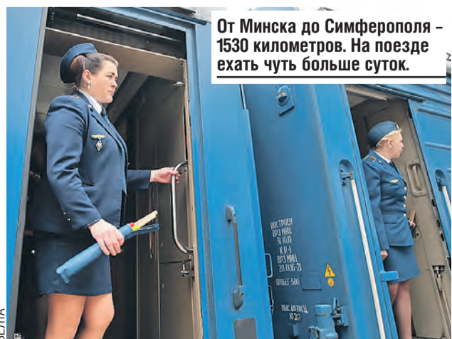
От Минска до Симферополя — 1530 километров. На поезде ехать чуть больше суток.

терес к поездкам в санатории Беларуси. Там они смогут принимать процедуры, в том числе из сакских целебных грязей. Об их поставке в республику договорились на выставке. Как и о возможном расширении закупок уникальной продукции крымских виноделов.