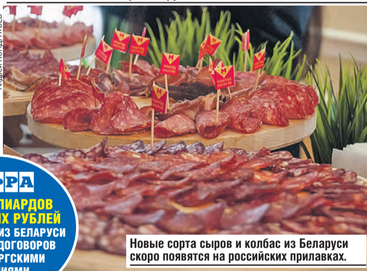
Новые сорта сыров и колбас из Беларуси скоро появятся на российских прилавках.

ЦИФРА НА 5 МИЛЛИАРДОВ РОССИЙСКИХ РУБЛЕЙ ПРЕДПРИЯТИЯ ИЗ БЕЛАРУСИ ПОДПИСАЛИ ДОГОВОРЫ С ПЕТЕРБУРГСКИМИ КОМПАНИЯМИ