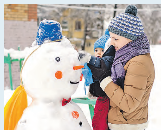
А дети лепили снеговиков и радовались.

Винуват средиземноморский циклон под нежным именем «Катарина». В минувшие выходные он принес в Центральную Россию аномальное количество осадков. — В Москве выпало 22 сантиметра снега. А в Подмосковье — все 25. Максимум был в 1965 году — 31 сантиметр, — рассказал ведущий сотруд-