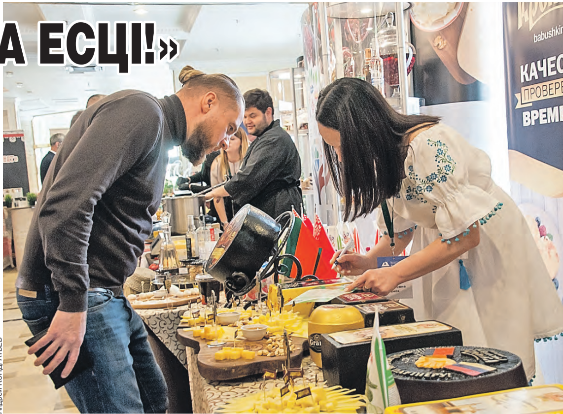
Эти экспонаты можно трогать руками, а есть – обязательно!

– В мире растут цены на продукты, разрушаются логистические цепочки, у племенных животных появляются новые болезни. В этих условиях гарантия непрерывных поставок – долгосрочное и взаимовыгодное партнерство, – считают организаторы форума.