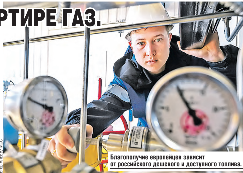
Благополучие европейцев зависит от российского дешевого и доступного топлива.

Бретон считает, что теоретически возможно. Во-первых, за счет импорта сжиженного природного газа – 50 миллиардов кубов. Еще десять за счет дополнительных трубопроводных поставок. 25 миллиардов должна компенсировать альтернативная энергетика, ну и еще десять – усиленная экономия. А как же брешь в 60 миллиардов кубометров?! Тут еврокомиссар начинает плавать. Дескать, можно ее заткнуть с помощью угля: прощай, зеленая энергетика. Но значительную часть его тоже покупают в России!