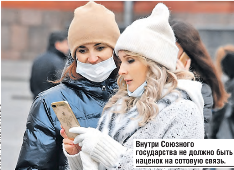
Внутри Союзного государства не должно быть наценок на сотовую связь.

Правда, МТС и «МегаФон» предоставляют бесплатно