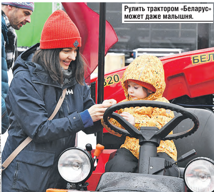
Рулить трактором «Беларус» может даже малышня.