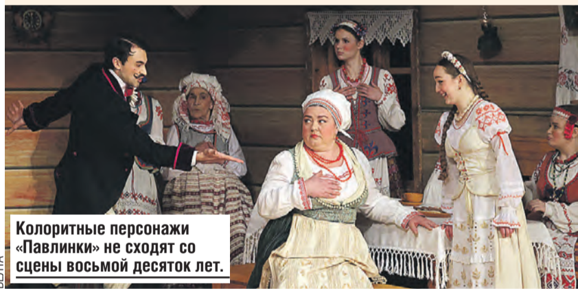
Колоритные персонажи «Павлинки» не сходят со сцены восьмой десяток лет.

Этот театр – в первую очередь про трепетное отношение к прошлому. Визитная карточка легендарной сцены – «Павлинка» по одноименной пьесе Янки Купалы. Искрометная комедия открывает каждый сезон уже почти 80 лет. В тяжелом 1944 году ее ставили в эвакуации в Томске. Сибирский зритель был в восторге, хоть пьеса и шла на белорусском языке.