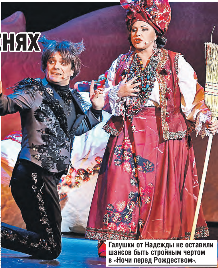
Галушки от Надежды не оставили шансов быть стройным чертом в «Ночи перед Рождеством».

– Огромное количество часов провели вместе на сцене,