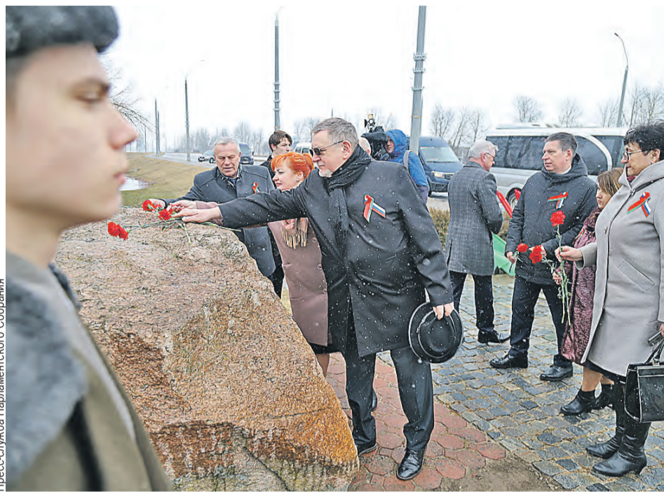
Депутаты возложили цветы к Симоновскому камню на Буйничском поле.