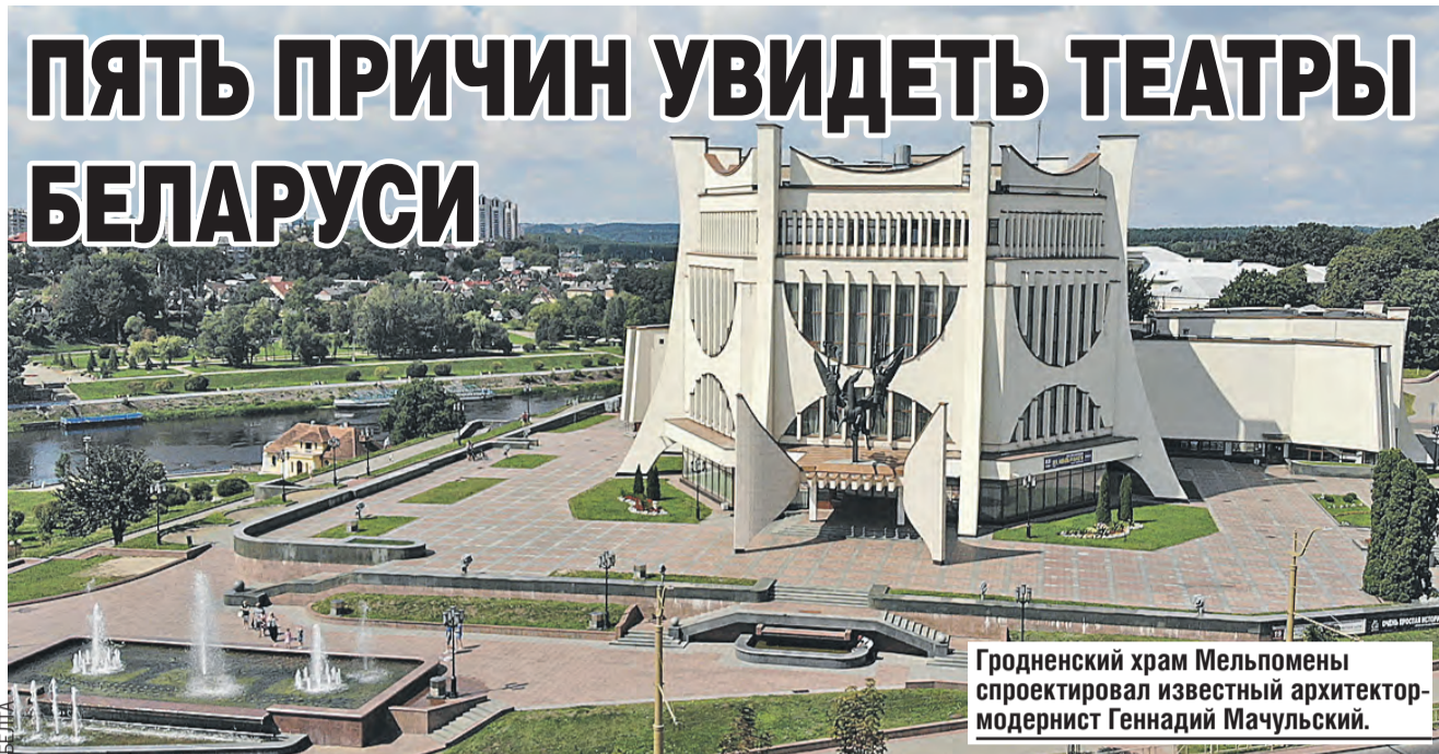
Гродненский храм Мельпомены спроектировал известный архитектор-модернист Геннадий Мачульский.