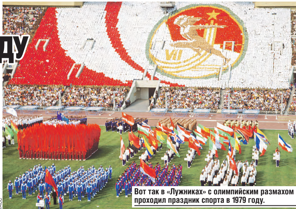
Вот так в «Лужниках» с олимпийским размахом проходил праздник спорта в 1979 году.

Спартакиада – это здорово. В России еще ни разу не проводили настолько масштабные по охвату соревнования. Причем для ее организации не надо ничего изобретать. Все уже придумали до нас. Достаточно вспомнить, как это делали в СССР. Тогда Всесоюзные спартакиады были традицией, их проводили раз в четыре года. Самая грандиозная состоялась в 1979 году. Стояла задача обкатать по максимуму стадионы, построенные к Олимпиаде-80. Развернулись во всю мощь.