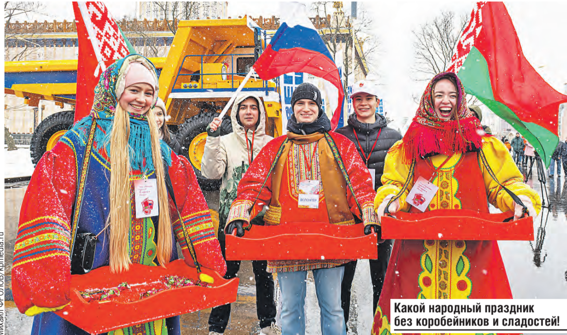
Какой народный праздник без коробейников и сладостей!