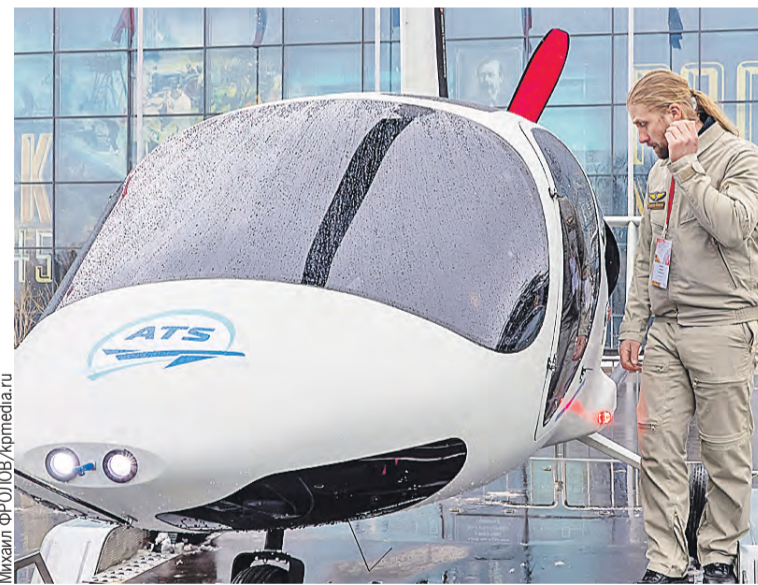
Гироплан – сверхлегкая и полезная для сельского хозяйства авиация.

– Появляются новые высокотехнологичные производственные предприятия. Продукция успешно конкурирует с самыми известными мировыми производителями, чьи бренды знают на всех континентах. Мы должны и дальше расширять компетенции белорусских и российских предприятий, приложить все усилия для создания не только национальных, но и союзных продуктов.