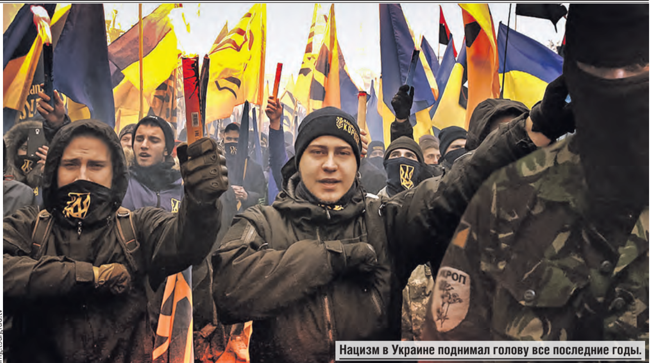
Нацизм в Украине поднимал голову все последние годы.

Выяснят следователи и то, кому принадлежит голос на аудиозаписи. Может, эту девушку и вправду изнасиловали? Но для чего тогда было создавать левый аккаунт, используя данные и фото реального человека? В Мозырский РОВД, кстати, никто с заявлением не обращался.