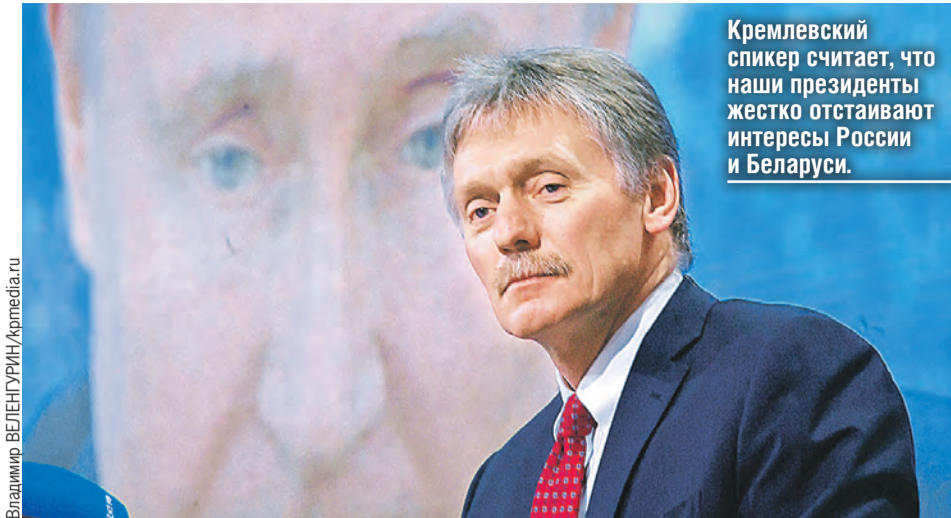
Кремлевский спикер считает, что наши президенты жестко отстаивают интересы России и Беларуси.

● Мы объединены взаимными обязательствами в рамках Союзного государства и, кроме того, в рамках ОДКБ.