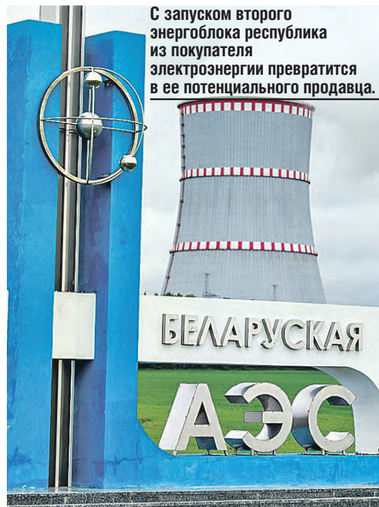
С запуском второго энергоблока республика из покупателя электроэнергии превратится в ее потенциального продавца.