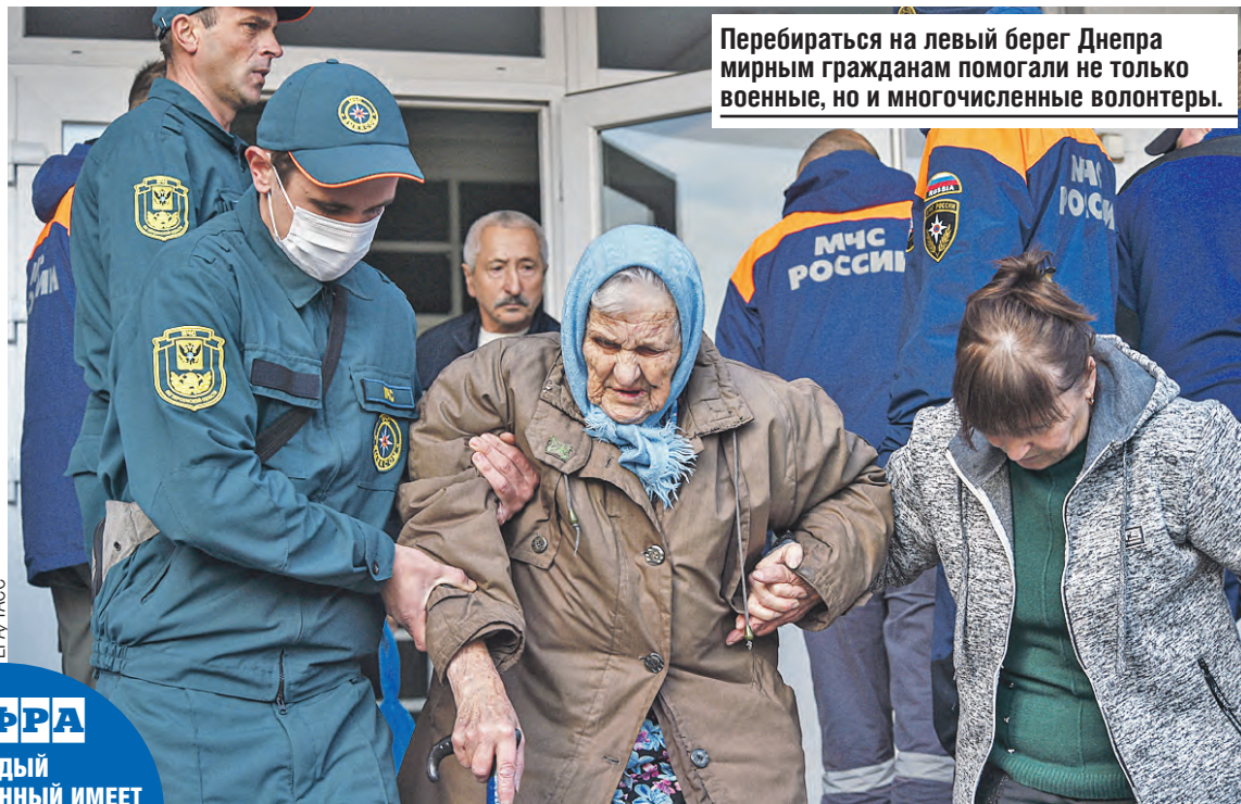
Перебраться на левый берег Днепра мирным гражданам помогли не только военные, но и многочисленные волонтеры.

– В прибрежной зоне образуется огромное пятно повы-