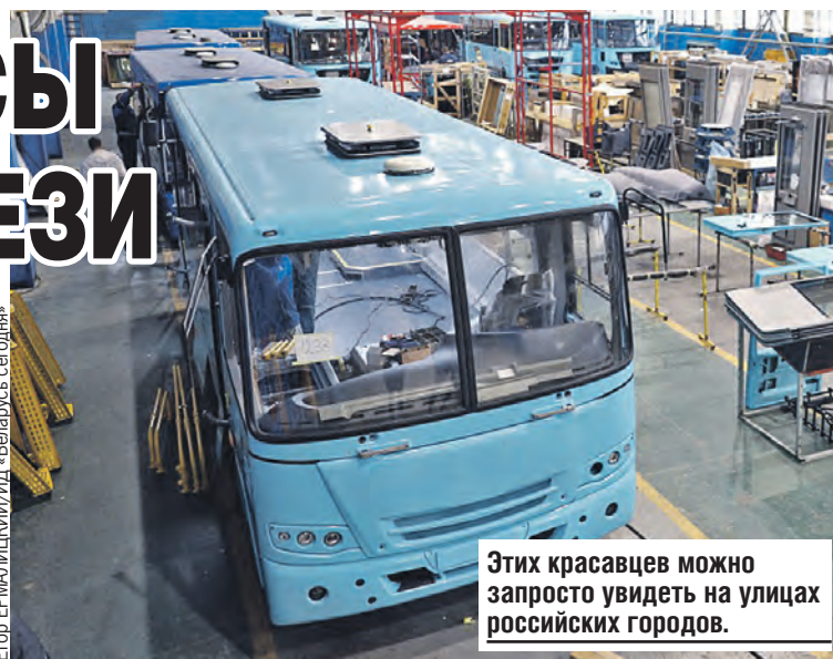
Этих красавцев можно запросто увидеть на улицах российских городов.

Электрооборудование замещать начали раньше, чем появился сам термин. Существующие на рынке устройства в большинстве случаев не подходят под нашу технику из-за специфических требований заказчика или эксплуатирующей организации. Изготовители прорабатывают техническое задание и выпускают его сами. Этот механизм отладили, поэтому отсутствие белорусского или российского аналога больших проблем не вызвало.