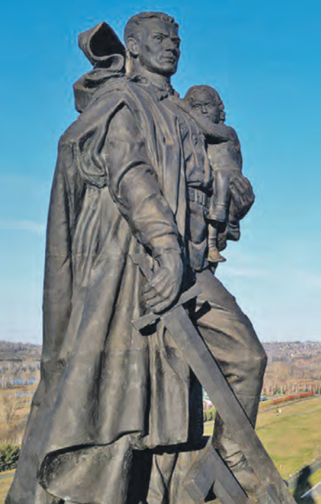
Сибирский двойник на пять метров выше берлинского оригинала.