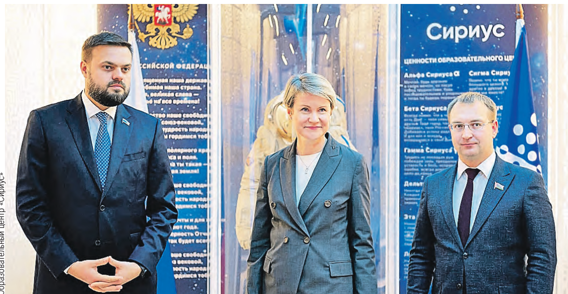
Образовательный центр «Сириус»

Не забыли и про спорт. Возможно, уже скоро на площадках центра пройдет этап Спартакиады Союзного государства для детей и юношества. А «Сириус» станет ярчайшей звездой на союзном небосклоне.