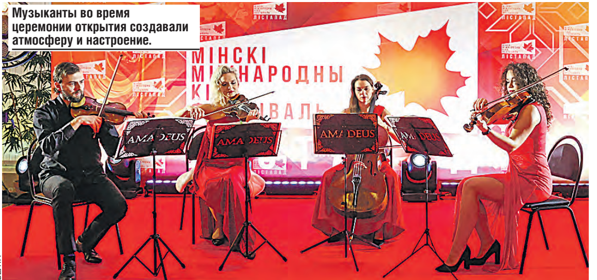
Музыканты во время церемонии открытия создавали атмосферу и настроение.

– Я очень люблю Беларусь. На этом кинофестивале была не меньше десяти раз. Здесь люди, которых знаю много лет. Особенно рада Гостюхину. У меня есть премия Александра Лукашенко за фильм «Гоголь. Ближайший». Красивый хрусталь стоит