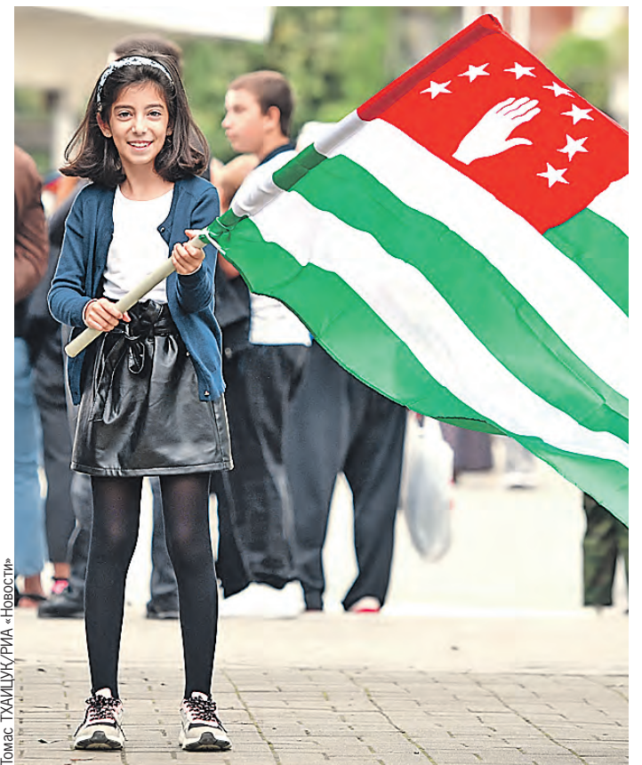
Томас ТУХИЛУК РИА «Новости»

– Мне очень приятно находиться здесь. Нам нужно интенсивно выстраивать связи в гуманитарной, экономической, политической сферах, и я уверен, что мы сможем отвечать на вызовы, перед которыми сейчас оказались. Наши народы на протяжении сотен лет были рядом друг с другом, нас объединяют общие ценности, культура, вера.