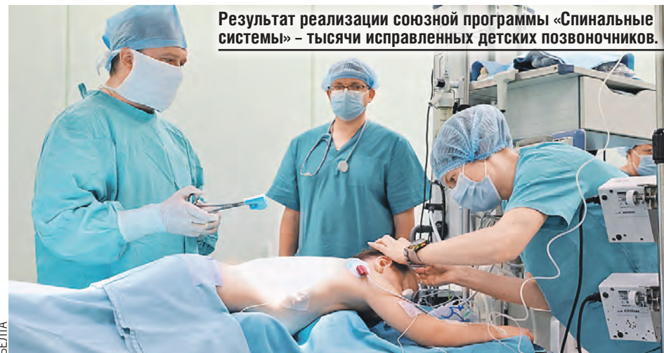
Результат реализации союзной программы «Спинальные системы» – тысячи исправленных детских позвоночников.

Таких примеров можно привести еще немало. Взять тот же БЕЛАЗ. Если посмотреть, какие агрегаты и элементы устанавливают на эти замечательные машины, вы увидите, что чуть ли не 60 процентов комплектующих, в том числе электродвигатели, металл российского производства. Важно, что сотрудничество между нашими странами взаимовыгодно. И кто бы что ни говорил, у нас никто никому не делает подарков, никто никого не держит за хлебников.