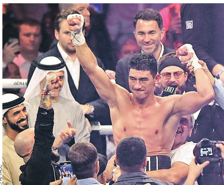
Непобедимый россиянин уже 21 бой на профессиональном ринге не знает поражений.

удары периодически доходили до цели. В концовке раунда в голову Рамиреса прилетело сразу несколько крепких оплеух. И это было только начало.