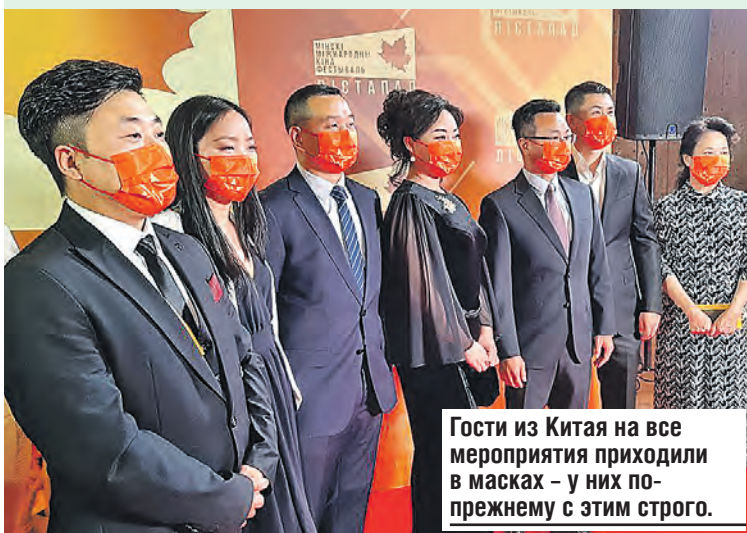
Гости из Китая на все мероприятия приходили в масках – у них по-прежнему с этим строго.