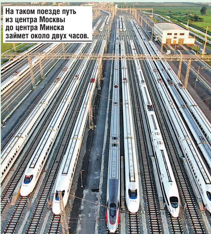
На таком поезде путь из центра Москвы до центра Минска займет около двух часов.

Но этот человек просто не знал, что США уже строят высокоскоростную дорогу Даллас — Хьюстон. И есть решение, чтобы где-то к 2050 году 80 процентов