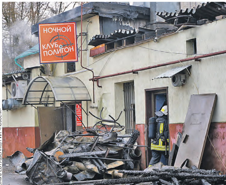
Из-за глупой выходки погибли 13 человек.

Неудачливый кутила оказался военным служащим из войсковой части Костромского территориального гарнизона. Участвовал в спецоперации в Украине, был ранен, приехал полечиться, но, видимо, свое здоровье все же решил подпортить и отправился в питейное заведение.