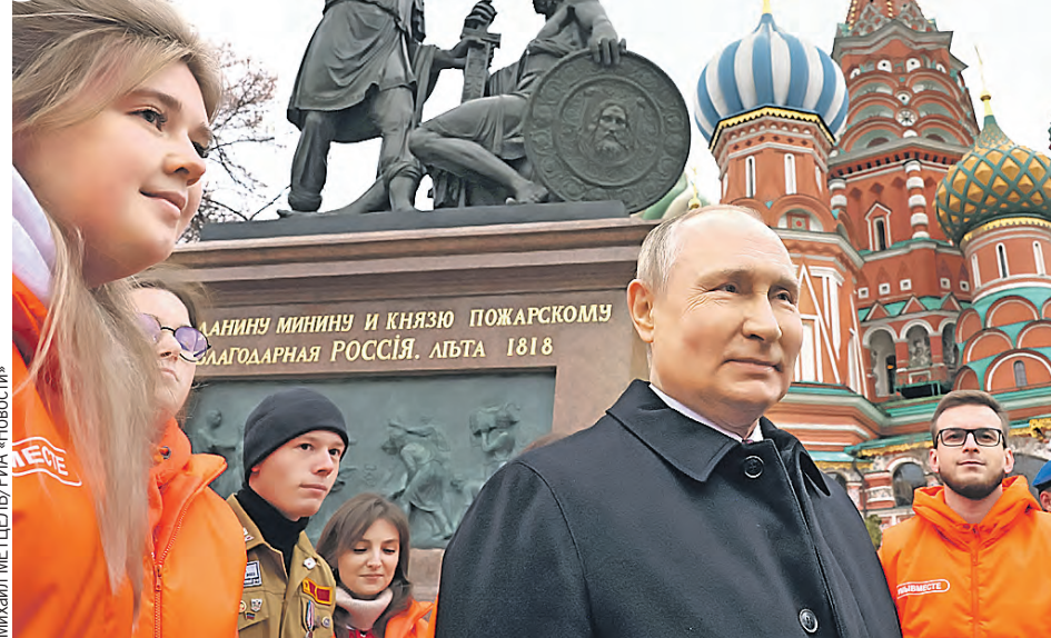
Владимир Путин сказал ребятам, что рассчитывает на таких, как они. И передал видеопривет маме одной из волонтерок.

– Мы сейчас как раз принимаем решения, которые позволят получать эти документы в упрощенном порядке. Зная, что очень много людей из Харьковской области, да и из Харькова разными путями, даже обходными,