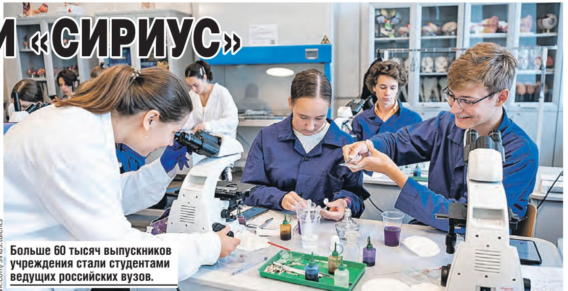
Больше 60 тысяч выпускников учреждения стали студентами ведущих российских вузов.

Сейчас в Беларуси, например, очень серьезно занялись молодежной наукой в области биохимических технологий. В том числе на базе технопарка, где набирают профильные отделения. Депутаты пригласили специалистов из «Сириуса», чтобы они приехали, посмо-