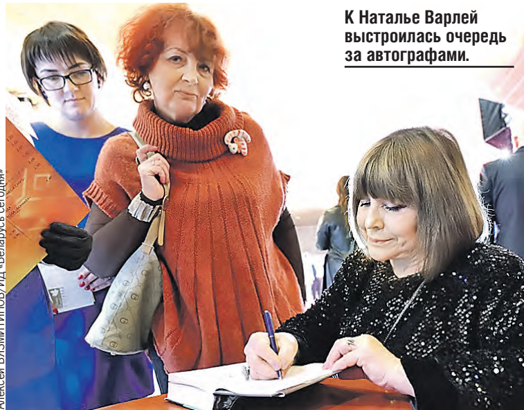
К Наталье Варлей выстроилась очередь за автографами.

В Крыму актрисе вправили ногу почти без анестезии. Боль была чудовищная! А уже в Москве по совету телеведущей Елены Малышевой она нашла прекрасного хирурга,