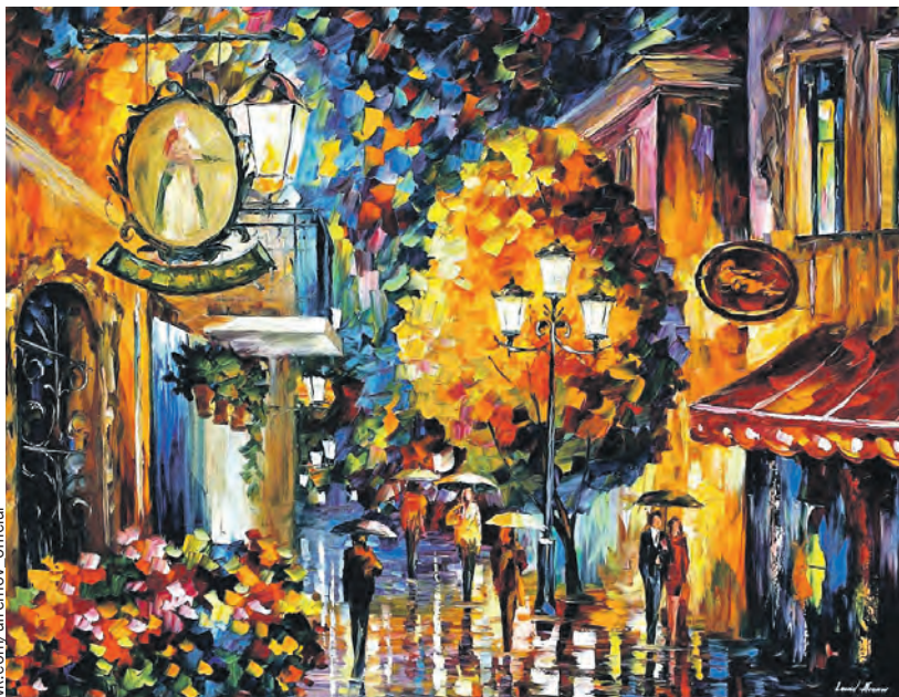
На многих картинах можно увидеть размытое отражение на мокром асфальте – это один из любимых художественных приемов мастера.