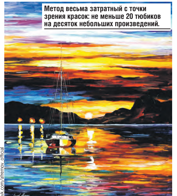
Метод весьма затратный с точки зрения красок: не меньше 20 тюбиков на десяток небольших произведений.