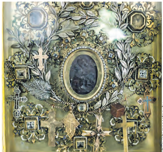
Списки Жировичской иконы можно увидеть в храмах по всему миру – от Польши и Литвы до Лондона и Нью-Йорка.

Жировичская икона размером всего 5,7×4,4 сантиметра. Она самая маленькая в мире среди почитаемых Богородичных. Крошечный размер не раз ее спасал. Например, в 1920-е образ прятали в банке с вареньем.