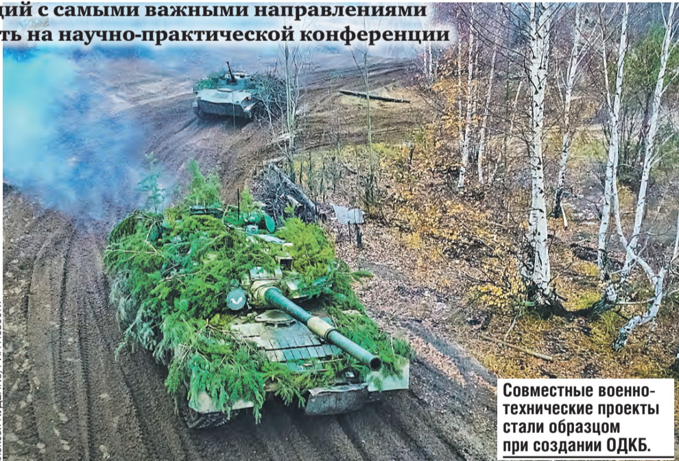
Совместные военно-технические проекты стали образцом при создании ОДКБ.

На этой секции информационным технологиям уделят особое внимание. Так, система суперкомпьютеров, разработанная по программе Союзного государства, является классической технологией двойного назначения: такие ЭВМ могут использоваться как в разведке недр, так и в отражении кибератак, моделировании эффективности оружия и многом другом.