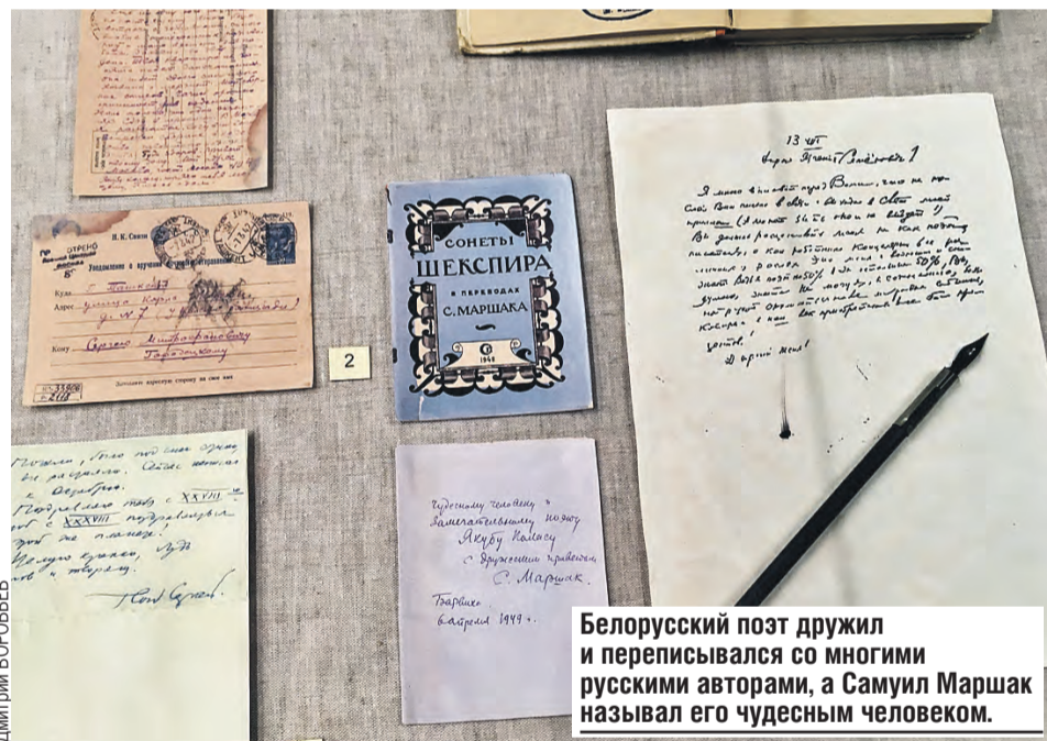
Белорусский поэт дружил и переписывался со многими русскими авторами, а Самуил Маршак называл его чудесным человеком.

Выразительные стихи поэта звучат сильно, пронзительно. Зал будто затаил дыхание. Но вот прозвучали финальные строки – и аудитория взорвалась аплодисментами. А некоторые зрители, не стесняясь эмоций, смахивали набежавшие слезы.