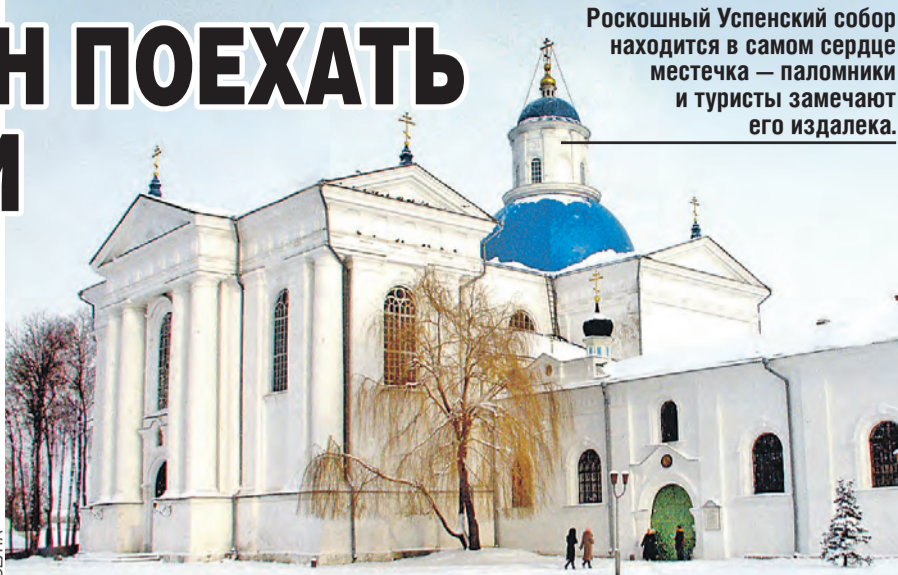
Роскошный Успенский собор находится в самом сердце местечка – паломники и туристы замечают его издали.

Это самое старое здание в монастырском комплексе. А единственное прямое доказательство тех давних событий и ныне там. На службы в теплое время года в церковь набивается много народу, чтобы хоть одним глазком увидеть тот самый валун под престолом в алтаре.