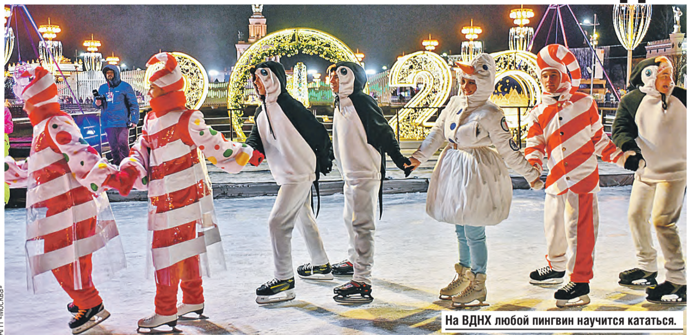
На ВДНХ любой пингвин научится кататься.

ально для российской публики придумали инсталляцию на тему сказок Пушкина. Шоу-программа будет здесь каждый день. ➔ ГДЕ: Сокольнический вал, д. 1, стр. 1 ➔ КОГДА: ежедневно с 10.00 до 24.00 ➔ БИЛЕТЫ: полный – от 300 рос. рублей, детский – 200 рос. рублей в будние дни ➔ ПРОКАТ: включен в стоимость билета