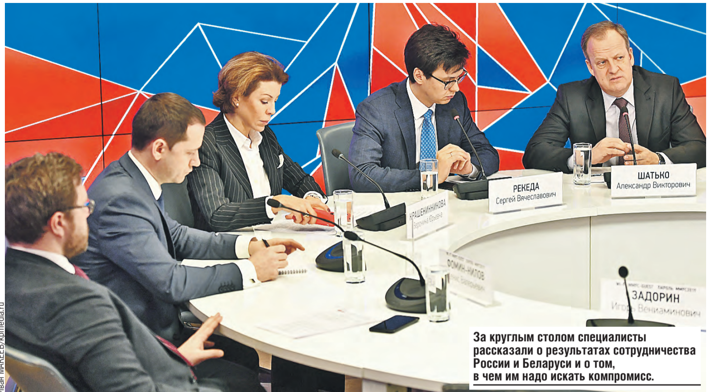
За круглым столом специалисты рассказали о результатах сотрудничества России и Беларуси и о том, в чем им надо искать компромисс.

– Нужно передать молодому поколению стремление сохранить то единство между странами, которое формировалось веками. В рамках Союзного государства много внимания уделяется молодежи. Есть Молодежная палата, регулярно проходит