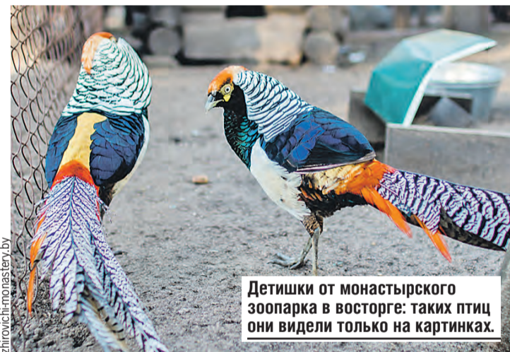
Детишки от монастырского зоопарка в восторге: таких птиц они видели только на картинках.