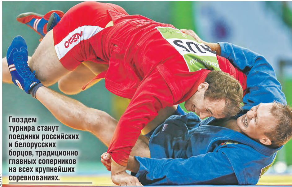
Гвоздем турнира станут поединки российских и белорусских борцов, традиционно главных соперников на всех крупнейших соревнованиях.