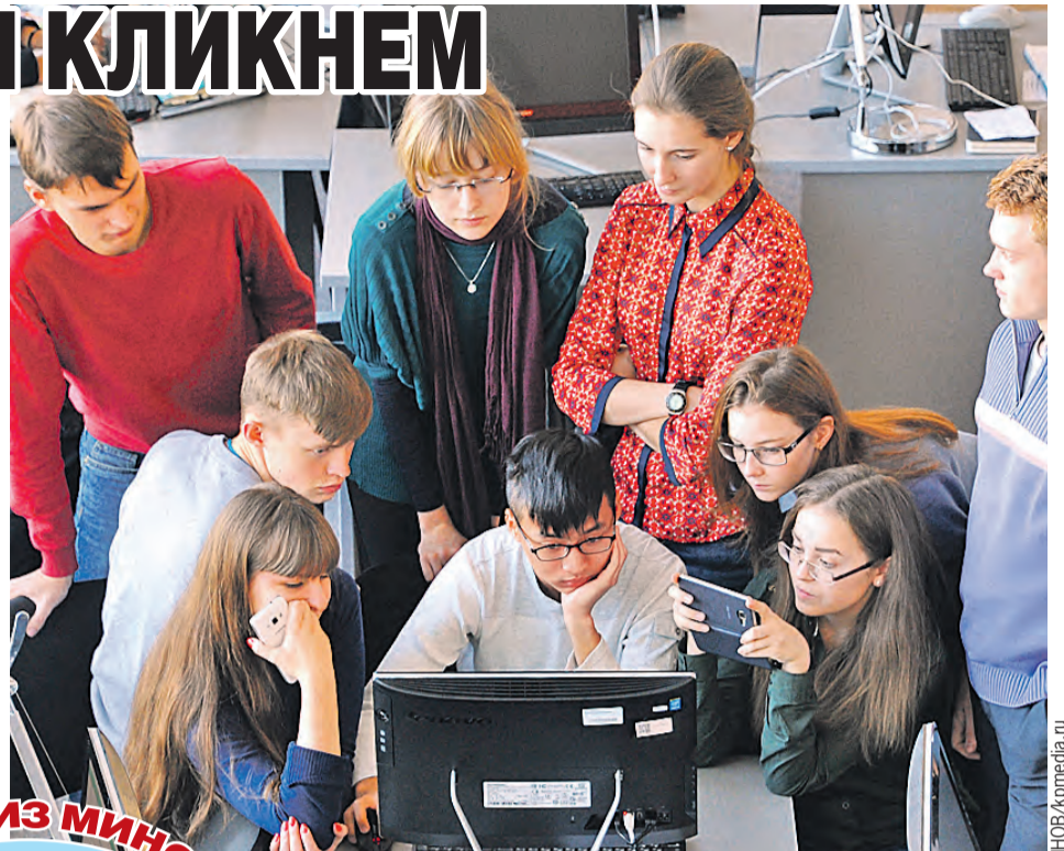
Теперь в Беларуси компьютеров и гаджетов хватит на каждого ученика, было бы желание набираться ума-разума.

Речь об электронной площадке, где в пару кликов можно получить необходимую информацию. Например, создан регистр учащихся. Нажал пару кнопок, и уже знаешь о любом Петрове или Васечкине, где он учится, как успевает, о его наградах на конкурсах и олимпиадах. Такая база данных поможет снять дополнительную нагрузку с учителей. В перспективе – полный переход