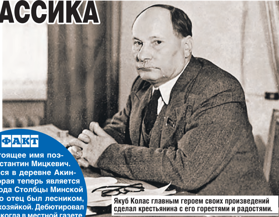
Якуб Колас главным героем своих произведений сделал крестьянина с его горестями и радостями.

В концертном зале зрители расаживаются по местам. Вот-вот на сцене развернутся фрагменты спектакля «Площадь Якуба Коласа» в исполнении Белорусского камерного хора.