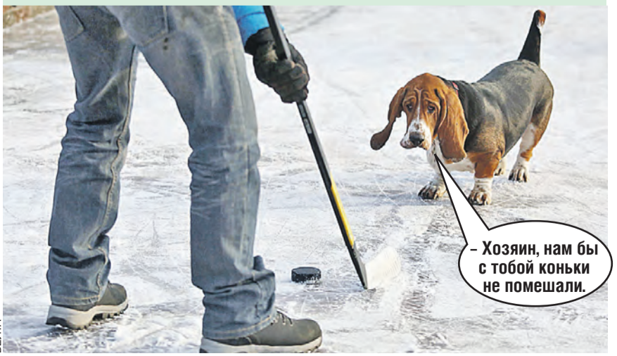
– Хозяин, нам бы с тобой коньки не помешали.