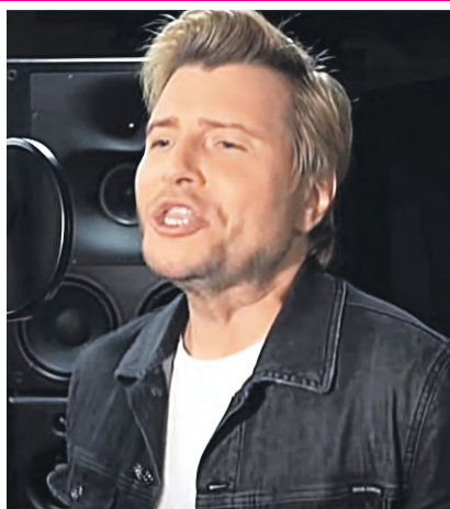
В клипе на песню «Любимую не отдают» с удовольствием снялись Филипп Киркоров, Диана Гуцкая, Николай Басков и другие звезды.