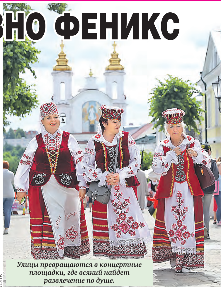
Улицы превращаются в концертные площадки, где всякий найдет развлечение по душе.

Работы компактные – 80 на 120 сантиметров – идеально вписываются в любой интерьер. Насыщенные цвета поднимают настроение и настраивают на гармоничный лад. Да и разместив такую красоту на стене, можно, не вставая с дивана, перенестись на уютные улочки древнего города.