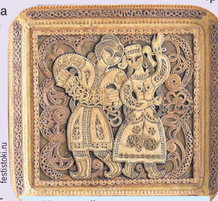
Из такой тарелочки есть рука не поднимется.

С давних пор береста была популярна. Где ее только не использовали. Эластичный и податливый материал, способный выдерживать большие нагрузки, был идеален в быту. Из него изготавливали кухонную посуду, шкатулки, емкости для хранения, лапти, сумки, короба и корзинки. И бумагу она тоже заменяла. Русские мастера любили дерево за его покладистость и долговечность. Оригинальный стиль в художественной обработке получил название «прокопьевская береста». Для этой