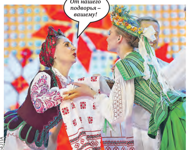
От нашего подворья – вашему!