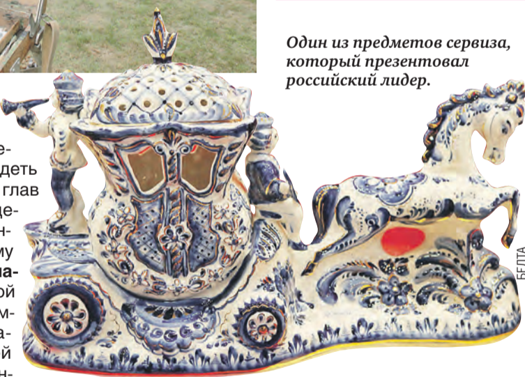
Один из предметов сервиза, который презентовал российский лидер.