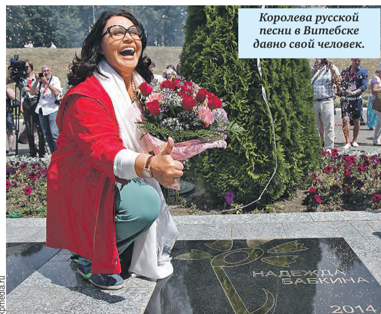
Королева русской песни в Витебске давно свой человек.