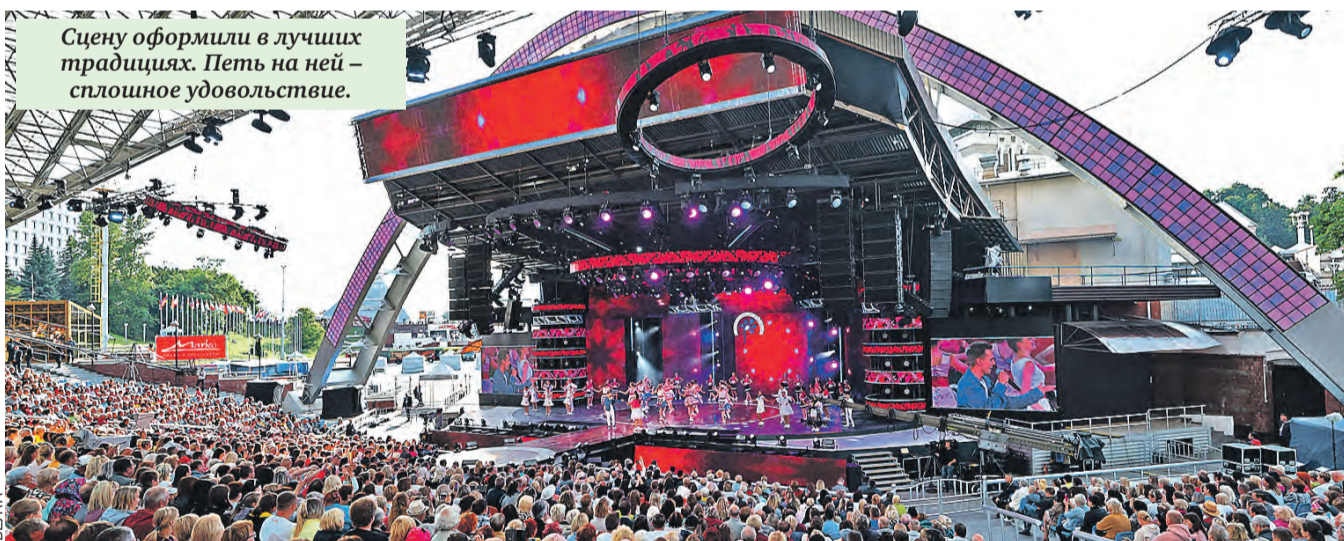
Сцену оформили в лучших традициях. Петть на ней – сплошное удовольствие.

В центре города, как и в прежние годы, раскинется «город мастеров».