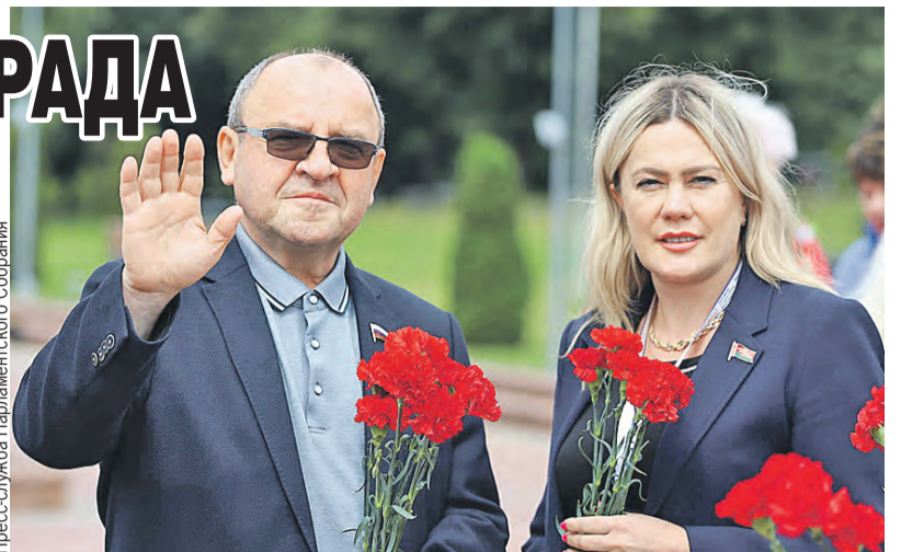
Парламентарии находят время и на концерты любимых звезд сходить, и почтить память героев.

✿ Депутаты приедут на торжественное закрытие фестиваля «Славянский базар в Витебске» и наградят специальными призами Парламентского Собрания лауреатов основного конкурса исполнителей эстрадной песни.