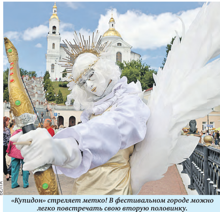
«Купидон» стреляет метко! В фестивальном городе можно легко повстречать свою вторую половинку.

– Мы, витебчане, очень гордимся своей уникальной природой, традициями, именами просветителей, художников, поэтов. Определяющее значение Витебская область вносит в развитие экономики страны. Здесь работают такие гиганты, как Оршанский льнокомбинат, Лукомльская ГРЭС, обувные предприятия «Белвест» и «Марко», ставшие брендом Беларуси и Витебской области. Успешно действуют Витебская бройлерная птицефабрика, агрокомбинат «Юбилейный», частное предприятие «Витконпродукт», сельхозпредприятие «Маяк Браславский» и многие другие.