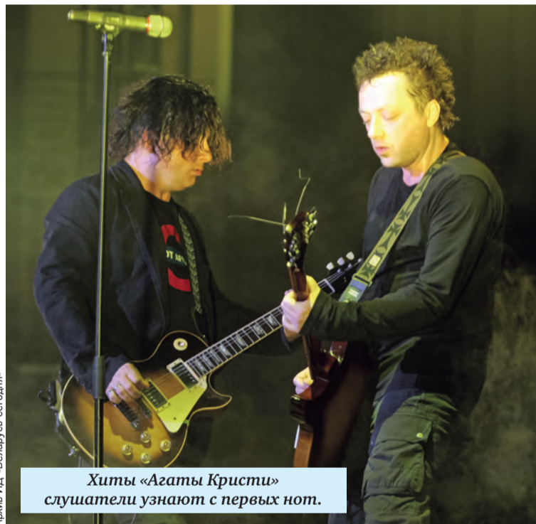
Хиты «Агаты Кристи» слушатели узнают с первых нот.

Мы очень много гастролировали не только по республике, но и по России с хорошей прокатной компанией из Мозыря, которая поставляла нам аппаратуру. А еще на заре «Агаты Кристи», в 88-м или 89-м, у нас была целая серия концертов в Бресте. Когда стартуешь, делаешь первые шаги, впечатления очень сильные. Та поездка мне навсегда запомнилась.