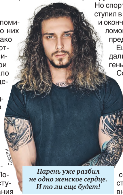
Парень уже разбил не одно женское сердце. И то ли еще будет!

Молодой человек – тот еще сердцеед. Его личная жизнь постоянно оказывается в центре внимания.