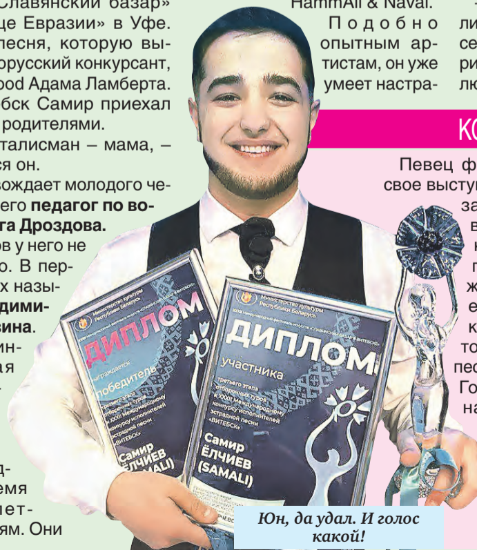
Юн, да удал. И голос какой!

Певец фактически отрепетировал свое выступление на «Славянском базаре» в «Сердце Евразии» в Уфе. Одна из композиций, которую молодой человек представил, – «Чырвоная ружа» «Песняров». Он исполнил ее тонко и душевно. Почти как Владимир Мулявин. Для того чтобы так проникнуться песней, надо знать ее историю. Говорят, «папа» «Песняров» нашел ее текст в старом средневековом сборнике, который ему подарили во время гастролей в Нью-Йорке представители белорусской диаспоры.