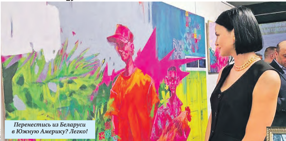
Перенестись из Беларуси в Южную Америку? Легко!

А московский Государственный музей Толстого привез экспозицию «Усадебная культура в творчестве Толстого и Репина». Великий русский писатель и знаменитый художник дружили, сохранилась их