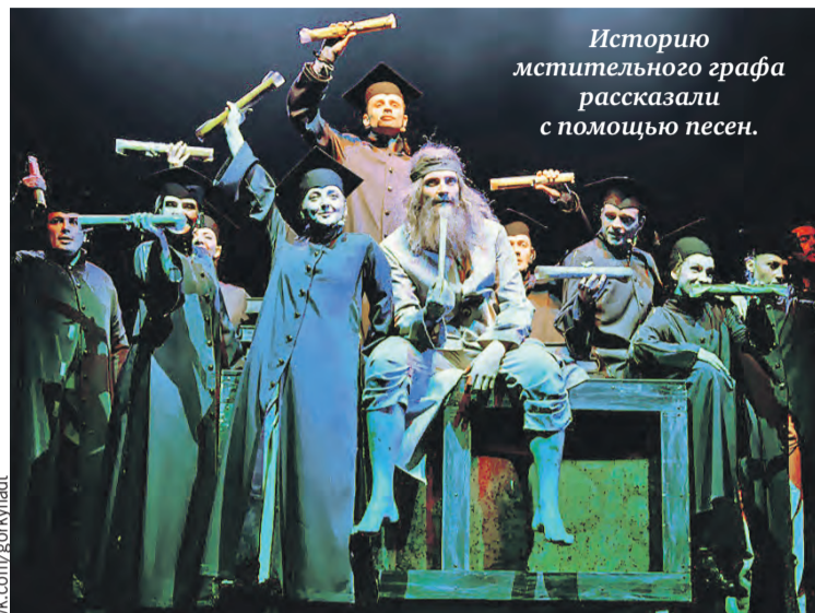
Историю мстительного графа рассказали с помощью песен.