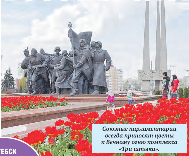
Союзные парламентарии всегда приносят цветы к Вечному огню комплекса «Три штыка».

ВИТЕБСК В СЛЕДУЮЩЕМ ГОДУ ПРАЗДНУЕТ 1050-ЛЕТНИЙ ЮБИЛЕЙ