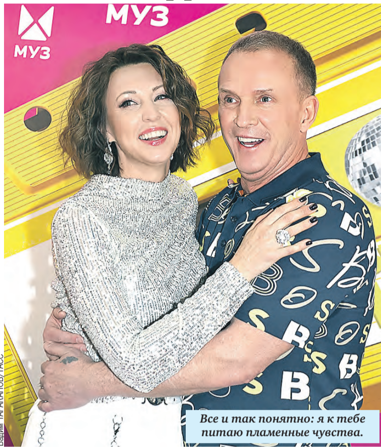
Все и так понятно: я к тебе питаю пламенные чувства.