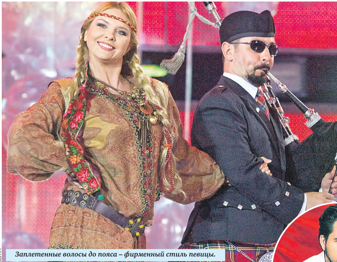
Заплетенные волосы до пояса – фирменный стиль певицы.

96-го по 2000-й. Лещенко и в девяностые был мэтром. Он – невиданная интеллигентия, доброта. Учитель. Если что-то говорит – только по делу. Четко все видит. Мудрый профессионал. Благодарна судьбе за знакомство. Лев Валерьянович говорил: «Знаю, у тебя сильный народный голос, и надо искать что-то в этом направлении. Может быть, не нужно полностью уходить в фолк, а взять этно-фолк?» Подсказал, что нужно сделать, чтобы не стоять в очереди из эстрадных певиц, а выбрать свое направление и стиль. Не разговаривал ни с какими продюсерами. Подсказал дорожку, а дальше уже сама ее протаптывала. И теперь, прежде чем что-то сделать, тысячу раз подумаю, как на это отреагировал бы Лещенко.