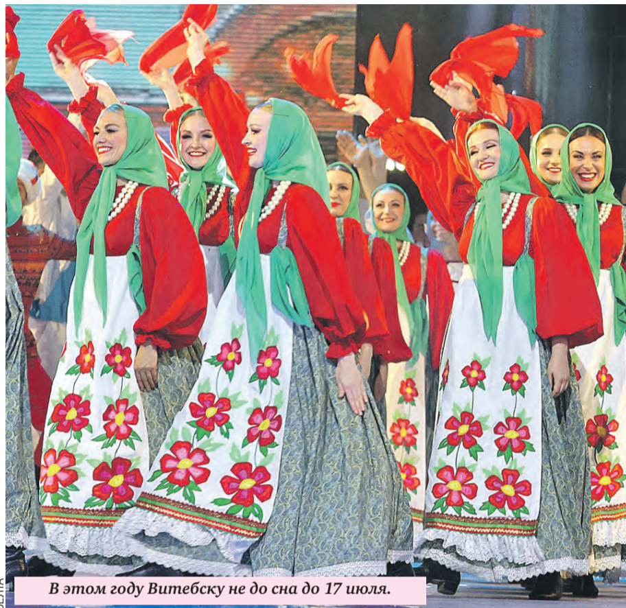
В этом году Витебску не до сна до 17 июля.