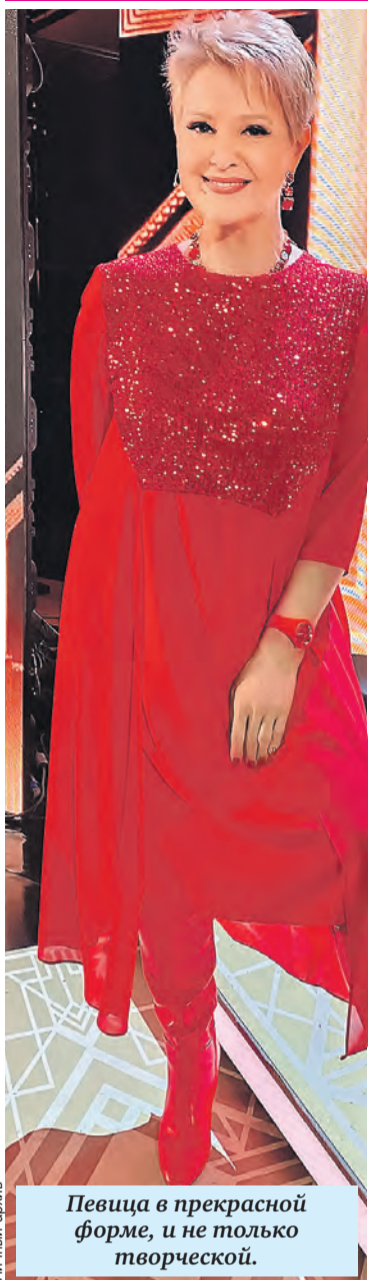
Певица в прекрасной форме, и не только творческой.