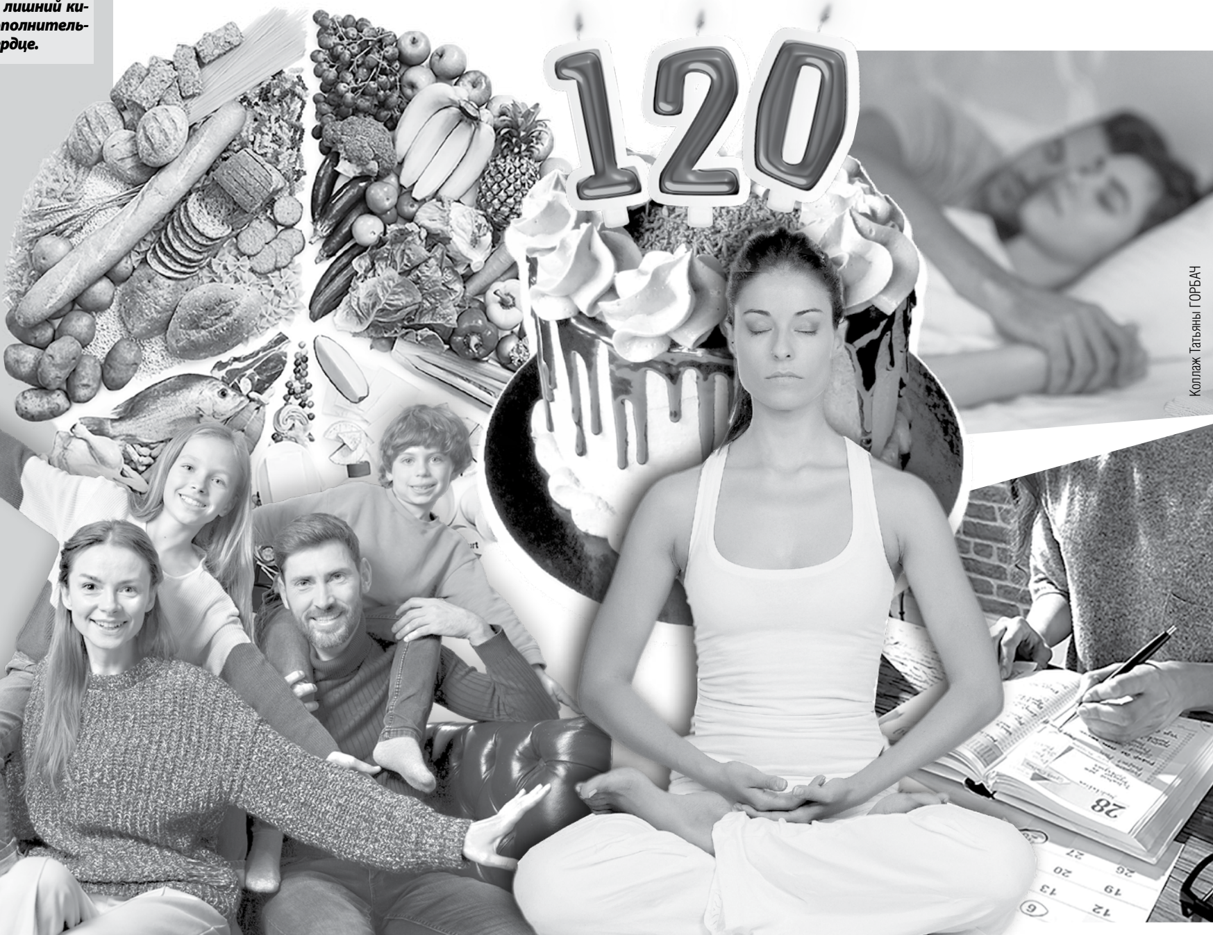
Коллаж Татьяна ГОРБАЧ

Алла МАРТИНКЕВИЧ, фото из открытых интернет-источников несут иллюстративный характер