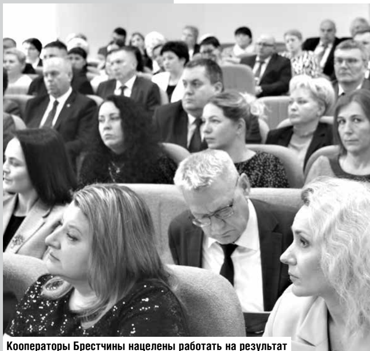
Кооператоры Брестчины нацелены работать на результат

– Организациям Брестского облпотребсоюза необходимо активно искать точки роста на будущее. Определиться, какие меры предпринять в нынешнем году, чтобы получить доход в следующем. Причем внимание должно быть сосредоточено на обеспечении эффективной работы каждой отрасли. Для этого необходимо задействовать все имеющиеся резервы.