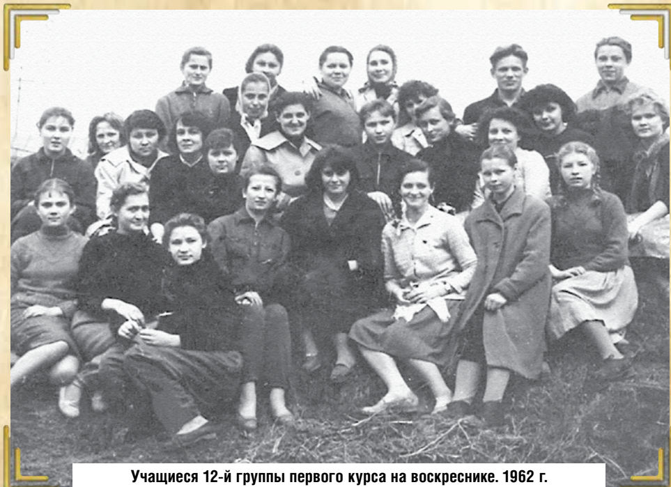
Учащиеся 12-й группы первого курса на воскреснике. 1962 г.