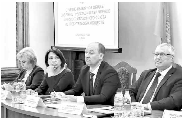
Собрание постановило: считать приоритетной задачей на 2024 год обеспечение повышения эффективности деятельности организаций при безусловном выполнении поручений Президента Республики Беларусь Александра Лукашенко, данных 16 февраля 2024 года

Организациями Минского облпотребсоюза в рамках реализации планов по укреплению материально-технической базы торговой отрасли открыто 17 магазинов шаговой доступности, проведена реконструкция (модернизация) 20 торговых объек-