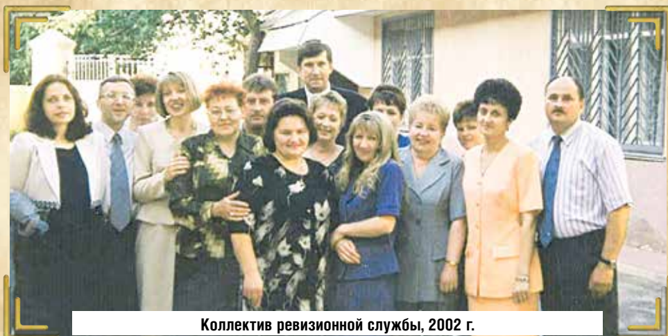
Коллектив ревизионной службы, 2002 г.