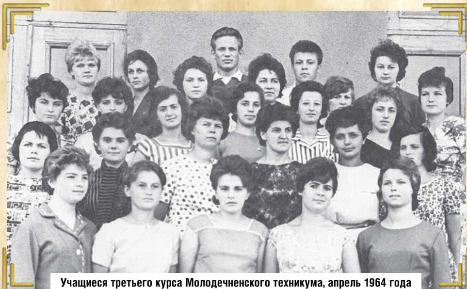
Учащиеся третьего курса Молодечненского техникума, апрель 1964 года