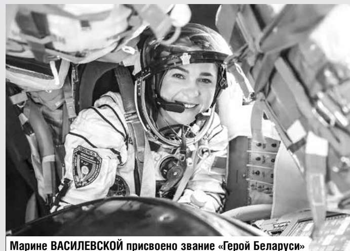
Марине ВАСИЛЕВСКОЙ присвоено звание «Герой Беларуси»

АЛЕКСАНДР ЛУКАШЕНКО СЛЕДИЛ В ПРЯМОМ ЭФИРЕ ЗА ВОЗВРАЩЕНИЕМ С МЕЖДУНАРОДНОЙ КОСМИЧЕСКОЙ СТАНЦИИ БЕЛОРУССКОГО КОСМОНАВТА МАРИНЫ ВАСИЛЕВСКОЙ И ОСТАЛЬНЫХ ЧЛЕНОВ ЭКИПАЖА КОРАБЛЯ «СОЮЗ МС-24»