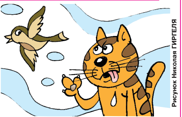
Рисунок Николая ГИРТЕЛЯ

Если бы кошке крылья, воробьям бы не жить (лезгинская). Бодливой корове Бог рогов не дает. *** Спешащий таракан в суп попадает (удмуртская). Поспешишь — людей насмешишь. *** Нечего ругать кошку, когда сыр съеден (французская). После драки кулаками не машут.