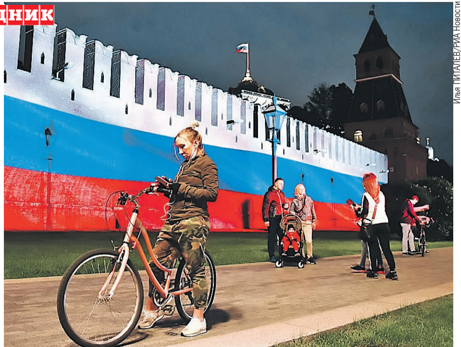
Рисунок на плотине получился «головокружительным»: его создавали на высоте 242 метров. Кремлевская стена, хоть и пониже будет, тоже «приделась» по случаю важной даты.