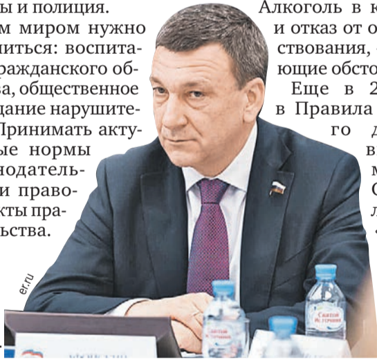
Депутат считает, что стоит ужесточить ответственность за выпивку и гонки.