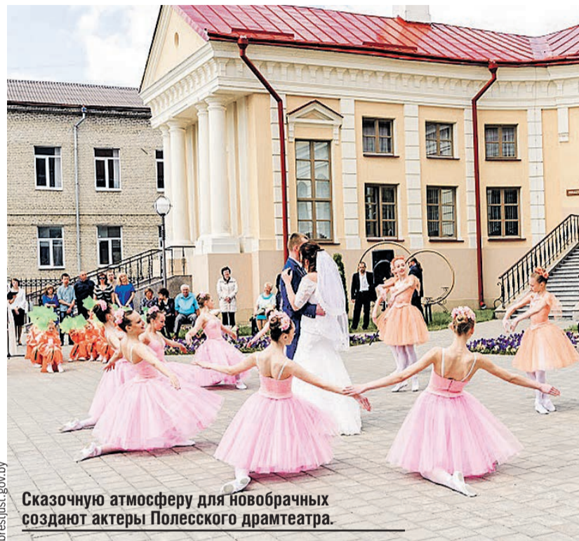
Сказочную атмосферу для новобрачных создают актеры Полесского драмтеатра.

В XX веке великолепную усадьбу превратили сначала в типографию, потом в кинотеатр и, наконец, в Дом пионеров. Звание дворца вернулось к историческому месту лишь в наши дни. Теперь тут и дамы в пышных платьях, и вальс на паркете, и шампанское рекой – все, как задумывалось изначально.