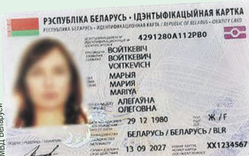
Многие страны мира уже используют подобные пластиковые ID-карточки.

Стоимость ID-карты составит 27 рублей. Биометрический паспорт обойдется в 81 рубль. Привычные бумажные документы никуда не уйдут. Они будут использоваться параллельно с электронными.