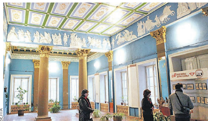
В XX веке во дворце Булгаков был детский дом, зоотехнический техникум и даже госпиталь.

Дворец дошел до нас в прекрасном состоянии. Потолки,