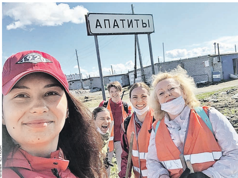
Средняя зарплата в Апатитах – 32 тысячи российских рублей, а на уборке города можно получить даже больше.

сийских рублей. На метлы сменили диктофоны и блокноты и журналисты апатитской газеты «Дважды два».