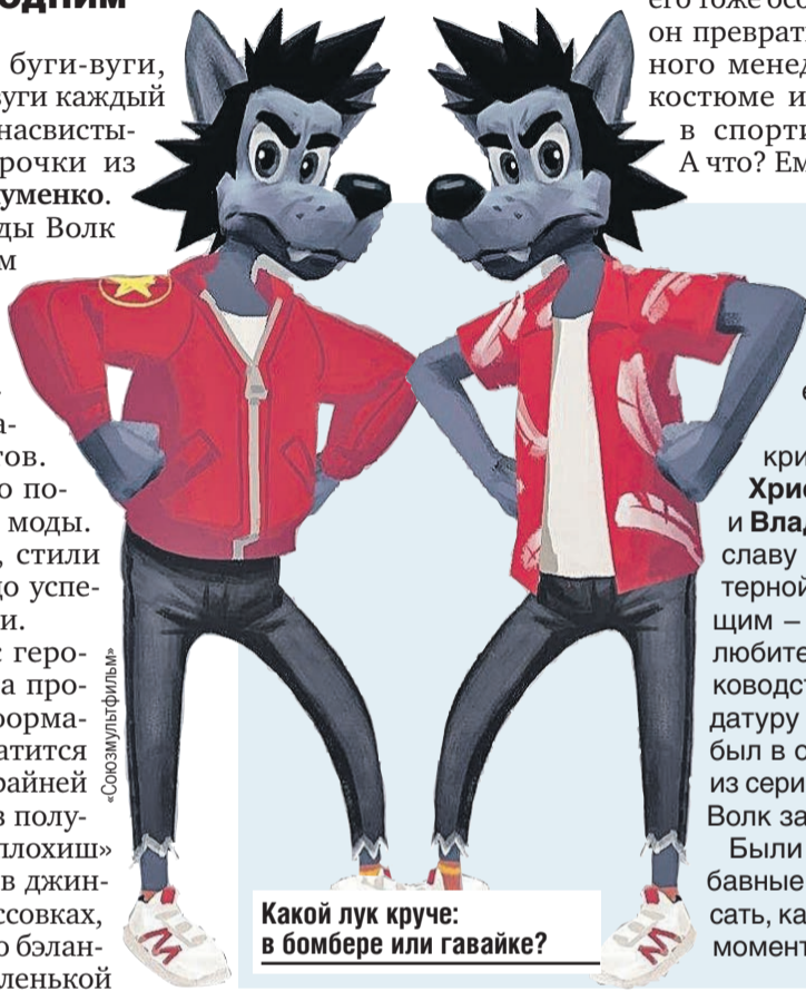
Какой лук круче: в бомбере или гавайке?

Зато изменится графический стиль. Пока аниматоры в поисках, но, кажется, уже нащупали идею – хотят попробовать квази-3D-технику.