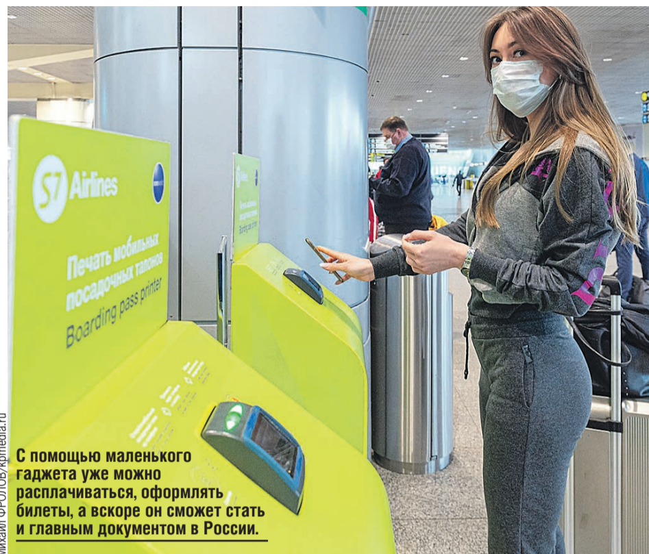
С помощью маленького гаджета уже можно расплачиваться, оформлять билеты, а вскоре он сможет стать и главным документом в России.