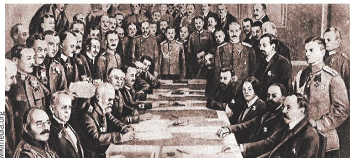
Мирному договору, заключенному в Белом дворце Брестской крепости в марте 1918-го (на фото), предшествовали долгие переговоры в Скоках.