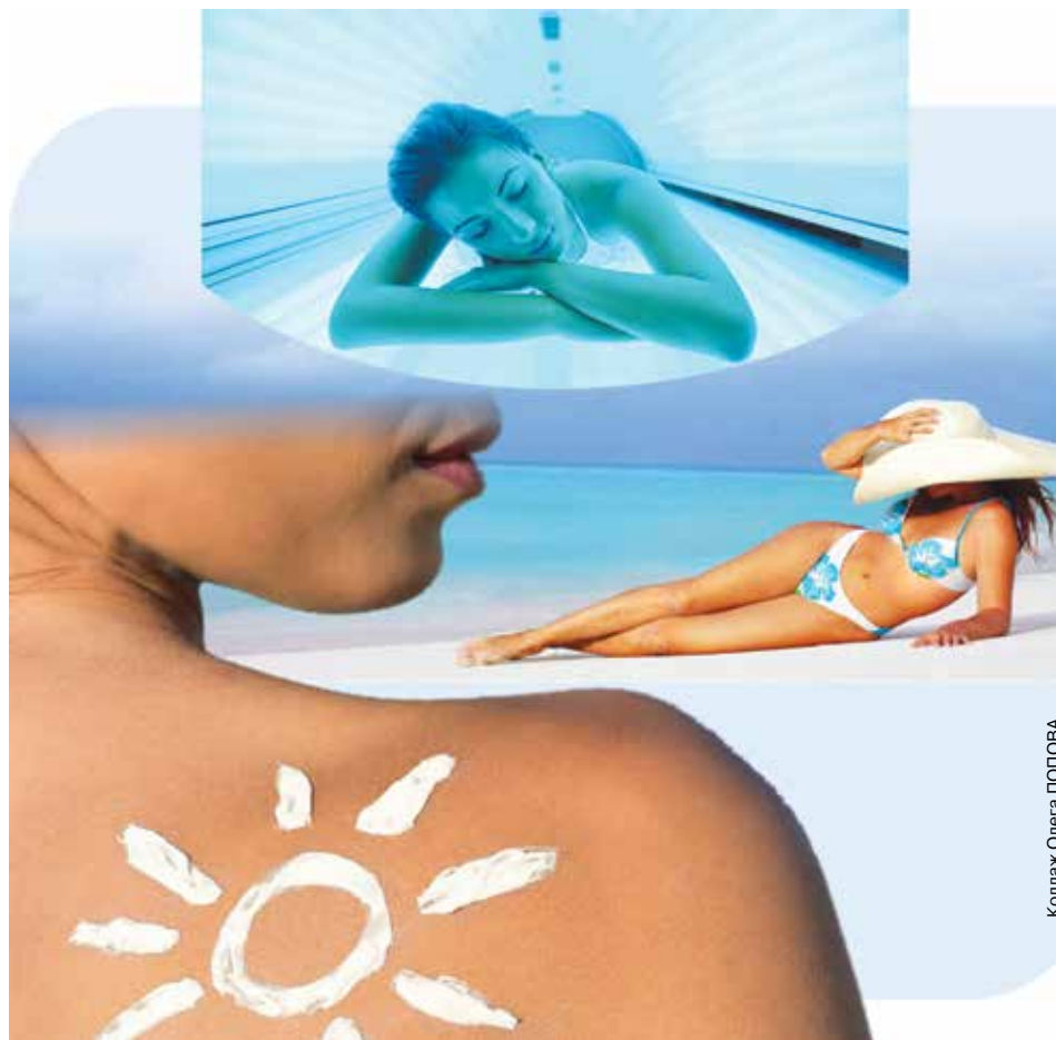
Коллаж Олега ПОПОВА

Красота бронзового тела в наших широтах всегда привлекательна. Это только в Китае и ряде других стран девушки прячутся под зонтиками, чтобы сохранить белый цвет кожи. В Беларуси же в основном девушки и дамы среднего лет заботятся о красивом, ровном загаре либо имитируют его: приобретают абонементы в солярий, измазываются специальными косметическими средствами – проявителями загара, носят колготки или чулки бронзового цвета... А все для того, чтобы быть летом «шоколадкой», а не лебедем.