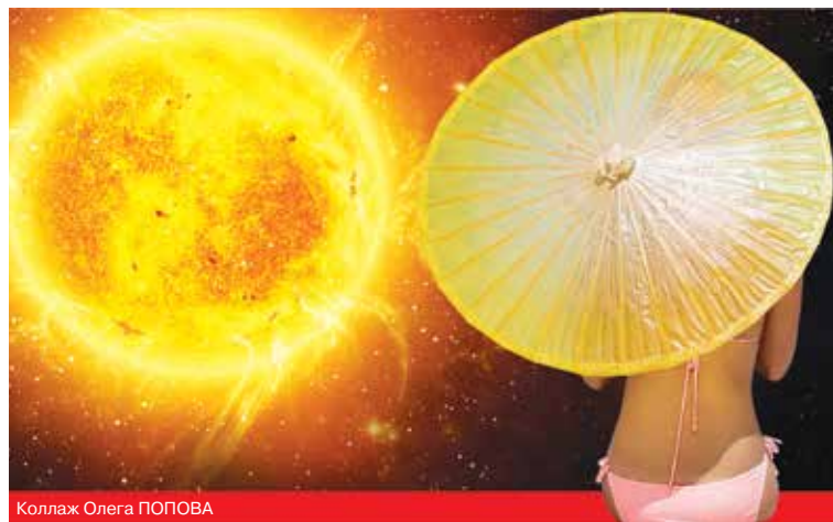
Коллаж Олега ПОПОВА

При дерматозе, себорее кожи и волос эти неприятные кожные заболевания у любителейница позгорать могут усугубиться, а если еще и нанести на себя косметические и фармакологические средства, то может