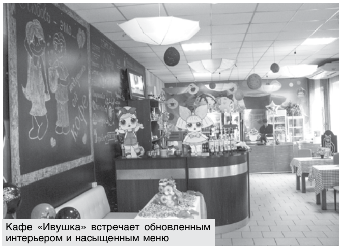
Кафе «Ивушка» встречает обновленным интерьером и насыщенным меню

– И сальтисон, и колбаса разлетаются на ура, – ком-