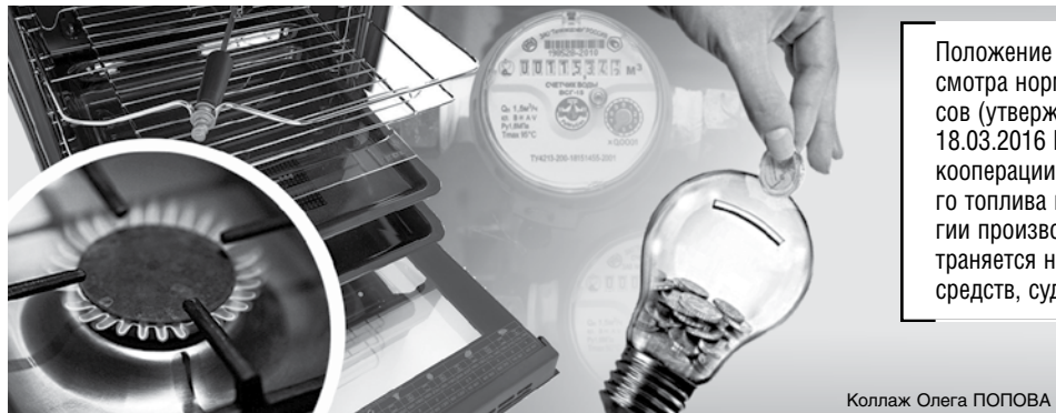
Коллаж Олега ПОПОВА

В норму не включаются расходы ТЭР на строительство, в том числе капитальный ремонт, зданий и сооружений с целью расширения производства и увеличения объемов выпускаемой продукции (за исключением строительномонтажных работ, выполняемых собственными силами), а также на монтаж, наладку и запуск технологического оборудования (вновь уста-