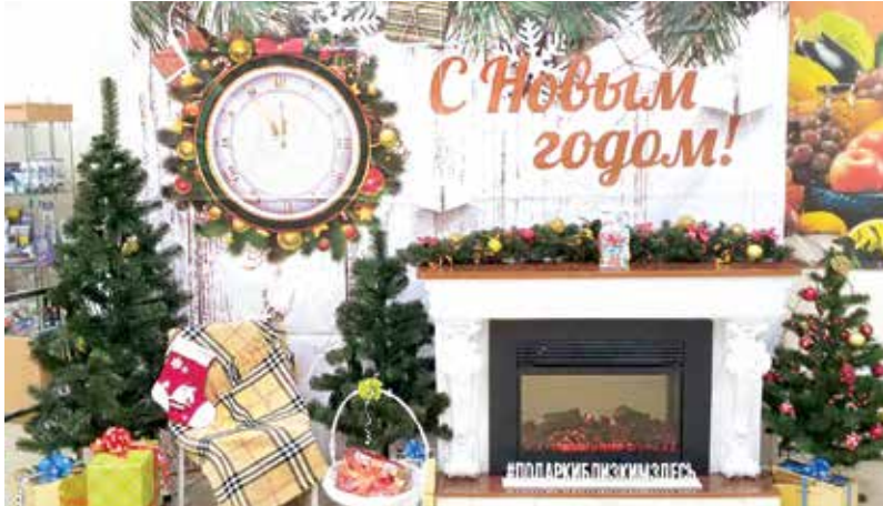
Фотозона в агрогородке Мышковичи порадовала и местных жителей, и гостей района

– Канун Нового года – особое время. И потребкооперация делает все, чтобы раскрасить жизнь в яркие тона, помочь людям в выбо-