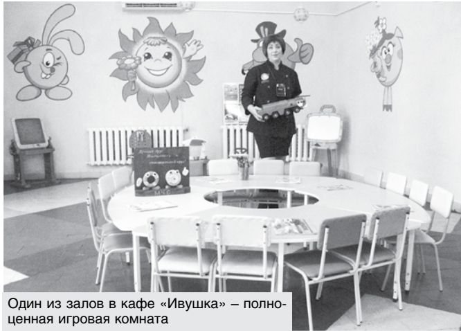
Один из залов в кафе «Ивушка» – полноценная игровая комната