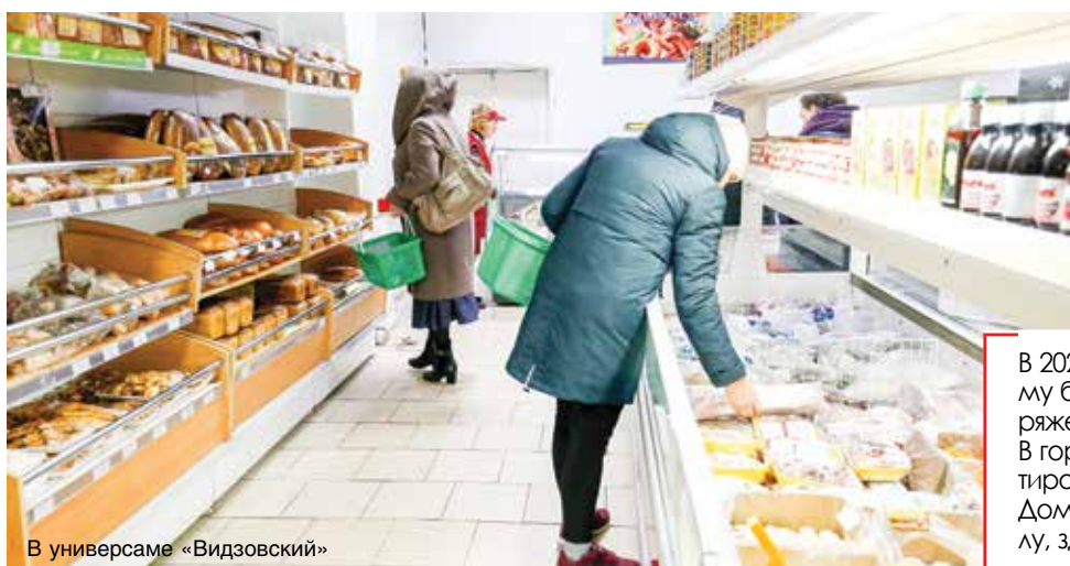
В универсаме «Видзовский»

В 2020 году Видзы подвергнутся обстоятельному благоустройству. Это закреплено распоряжением Витебского облисполкома. В городском поселке планируется отремонтировать школу и детский сад, больницу, Дом культуры, библиотеку, музыкальную школу, здание сельисполкома.