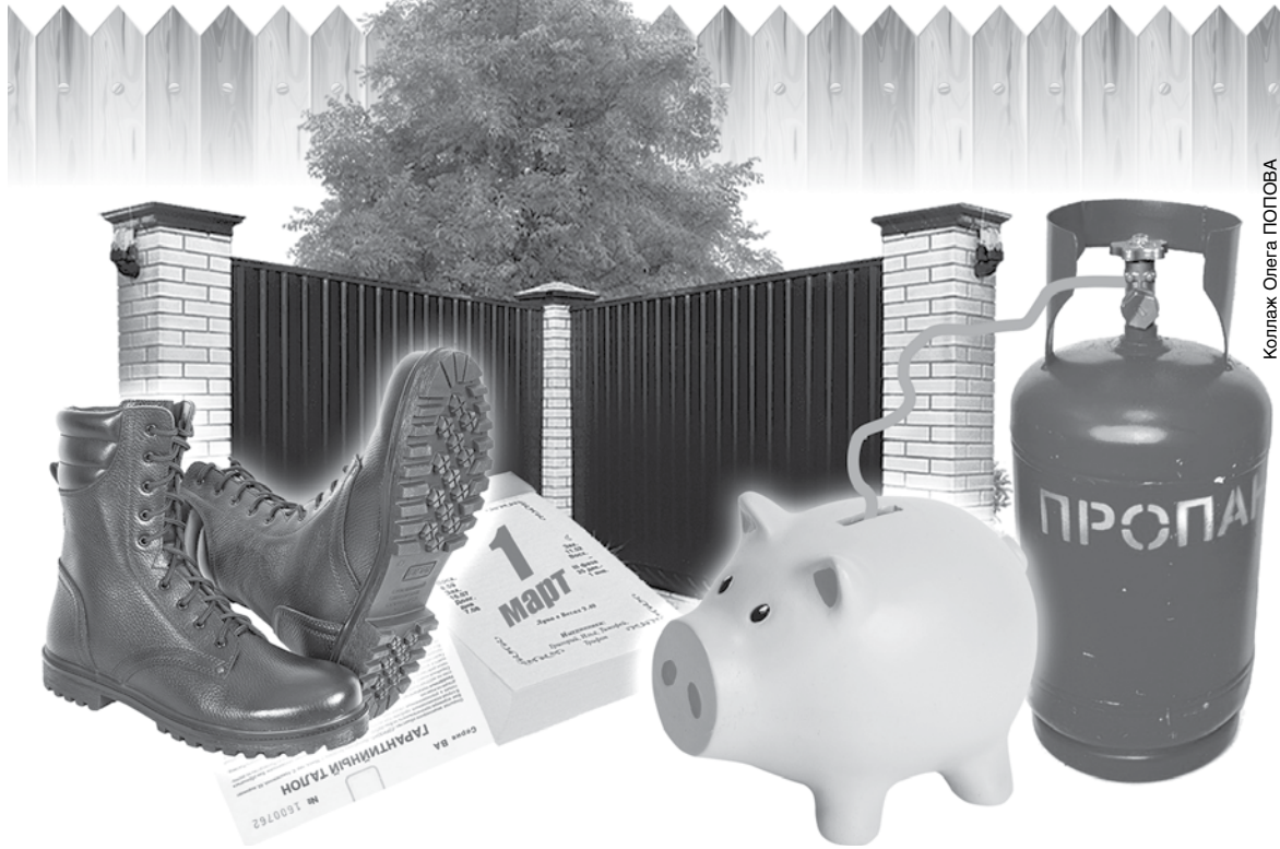
Коллаж Олега ПОПОВА

7.7. При проектировании ограждений между приквартирными участками жилого дома, состоящего из двух и более квартир, необходимо обеспечивать зону не менее одного метра