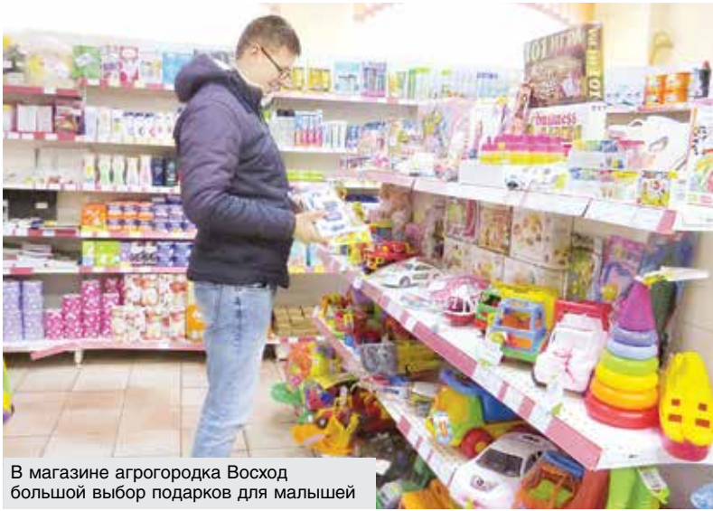
В магазине агрогородка Восход большой выбор подарков для малышей

На Могилевщине популярность фотозон в минувшем сезоне на самом деле была большой. Работники потребкооперации к делу их оформления подошли с особой теплотой. К примеру, в магазине «Родны кут» в Кировске продавцы своими руками выложили декоративный камин в натуральную величину. За основу взяли пенопласт и оклеили его так, чтобы создать эффект кирпичей.