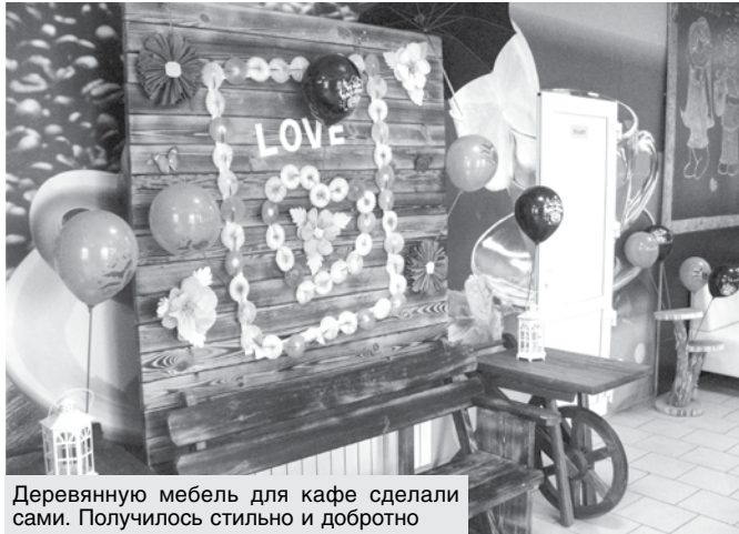
Деревянную мебель для кафе сделали сами. Получилось стильно и добротно

ментирует буфетчица Наталья Юдицкая. – Это очень уважаемые местными жителями и гостями продукты.