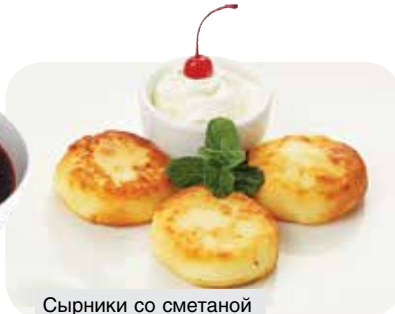
Сырники со сметаной

Приятного аппетита и теплых вечеров в кругу семьи!