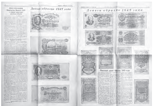
Текст постановления Совета Министров СССР и ЦК ВКП(б) «О проведении денежной реформы и отмене карточек на продовольственные и промышленные товары» от 14 декабря 1947 года и образцы новых денег, опубликованные в центральных газетах СССР

сельского хозяйства БССР строят столовые и буфеты в центральных усадьбах и крупных отделениях. Вложены огромные деньги. Сеть за 1958–1961 годы увеличилась в девять раз. Но в 1961–1962 годах ее у потребкооперации забирают без какой-либо