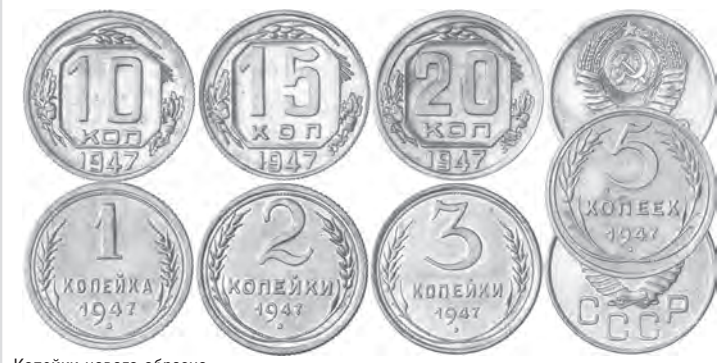
Копейки нового образца

К 1955 году удельный вес розничного товарооборота потребительской кооперации увеличился до 38,7 процента. Рост за пятилетку на 125 процентов против плановых 70. Сельская торговля республики в расчете на душу населения достигла довоенного уровня.