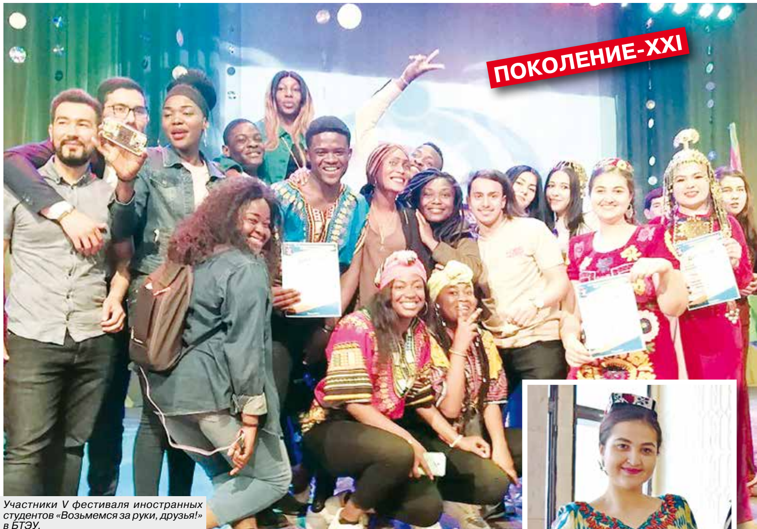
Участники V фестиваля иностранных студентов «Возьмемся за руки, друзья!» в БТЭУ.