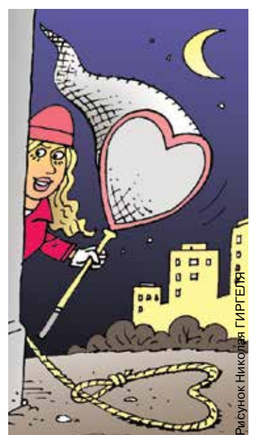
Рисунок: Николай ГИРГЕЛЯ

*** В детстве он был слабым и трусливым мальчиком, но с появлением интернета превратился в крутого каратиста.