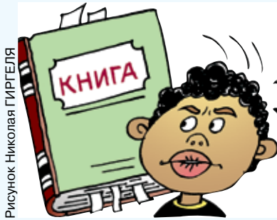
Рисунок: Николай ГИРГЕЛЯ

Русские слова и выражения, которые звучат для американцев как ругательства