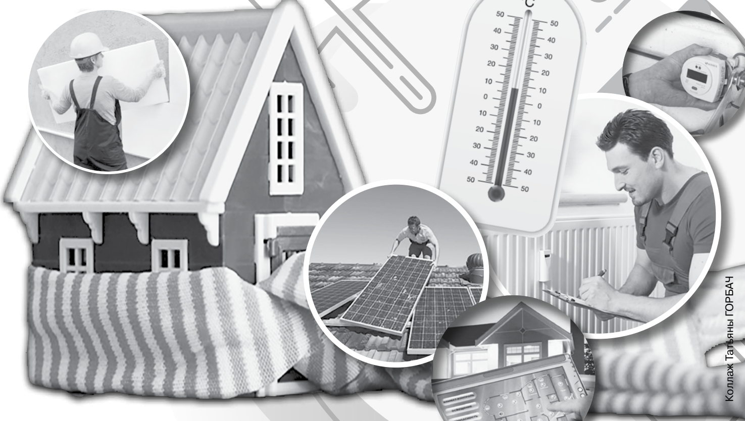
Коллаж Татьяна ГОРБАЧ

Проблема обогрева всегда являлась одной из важнейших для человека, возможно, даже самой важной после питания. В общем-то, это и неудивительно, учитывая крайне узкий, всего пару десятков градусов, диапазон пригодных для естественной, без дополнительного обогрева жизни человека температур, с одной стороны, и весьма значительный температурный разброс в разных климатических зонах нашей планеты – с другой. В свое время только лишь освоение огня позволило нашим предкам пережить ледниковый период и расселиться по холодным северным ареалам. И хотя с тех легендарных времен человечество значительно продвинулось по пути технического прогресса, проблема собственного обогрева до сих пор остается крайне злободневной и каждому ее приходится так или иначе решать.