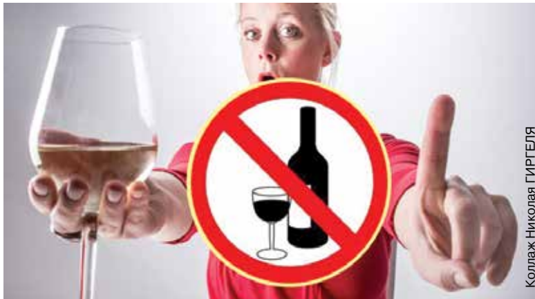
Коллаж: Николай ГИРГЕЛЯ

Бытует мнение, будто в бокале вина нет ничего страшного. Однако это смертельно опасный миф. Чем больше спиртных напитков вы пьете, тем выше риск гипертонии и инсульта. Сэтим утверждением не спорили никогда. Но все же считалось, что есть некая безопасная доза алкоголя, которая, по некоторым данным, умеет даже предотвращать ишемический инсульт. Однако эти данные опровергнуты. Результаты недавно завершившегося крупного исследования однозначно доказывают: безопасной дозы алкоголя не существует.