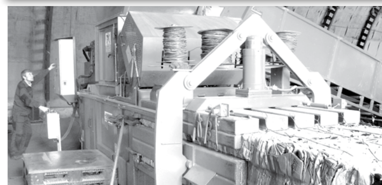
Благодаря мощному прессу вес тюка отсортированных отходов бумаги и картона может достигать 400 кг: транспорт переработчика за один раз загружается под завязку – выгодно всем.

общем объеме сбора вторресурсов в масштабе облпотребсоюза на наше предприятие приходится в настоящее время 38 процентов заготавливаемых отходов бумаги и картона, 45 – стекла, 52 процента полимерного сырья. Нынешний год также начали с хороших результатов: темп роста заготовительного оборота по итогам первого квартала составил 118 процентов.