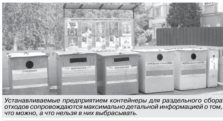
Устанавливаемые предприятием контейнеры для раздельного сбора отходов сопровождаются максимально детальной информацией о том, что можно, а что нельзя в них выбрасывать.

Осваиваем заготовку новых видов сырья. Это уже упоминавшаяся бытовая техника, а также отработанные моторные и индустриальные масла: динамика положительная, перспективы хорошие. Осознаем всю важность возложенной на нас миссии. В