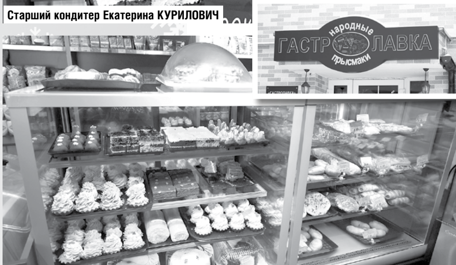
Кондитерские изделия собственного производства магазина кулинарии «Гастролавка» изготавливаются на основе натуральных ингредиентов