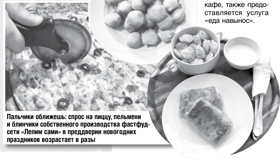
Пальчики оближешь: спрос на пиццу, пельмени и блинчики собственного производства фастфуд-сети «Лепим сами» в преддверии новогодних праздников возрастает в разы

Мария НИКОЛАЕВА