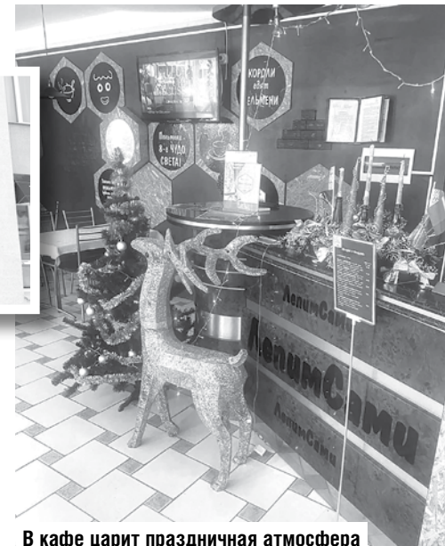
В кафе царит праздничная атмосфера

– Свежее мясо, лук, специи, – отвечает мастер. – Берем муку, смешиваем ее с солью, а затем вливаем крутой кипяток. Добавляем яйца, масло подсолнечное, замешиваем. Тесто само по себе получается тугое, затем выстаивается. Позже из него вырезаются кружки, внутрь которых заворачивается