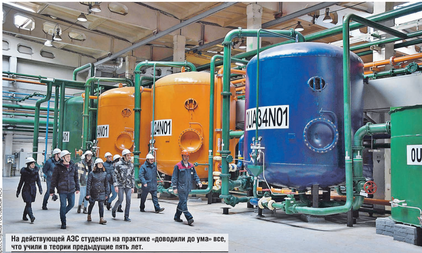
На действующей АЭС студенты на практике «доводили до ума» все, что учили в теории предыдущие пять лет.

Еще через три года ввели четвертый энергоблок.