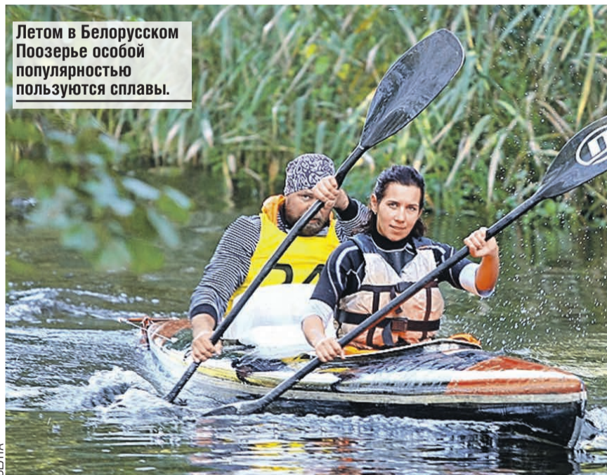
Летом в Белорусском Поозерье особой популярностью пользуются сплавы.