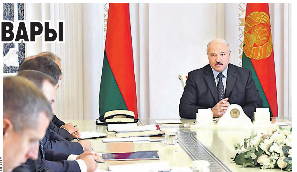
Александр Лукашенко формулирует задачи перед Правительством четко и однозначно, чтобы потом сомнений не возникало, с кого требовать результат и какой.

– Сегодня около шестидесяти белорусских предприятий полностью или частично закрыты для поставок своей