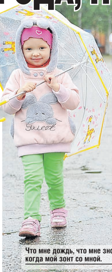
Что мне дождь, что мне зной, когда мой зонт со мной.