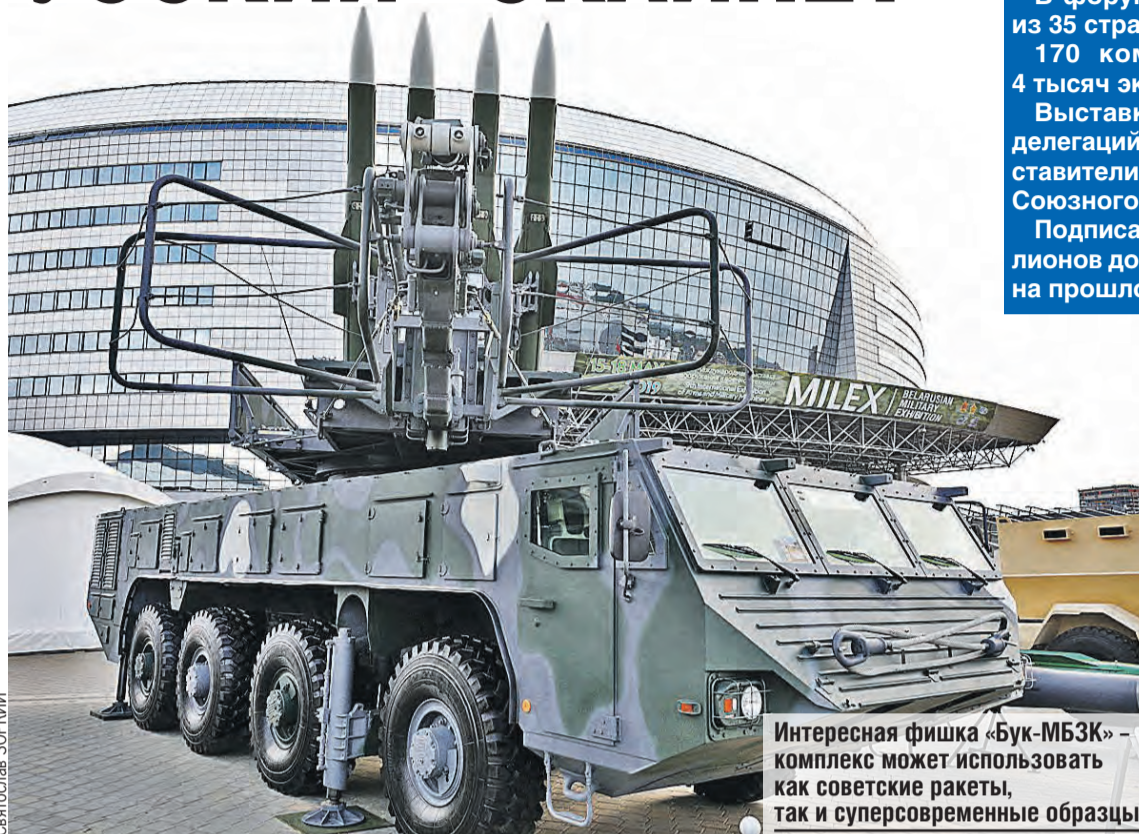
Интересная фишка «Бук-МБЗК» — комплекс может использовать как советские ракеты, так и суперсовременные образцы.

Хочешь, например, поучиться управлять переносным зенитным ракетным комплексом? Пожалуйста! На учебном электронном стенде от моего первого выстрела вражеский вертолет размером со стрекозу ускользнул. Второе железное насекомое едва успело долететь до середины экрана, и ба-бах! Рисую звездочку за сбитый.