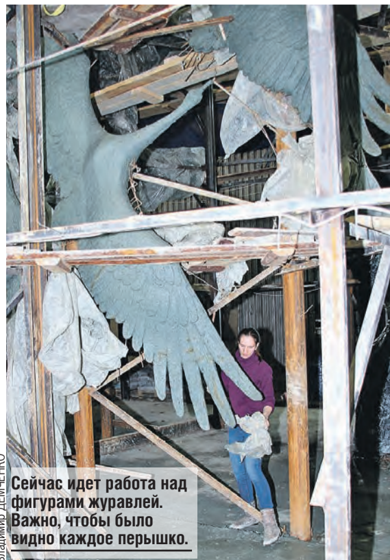
Сейчас идет работа над фигурами журавлей. Важно, чтобы было видно каждое перышко.