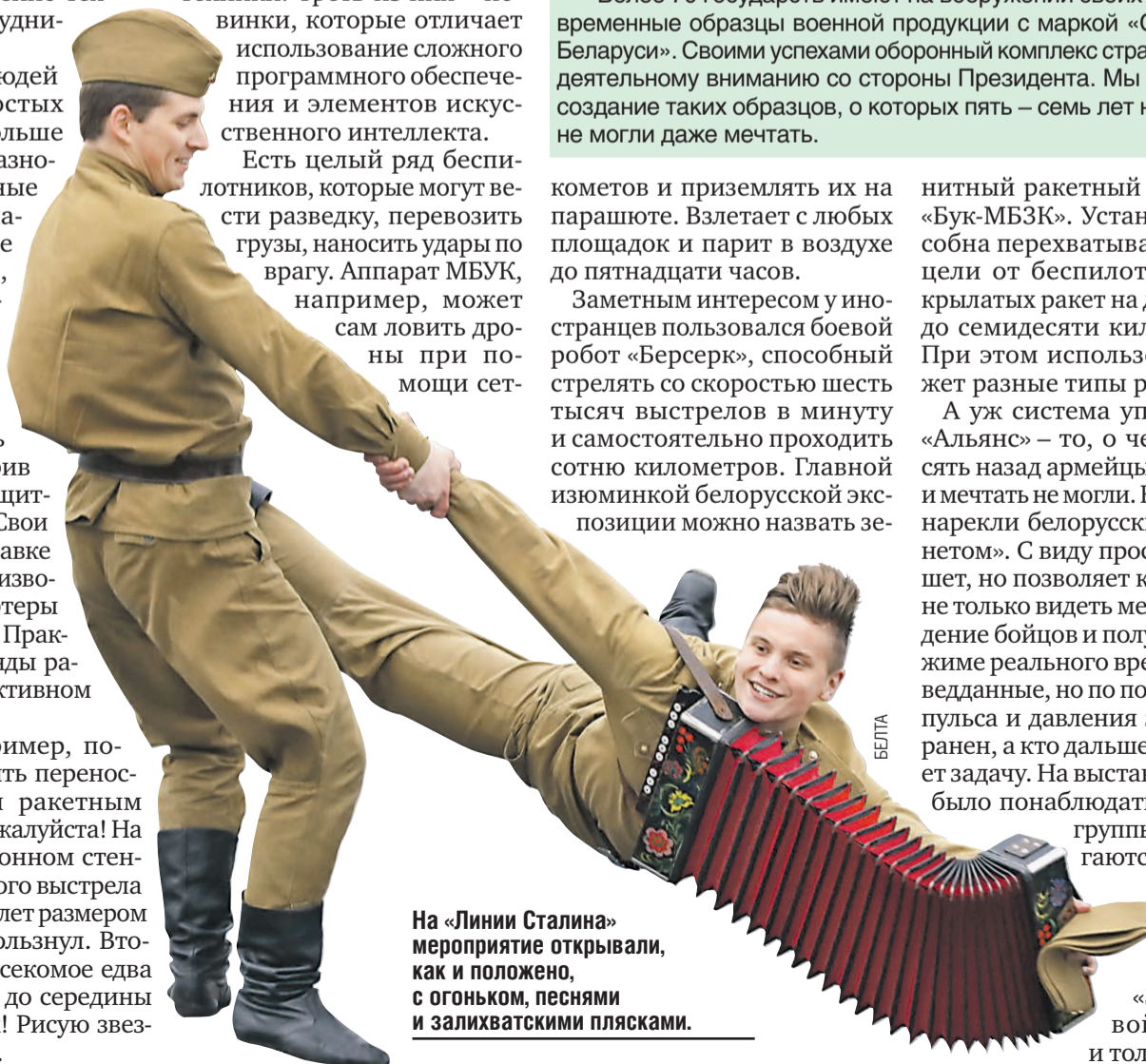
На «Линии Сталина» мероприятие открывали, как и положено, с огоньком, песнями и заливхватскими плясками.

А уж система управления «Альянс» — то, о чем лет десять назад армейцы Беларуси и мечтать не могли. В народе ее нарекли белорусским «Скайнетом». С виду простой планшет, но позволяет командиру не только видеть местонахождение бойцов и получать в режиме реального времени разведанные, но по показателям пульса и давления знать, кто ранен, а кто дальше выполняет задачу. На выставке можно было понаблюдать, как три группы передвигаются в Витебске, Марьиной Горке и Бресте. «Звездные войны», да и только.