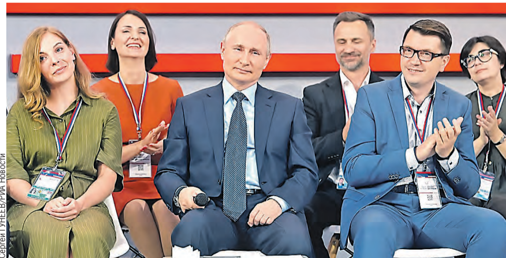
На медиафоруме ОНФ Владимир Путин окупался в ворах региональных проблем, которые журналисты местных СМИ раскрывали в своих злободневных репортажах.

– Что, кому, когда, в какие сроки и на каких основани-