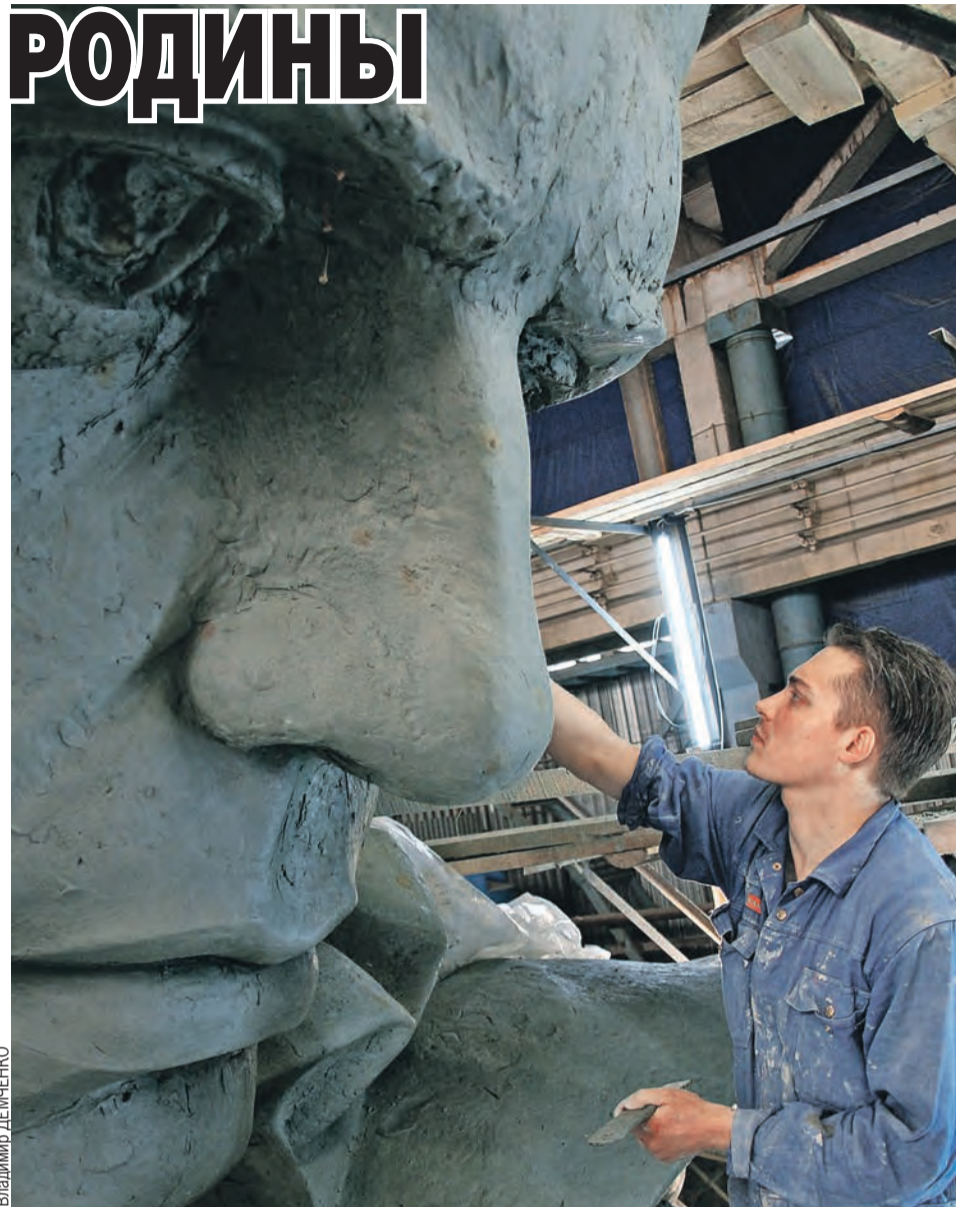
Кажется, как будто воин наблюдает за нами прямо из 1942 года.