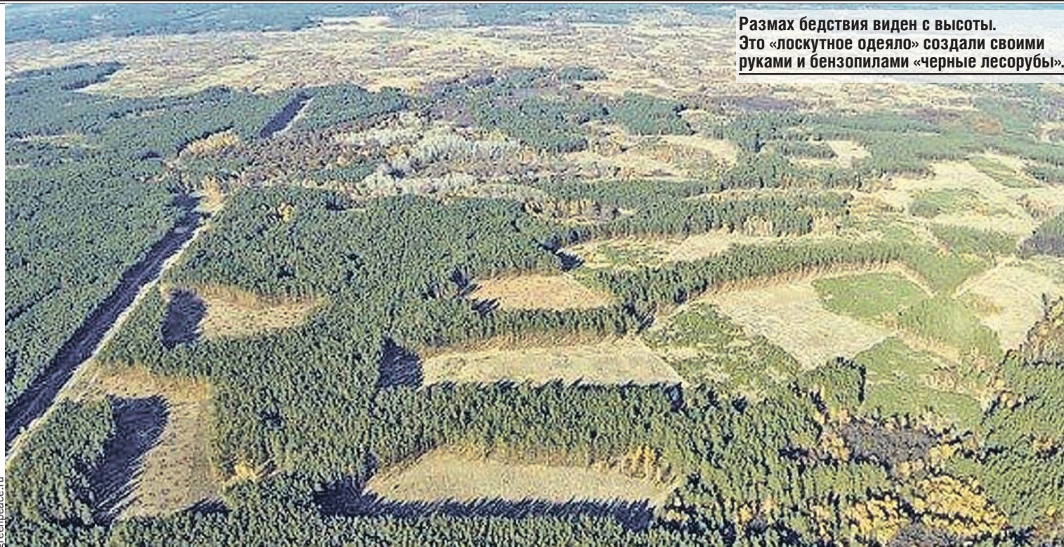
Размах бедствия виден с высоты. Это «лоскутное одеяло» создали своими руками и бензопилами «черные лесорубы».

– Правильно считают. Добывать лес в труднодоступных местах – прорезивать – не хотят, нерентабельно. Выкашивают площадями. Восстанавливать вырубленное не считают нужным. Институт гарантийных обязательств лесовосстановления не работает. Так что проблем много. Самая серьезная – нежелание государства