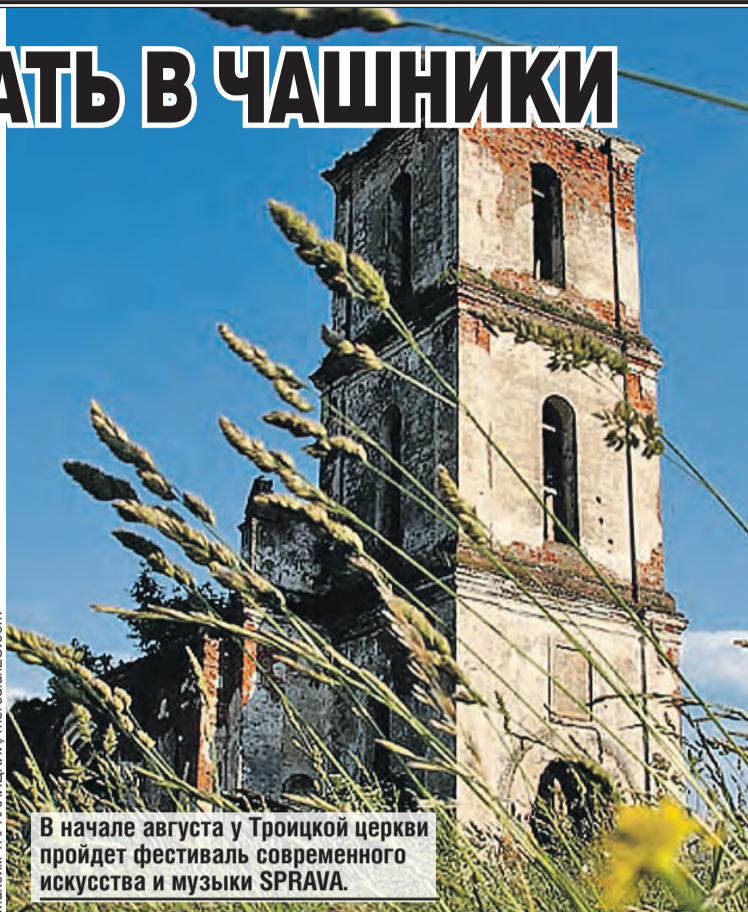
В начале августа у Троицкой церкви пройдет фестиваль современного искусства и музыки SPRAVA.