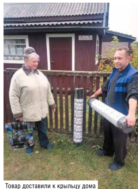
Товар доставили к крыльцу дома