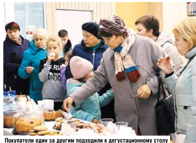
Покупатели один за другим подходили к дегустационному столу

Для того чтобы кондитерские изделия были вкусными и визуально привлекательными, в их состав совсем необязательно включать искусственные ингредиенты. Ивацевичские специалисты доказали это, создав сладкие шедевры из простых и натуральных продуктов.