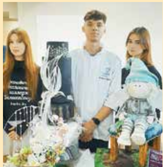
Учащиеся Барановичского технологического колледжа Белкоопсоюза во время презентации учебного заведения

Нынешней осенью ярмарки целевой подготовки проходят уже не в первый раз. Посещая их, школьники узнают о профессиях и условиях обучения. На сей раз ее участниками стали около 600 учащихся одиннадцатых классов.