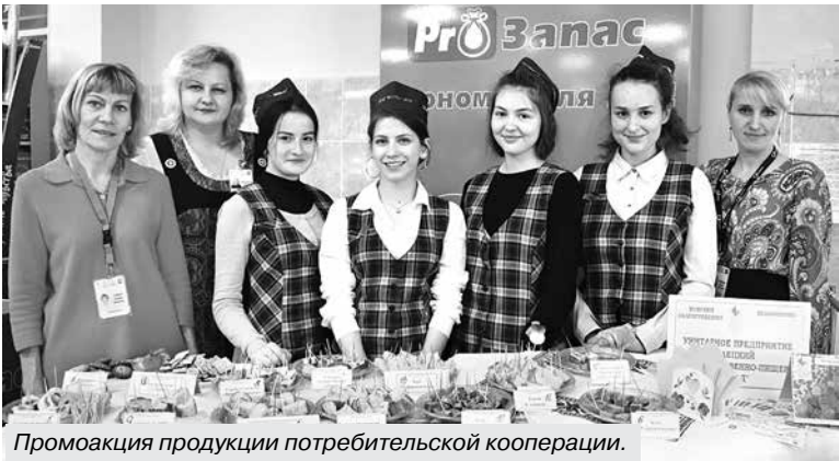
Промоакция продукции потребительской кооперации.

В связи с этим в Минском филиале учреждения образования «Белорусский торгово-экономический университет потребительской кооперации» учебная практика рассматривается как значимая часть образовательного процесса, целью которого является эффективная интеграция теоретических знаний и практических умений. С 2015 года стало традицией проводить выездные учебные занятия по коммерческой деятельности, товароведению, маркетингу, экономике, по учебной и производственной практике на базе объектов торговли Минского райпо. 22 мая 2019 года в соответствии с планом мероприятий по совмест-