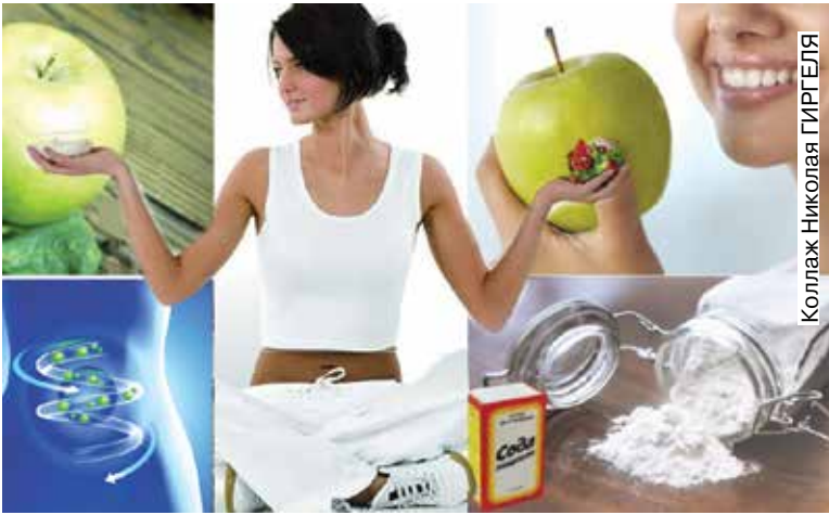
Коллаж Николая ГИРГЕЛЯ

На одну процедуру обычно необходимо 8 – 12 стаканов воды и несколько часов времени. Для остановки очищения кишечника после принятия очередного стакана воды