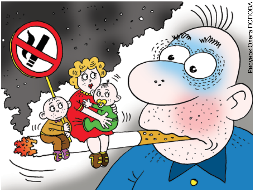
Рисунок Олега ПОПОВА

Вся опасность курения в том, что вред от него не проявляется одновременно. То есть нельзя сразу и мгновенно увидеть весь негатив и оценить удар, наносимый организму. А потому человек получает ложное ощущение безопасности. Ведь выходит, что курить можно всю жизнь и ничем не жертвовать! Но так ли это? Курить почти все начинают в подростковом возрасте, и это вполне логично,