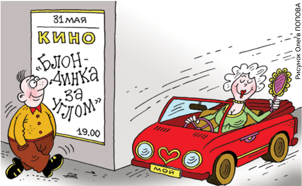
Рисунок Олега ПОПОВА

О втором варианте происхождения Дня блондинок говорят гораздо меньше, но по срокам он вполне мог бы быть связан с американским кино. Дочь адвоката и владелицы художествен-