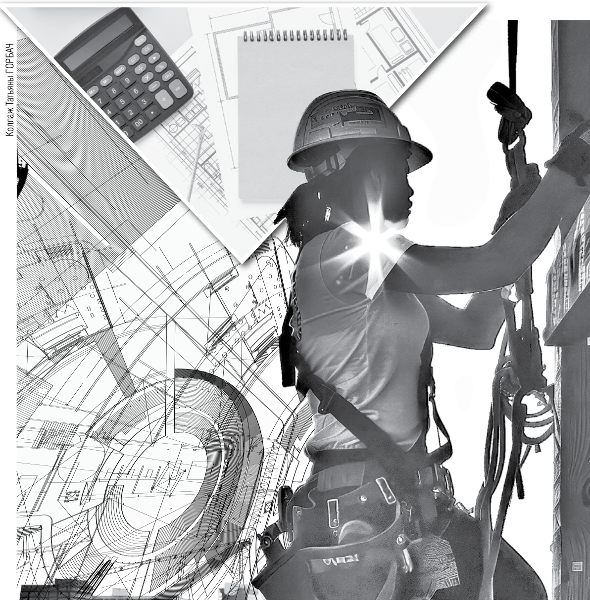
Коллаж Татьяна ГОРБАЧ

Подчеркну: составление акта формы С-2а – не просто требование к форме документирования текущего ремонта. Это залог соблюдения требований по контро-