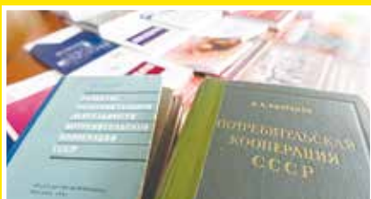
В библиотеке хранятся фундаментальные труды о развитии потребительской кооперации