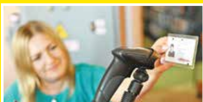
В библиотеке БТЭУ ПК внедрены электронные формуляры и штрихкодированное обслуживание