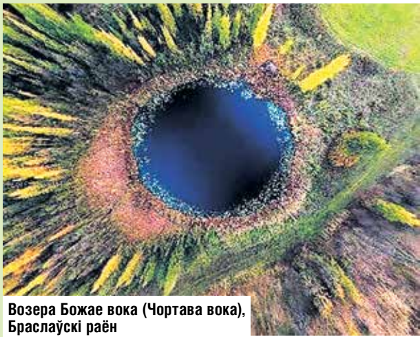
Возера Божае вока (Чортава вока), Браслаўскі раён

Марына КУЗЬМІЧ, фота з адкрытых інтэрнэт-крыніц