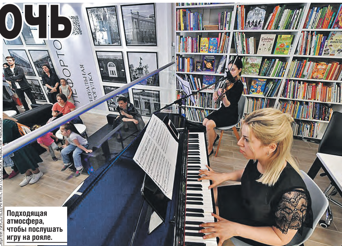
Подходящая атмосфера, чтобы послушать игру на рояле.

В Румянцевском зале объявят победителей из стран СНГ литературного конкурса «Класс!». При участии актеров театра «РЭПЭТЭ» и финалистов чемпионата по чтению вслух «Страница» прозвучат