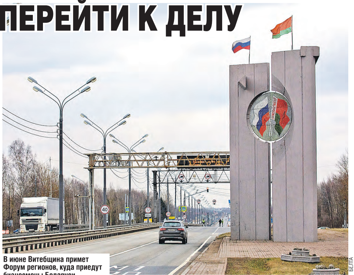
В июне Витебщина примет Форум регионов, куда приедут бизнесмены Беларуси и России, чтобы заключить новые контракты.

– Может быть, предложить такой термин, как регионы, приравненные к пригра-