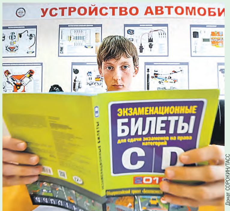
Зубрежка и нервотрепка отменяются, водительское удостоверение в соседней стране – не проблема.