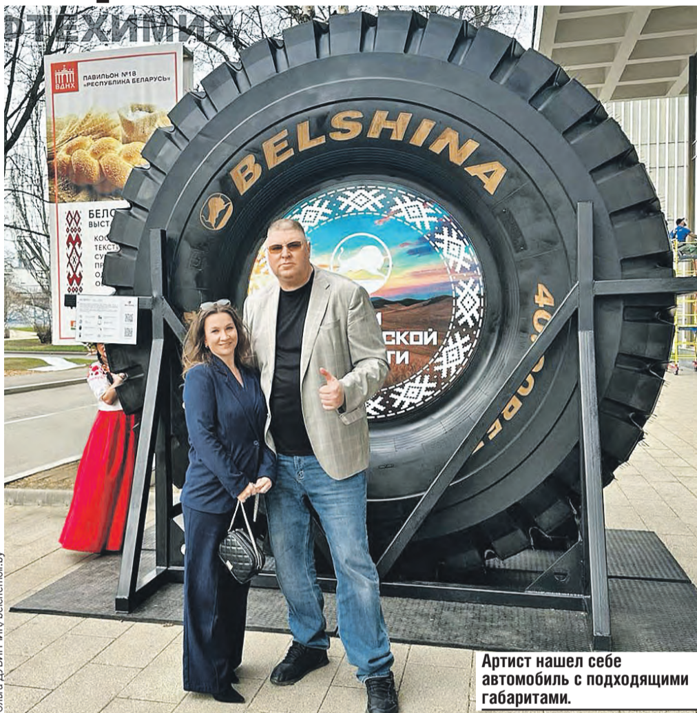
Артист нашел себе автомобиль с подходящими габаритами.