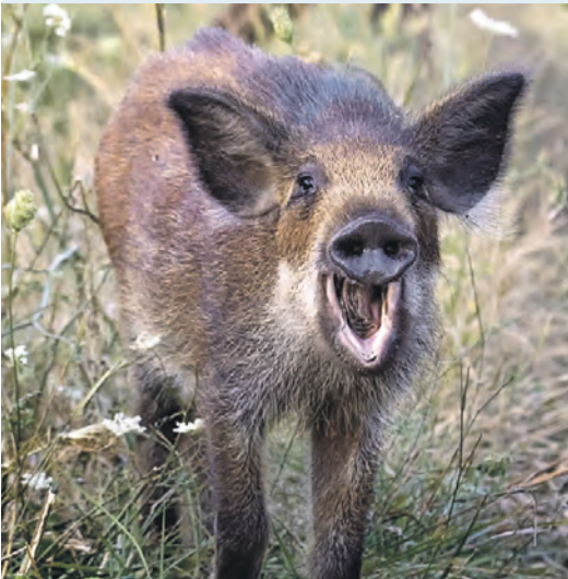
Милый кабанчик как будто сейчас скажет: «Я так рад тебя видеть!»