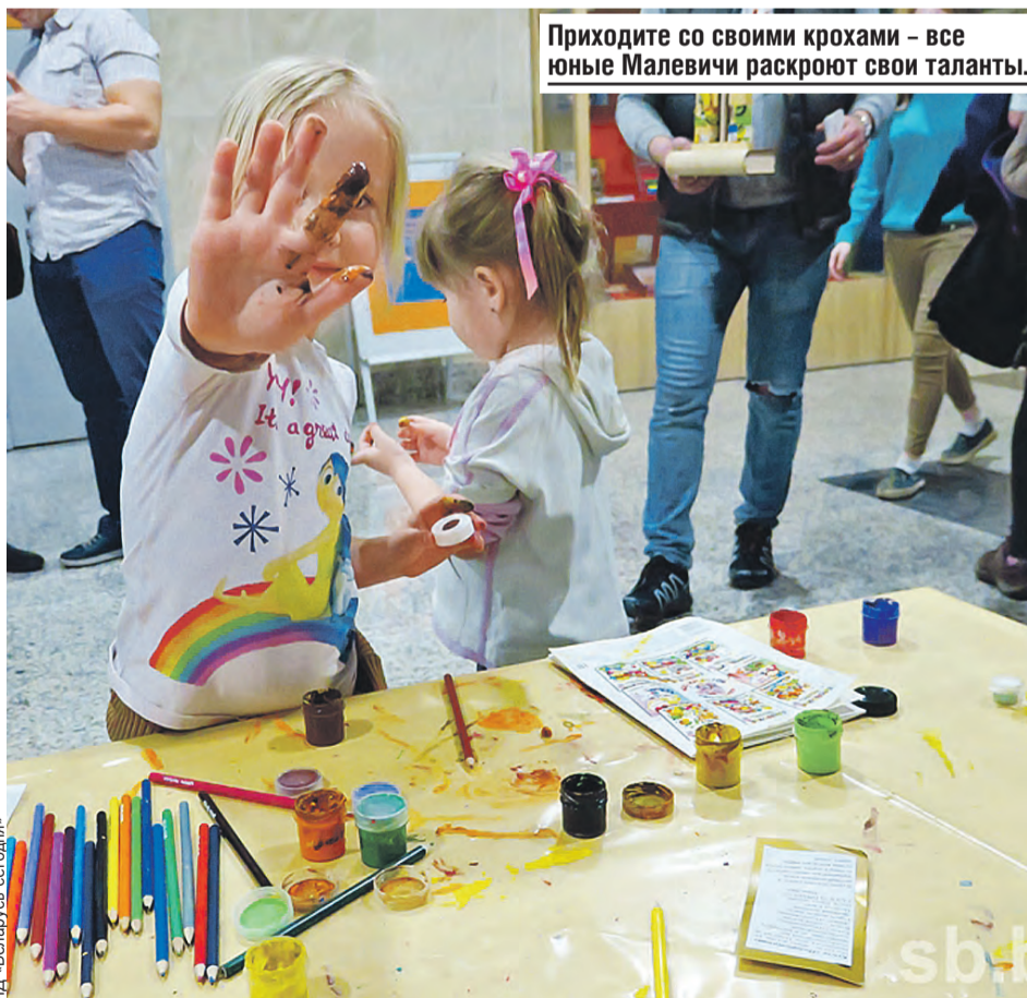
Приходите со своими крохами – все юные Малевичи раскроют свои таланты.

Тематическую акцию проведут в Республиканской научной медицинской библиотеке. Для взрослых – эксклюзивные лекции акушера-гинеколога и врача-педиатра. А в это время дети смогут мастерить поделки из бисера и лепить из воздушного пластилина. Бонус – увлекательный квест в Музее истории медицины.