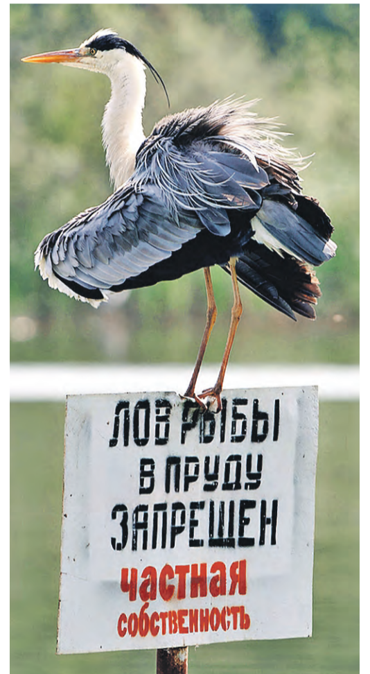
Догадались, что за птица? Серая цапля! На самом деле эти пернатые очень осторожны, но бесстрашная молодежь не боится нарушать правила.