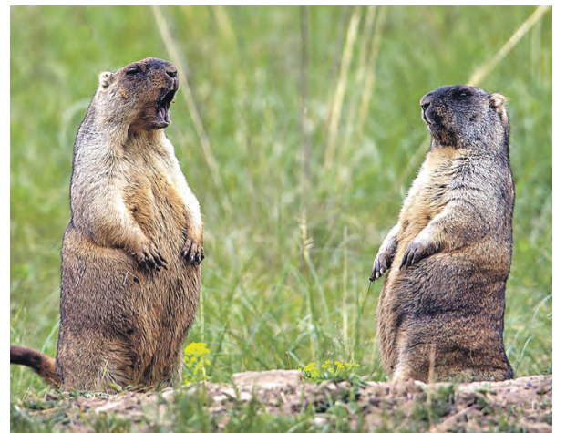
Вспомнился мем с орущим бобром! Но это – степной сурик. По словам автора, фотография сделана ранним утром, когда солнце прогрело пригорок, где поселилась их колония.