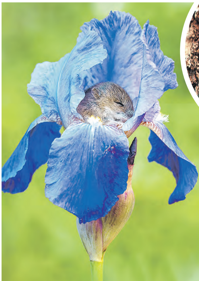
«Мышонок Пик» – вспомнилась детская сказка про малыша, построившего себе жилище в поле.