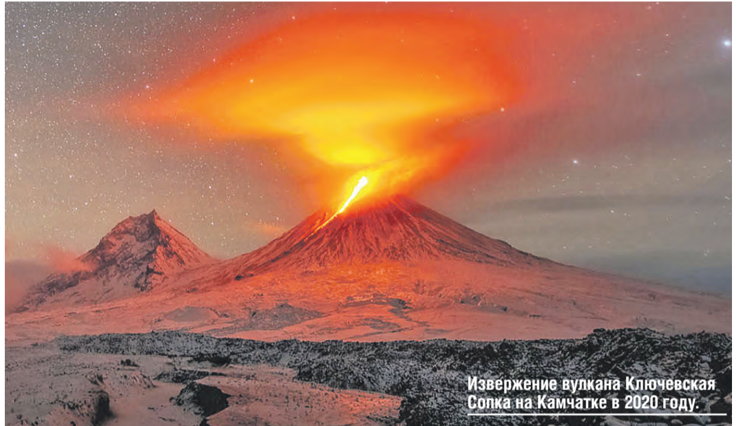
Извержение вулкана Ключевская Солка на Камчатке в 2020 году.

Также представлен раздел «Нетронутая красота Таиланда». Хотя эта страна очень удалена от России и отличается от нее климати-