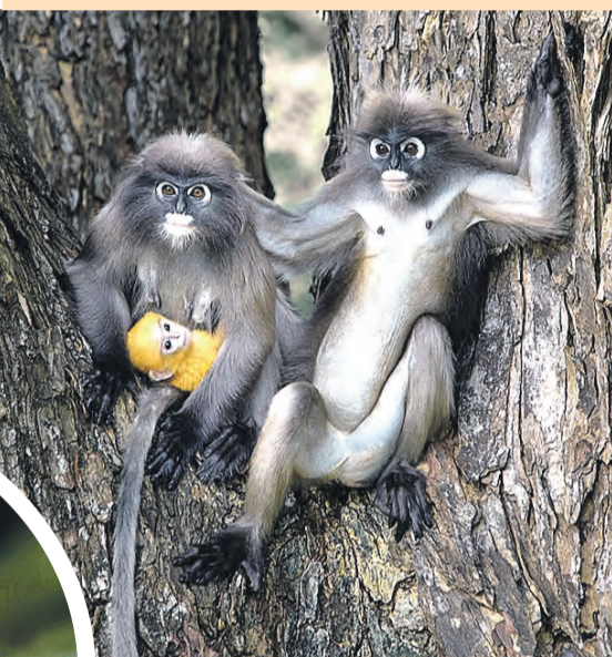
Когда собрались с подружкой обсудить последние сплетни. Главный вопрос – а чье дитя такого странного цвета?