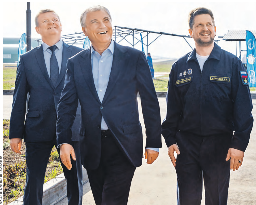
В аэроклубе, где когда-то стартовал Гагарин, Вячеслав Володин посмотрел на соревнующихся парашютистов: орлы!

В этом году Россия председательствует в БРИКС. В Санкт-Петербурге пройдет X Парламентский форум.