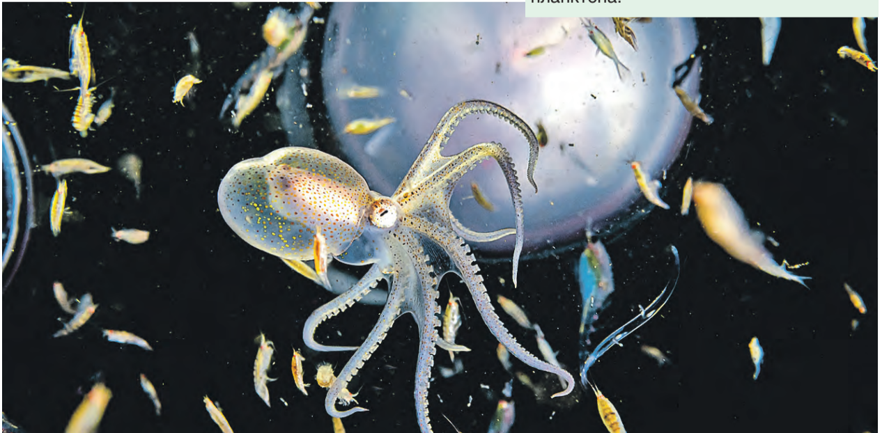
Вылупившиеся из яйца личинки гигантского осьминога Дофлейна совершенно прозрачны и живут в толще воды среди планктона.