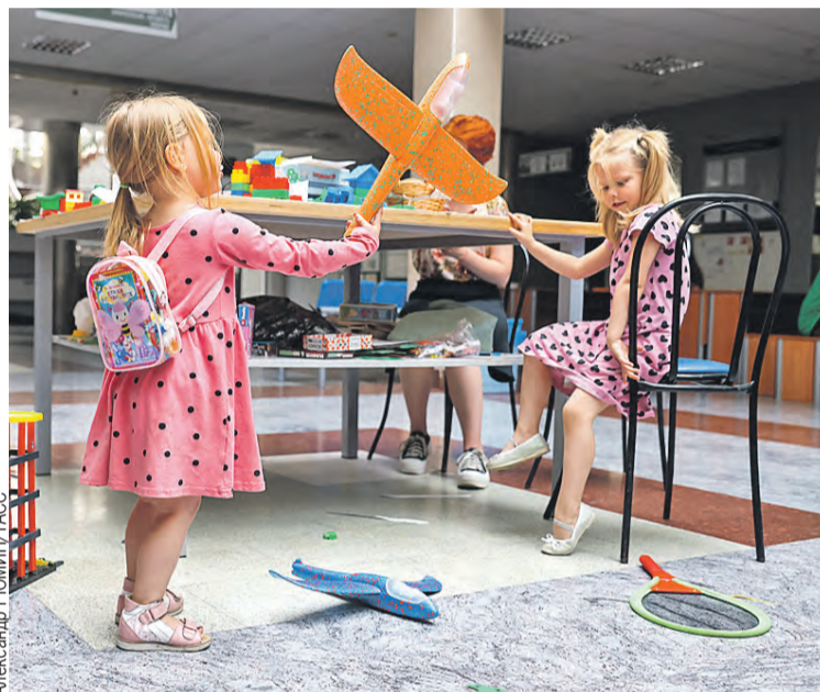
Лучше игрушечные самолетики в руках, чем ракеты в небе.

– В городе практически никого нет, а оставшиеся жители находятся в своих подвалах и укрытиях. Почти полностью уничтожена инфраструктура