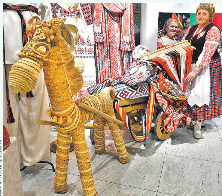
Запрягли коника, подпоясались – и на праздник. Изделия из соломки пользуются у россиян большой популярностью.

А еще он занимается резьбой по дереву, может вышивать крестиком и вязать на