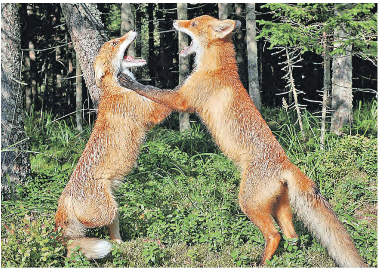
«Борьба за сырок в холодильнике», или Встреча двух молодых лисиц в лесной чаще.