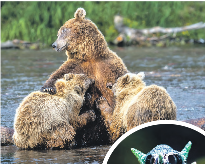
«Ну ма-а-а-ам!» – словно говорят медвежата-двухлетки. В этом возрасте они уже достаточно крупные и сами успешно рыбачат.