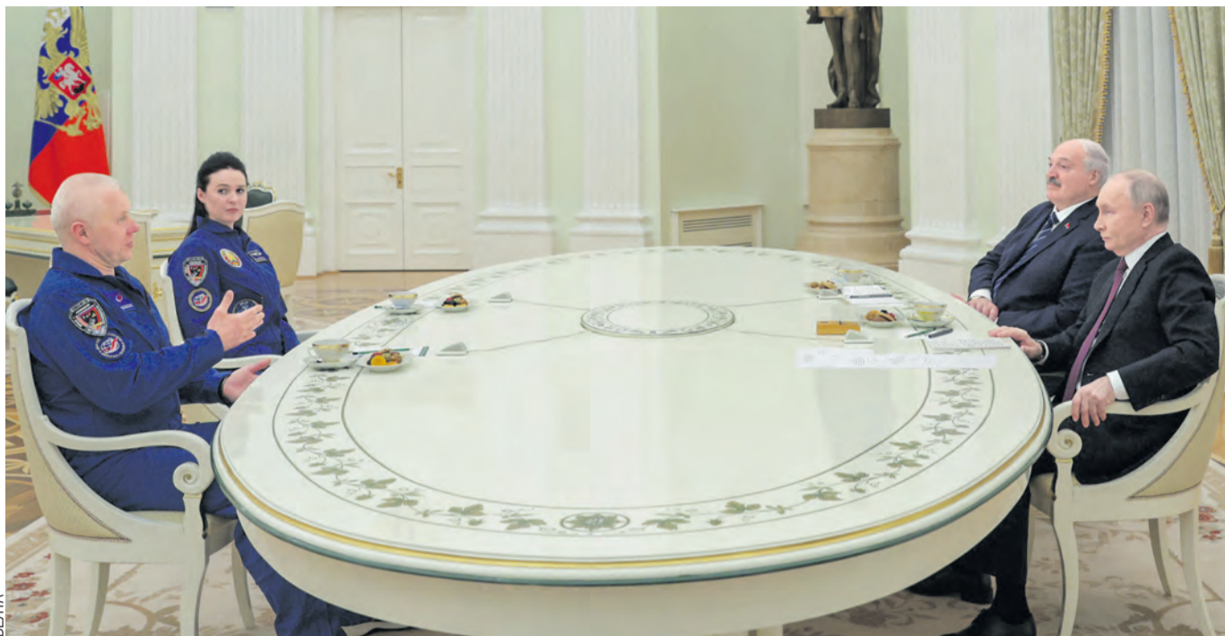
Президенты пригласили к себе на встречу участников 21-й экспедиции на МКС Олега Новицкого и первую в истории суверенной Беларуси женщину-космонавта Марину Василевскую.