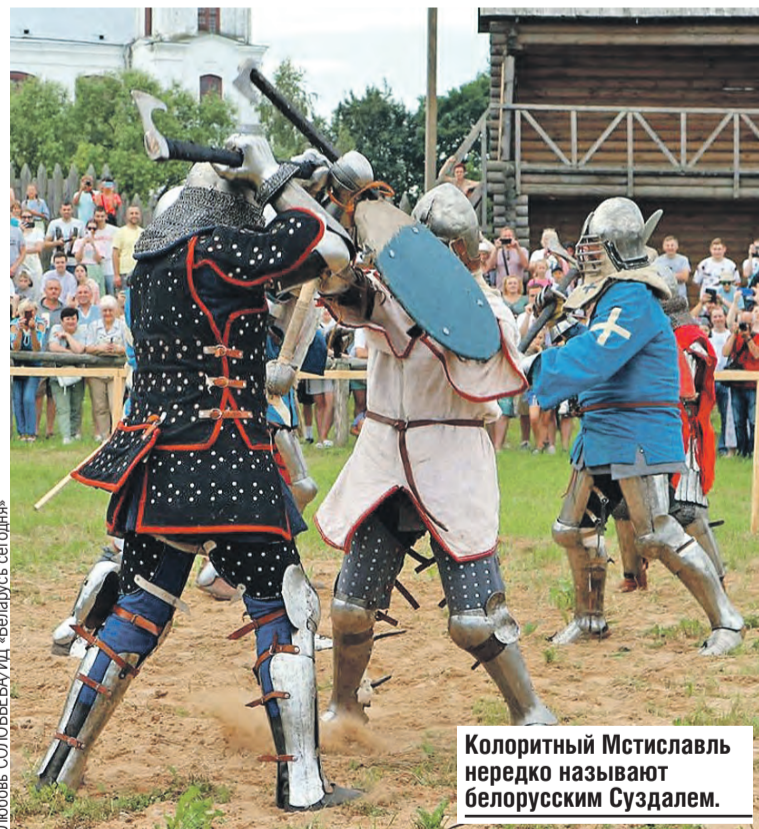
Колоритный Мстиславль нередко называют белорусским Суздалем.