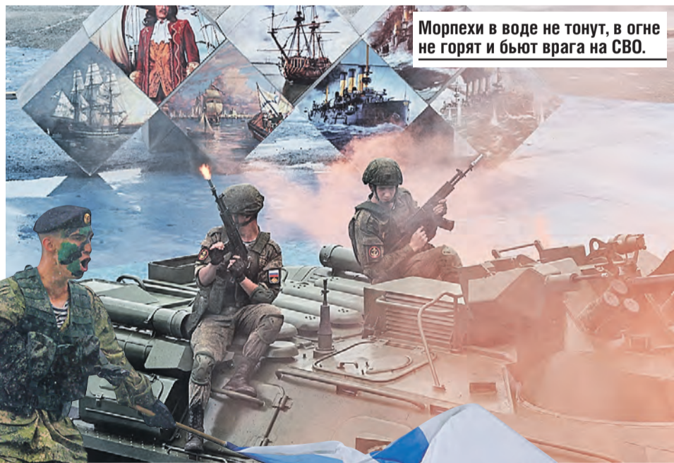
Морехи в воде не тонут, в огне не горят и бьют врага на СВО.