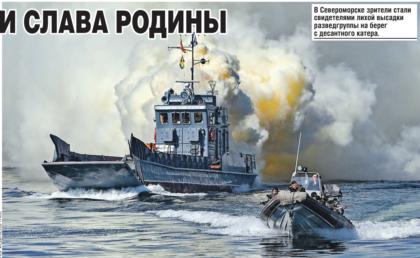
В Североморске зрители стали свидетелями лихой высадки разведгруппы на берег с десантного катера.

День ВМФ – праздник всенародный. По традиции его отмечали по всей стране. Помимо Санкт-Петербурга, морские парады состоялись во Владивостоке, Североморске, Балтийске, Каспийске и сирийском Тартусе, где базируется эскадра. Всего в праздничных кильватерных колоннах прошли почти 200 кораблей и судов разного назначения. Также задействовали больше 100 единиц боевой техники и до 15 тысяч военнослужащих.