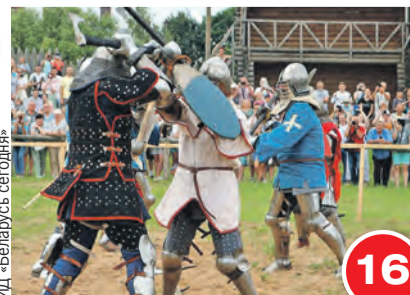
ИД «Беларусь сегодня»

Примеряем кольчугу, лепим горшки и пробуем каравай из муки нового урожая