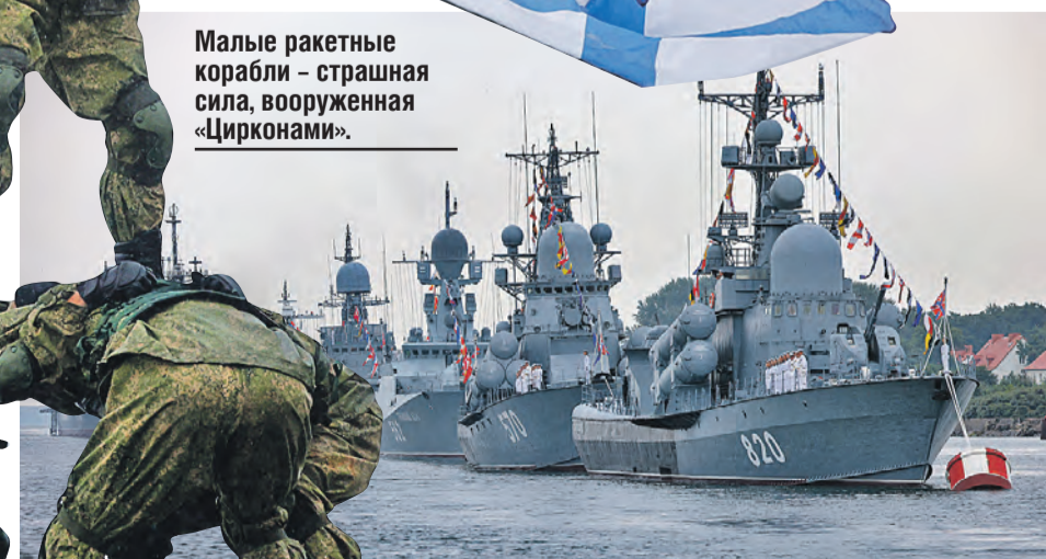
Малые ракетные корабли – страшная сила, вооруженная «Цирконами».