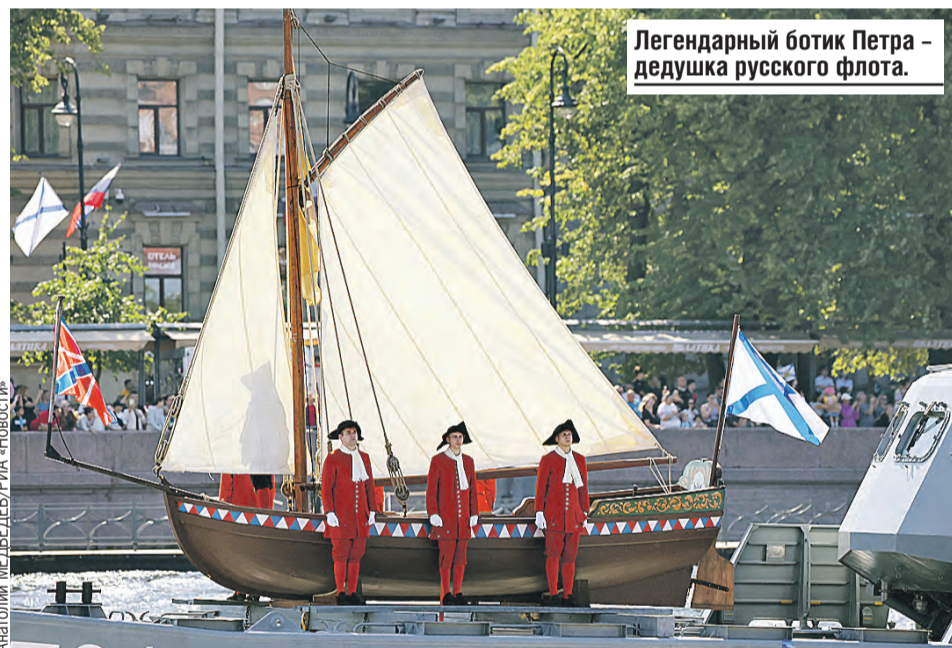
Легендарный ботик Петра - дедушка русского флота.