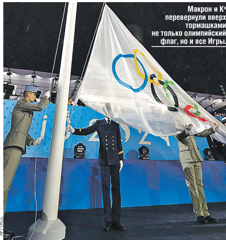
Макрон и К о перевернули вверх тормашками не только олимпийский флаг, но и все Игры.

– После тысяч гневных и осуждающих коммента-