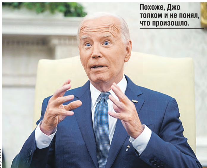
Похоже, Джо толком и не понял, что произошло.

Между тем все мировые СМИ, описывая заслуги президента, писали о том, как он здоровался с воздухом, спотыкался, зависал и нес что попало. В общем, показали круглого дурака во главе ядерной державы. Ничего реального, сделанного на благо народа, не нашли.