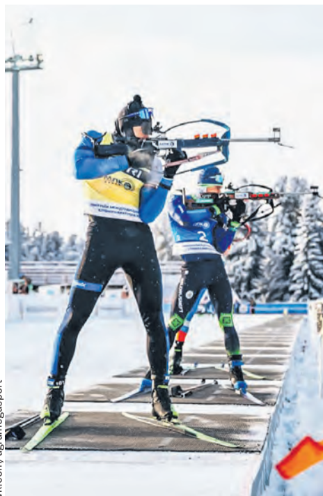
В этом сезоне белорусские и российские биатлонисты проведут много совместных стартов.

■ Биатлонисты продолжают подготовку к новому сезону. Белорусы недавно завершили сбор в армянском Цахкадзоре, россияне отдельными группами тренируются на Семинском перевале и в «Раубичах» под Минском... Сезон у стреляющих лыжников будет насыщенным. Пока Международный союз биатлонистов не делает никаких шагов к возвращению наших спортсменов на Кубок мира и другие крупнейшие старты, белорусы и россияне продолжают работать сообща.