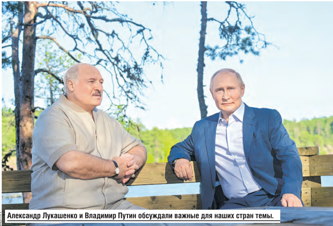
Александр Лукашенко и Владимир Путин обсуждали важные для наших стран темы.

Валаам жарко встречал высоких гостей. Температура воды, кстати, +25.