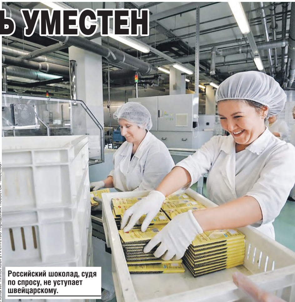
Российский шоколад, судя по спросу, не уступает швейцарскому.

Россия – один из лидеров по экспорту растительных масел. Есть ин-