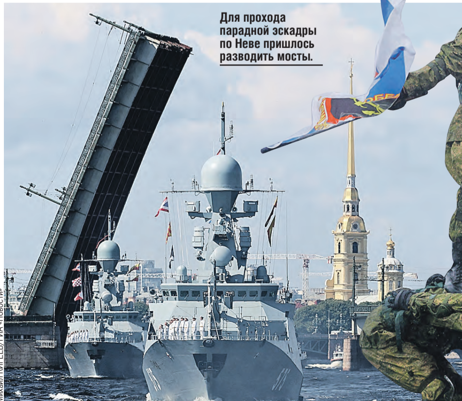
Для прохода парадной эскадры по Неве пришлось разводить мосты.