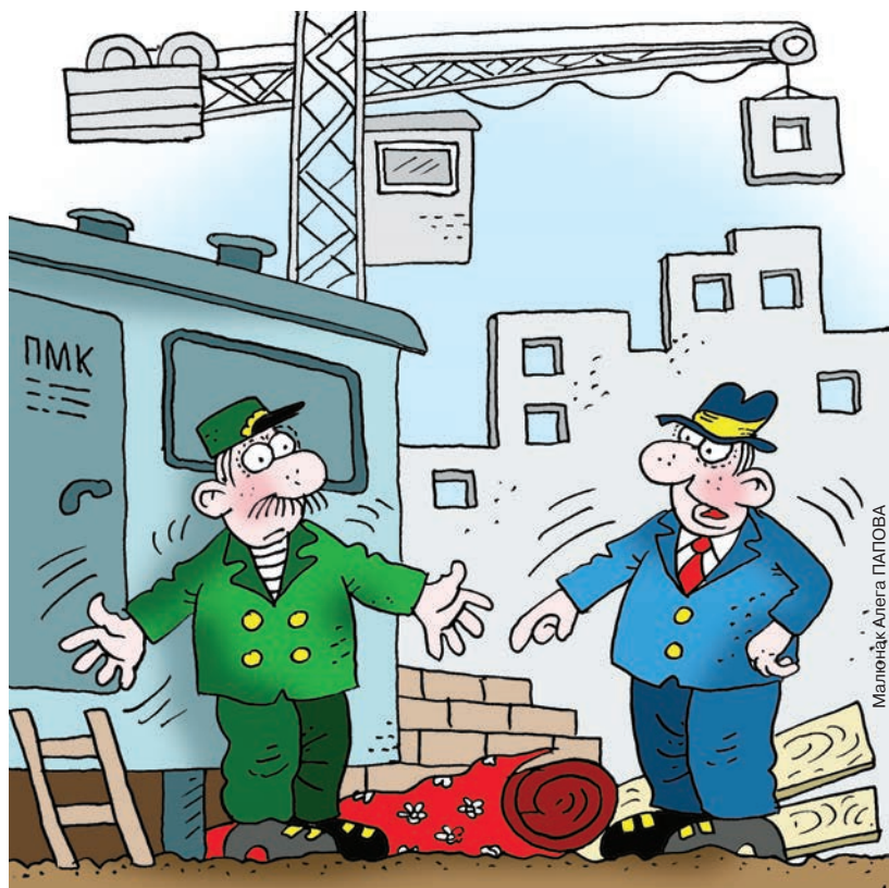
Малюнак Алега ПАПОВА

На будпляцоўцы цішыня. Спякота. Выхадныя. Дурэюць толькі тут