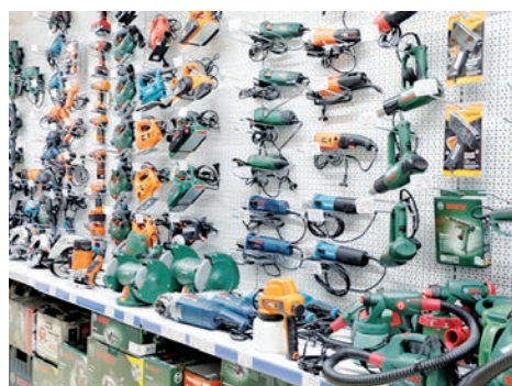
Торговый объект «ОМА» Столинского райпо.

Чем активнее вы, тем активнее ваш покупатель! В сезон торговли строительными материалами привлечь покупателя можно и различными организационными мероприятиями, которые под силу каждой торговой организации: