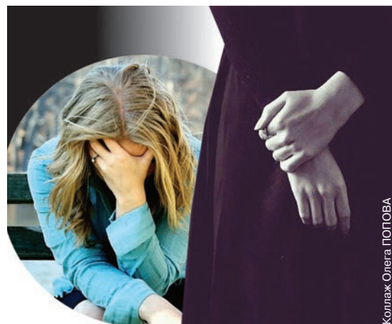
Коллаж Олега ПОПОВА

Чтобы уделить особое внимание бедственному положению этой категории женщин, проживающих в разных регионах и культурных средах, Генеральная Ассамблея ООН объявила, что отныне 23 июня будет Международным днем вдов. Возможно, что для нас эта дата не станет общепринятой, так как в славян-