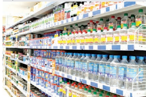
Торговый объект «ОМА» Пружанского райпо.