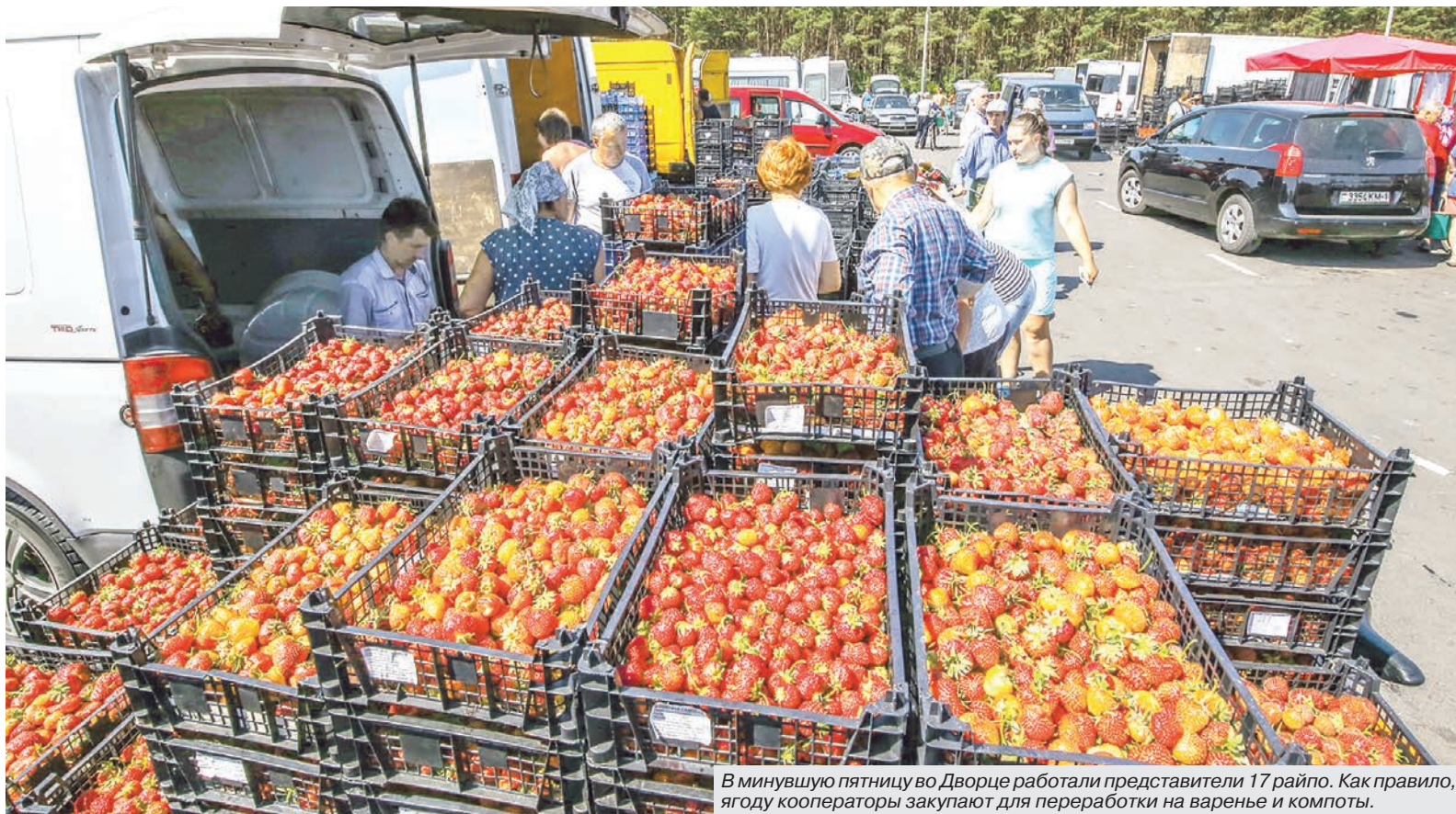
В минувшую пятницу во Дворце работали представители 17 райпо. Как правило, ягоду кооператоры закупают для переработки на варенье и компоты.

Сезонный бизнес: как не только вырастить, но и продать сладкую ягоду