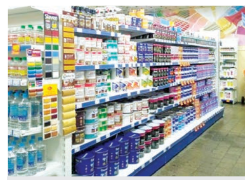
Торговый объект «ОМА» Пружанского райпо.

2. Реклама – это инструмент, который и по сей день остается двигателем торговли. Главное, правильно использовать ее элементы: