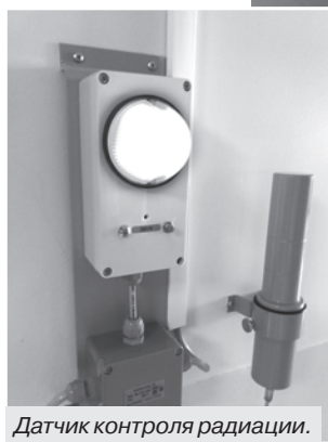
Датчик контроля радиации.

– Как клетки щитовидной железы, так и клетки высокодифференцированного рака активно накапливают йод, – поясняет заведующий отделением. – Если мы даем йод с изотопом, то можем увидеть клетки щитовидки и рака, метастазы, если остались, с помощью диагностического оборудования. А дальше решаем, как лечить. 1–2 курса терапии йодом – и клетки убираются полностью. При метастазах даем большую дозу, проводим несколько