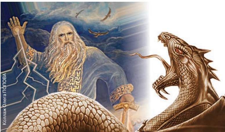
Коллаж Олега ПОПОВА