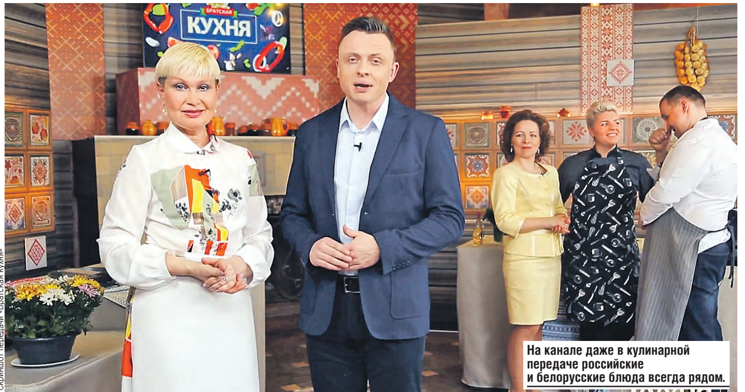
На канале даже в кулинарной передаче российские и белорусские блюда всегда рядом.