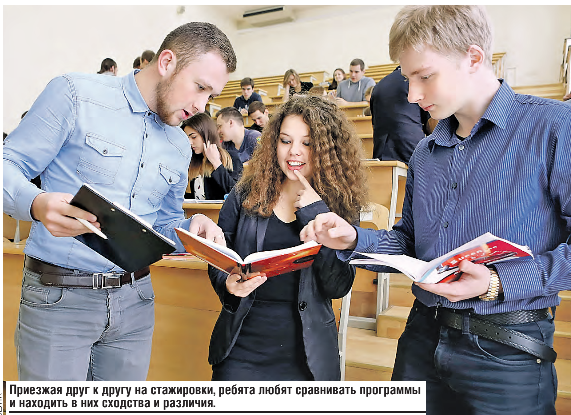
Приезжая друг к другу на стажировки, ребята любят сравнивать программы и находить в них сходства и различия.

– К нам приезжают для работы в архивах, для научных консультаций, участвуют в учебном процессе, слушают