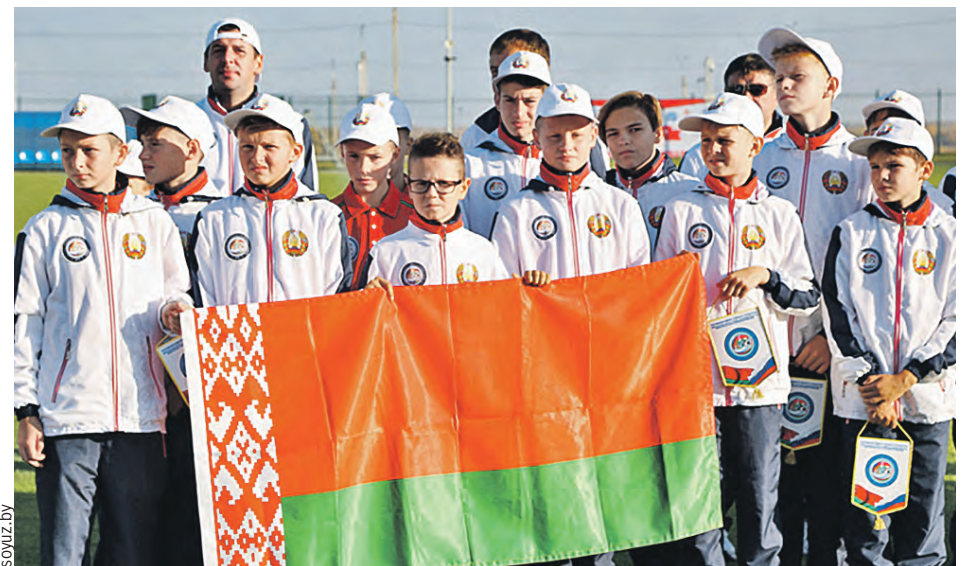
Дружная команда из Минска выиграла в Волгограде свой первый, но наверняка не последний международный турнир.