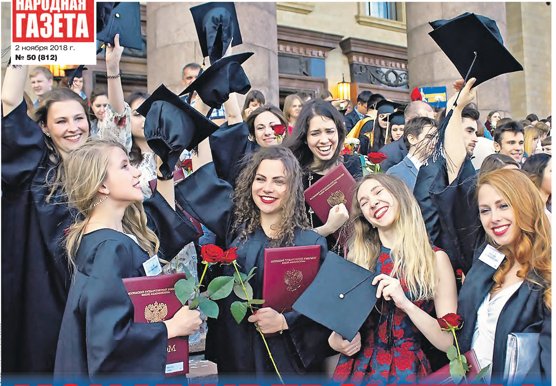
Оф. сайт МГУ им. Ломоносова