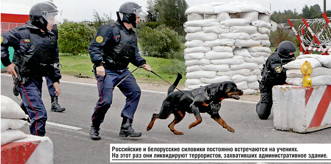
Российские и белорусские силовики постоянно встречаются на учениях. На этот раз они ликвидируют террористов, захвативших административное здание.