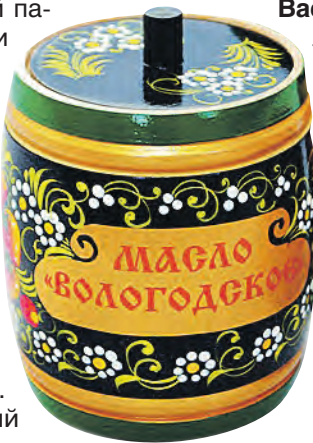
ПК «Вологодский молочный комбинат»

«Знаю точно, где мой адресат. В доме, где резной палисад» – эти строки многие и сегодня подхватят с легкостью. Хотите узнать, какой дом имели в виду «Песняры»? Есть несколько версий, но большинство сходится на том, что та самая постройка – на Благовещенской улице. Тут даже памятный знак установили.