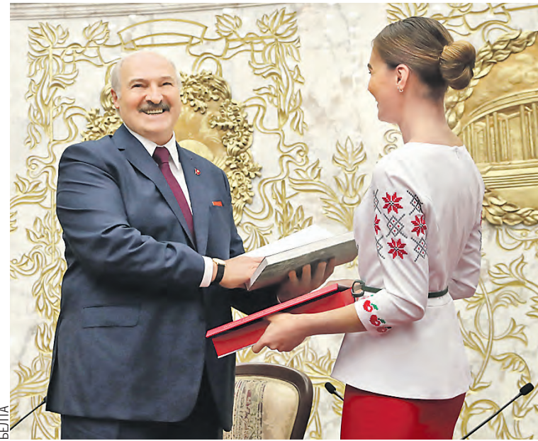
Главе государства вручили книгу «В ритме летящих лет...» об истории молодежного движения.

дать ни ученые, ни политики. Но комсомольцы оставили нам примеры беззаветной преданности Отечеству, искренней веры в идеалы честности и справедливости, достойные подражания.