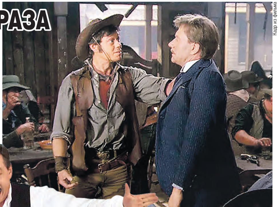
Каждую свою роль Караченцов не играл – проживал. Оттого и герои его были не шаблонными, а самыми что ни на есть настоящими.

Один за другим в репертуаре «Ленкома» появлялись, как сейчас