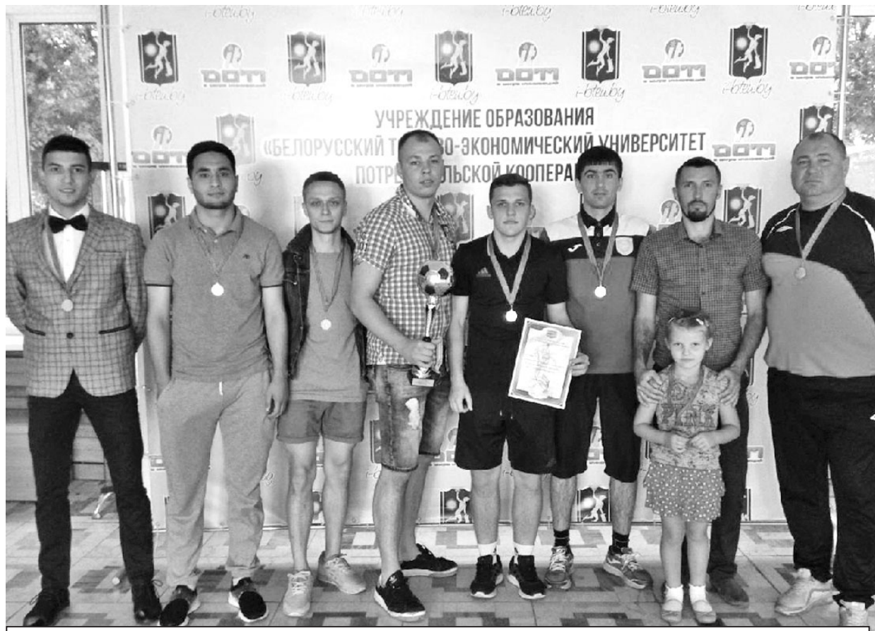
Члены команды БТЭУ по мини-футболу, ставшей победительницей в чемпионате Гомеля среди команд высшей лиги.

Учеба в университете — это не только знания по профессии, диплом о высшем образовании и море новых знакомств и впечатлений, но и отличная возможность проявить себя в различных сферах, в том числе и в спорте.