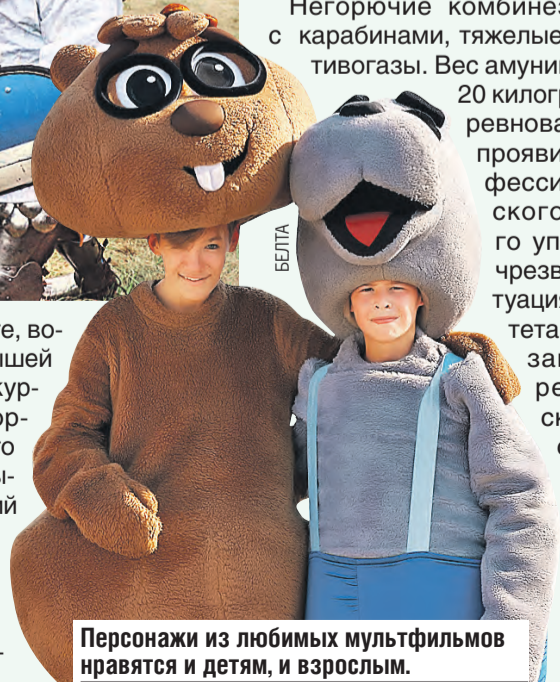
Персонажи из любимых мультфильмов нравятся и детям, и взрослым.

Негорючие комбинезоны, пояса с карабинами, тяжелые сапоги, противогазы. Вес амуниции – больше 20 килограммов! В соревнованиях смогут проявить себя профессионалы Минского городского управления по чрезвычайным ситуациям, Университета гражданской защиты МЧС, республиканского отряда специального назначения «Зубр». На соревнованиях определят лучших из лучших.