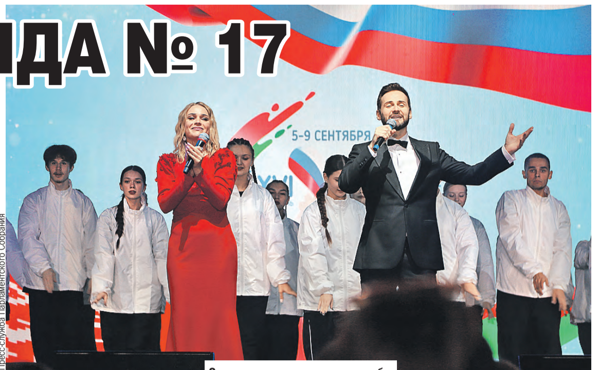
Здесь приезжают не только себя показать, но и опыта набраться.