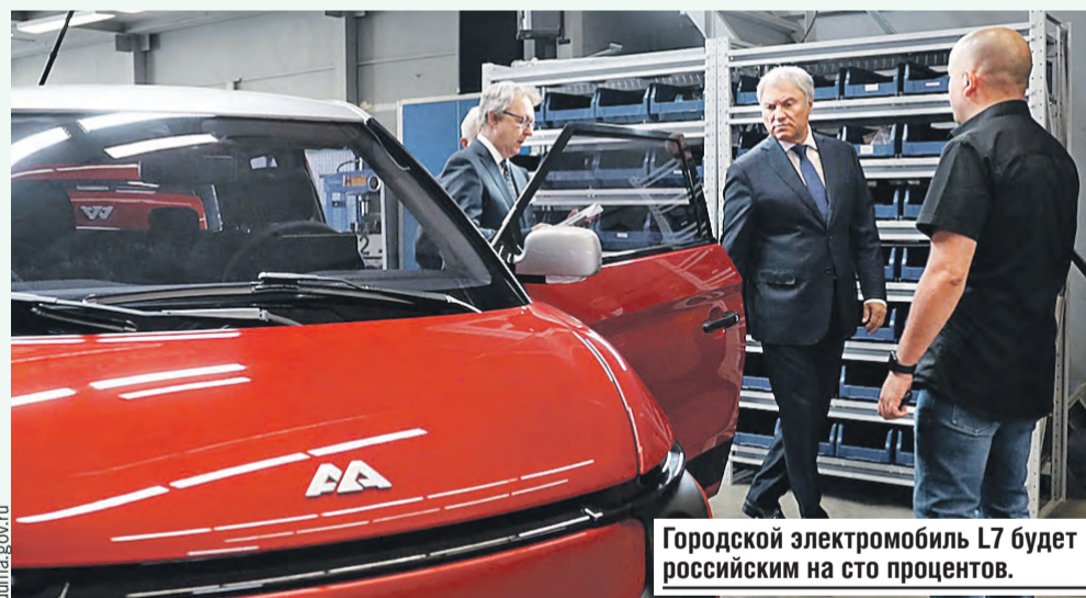
Городской электромобиль L7 будет российским на сто процентов.

биля и подготовку опытного образца. Городской автомобиль – то, чего люди ждут. Очень хорошо, что он полностью из наших, отечественных компонентов. Сейчас локализация автомобилей российских марок достигает только 50 процентов.