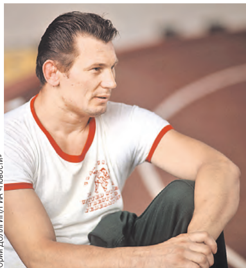
Свое олимпийское золото он завоевал, выступая в разных весовых категориях, – уникальный результат в истории спорта.

■ На 87-м году ушел из жизни великий борец, лучший спортсмен Беларуси XX века Александр Медведь.