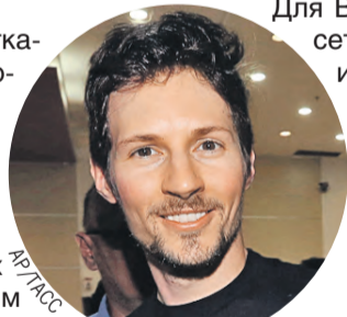
За ордер для «преступника» Макрону прилетит награда из Вашингтона.

Для Вашингтона слежка в соцсетях, их тотальная цензура и подчинение, в том числе с помощью шантажа под видом борьбы с разного рода угрозами, являются традиционными способами политического управления и внешнего влияния. Раньше Дуров заявлял об избыточном внимании ФБР и спецслужб к нему лично и его компании, попытках за-