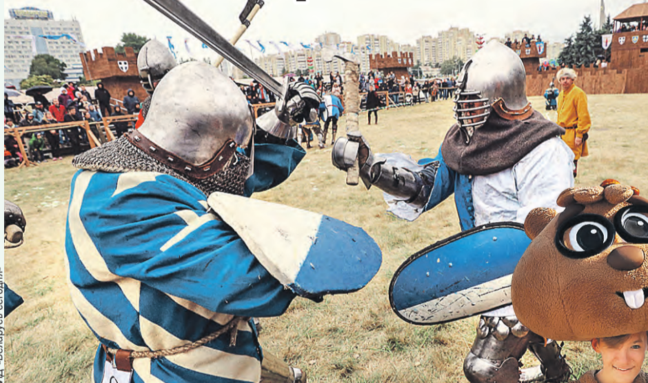
Рыцарские турниры прямо как в Средние века.

Вы попадете в атмосферу средневекового рыцарства, обстановку военных лагерей Первой мировой и Великой Отечественной войн, увидите танцы разных эпох. Возле стилизованных шатров дети и взрослые смогут примерить красочные наряды давно забытой моды. Самые ловкие посоревнуются в стрельбе из лука и арбалета. А после захватывающих и зрелищных битв, конных турниров зрители смогут попробовать необычные блюда белорусской кухни. На ярмарке ремесленников на память можно будет купить глиняную посуду, подковы. И сплести соломенные венки под руководством умелых мастеров.