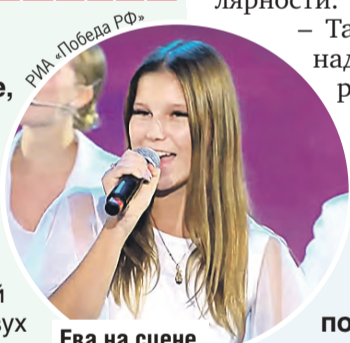
Ева на сцене с пяти лет.

– Кажется, почти с каждым обменялась номерами и контактами. Знаете, тут все на одной волне. Все такие активные, творческие, прям наши люди, я бы сказала.