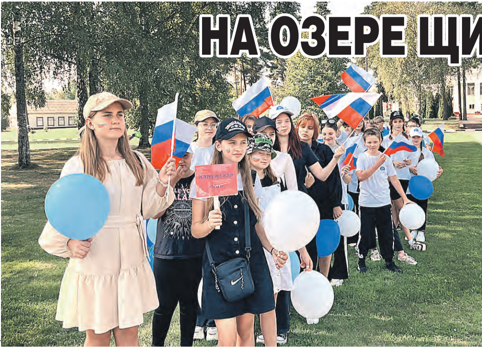
От Калуги до Лепельщины – около 600 километров, но ребята признаются: на белорусской земле чувствуют себя как дома.