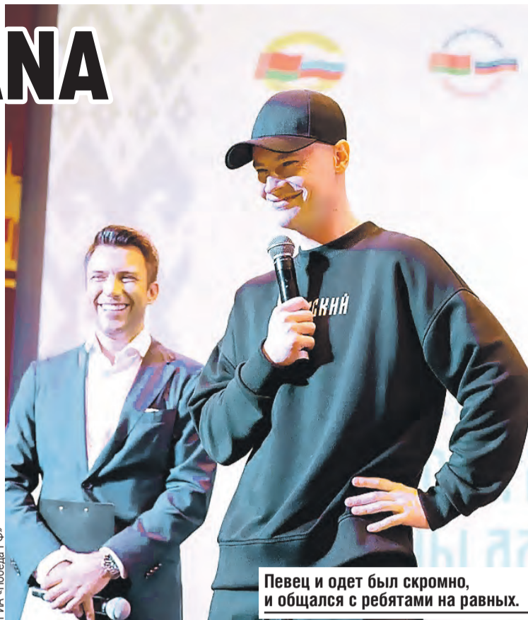
Певец и одет был скромно, и общался с ребятами на равных.

– Честно говоря, очень переполнен эмоциями, и это здорово. Спасибо большое, ребята, это большой сюрприз! Слезы наворачиваются, такой номер придумали. Для меня, как для автора песни, вдвойне приятно, что она живет в устах нового поколения. Это значит, что я делаю все правильно, – признался он.