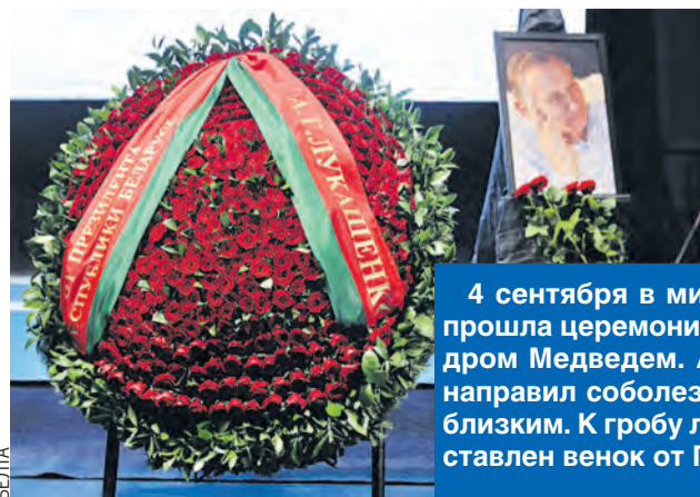
4 сентября в минском Дворце спорта прошла церемония прощания с Александром Медведем. Александр Лукашенко направил соболезнование его родным и близким. К гробу легенды спорта был доставлен венок от Президента Беларуси.

– Мне природа-матушка дала много, но всех побед своих я достиг благодаря труду, – рассказывал он позже. – Любил бороться и не представлял жизнь без борьбы. Майка после тренировок была такой мокрой, словно я в ней под душем стоял, жена дома в прямом смысле выжимала. По три килограмма за тренировку терял, а занимался два раза в день. Такой вот график. И никто не заставлял – сам шел к цели. В этом, наверное, и есть главный секрет любого успеха.