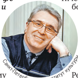
Санкт-Петербургский институт культуры