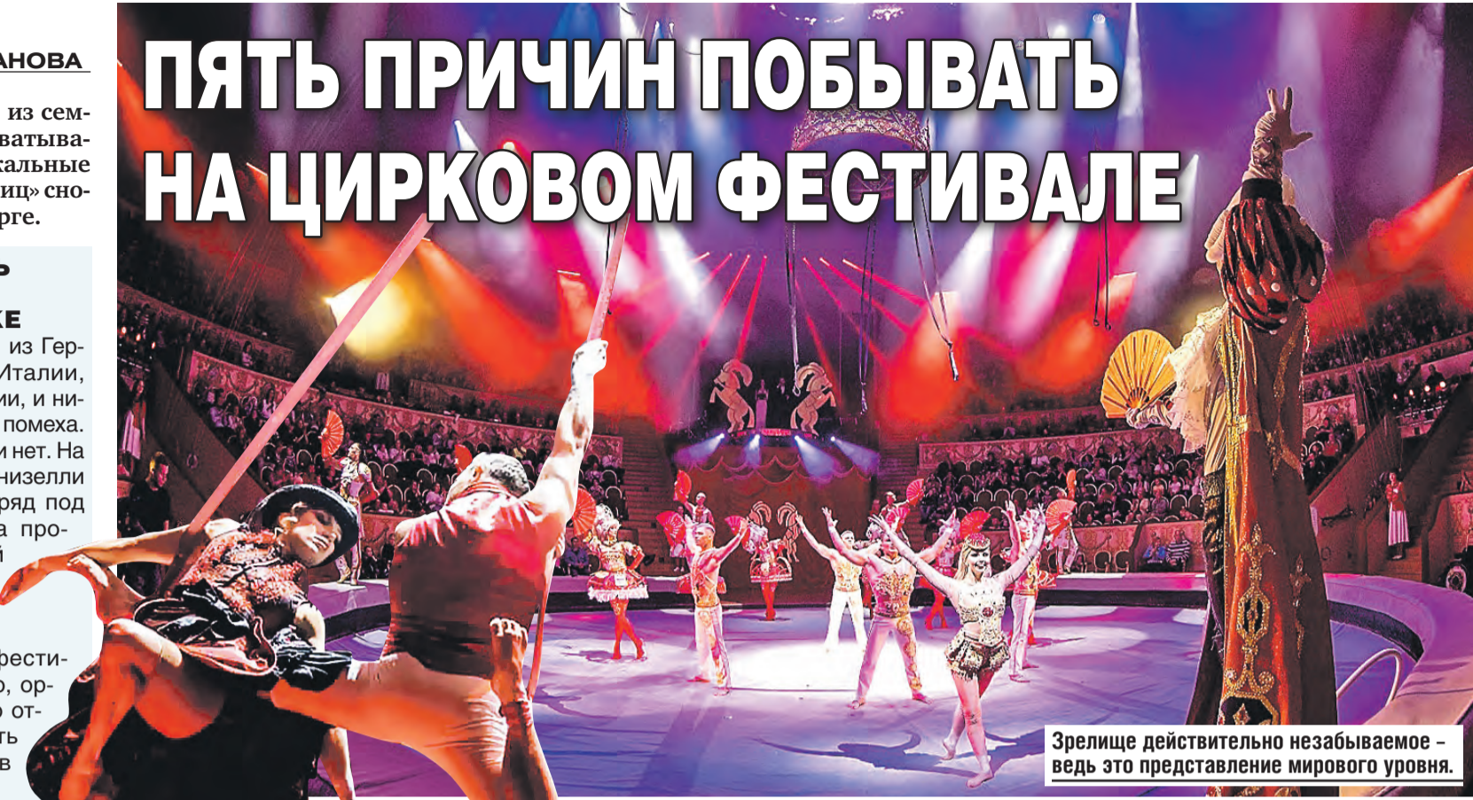
Зрелище действительно незабываемое – ведь это представление мирового уровня.

За время существования фестиваля десятки тысяч россиян посмотрели свыше сорока номеров и трюков мирового уровня. В этом году их ожидают выступления в самых редких цирковых жанрах. В том числе из таких стран, как Вьетнам, Перу, Монголия, Эфиопия и Бразилия и Китая. Вот она, дружба народов в действии.