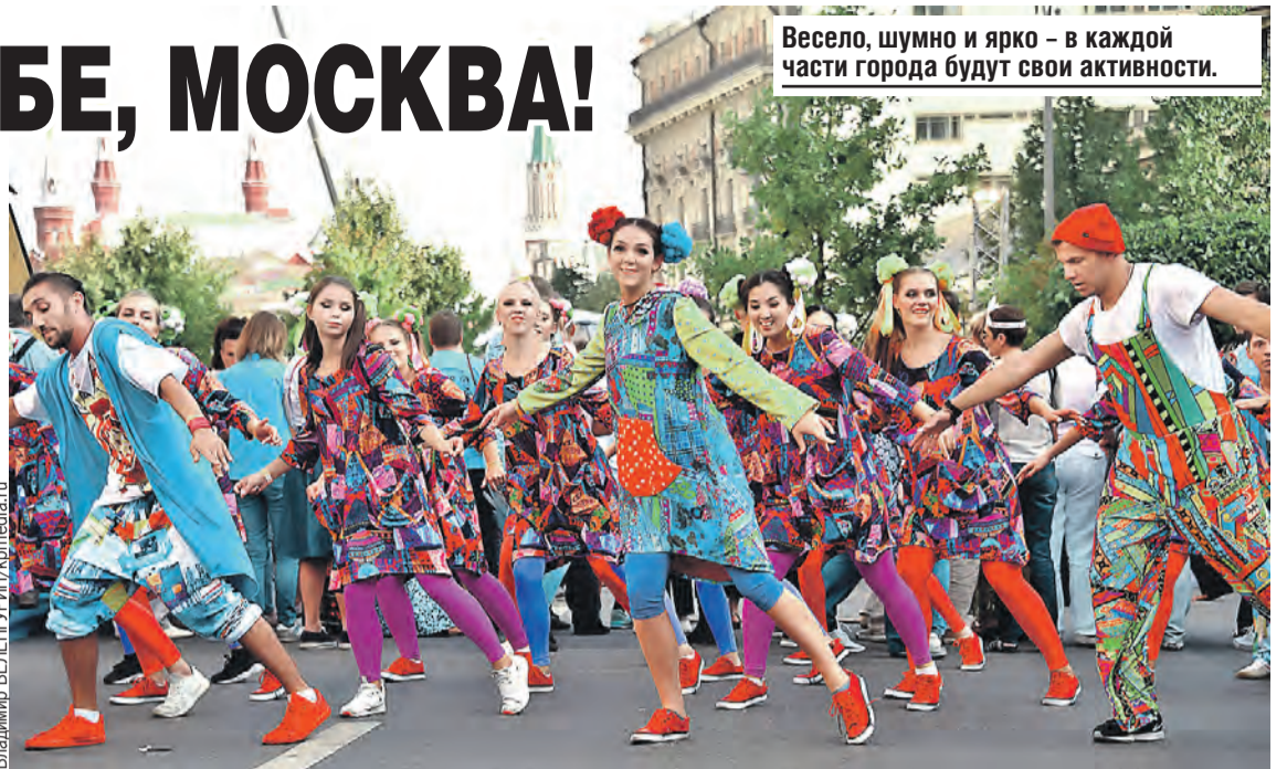
Весело, шумно и ярко – в каждой части города будут свои активности.