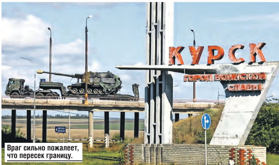
Враг сильно пожалеет, что пересек границу.

4 908 986 Страховая выплата членам семьи в случае гибели военнослужащего (Закон № 306-ФЗ)