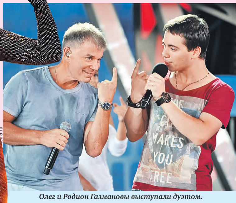
Олег и Родион Газмановы выступали дуэтом.