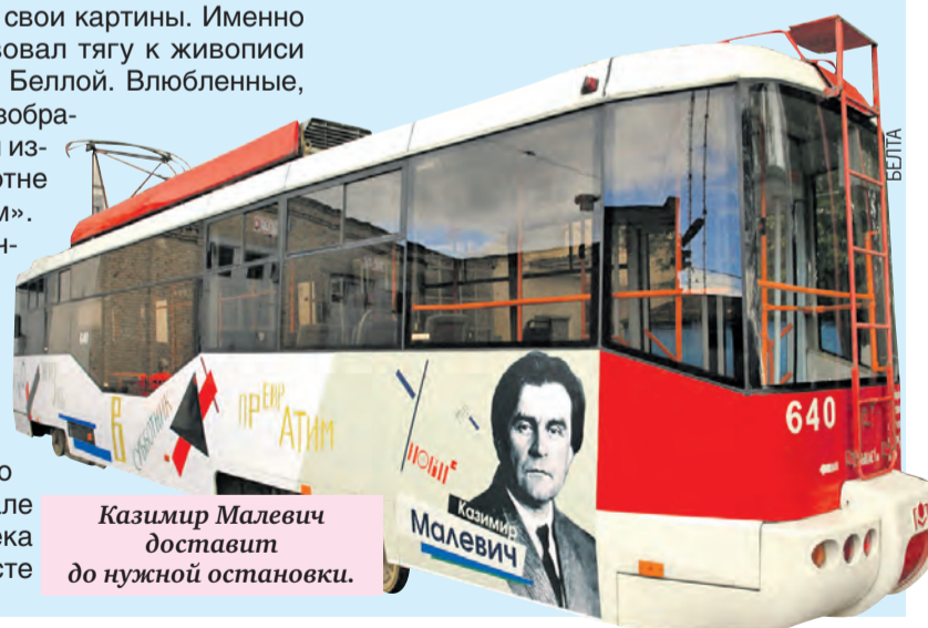
Казимир Малевич доставит до нужной остановки.

с Малевичем и другими мастерами-единомышленниками зародили здесь новый мир. На входе у лестницы – знаменитый фото-портрет Творческого объединения «Утвердителей нового искусства». Рядом на полу размещается мозаика с громким призывом «Клином красным бей белых» – один из наиболее популярных советских плакатов, созданный Эль Лисицким в 1920 году. А в зале, посвященном Казимиру Малевичу, загорается ультрафиолетовое освещение и оживают... стены. На них проецируются рукописи художника и его стихи.