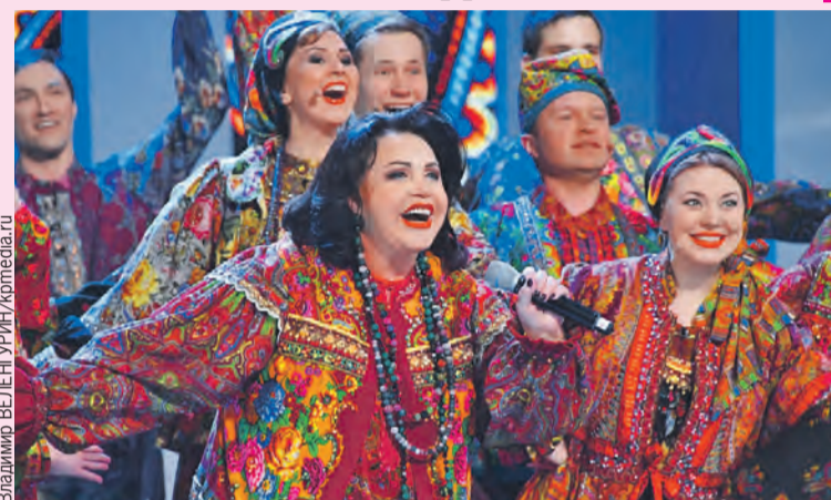
Надежда Бабкина не пропустила практически ни одного «Базара».

❖ На самом первом фестивале выступала харизматичная Надежда Бабкина . В 2001 году на белорусской сцене и во все отметила сольным концертом