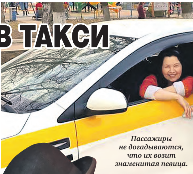
Пассажиры не догадываются, что их возит знаменитая певица.