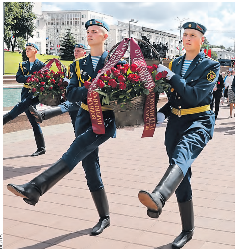
Утро начинается с возложения венков и цветов к мемориалу в честь воинов-освободителей.

Парламентарии посетят Полоцкое кадетское училище. Там сейчас идет реконструкция. Училище хотят превратить в корпус. С 1 сентября 2022 года на его базе планируется начать четырехлетнее обучение ребят из Беларуси и соседних российских регионов. Сто белорусов и сто россиян пойдут в восьмой класс. В программе – военное дело, физкультура и не только. В основном возьмут детей из многодетных и неблагополучных