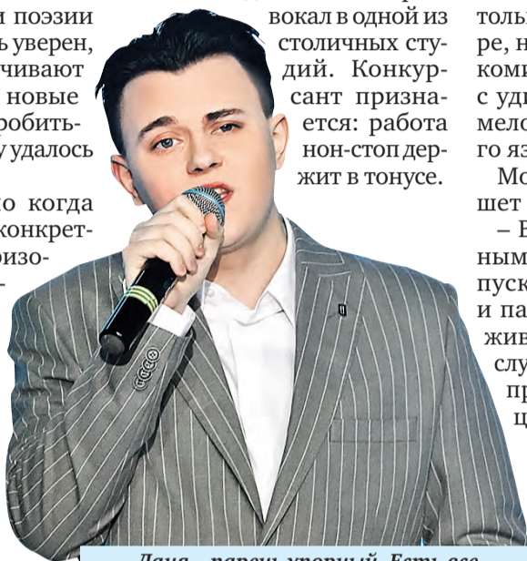
Дания – парень упорный. Есть все шансы победить.

вокал в одной из столичных студий. Конкурсант признается: работа нон-стоп держит в тонусе.