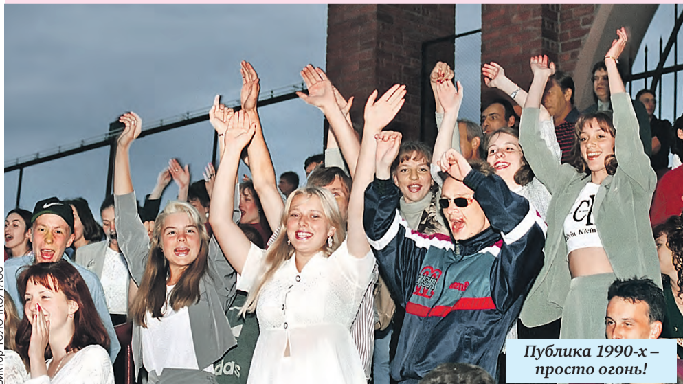
Публика 1990-х – просто огонь!

«И еще... обязательно лампочки – гирлянды везде, на деревьях, столбах, зданиях. Это детское ощущение радости и восторга при виде ламповых гирлянд или гроздьев мерцающих огней фейерверка и в их отблеске улыбающиеся счастливые лица людей не давали мне покоя».