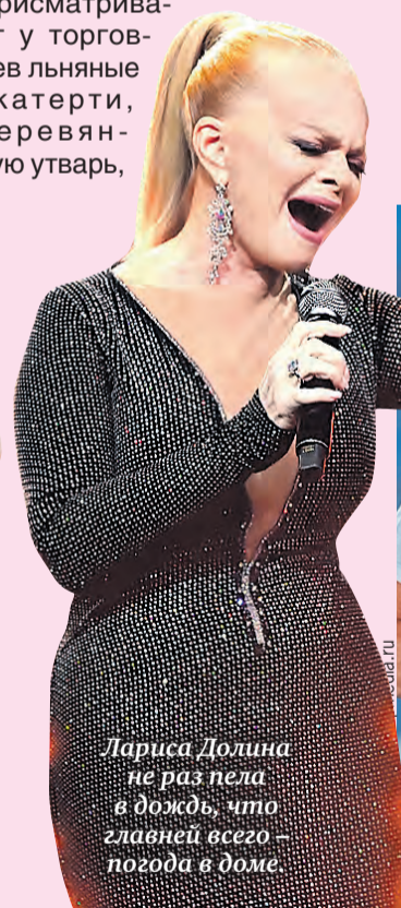
Лариса Долина не раз пела в дождь, что главней всего – погода в доме.