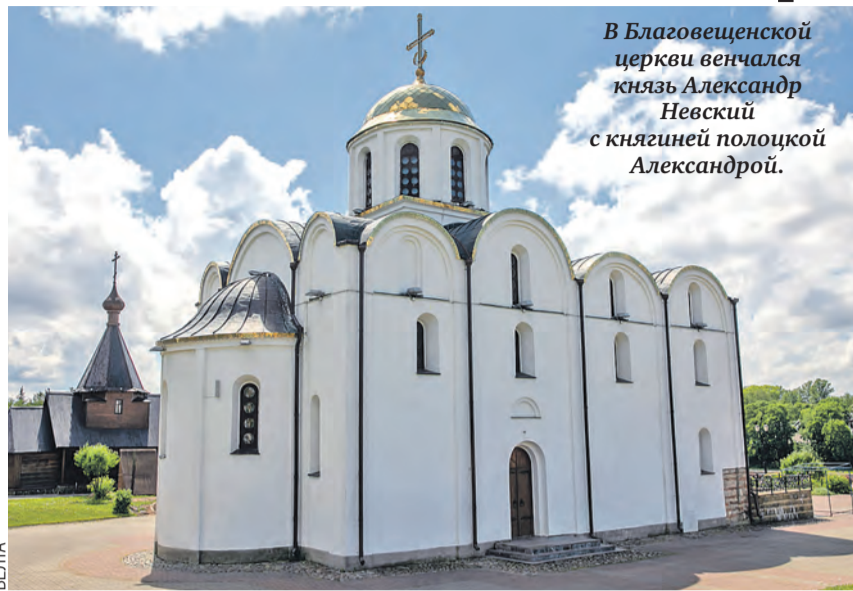
В Благовещенской церкви венчался князь Александр Невский с княгиней Полоцкой Александрой.

Недалеко от центра – один из красивейших храмов города, костел святой Варвары. Если переехать железнодорожный мост за вокзалом, сразу появятся его острые шпили. Костел построен в 1770-х годах, сочетает в себе черты неороманского стиля и неоготики.