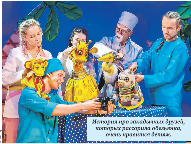
История про закадычных друзей, которых рассорила обезьянка, очень нравится детям.

Еще один спектакль – «Куклы Тима Талера, или Проданный смех». Зрители узнают, сколько стоит счастье и почему веселье бывает грустным.