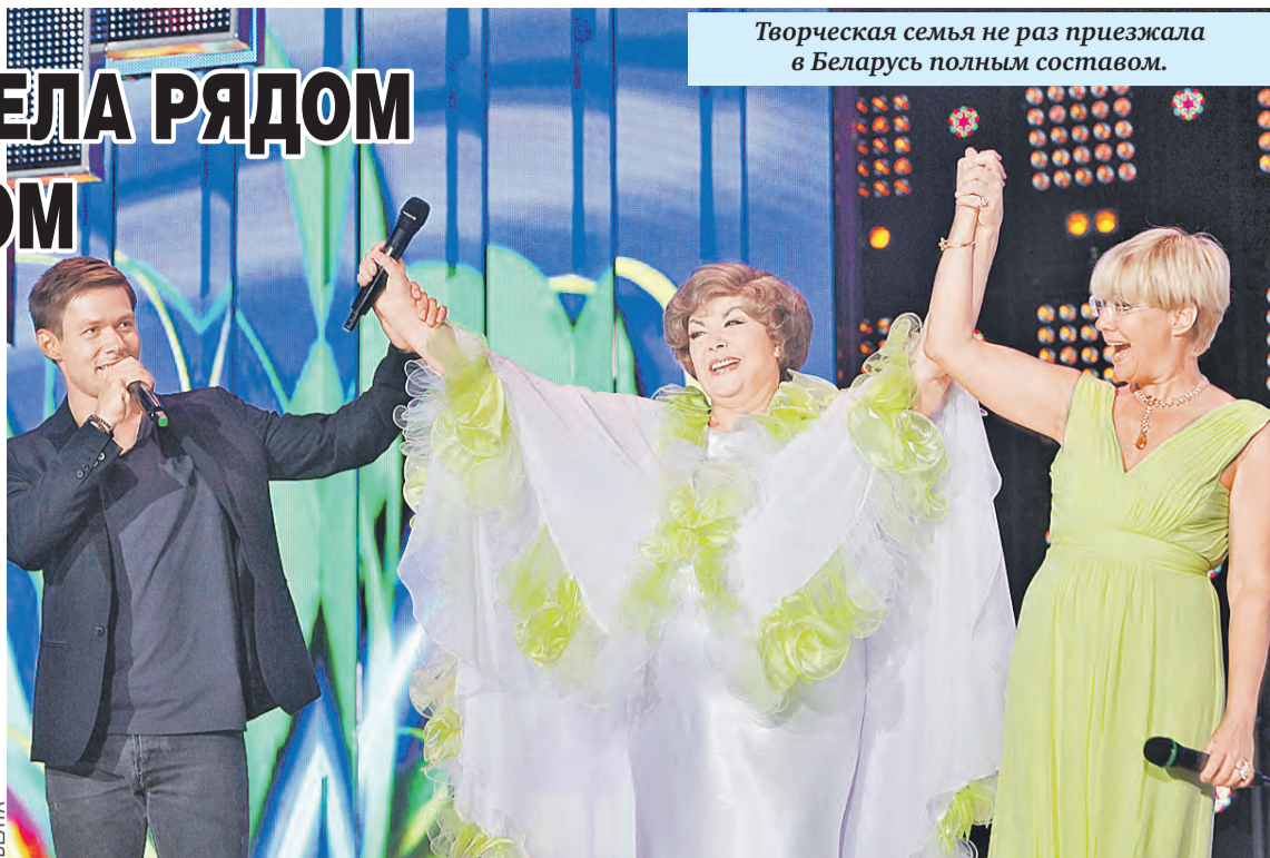
Творческая семья не раз приезжала в Беларусь полным составом.

– А публика всегда была замечательной – что тогда, что сейчас. Самое свежее воспоминание – накануне пандемии, в 2019 году, я вела концерт на одной из центральных площадей Минска. Кажется, это был день Союзного государства. Площадь была заполнена народом... много тысяч. И вдруг