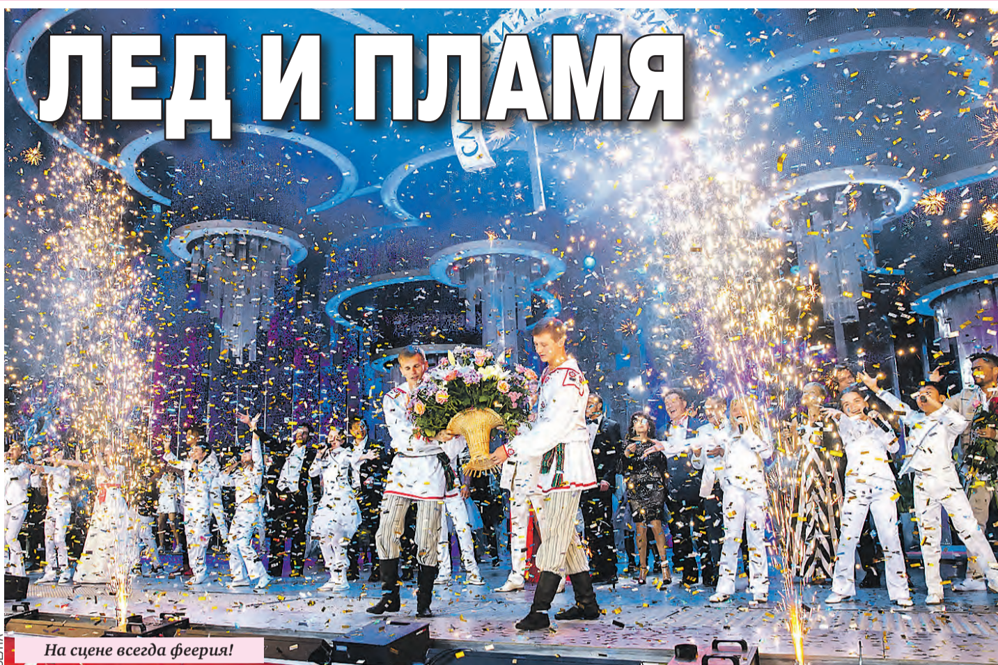
На сцене всегда феерия!