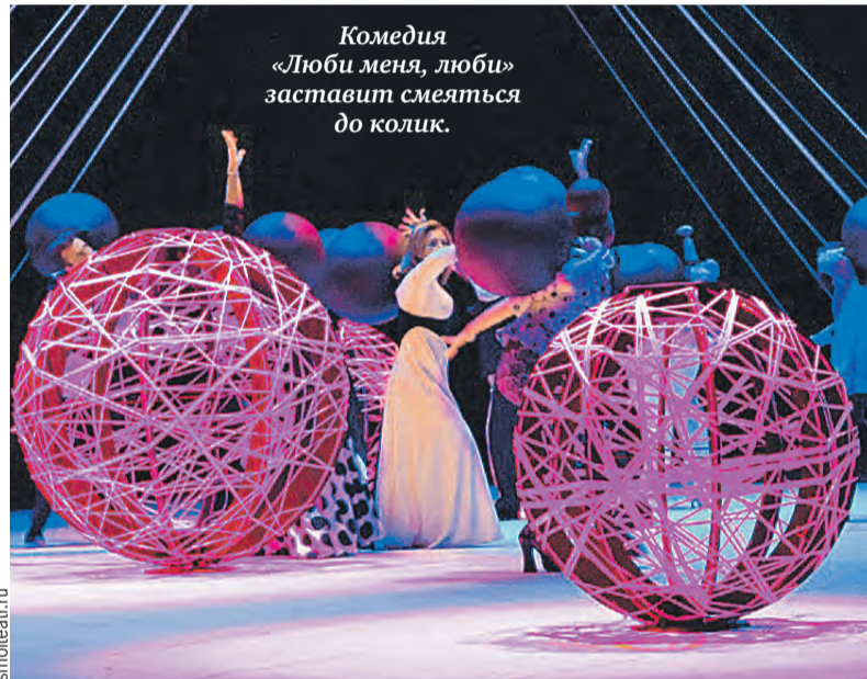
Комедия «Люби меня, люби» заставит смеяться до колик.

«В детстве, как и все люди из прошлого века, я писал короткие слова на заборах, уже тогда понимая, что краткость – сестра таланта. Но гонорары за это не платили, а всыпать могли по первое число. Поэтому постепенно переключился на газеты и журналы. Кабинета никогда не было. Сяду, бывало, в уголочке и пишу себе, думая о том, как все же приятно иметь в этой жизни свой угол», – вспоминает писатель.