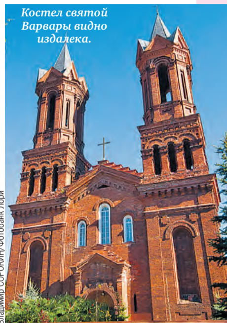
Костел святой Варвары видно издали.

Летом Витебск превращается в культурную столицу Беларуси. В 20-е годы прошлого века он был центром авангардного искусства. «Союзное вече» поможет составить самые интересные маршруты.