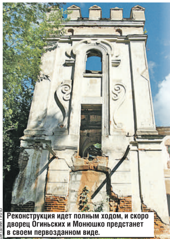
Реконструкция идет полным ходом, и скоро дворец Огинских и Моношко предстанет в своем первоначальном виде.