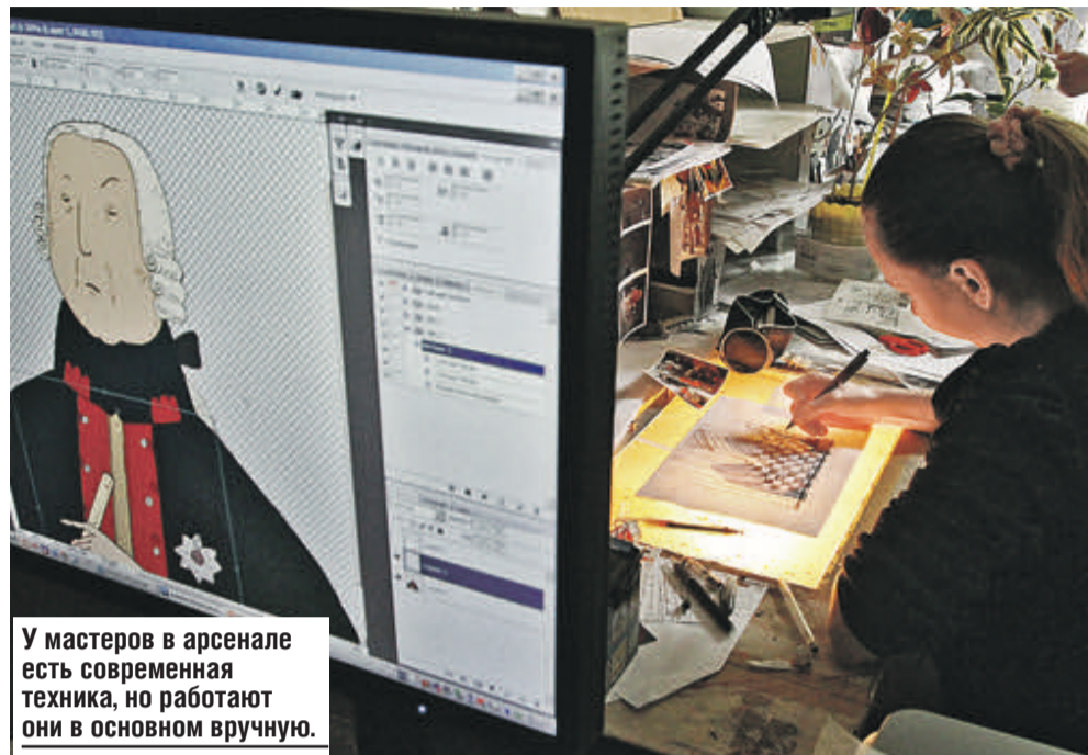
У мастеров в арсенале есть современная техника, но работают они в основном вручную.

Герой народной сказки «Піліпка сынок» стал мультперсонажем.