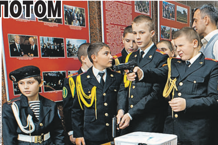
В Союзном государстве большое внимание уделяют патриотическому воспитанию, а теперь для этого еще и разработают специальные туристические маршруты.