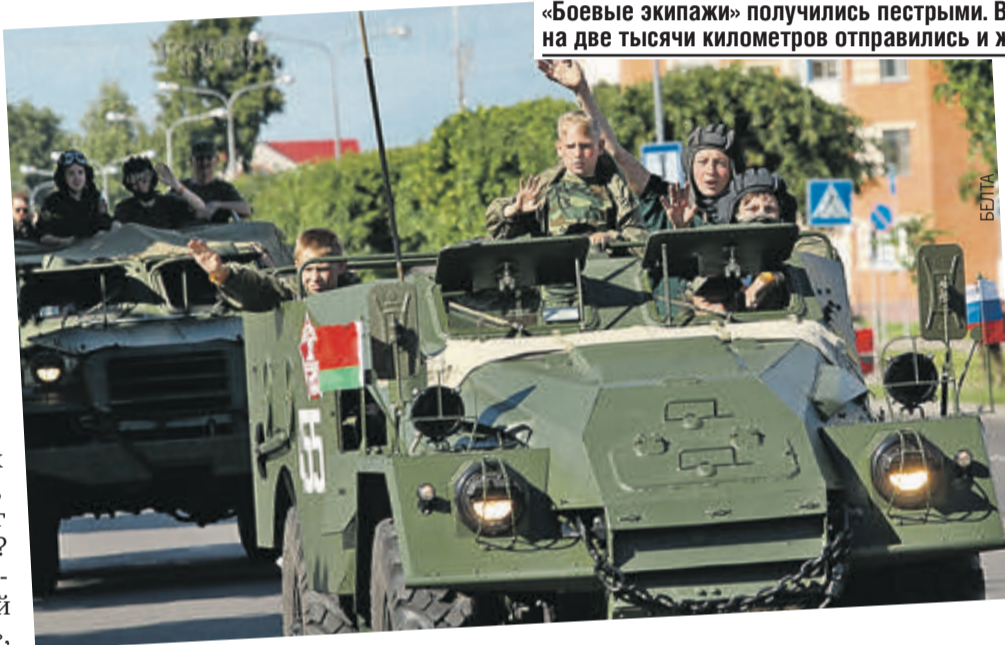
«Боевые экипажи» получились пестрыми. В путешествие на две тысячи километров отправились и женщины, и даже дети.