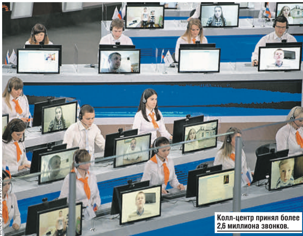
Колл-центр принял более 2,6 миллиона звонков.