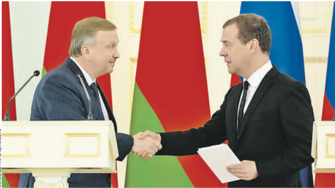
Глава Правительства Беларуси Андрей Кобяков (слева) и Премьер-министр России Дмитрий Медведев вместе нашли решение острых вопросов.

кон России вступил в жесткое противоречие со всей концепцией равных прав граждан Союзного государства. Депутаты Госдумы, часть из которых являются членами Парламентского Собрания, не могли остаться в стороне. Они приняли обращение к Главе российского Правительства с просьбой исправить эту несправедливость ( подробнее – на сайте souzveche.ru ).