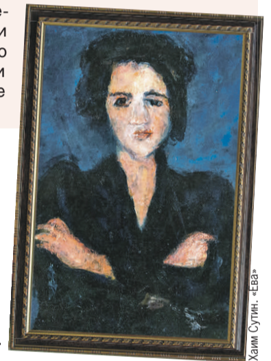
Хаим Сутин. «Ева»

Картины Хаима Сутина «Ева» эксперты относят к самому яркому периоду его творчества.