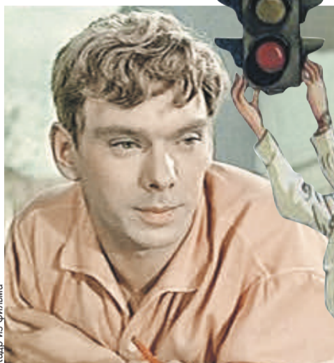
Самый известный милиционер, украсивший детскую книжку, как две капли воды похож на молодого Баталова.

– В новом времени я себя так и не нашел. Играть роли в рекламе или сериалах не стал бы ни за что! Хотя звали не раз, – рассказывал Алексей Владимирович. – Мне важно не угодить в никудышное кино. И, следовательно, оставаться таким, какой я есть, и не изменять вам, а значит, и самому себе.