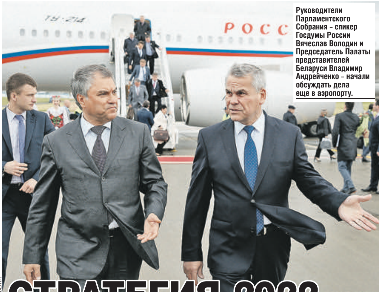
Руководители Парламентского Собрания – спикер Госдумы России Вячеслав Володин и Председатель Палаты представителей Беларуси Владимир Андрейченко – начали обсуждать дела еще в аэропорту.