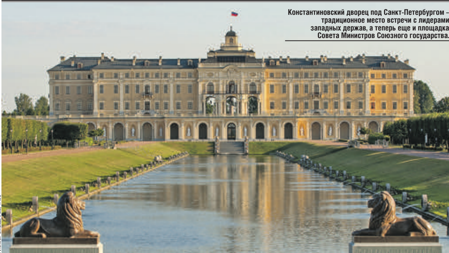
Константиновский дворец под Санкт-Петербургом – традиционное место встречи с лидерами западных держав, а теперь еще и площадка Совета Министров Союзного государства.