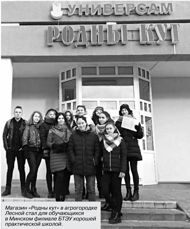
Магазин «Родны кут» в агрогородке Лесной стал для обучающихся в Минском филиале БТЭУ хорошей практической школой.

Важным моментом в обеспечении эффективной деятельности таких объектов Минского районного потребительского общества является максимальное использование возможностей торговых систем для автоматизации розничной торговли. Так, препода-