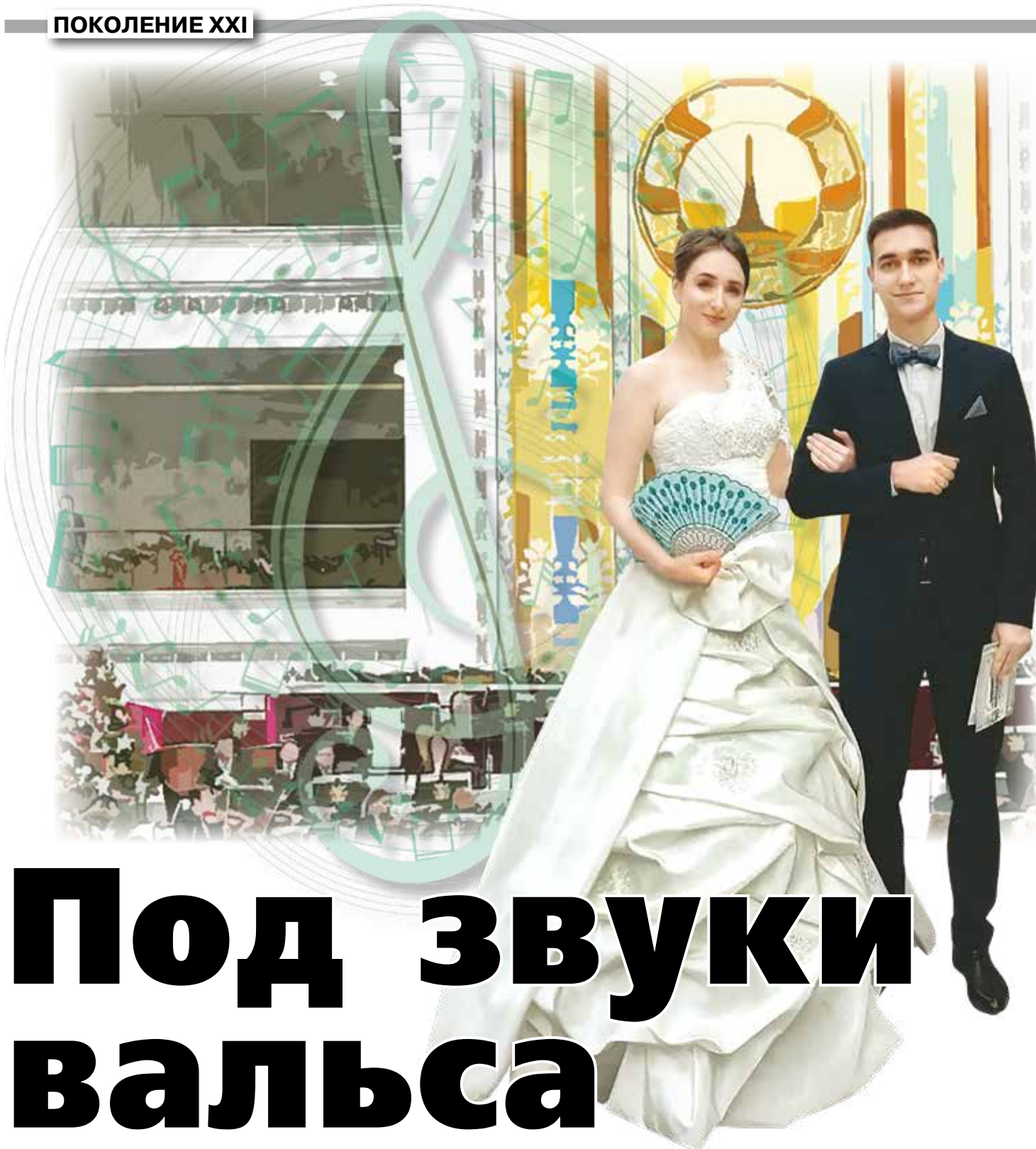
Коллаж Татьяна ГОРБАЧ На снимке: студенты БТЭУ на первом республиканском новогоднем балу молодежи.