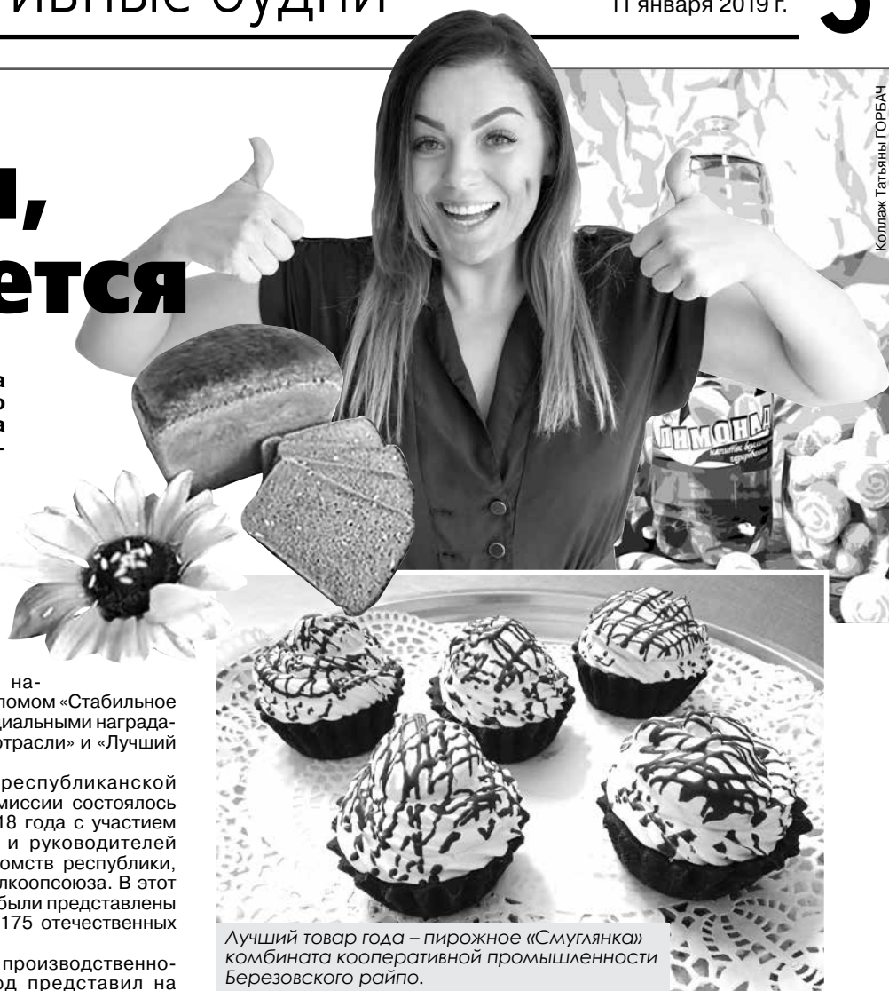
Лучший товар года – пирожное «Смуглянка» комбината кооперативной промышленности Березовского райпо.