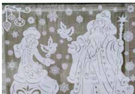
Сказочные персонажи в исполнении продавцов появились в новогодние праздники на витринных окнах магазина № 25 «Товары для дома» в деревне Большевик.

Что касается самого магазина, то он действительно как игрушка. Новогодняя тематика запечатлена даже на приличных размерах семи витринных окнах, где благодаря мастерству продавцов словно ожили герои сказочных сюжетов. Витрины магазина покупателей встречают Дед Мороз со Снегурочкой, а помогают им в этом лесные обитатели, снеговик, пингвины, которых искусно связали из ниток продавцы. Получилось просто здорово! Ну и, само собой разумеется, в праздничной композиции нашлось место нарядной елочке. По всему торго-