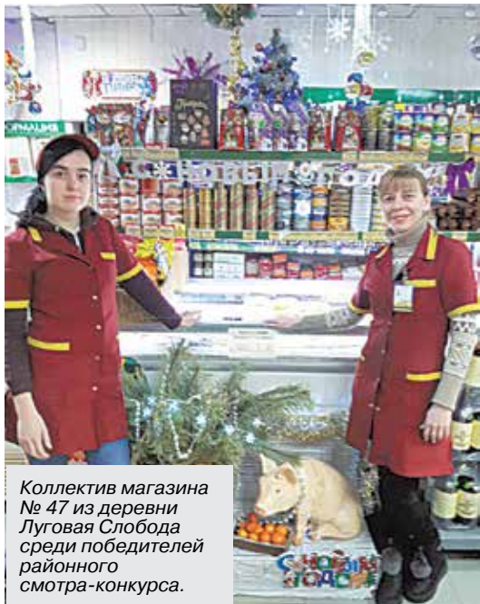
Коллектив магазина № 47 из деревни Луговая Слобода среди победителей районного смотра-конкурса.