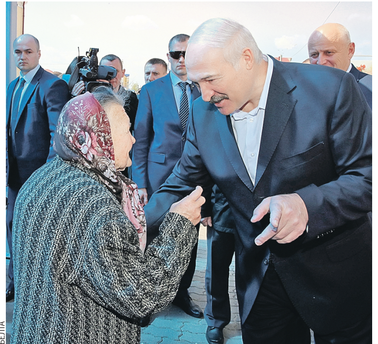
Редкая поездка Президента в регионы обходится без общения. В Житковичах Александр Лукашенко подошел к людям, которые ожидали транспорт на автобусной остановке.

– Председатели райисполкомов, садитесь вместе с прокурорами и руководителями РОВД, принимайте меры. Не рассказывайте о том, что у вас не хватает полномочий. Очень жесткие принимайте меры. Эти «несуны» мало того, что воруют, они воздействуют негативно на других людей, которые этого не делают. А по пьяницам делайте что хотите, но милиция и прокурор должны навести порядок. Нет другого пути, и руководители пожестче должны подходить к этому.