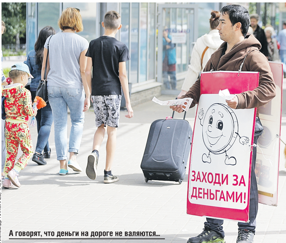
А говорят, что деньги на дороге не валяются...