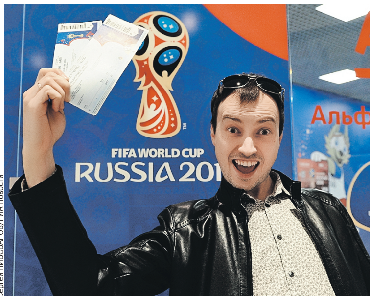
Фанаты, доставшие билеты на игры сборной России, на седьмом небе от счастья.

Друзья правы. Перекупщики заламывают в 15–20 раз дороже номинала. До нескольких сотен тысяч российских рублей. Но пролететь можно элементарно. Даже если билет окажется неподдельным, на стадион все равно не пустят. Потому что данные, указанные в билете, будут отличаться от тех, что в паспорте. И прощай, футбол.