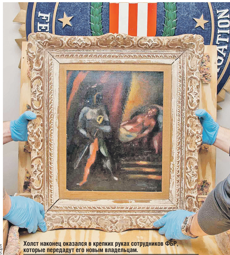
Холст наконец оказался в крепких руках сотрудников ФБР, которые передадут его новым владельцам.