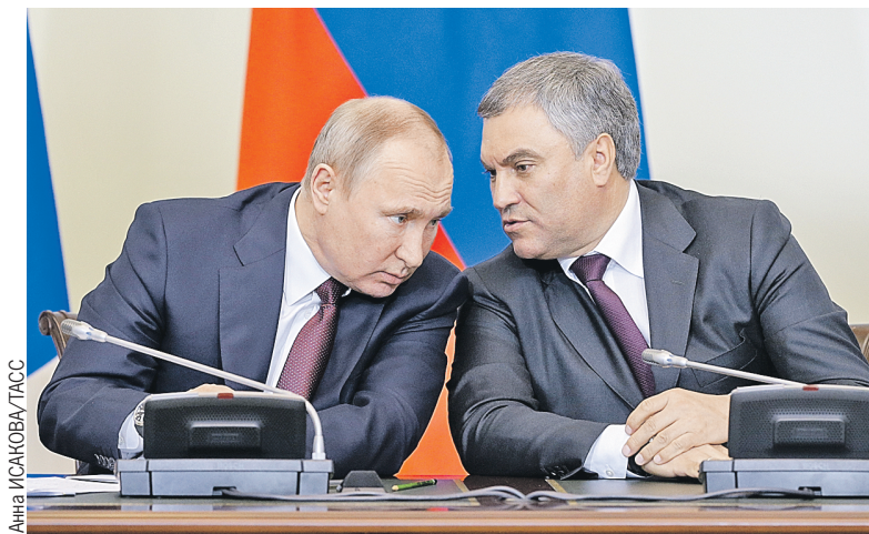
Владимир Путин и Вячеслав Володин считают, что в диалоге с населением рождаются правильные решения.

Активнее проявлять инициативу региональных зако-