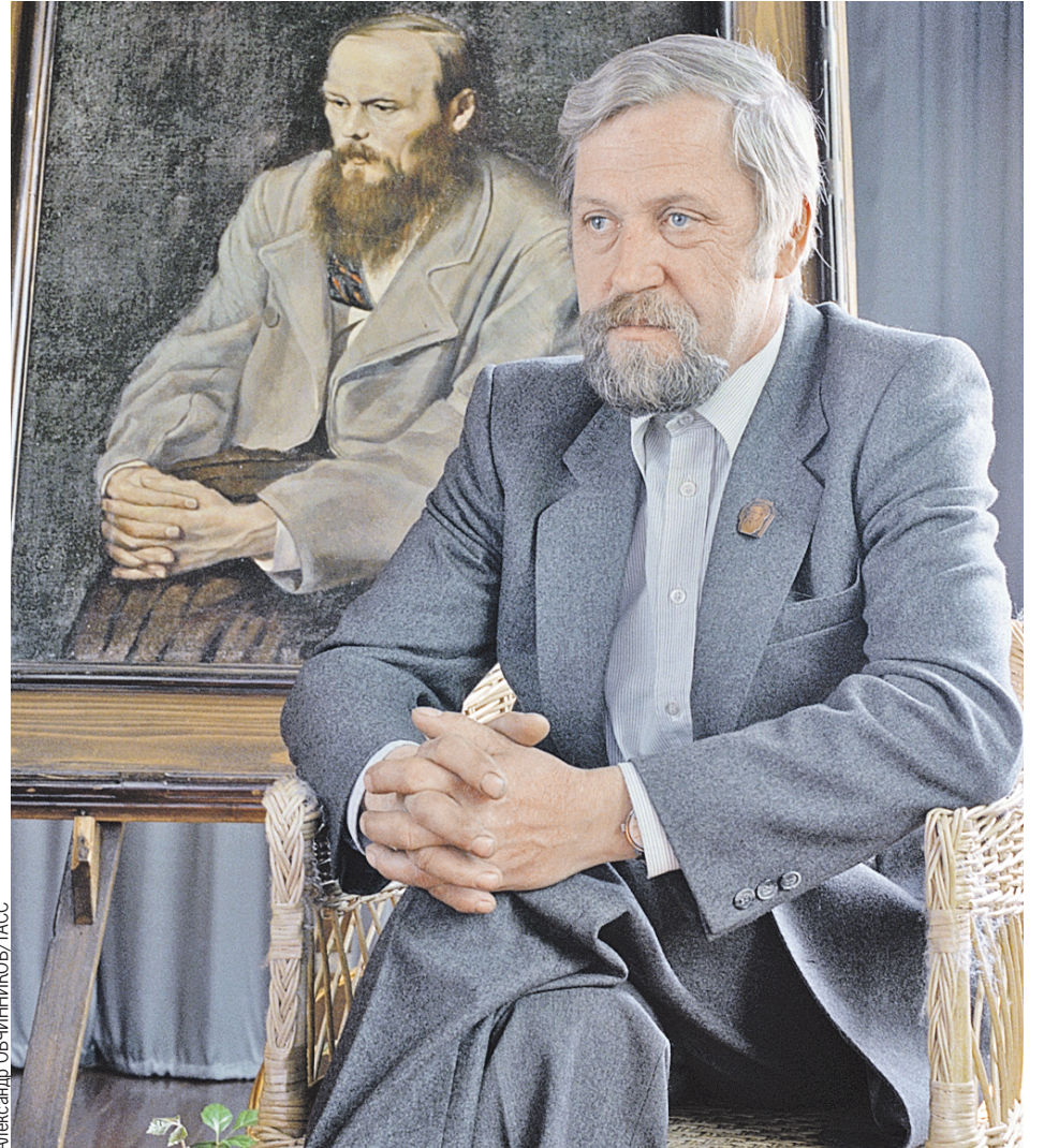
Потомок автора «Преступления и наказания» очень похож на знаменитого прадеда. Книг не пишет, зато хранит в памяти массу интересных историй.