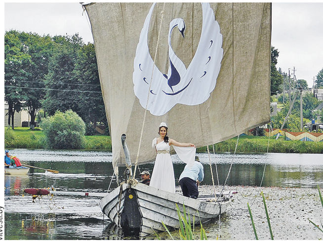
На ладьях, которые можно увидеть на празднике, когда-то ходили «из варяг в греки».

Здесь потрясающая природа. Много лесных озер с ключевой водой и теплых рыбных рек. Летом и осенью в местных лесах – изобилие грибов и ягод. Не заскучают и те, кто тихой охоте предпочитает настоящую. Пернатых, рогатых и водоплавающих столько, что успевай ловить-стрелять.