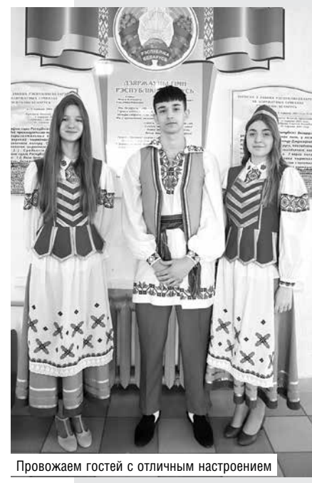
Провожаем гостей с отличным настроением