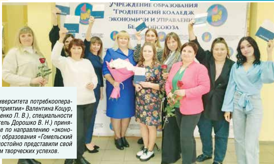
Участники II Республиканского молодежного фестиваля стартап-проектов громко заявили о себе, обрели новых друзей, получили направление для развития своих идей от членов жюри