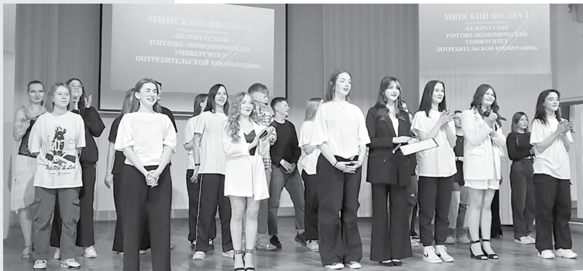
Выступление учащихся Минского филиала БТЭУ ПК впечатлило зрителей и жюри