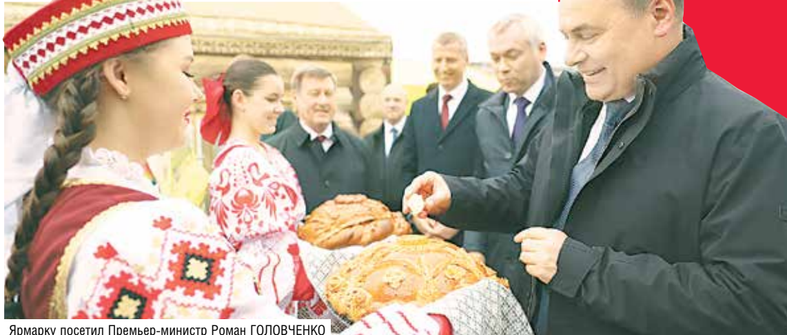
Ярмарку посетил Премьер-министр Роман ГОЛОВЧЕНКО

Новосибирские предприятия поставляют для белорусского рынка турбогенераторы, резисторы, запасные части, электронно-оптические преобразователи, графитированные электроды и другие товары.