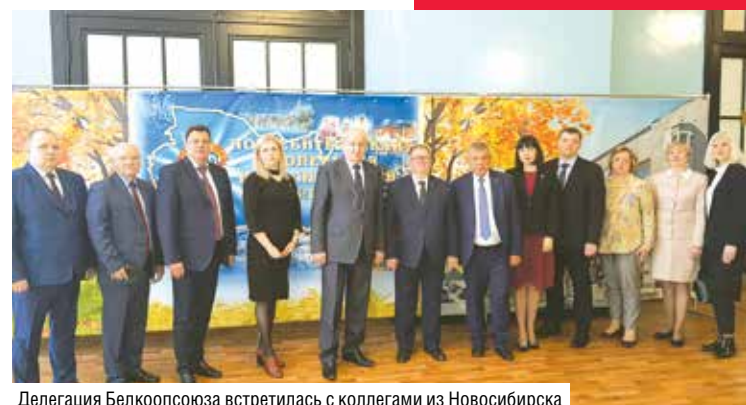
Делегация Белкоопсоюза встретилась с коллегами из Новосибирска

— У нас предусмотрена большая программа по обновлению общественного транспорта, которая стартовала два года назад. Только за последние 2,5 года Новосибирск получил больше 200 единиц автобусов, трамваев, троллейбусов. Да, с одной стороны, рынок очень конкурентный, но уже в этих поставках присутствуют автобусы, троллейбусы совместного с белорусами производства. В теме трамваев есть безусловное преимущество — это совместное предприятие «БКМ-Сибирь». Мы договорились, что в этом году коллеги выйдут на про-