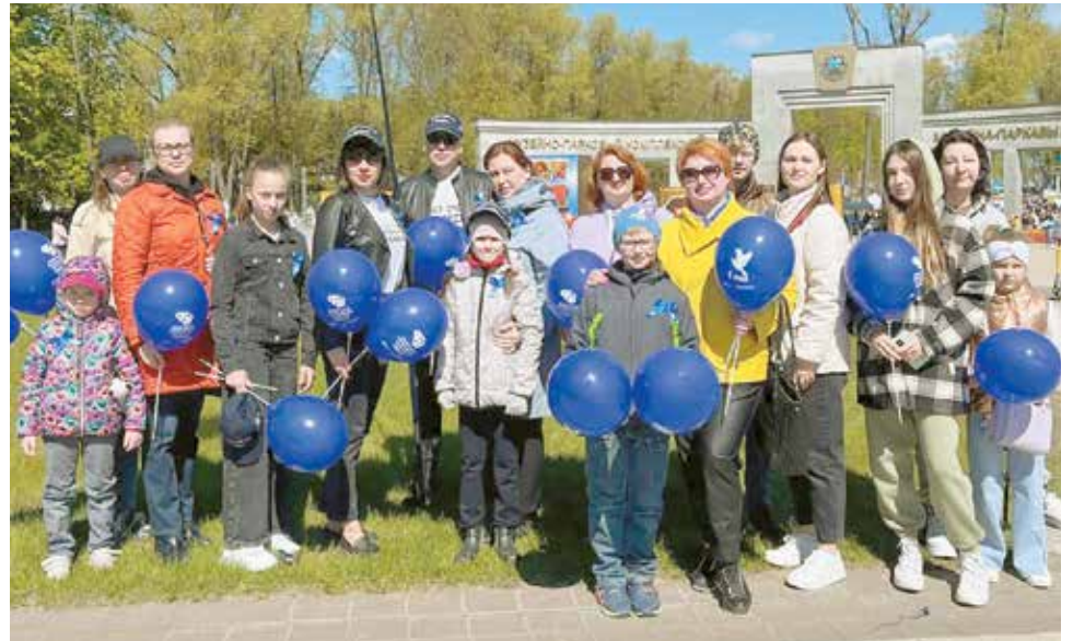
Коллаж Татьяна ГОРБАЧ

Праздник труда по всей республике традиционно отмечали маевками. Жители Беларуси вместе с семьями собрались в местах отдыха, чтобы весело и интересно провести время, насладиться хорошей погодой. Во всех регионах к первомайским акциям присоединились и активисты организаций потребкооперации. К слову, многие кооператоры встретили этот день на своих рабочих местах, чтобы создать праздничное настроение всем белорусам.