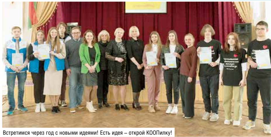
Встретимся через год с новыми идеями! Есть идея – открой КООПилку!

рапынак са смакам» лежит идея об установлении автоматов по продаже здоровых перекусов и горячих напитков в Минском филиале УО «Белорусский торгово-экономический университет потребиооперации», чтобы обеспечить учащихся и педагогический состав быстрыми, удобными и полезными перекусами и горячими напитками. Стартап команды УО «Барановичский государственный колледж легкой промышленности имени В. Е. Чернышева» выиграл в номинации «Образовательная инициатива». Проект УО «Гомельский торгово-экономический колледж» Белкоопсоюза под названием «Разработка и сопровождение сайта «Гомельскооптторресурсы» отмечен за практическую идею для потребиооперации.