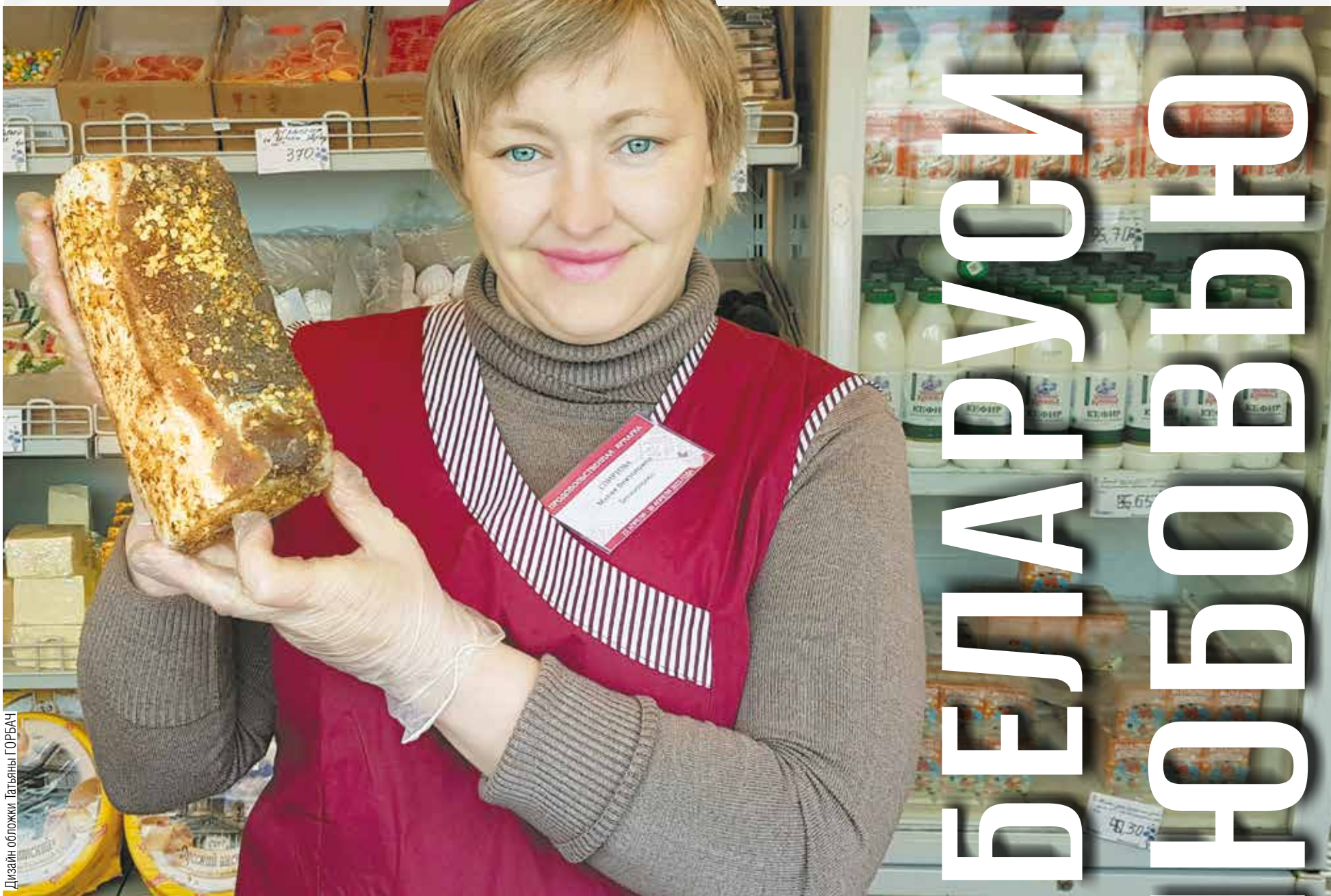
Дизайн обложки Татьяна ГОРБАЧ

БОЛЕЕ 63 МИЛЛИОНОВ РОССИЙСКИХ РУБЛЕЙ СОСТАВИЛ ОБОРОТ ЯРМАРКИ БЕЛОРУССКИХ ТОВАРОВ В НОВОСИБИРСКЕ. ОНА ПРОШЛА С 22 ПО 30 АПРЕЛЯ. СВОЮ ПРОДУКЦИЮ ПРЕДСТАВИЛИ ОРГАНИЗАЦИИ БЕЛКООПСОЮЗА. ЧЕМ УДИВЛЯЛИ БЕЛОРУССКИЕ ПРОИЗВОДИТЕЛИ, ЧИТАЙТЕ В НАШЕМ МАТЕРИАЛЕ.