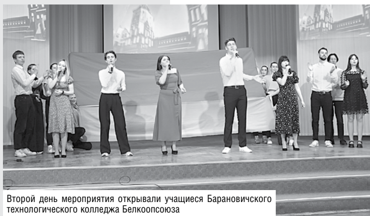
Второй день мероприятия открывали учащиеся Барановичского технологического колледжа Белкоопсоюза