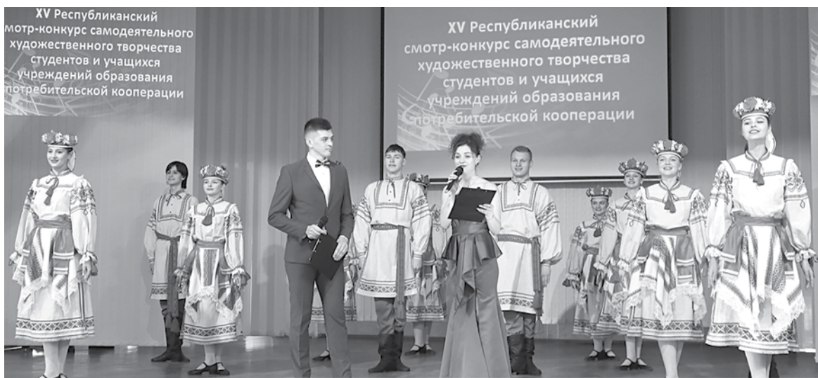
Церемония открытия смотра-конкурса