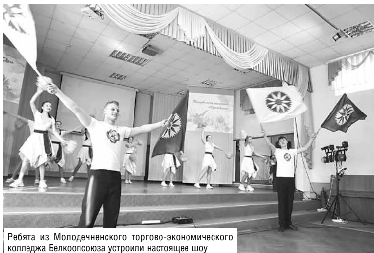
Ребята из Молодечненского торгово-экономического колледжа Белкоопсоюза устроили настоящее шоу

жая зал позитивом и хорошим настроением. Нужно отдать должное группе поддержки – у команды принимающей стороны она была самой многочисленной. Как и все предыдущие годы, Молодечненский колледж порадовал болельщиков и экспертов разнообразной программой, подготовленной на самом высоком уровне. Жюри не переставало хвалить ребят за артистизм, всплеск идей и прекрасные вокальные данные: