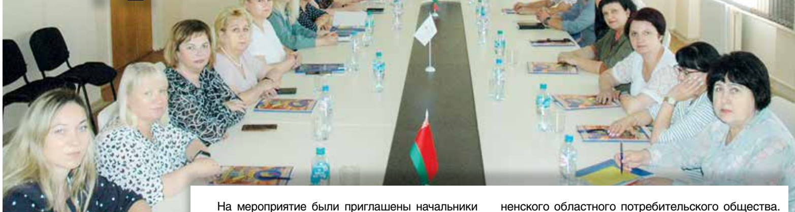
Участники круглого стола поделились опытом и обозначили круг проблем

Сегодня на рынке труда востребованы не знания сами по себе, а безусловная способность специалиста применять их на практике, эффективно и творчески осуществлять профессиональную деятельность. Гродненский колледж экономики и управления Белкоопсоюза активно взаимодействует с организациями – заказчиками кадров, чтобы обеспечить их работниками со средним специальным образованием. Для этого проводится ряд мероприятий различного уровня. На днях состоялся круглый стол на тему «Формы и методы взаимодействия УО «Гродненский колледж экономики и управления» Белкоопсоюза с филиалами Гродненского областного потребительского общества».