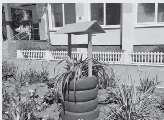
Творческие работники украсили и территорию, прилегающую к магазину

ший по профессии», где заняла первое место в области и представляла команду Витебского облпотребобщества на республиканском состязании. Она – выпускница Белорусского торгово-экономического университета потребительской кооперации и магистратуры этого учебного заведения, но продолжает ездить за 20 километров из Витебска на работу в сельский магазин. К обязанностям заведующей ей очень даже кстати приходится знания экономиста и товароведа. Они, а также практический опыт работы, творчество, любовь к своему делу, умение сплотить коллектив так, что невозможно расстаться, сделали этот магазин лучшим в Сенненском филиале, да и смело можно сказать – в отрасли потребительской кооперации. Именно руководство филиала и подсказало газете «Вести потребкооперации» адрес, заинтриговав, что магазин № 68 в агрогородке Копти очень необычный. Это тот самый случай, когда люди на своем месте и умеют показать и доказать, что молодое поколение кооператоров способно на серьезные достижения и свершения.