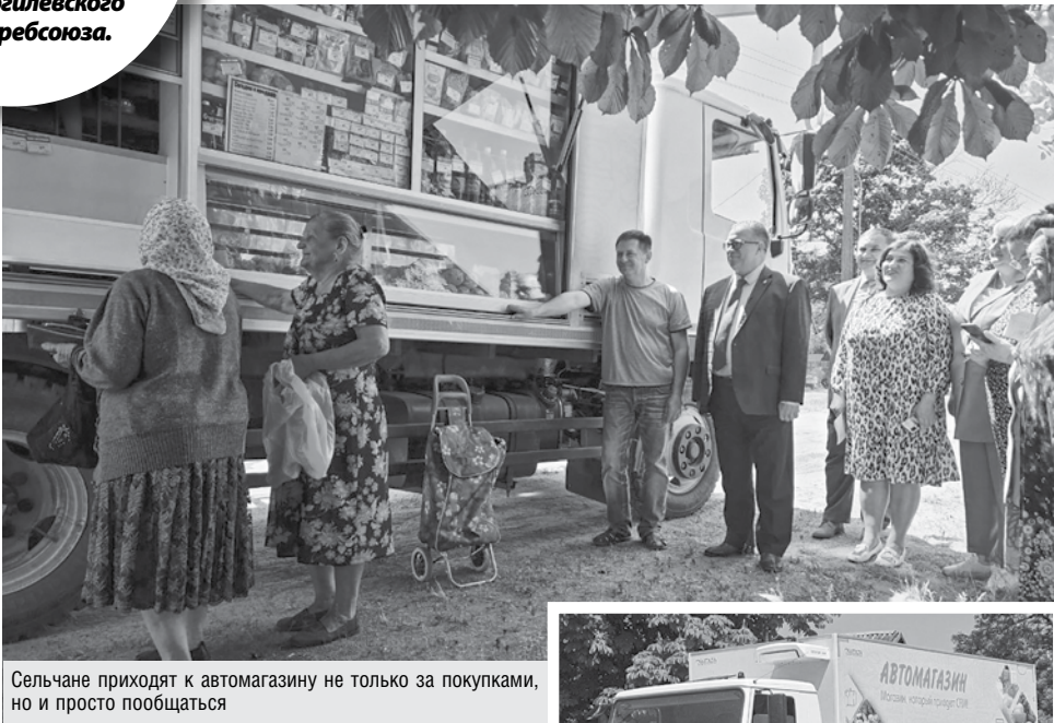
Сельчане приходят к автомагазину не только за покупками, но и просто пообщаться

За 4 месяца 2023 года объем производства промышленной продукции составил 1,1 миллиона рублей, что обеспечило глусчанам 7-е место в рейтинге организаций Могилевского облпотребсоюза.