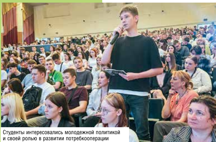
Студенты интересовались молодежной политикой и своей ролью в развитии потребкооперации

■ Студенты организовали выставку основных направлений государственной молодежной политики в учреждениях образования потребительской кооперации. Ребята показали гостям научные, благотворительные, спортивные, творческие и патриотические проекты, а также работу штаба трудовых дел первички БРСМ.