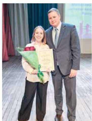
Лучшим сотрудникам университета и активистам БРСМ вручили награды