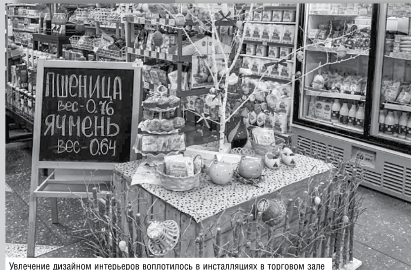
Увлечение дизайном интерьеров воплотилось в инсталляциях в торговом зале