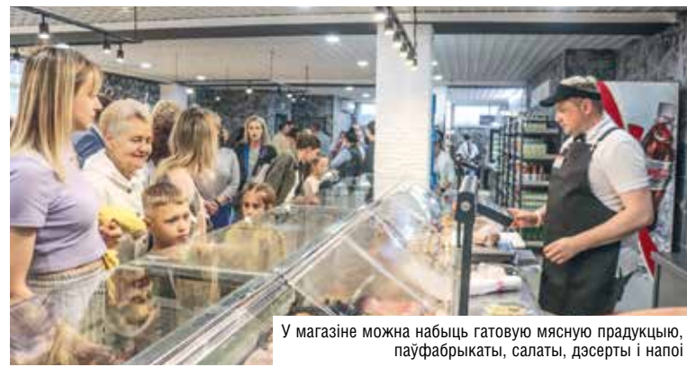
У магазіне можна набыць гатовую мясную прадукцыю, паўфабрыкаты, салаты, дэсерты і напоі