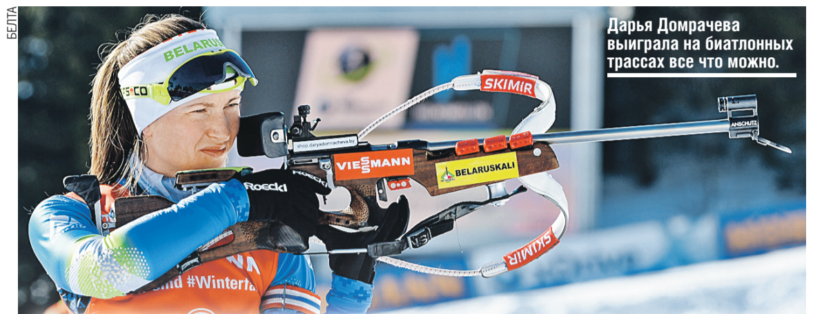
Дарья Домрачева выиграла на биатлонных трассах все что можно.