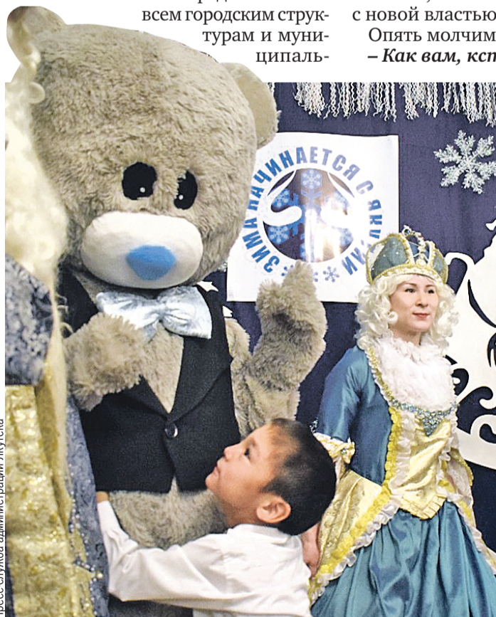
Детям праздники вместо корпоративов очень даже понравились.

Что ж, сотрудники мэрии Якутска убедительно доказали, что у них не холодное, а очень теплое и отзывчивое сердце.