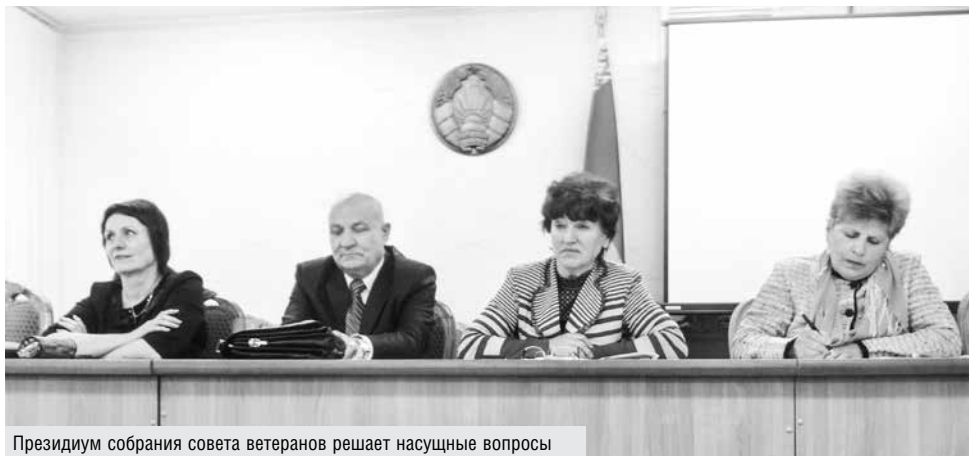
Президиум собрания совета ветеранов решает насущные вопросы

Словом, стараемся сделать все возможное, чтобы жизнь пожилых людей бы-