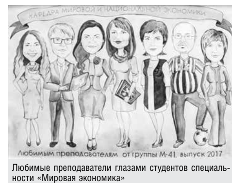
Любимым преподавателям от группы М-41, выпуск 2017 Любимые преподаватели глазами студентов специальности «Мировая экономика»

ведущих экспортно ориентированных предприятий Беларуси.