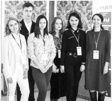
Студенты специальности «Мировая экономика» участвуют в значимых мероприятиях международного характера, таких, например, как проект Программы развития ООН по содействию вступления Беларуси во Всемирную торговую организацию