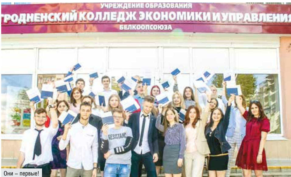
Они – первые!

Подготовку специалистов для логистической деятельности ведут компетентные, креативные, любящие свою профессию педагоги, которые активно используют в обучении современные образовательные технологии, интерактивные методы. Например, лекционный материал подается на практических примерах, с использованием видеоматериалов, интернет-ресурсов или информационно-справочных си-