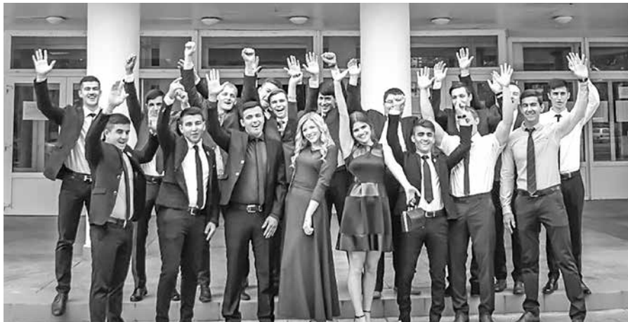
Наши выпускники – дипломированные специалисты в сфере управления внешнеэкономической деятельностью

Некоторые продолжают обучение на второй ступени высшего образования и получают диплом магистра по специальности «Мировая экономика», подготовка ведется с 2010 года.