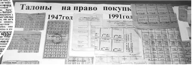
Талоны на право покупки

7 орденов: Ленина, Красного Знамени, Трудового Красного Знамени, Богдана Хмельницкого II степени, Отечественной войны I степени, Красной Звезды, Болгарский крест, а также множество медалей и грамот разного уровня. Избирался депутатом Верховного Совета СССР и БССР нескольких созывов.