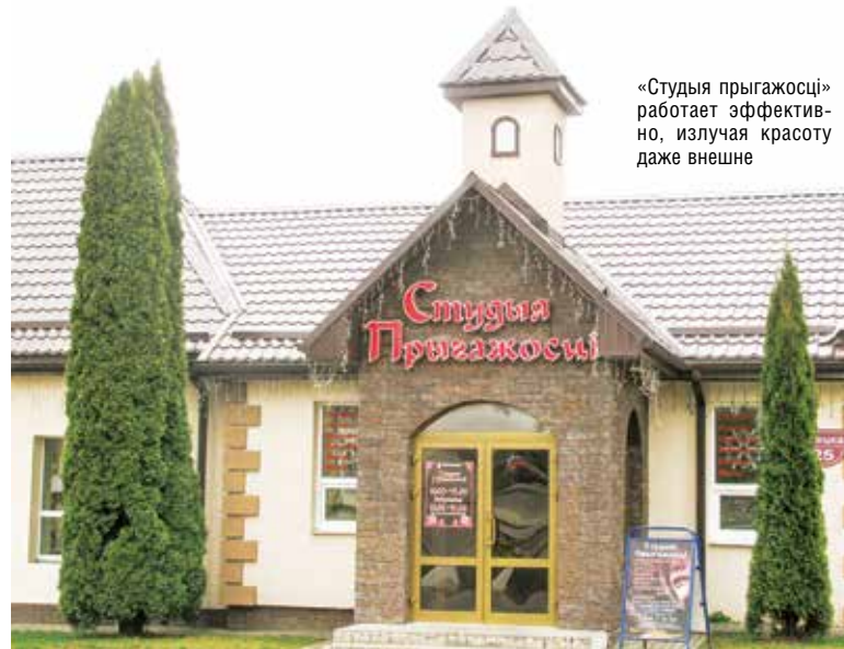
«Студия прыгажосці» работает эффективно, излучая красоту даже внешне

Конкурируя с частником, находят неплохие решения. Ключевой принцип: если чего-то нужного покупателю в магазине вдруг не окажется, под заказ появится обязательно. Привлекает и беспроцентная рассрочка: при сумме покупки от 100 до 300 рублей ее предоставят на 3 месяца, от 300 до 500 – на 6, а если свыше 500 рублей, можно растянуть оплату на год.