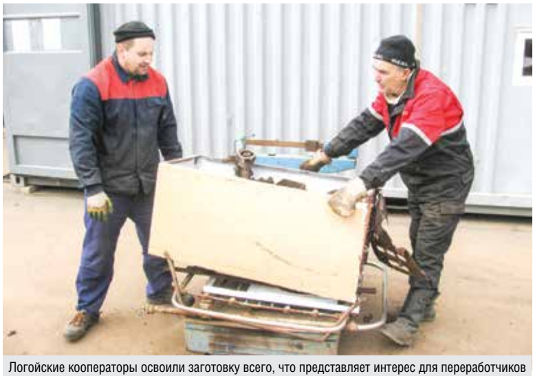
Логойские кооператоры освоили заготовку всего, что представляет интерес для переработчиков