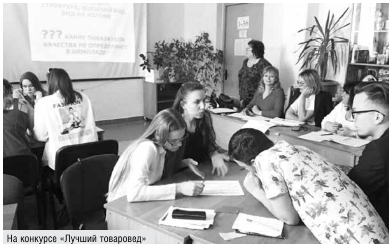
На конкурсе «Лучший товаровед»

Предпринимательский труд, связанный с производством и реализацией продовольственного сырья и пищевых продуктов, непродовольственных товаров, имеет специфический характер. Производство предполагает создание полезного и необходимого потребителю продукта, который можно впоследствии продать или обменять на другой. Предприниматель в торговле выступает в роли квалифицированного посредника между производителем и потребителем, ему важна эффективная и коммерчески успешная реализация товаров.