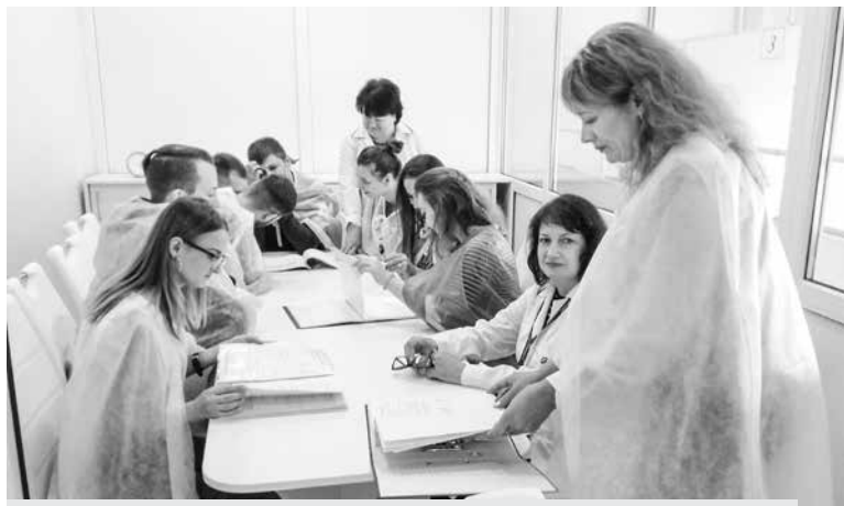
Выездное занятие в Гомельском центре стандартизации, метрологии и сертификации