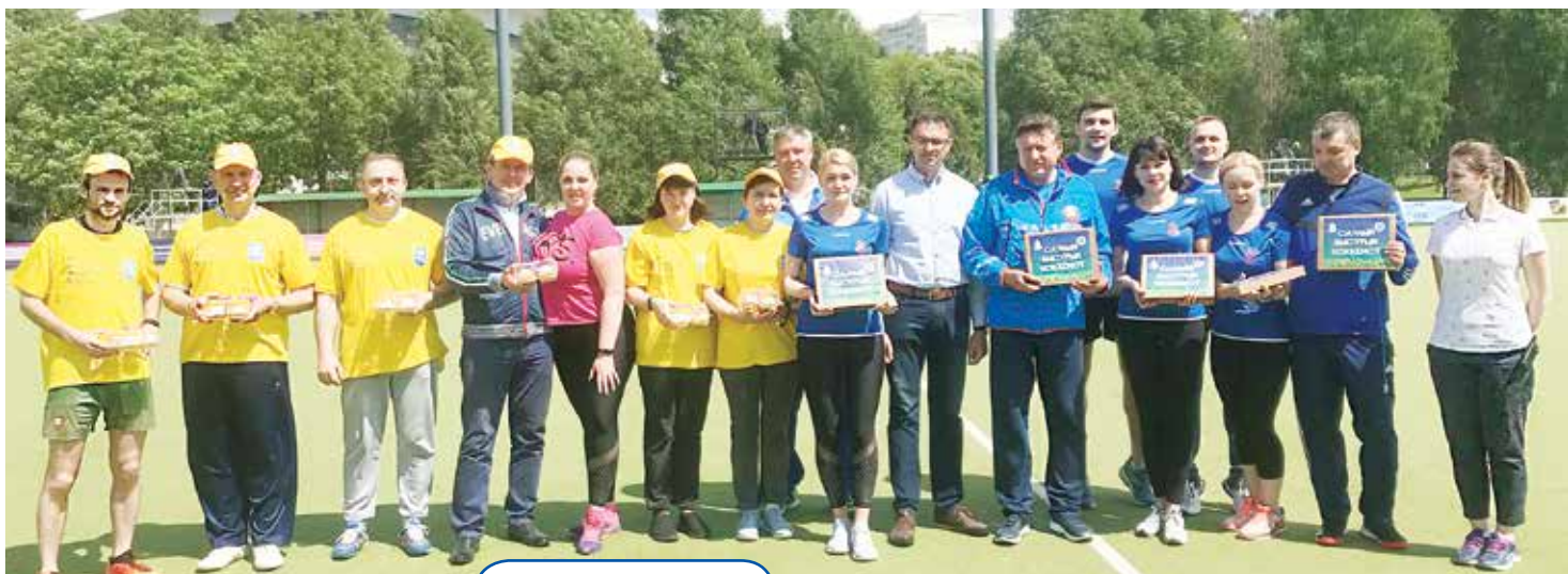
Все участники мини-турнира, помимо заряда хорошего настроения, получили сладкие подарки

Начали с забега. Объединил он тех, кто дружит со спортом, так сказать, профессионально, и тех, кто не настолько часто, как то го хотелось бы, меняет деловой костюм на