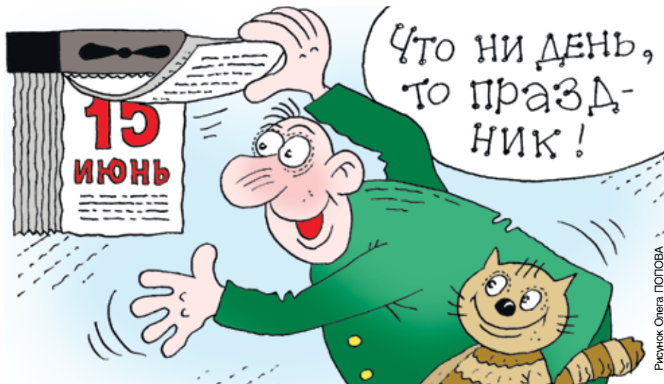
Рисунки Олега ПОПОВА

13 июня – День швейной машинки . И хотя прототип гениального изобретения принадлежит Леонардо да Винчи (XV век), только 13 июня 1790 года английский изобретатель Томас Сейнт получил патент на конструкцию первой швейной машинки, которая предназначалась для сшивания кожи и парусины и широкого распространения не получила. Прорыв произошел лишь в 1845 году вместе с изобретением американца Элиаса Хоу: его модель делала 300 стежков в минуту, появился челнок. Но законодателем моды и брендом на века стала компания, основанная другим изобретателем, Исааком Мерритом Зингером, в 1851 году.