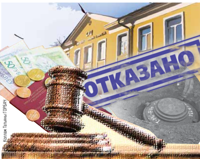
Коллаж Татьяна ГОРБАЧ

удостоверение участника войны и справка об участии в составе специальных формирований в разминировании территорий и объектов после освобождения от