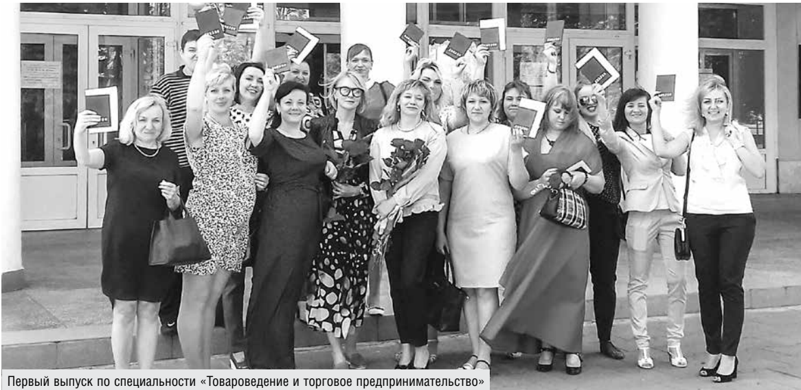
Первый выпуск по специальности «Товароведение и торговое предпринимательство»

Товаровед сегодня – это многопрофильный специалист по эффективному сопровождению товара. От продавца или кассира-контролера он отличается более высокой степенью профессионального погружения в само понятие «товар», включая сведения о его происхождении, основных свойствах (потребительской ценности, безопасности качества), а также о динамике его движения по торговым сетям. Это предполагает фактическое выполнение одним специалистом сразу нескольких функций: товароведных, коммерческих, рекламных, организаторских, аналитических и научных. Для успешного их совмещения требуется целый комплекс профессиональных знаний и навыков: приобретение компетенций в продовольственной, экологической безопасности, таможенном законодательстве, оценке конкурентных преимуществ продукции, информационных, инновационных и ресурсосберегающих технологиях, проведении системных исследований качества пищевых продуктов, организации торговли, маркетинговой и коммерческой деятельности. Плюс приемы делового общения и ведения переговоров – все, что так или иначе способствует не только продаже