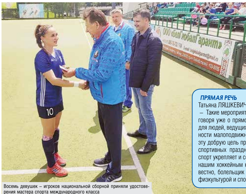
Восемь девушек – игроков национальной сборной приняли удостоверение мастера спорта международного класса

Виталий ЕФИМЕНКО