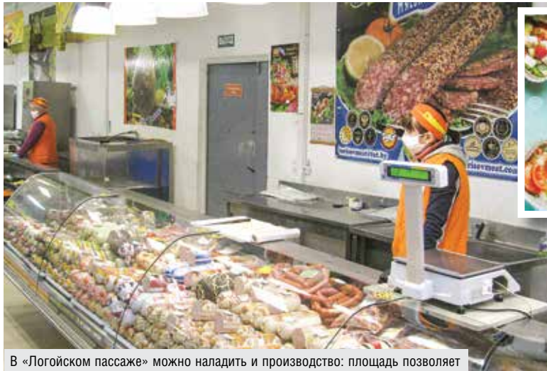
В «Логойском пассаже» можно наладить и производство: площадь позволяет

Темп роста достойный, но просит обновления оборудование. Колбасному цеху нужен новый шприц. А производству в Плещеницах – новые печи: с уменьшением расхода топлива снизится и себестоимость продукции. Обзаведутся еще одной хлебной машиной, ее сделают по спецзаказу: кооператоры представили конструкторам собственное видение того, как нуж-