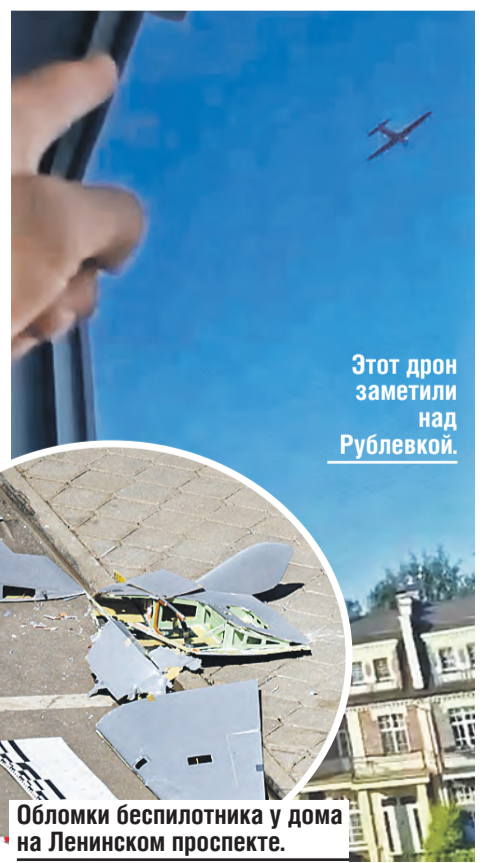
Этот дрон заметили над Рублевкой.

Как заявил губернатор Белгородской области, единственный способ прекратить эти преступления – присоединить Харьков к Белгородской области. Нацисты ответят за свои преступления.