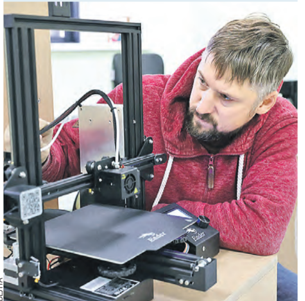
Белорусские инженеры заставляют современные технологии служить людям.

Вовсю трудится и робот-фасовщик, способный заменить целую бригаду. Пока ему в тестовом режиме доверяют переключать печенки, но создатели говорят, что это только начало.