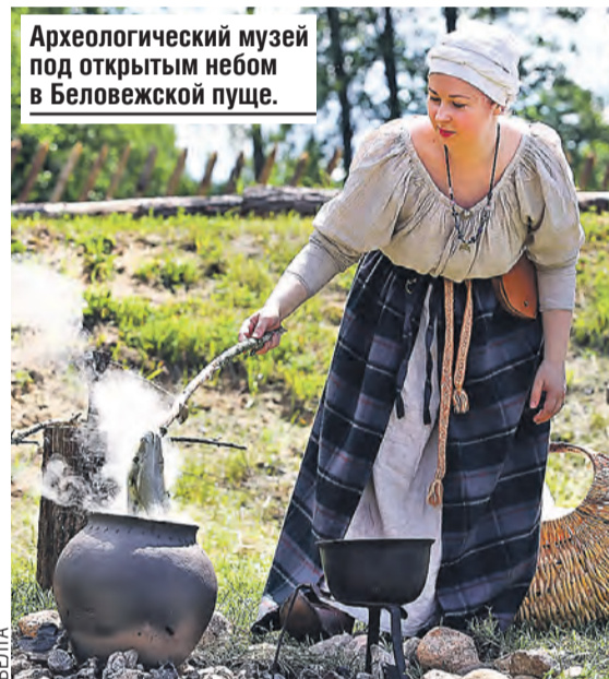
Археологический музей под открытым небом в Беловежской пуше.