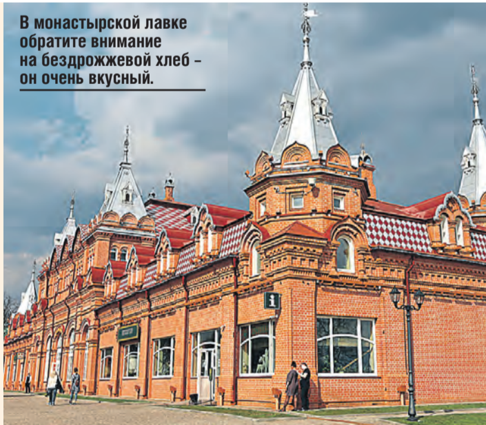
В монастырской лавке обратите внимание на бездрожжевой хлеб – он очень вкусный.

Сейчас тут можно купить еду, которая попала на прилавки прямоком из монастыря: хлеб, выпечку, рыбу, пельмени и вареники, соленья, а также квас, мед, сбитень, иван-чай и медовый лимонад.