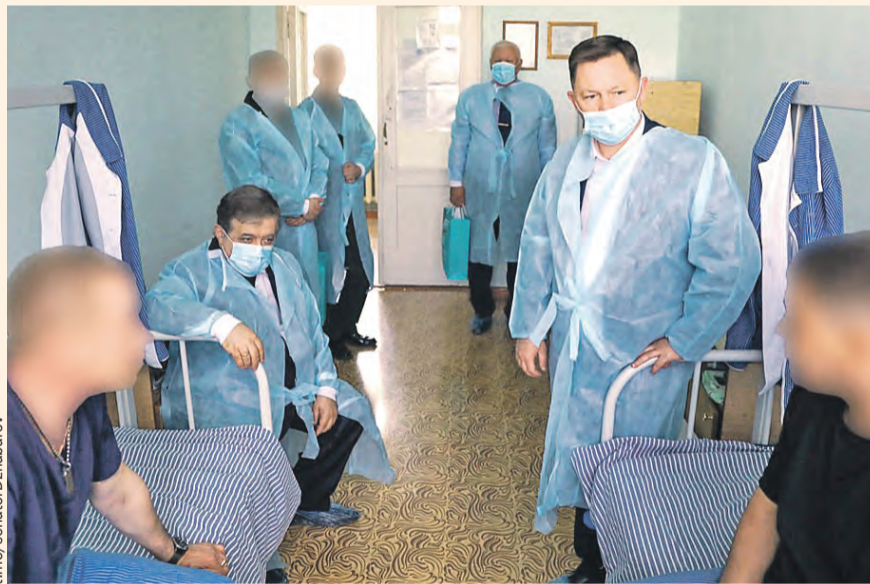
Настроение у ребят позитивное, а хороший уход этому способствует. Тяжелых ранений у них, к счастью, нет.