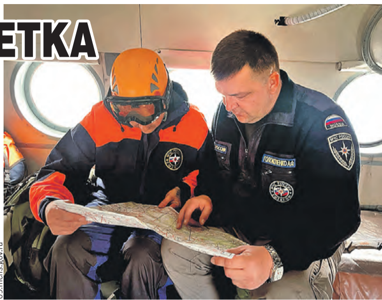
Восьмидесяти эмчезникам, которые отправились на помощь пропавшим горе-альпинистам, пришлось работать в сложнейших условиях.

После приземления врачей звать не пришлось – ни травм, ни обморожений. Можно сказать, отделались легким испугом. Самим испугом сейчас занимаются психологи.