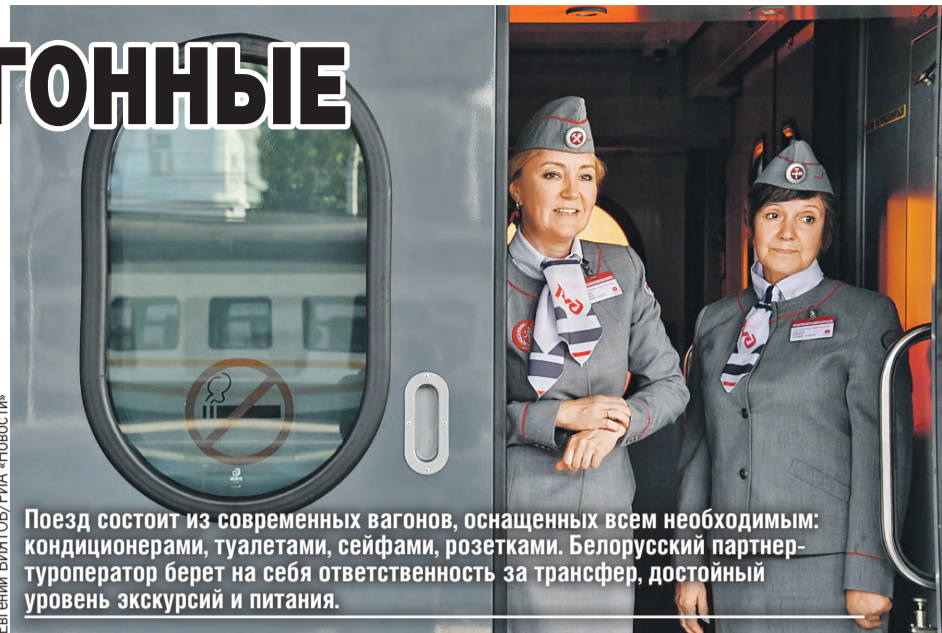
Поезд состоит из современных вагонов, оснащенных всем необходимым: кондиционерами, туалетами, сейфами, розетками. Белорусский партнер-туроператор берет на себя ответственность за трансфер, достойный уровень экскурсий и питания.

А Мирский замок в Гродненской области?! Если кто из россиян не знает,