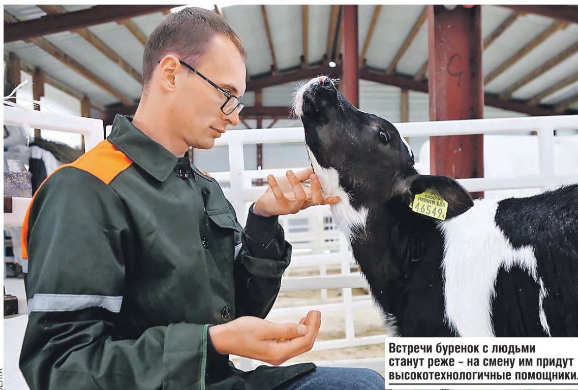
Встречи буренок с людьми станут реже – на смену им придут высокотехнологичные помощники.