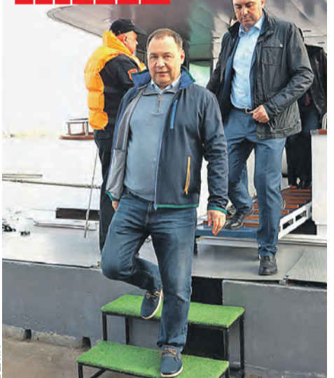
Роман Головченко ознакомился с возможными площадками для строительства порта в Мурманске.

Карелии Артур Парфенчиков . – Мы действительно выращиваем около 70 процентов всей российской форели.