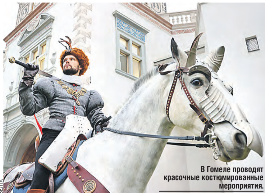
В Гомеле проводят красочные костюмированные мероприятия.