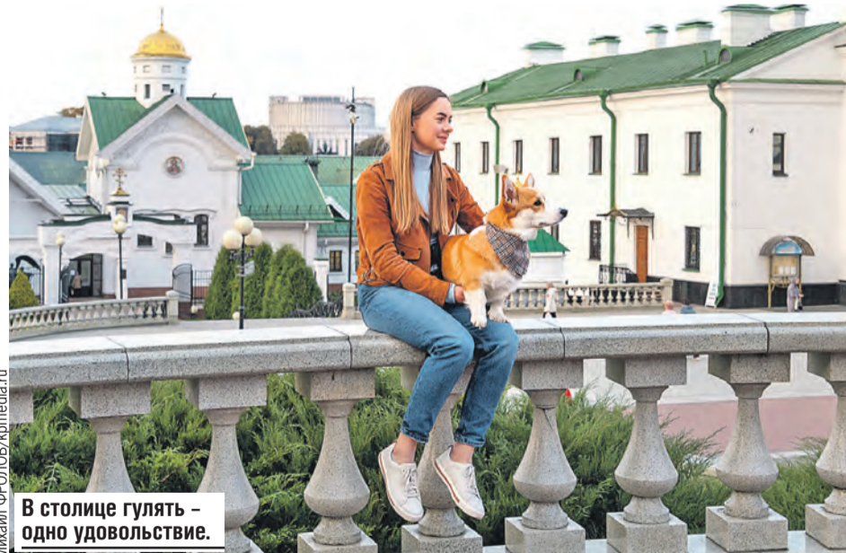
В столице гулять – одно удовольствие.