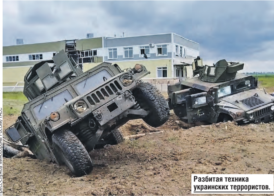
Разбитая техника украинских террористов.

– Если Украина одним мощным ударом займет часть российской территории, США добьются прекращения огня, усадят стороны за переговоры и постараются обменять эти занятые территории на территории, полученные Россией в ходе СВО.