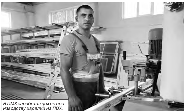
В ПМК заработал цех по производству изделий из ПВХ.