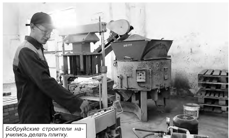
Бобруйские строители научились делать плитку.