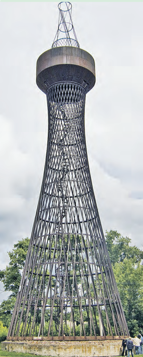
Первую башню знаменитый инженер построил в 1896 году. А вот самое высокое из его строений появилось в Москве на Шаболовке спустя четверть века.

Всего в парке семнадцать макетов исторических зданий, созданных с кропотливой точностью. Побродить по Быхановому саду можно круглый год: миниатюры сделаны из хитрого материала, которому не страшен ни дождь, ни снег. Вход стоит 200 российских рублей.