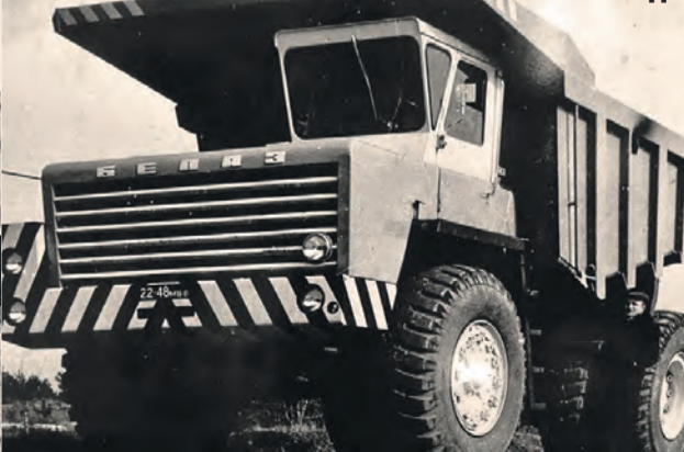
БелАЗ-548 (40 тонн). Эта машина выпускалась в пяти модификациях, в том числе был и «северный вариант».