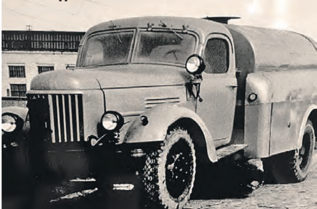
Поливочная машина ПМ-150 на базе ЗИС-150. На таких авто специализировался завод в первые годы работы.