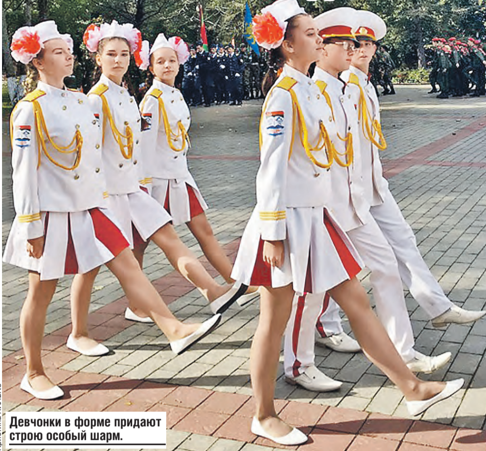
Девочки в форме придают строю особый шарм.