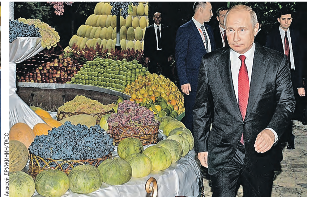
Душанбе встретил лидеров стран СНГ традиционным таджикским гостеприимством. Владимир Путин с коллегами успели отщипнуть несколько виноградин в перерывах между заседаниями, а Александр Лукашенко даже поучаствовал в сборе урожая.