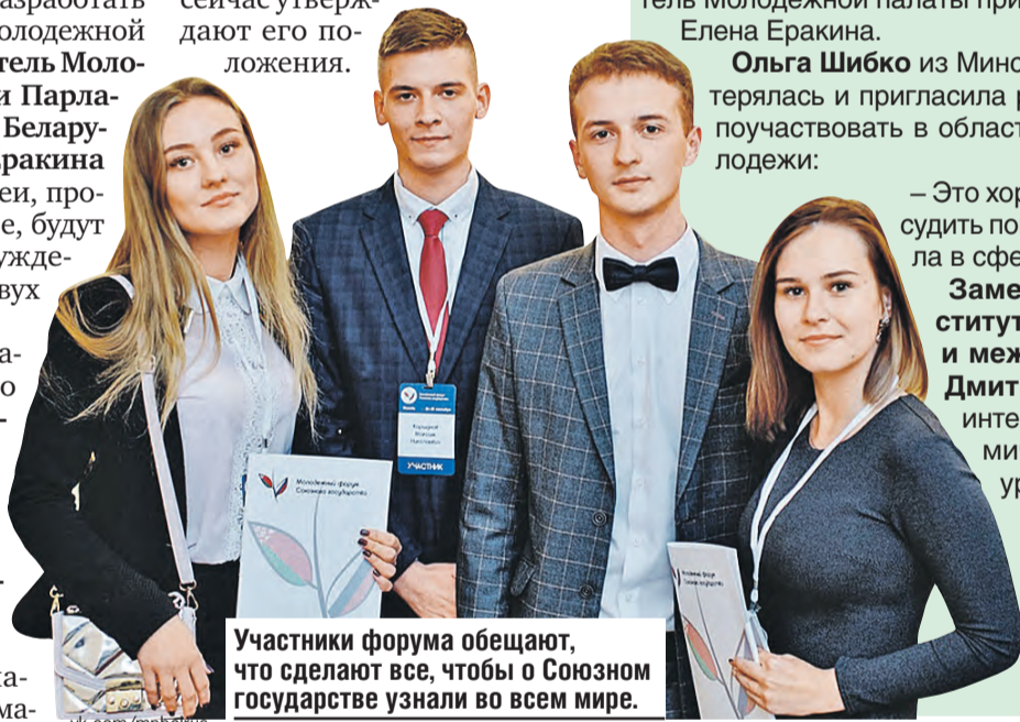
Участники форума обещают, что сделают все, чтобы о Союзном государстве узнали во всем мире.

Участники согласились также, что пора разработать молодежную символику Союзного государства – готовится конкурс, сейчас утверждут его положения.