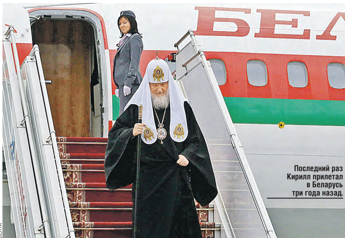
Последний раз Кирилл прилетал в Беларусь три года назад.

В воскресенье утром, 14 октября, Предстоятель РПЦ отслужит чин Великого освящения Храма-памятника в честь Всех Святых. Десять лет назад в свой последний визит в Беларусь Святейший Патриарх Алексий утвердил название храма, наиболее полно отвечающее замыслу мемориала – «Храм-памятник в честь Всех Святых и в память о жертвах, спасению Отечества нашего послуживших». В крипте захоронены останки неиз-