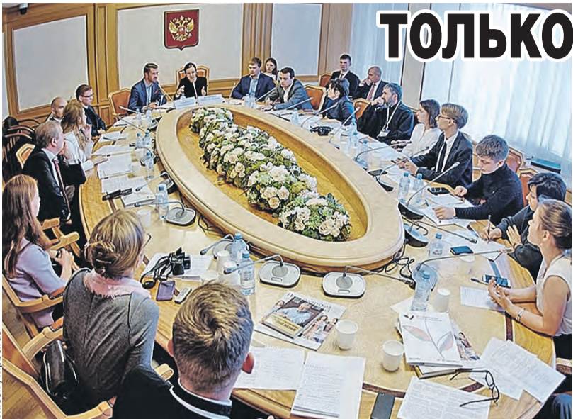
Ребята обсуждали самые серьезные проблемы – внешние угрозы, вызовы безопасности страны.