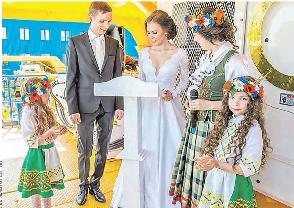
С прошлого года для влюбленных на заводе проводят торжественные церемонии бракосочетания. Прямо на палубе гигантских машин.