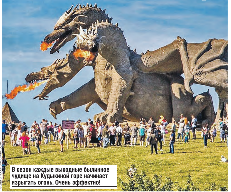
В сезон каждые выходные былинное чудовище на Кудыкиной горе начинает изрыгать огонь. Очень эффектно!

В любое время года там приятно вдохнуть полной грудью хрустального чистого воздуха, пройтись вдоль реки и выпить вкусной живой воды, бьющей ключом из пятиметровой кринки. И, представив себя добрым молодцем или красной девицей, позволить себе пожить в сказке хотя бы несколько часов.