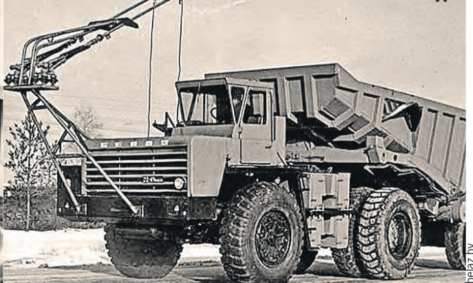
Дизель-троллейвоз БелАЗ-7524-792. Грузоподъемность – 65 тонн. Этих машин выпустили около десятка штук. Их эксплуатация оказалась нерентабельной.