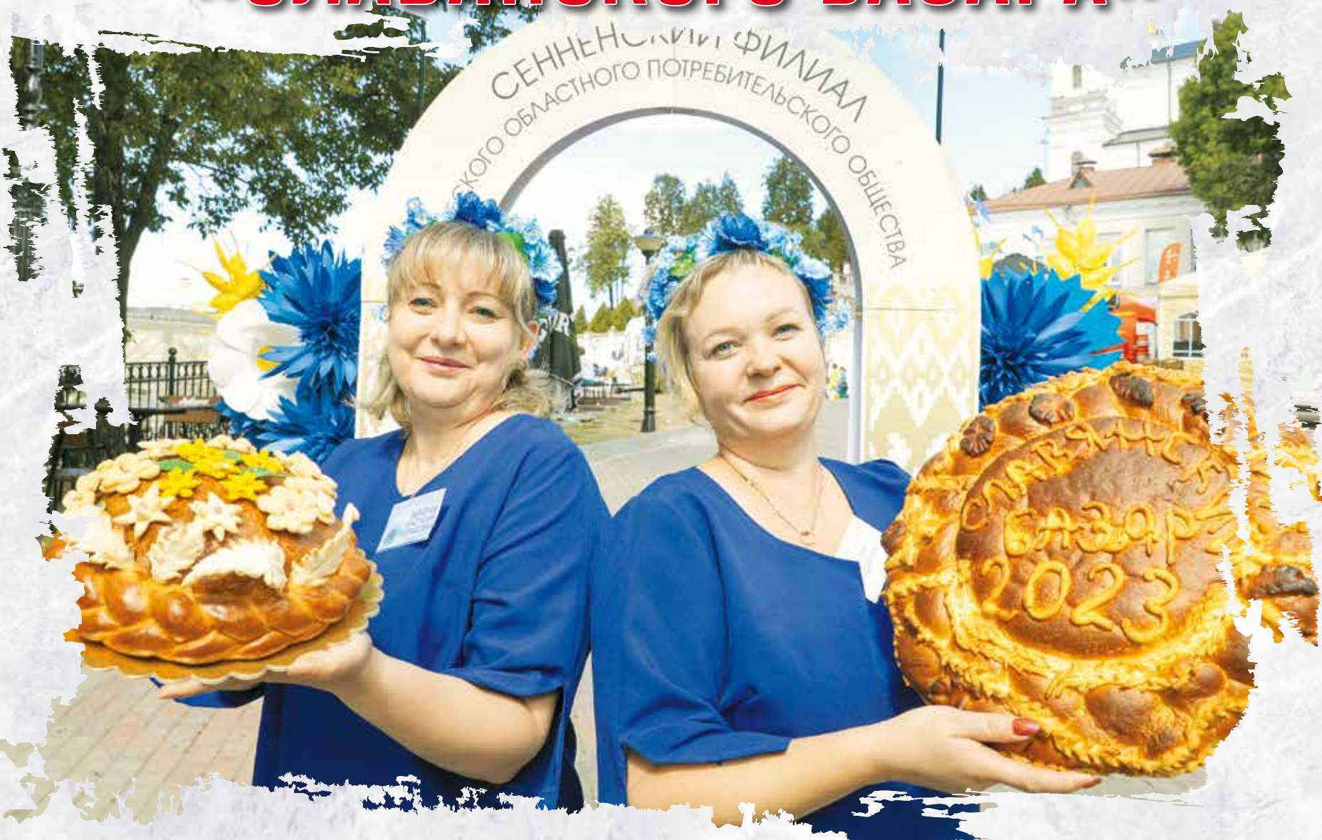
Дизайн обложки Татьяна ГОРБАН

ЛЕПЕЛЬСКИЙ И СЕННЕНСКИЙ ФИЛИАЛЫ ВИТЕБСКОГО ОБЛПОТРЕБОБЩЕСТВА ОРГАНИЗОВАЛИ КРУГЛОСУТОЧНОЕ ОБСЛУЖИВАНИЕ И ВКУСНОЕ ПИТАНИЕ ДЛЯ ГОСТЕЙ ФЕСТИВАЛЯ