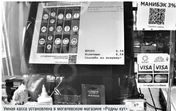
Умная касса установлена в могилевском магазине «Родны кут»