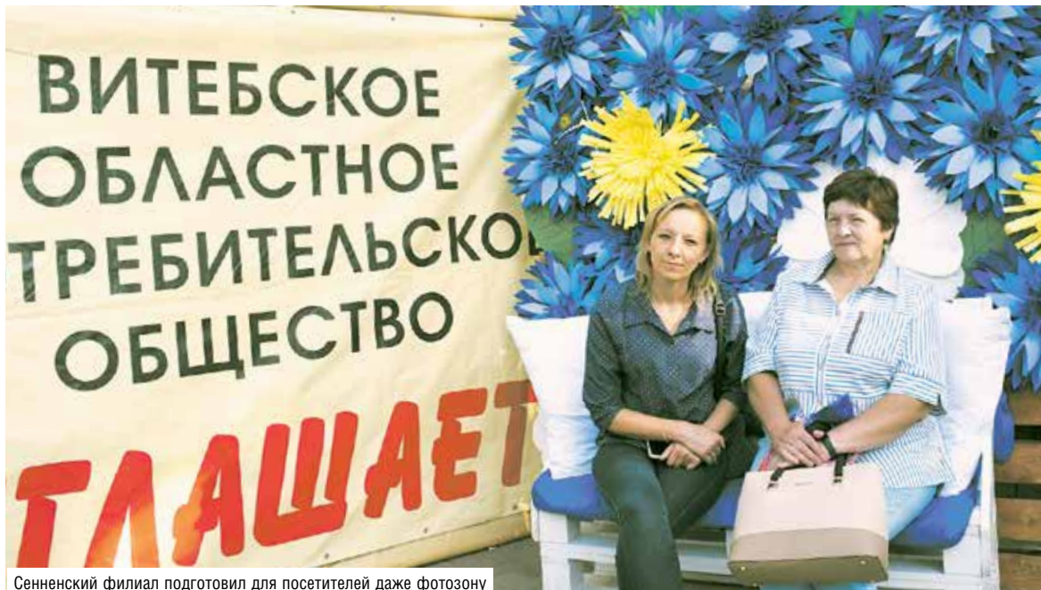
Сенненский филиал подготовил для посетителей даже фотозону