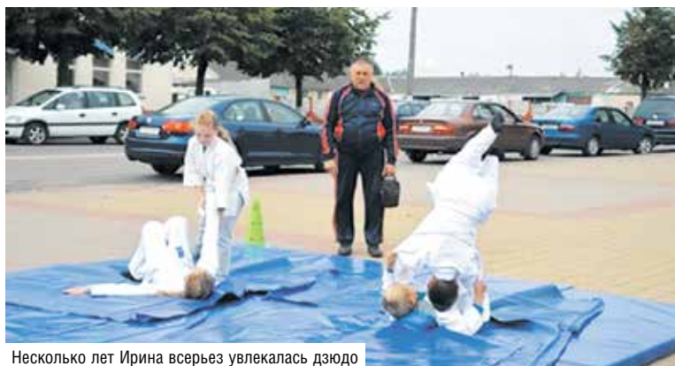
Несколько лет Ирина всерьез увлекалась дзюдо

Диана ВОЛЬСКАЯ, фото из личного архива собеседницы