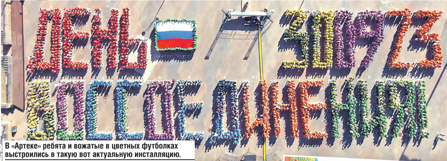
Кадр видео В «Артеке» ребята и вожатые в цветных футболках выстроились в такую вот актуальную инсталляцию.