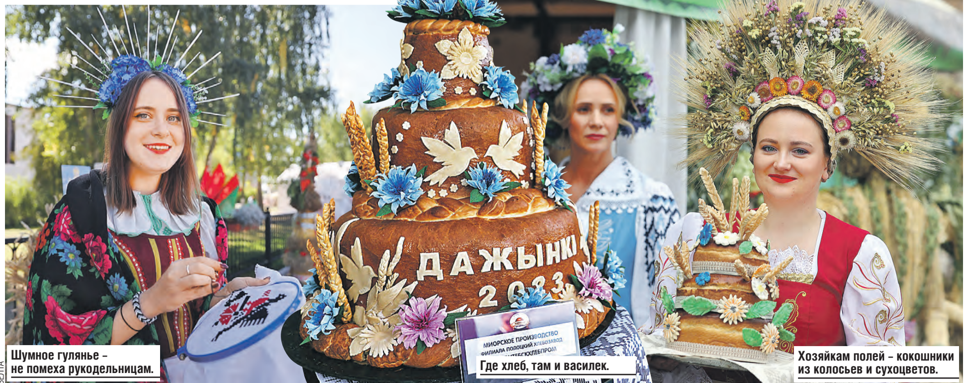
Шумное гулянье – не помеха рукодельницам.