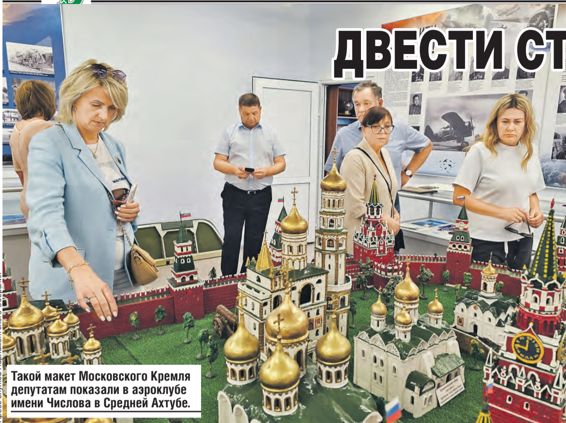
Такой макет Московского Кремля депутатам показали в аэроклубе имени Числова в Средней Ахтубе.