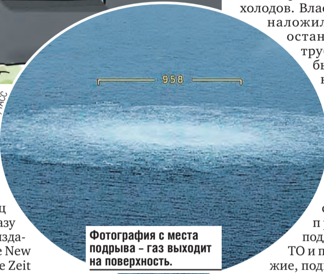
Фотография с места подрыва - газ выходит на поверхность.

«Полной чужью» назвал эту версию Владимир Путин. Ведь для организации такого взрыва «нужны специалисты, поддерживаемые всей мощью государства, которое располагает определенными технологиями».