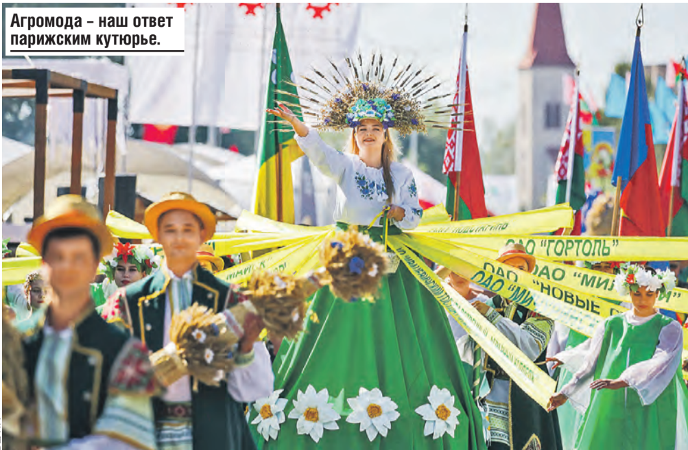
Агромода – наш ответ парижским кутюрье.