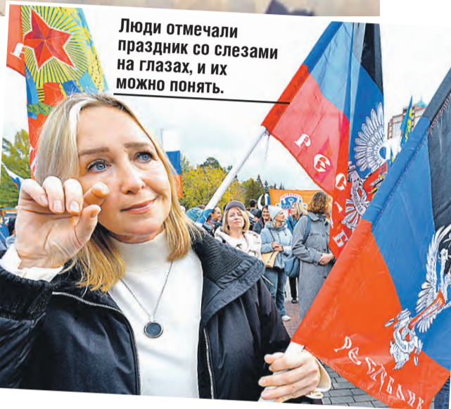
Люди отмечали праздник со слезами на глазах, и их можно понять.

Накануне праздника в легендарном «Артеке», который в России возродился практически из пепла, дети и вожатые лагеря выстроились в живую разноцветную надпись: «День воссоединения – 2023». Среди участников – дети из Донецка и Луганска.