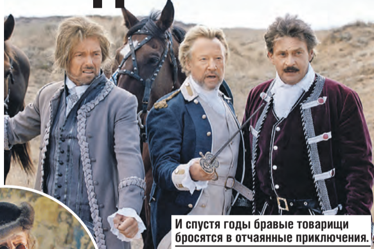
И спустя годы brave товарищи бросятся в отчаянные приключения.

Получилось масштабное костюмное кино. Над нарядами колдовал известный дизайнер Игорь Дадани , который сотрудничал со Славой Зайцевым . В фильме много лошадей – их обожает Дружинина. Идет постоянный отсыл к предыдущим лентам – вспышками черно-белых кадров. Высказывания героев станут крылатыми. Например, не лишены иронии сценаристы вложили фразу «русские своих не бросают» в уста «ожившему» французу Шевалье де Брильи.