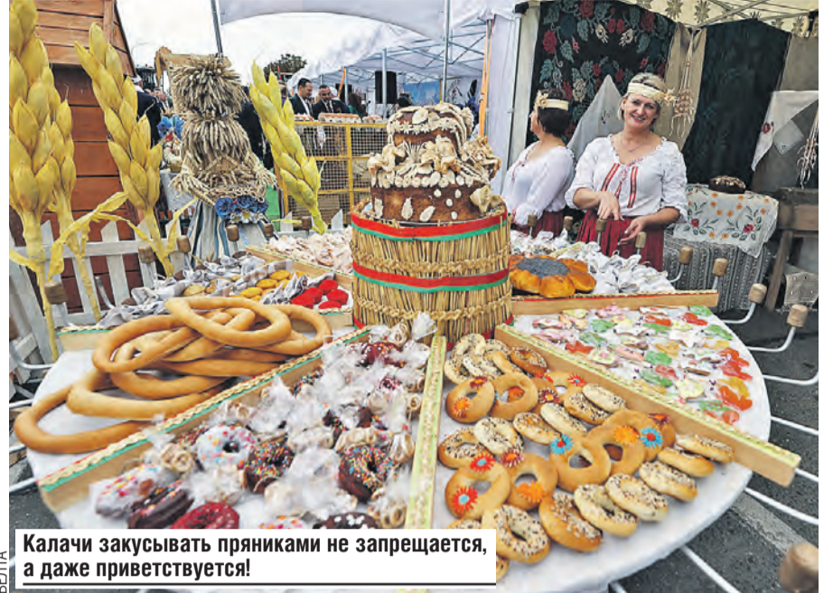
Калачи закусывать пряниками не запрещается, а даже приветствуется!