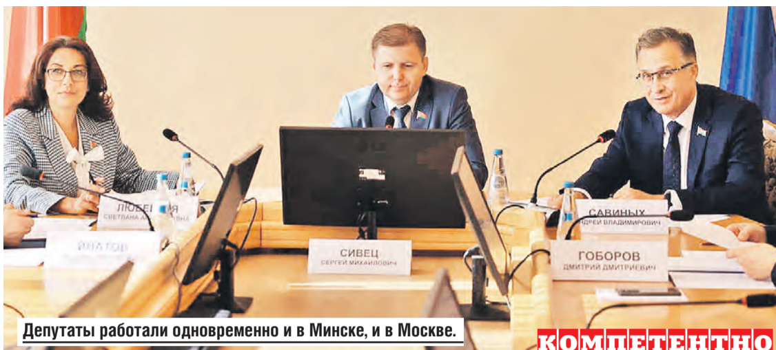
Депутаты работали одновременно и в Минске, и в Москве.