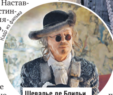
Шевалье де Брильи и сам не ожидал, что воскреснет на экране.

Четвертую и пятую части «Гардемаринов» снимали почти десять лет. Светлана Дружинина задумала продолжение легендарной киноэпопеи еще в 2014 году. Но процесс остановился – не хватало финансирования. Режиссер сбился с ног. Три года пыталась получить деньги от Фонда кино. Бегала по продюсерам. Тщетно. Повезло в Крыму.