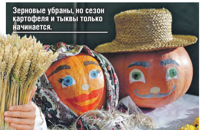
Зерновые убраны, но сезон картофеля и тыквы только начинается.