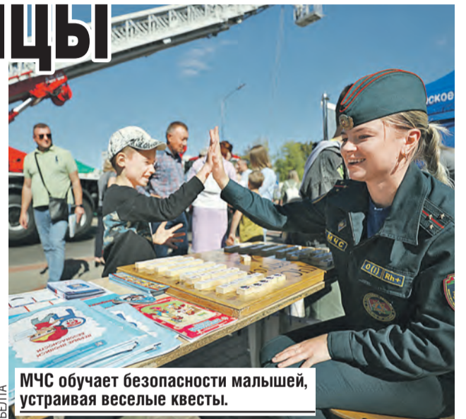
МЧС обучает безопасности малышей, устраивая веселые квесты.