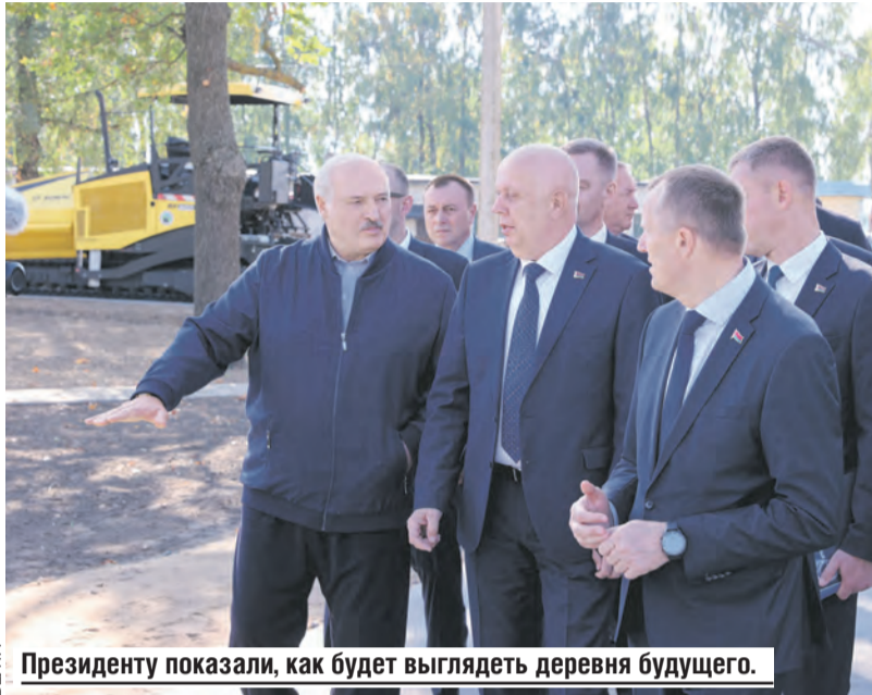
Президенту показали, как будет выглядеть деревня будущего.

— Вы знаете, все это было. Было, когда и провинился, я ему про это говорила и Президентом когда