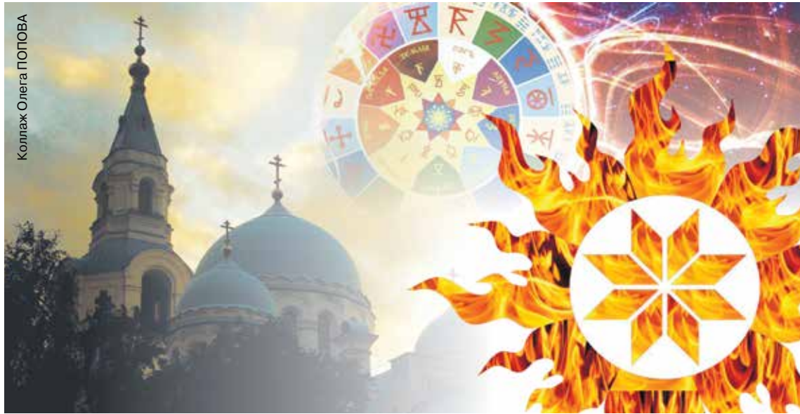
Коллаж Ольга ПОПОВА