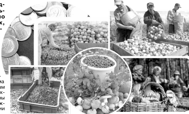
Коллекция Татьяна ГОРБАЧ

В текущем году в республике сложился невысокий урожай яблок.