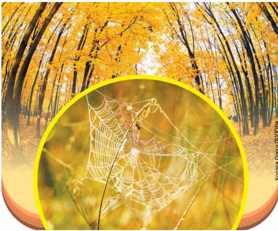
Коллаж Ольга ПОПОВА

предки следили особенно внимательно. Те люди, которые жили и работали на земле, зависели от прихотей природы. Благодаря их наблюдательности мы можем пользоваться их знаниями, а при желании и проверить. Замечено, что если 14 сентября пойдет дождь, то дождем бабье лето и закончится, зато осень будет сухая и теплая, а грибов в лесу будет очень мало. Но если все бабье лето стоит солнечная и ясная погода, то жди дождливой