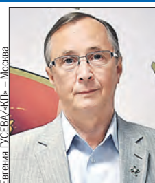
БУРЛЯЕВ Николай Петрович (Государственная дума)