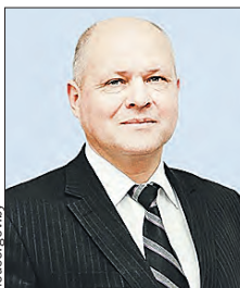
БРИЧ Леонид Григорьевич Зампредседателя комиссии (Палата представителей)