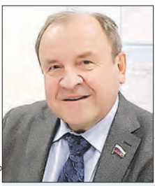
СЕЛИВЕРСТОВ Виктор Валентинович Председатель комиссии (Государственная дума)