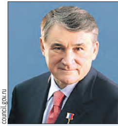
ВОРОБЬЕВ Юрий Леонидович Заместитель Председателя Парламентского Собрания (Совет Федерации)