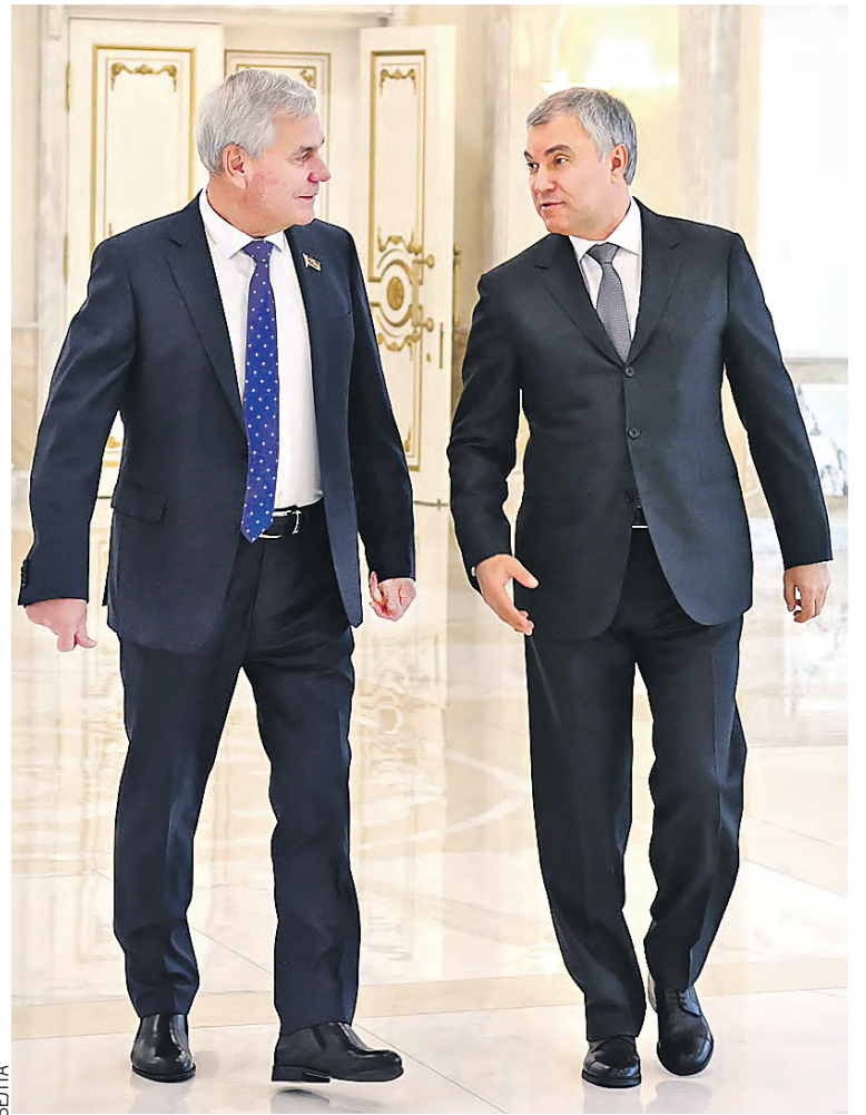
Лидеры Парламента в конце месяца еще раз встретятся в Москве.

SOUZVESHCHIE.RU ВИДЕО ВСЕГО ВЫСТУПЛЕНИЯ СМОТРИТЕ НА НАШЕМ САЙТЕ