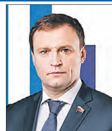
ПАХОМОВ Сергей Александрович Зампредседателя комиссии (Государственная дума)