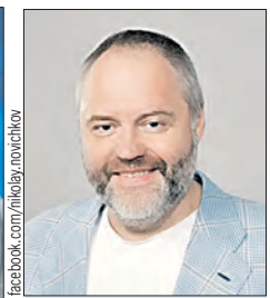
НОВИЧКОВ Николай Владимирович (Государственная дума)