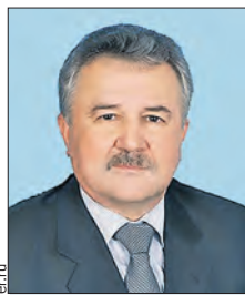
МОСКВИЧЕВ Евгений Сергеевич (Государственная дума)

Парламентарии развивают межрегиональное сотрудничество России и Беларуси, содействуют росту объемов взаимного товарооборота, участвуют в формировании единого экономического пространства.