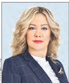
ГАЙДУК Оксана Вячеславовна (Палата представителей)