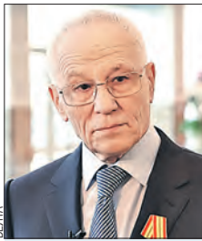
РАПОТА Григорий Алексеевич (Совет Федерации)