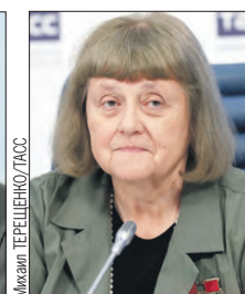
САВИЦКАЯ Светлана Евгеньевна (Государственная дума)

Комиссия координирует деятельность в области военного сотрудничества и развития вооруженных сил, совместного использования военной инфраструктуры, ВТС, борьбы с преступностью и в других сферах.