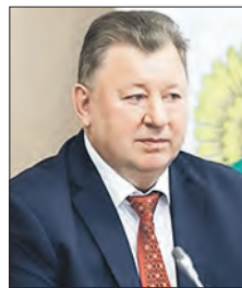
КАШИН Владимир Иванович (Государственная дума)