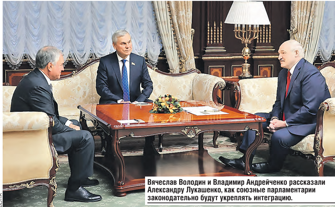
Вячеслав Володин и Владимир Андрейченко рассказали Александру Лукашенко, как союзные парламентарии законодательно будут укреплять интеграцию.

на нас повлияло. Но на нас извне всегда чего-то влияет, на кого-то мы влияем. Дело не в этом. Суть в том, что мы понимаем – в этом мире надо сохранить ту цивилизацию, которая существовала издревле и существует сегодня в нашем общем Отечестве. Если мы этого не сделаем, мы эту цивилизацию погубим.