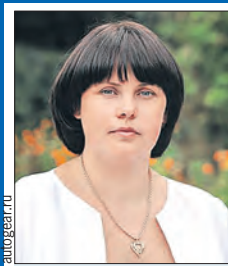
АФАНАСЬЕВА Елена Владимировна Председатель комиссии (Совет Федерации)