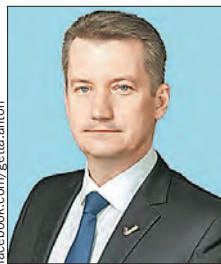
ГЕТТА Антон Александрович (Государственная дума)