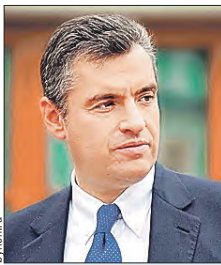
СЛУЦКИЙ Леонид Эдуардович (Государственная дума)