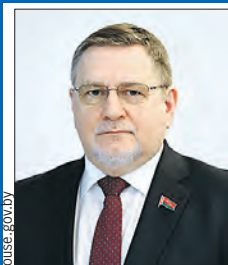
ДАВИДЬКО Геннадий Брониславович Председатель комиссии (Палата представителей)