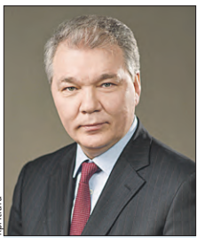
КАЛАШНИКОВ Леонид Иванович Зампредседателя комиссии (Государственная дума)