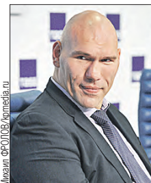
ВАЛУЕВ Николай Сергеевич Зампредседателя комиссии (Государственная дума)