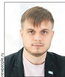
ТКАЧЕВ Антон Олегович (Государственная дума)