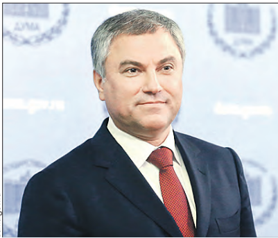
ВОЛОДИН Вячеслав Викторович Председатель Парламентского Собрания, Председатель Государственной думы России