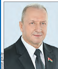
БЕЛОКОНЕВ Олег Алексеевич Председатель комиссии (Палата представителей)