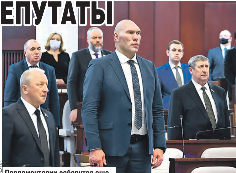
Парламентарии соберутся еще раз, чтобы принять бюджет Союзного государства.

— Спасибо за поддержку. Это не только в наше время, а в целом дорогого стоит. В повестке есть ряд содержательных тем. Поэтому хотелось бы по ним выработать решения, и они дальше уже определили бы развитие, реализацию программ, которые принимаются в рамках Высшего Госсовета.