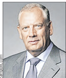
МИТИН Сергей Герасимович Председатель комиссии (Совет Федерации)