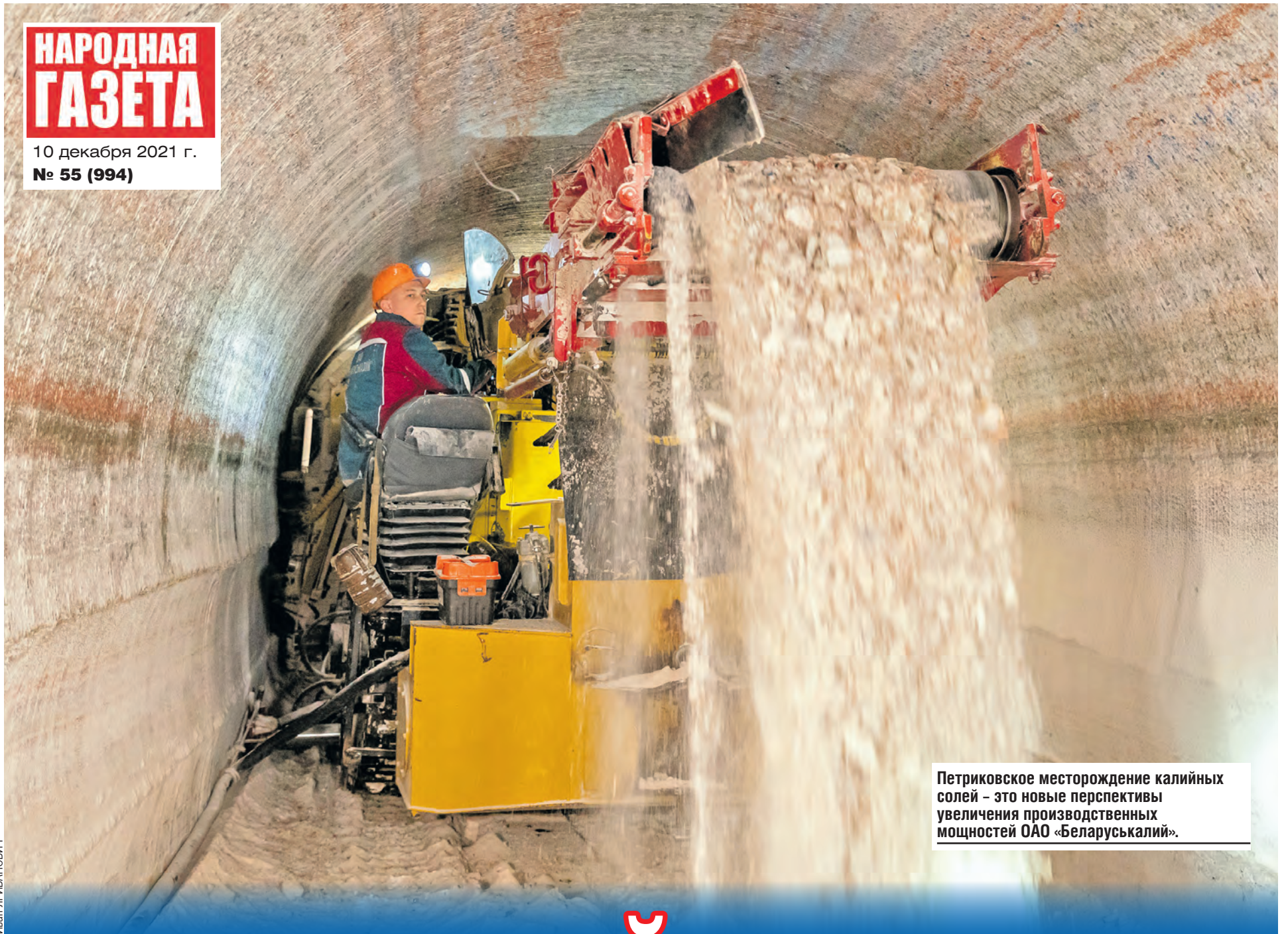
Петриковское месторождение калийных солей – это новые перспективы увеличения производственных мощностей ОАО «Беларуськалий».