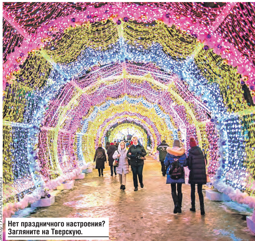
Нет праздничного настроения? Загляните на Тверскую.

На Поклонной горе смонтировали большой новогодний шар весом 35 тонн и высотой 20 метров, у Триумфальной арки прописались Дед Мороз и Снегурочка. А в Ростокино нашествие косолапых! Мама-медведица с сынишкой Умкой на льдине и полярные медвежата поменьше уже ждут гостей на фотосессии. Длина световой инсталляции почти 400 метров, так что с соблюдением социальной дистанции проблем не будет.