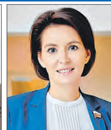
ПАВЛОВА Маргарита Николаевна (Совет Федерации)