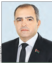
ГАЙДУКЕВИЧ Олег Сергеевич (Палата представителей)

К вопросам ведения комиссии относятся внешняя политика Союзного государства, международные отношения и право. Депутаты устанавливают официальные связи с ведущими мировыми межпарламентскими организациями.