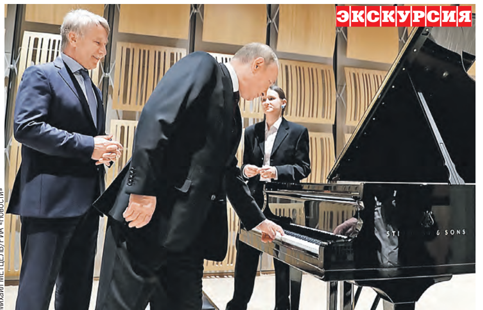
Владимир Путин побывал на бывшей ГЭС-2, которая снабжала Москву электричеством аж с 1907 года, а теперь превратилась в станцию большого искусства – с выставками и концертами. Президент не удержался и сам опробовал акустику зала, взяв несколько нот на рояле.

– Особо отмечу: нам нужны именно правовые, юридические гарантии, поскольку западные коллеги не выполнили взятые на себя соответствующие устные обязательства. В частности, всем известно о дававшихся устных заверениях, что НАТО не будет расширяться на восток, но все было сделано ровно наоборот. По сути, законные российские озабоченности в сфере безопасности были проигнорированы, и сейчас их продолжают игнорировать.