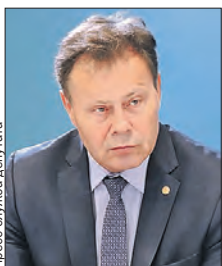
АРЕФЬЕВ Николай Васильевич (Государственная дума)