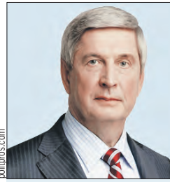
МЕЛЬНИКОВ Иван Иванович Заместитель Председателя Парламентского Собрания (Государственная дума)