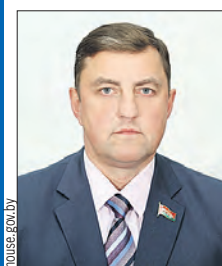
МАРКЕВИЧ Александр Иванович (Палата представителей)