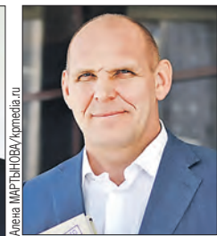
КАРЕЛИН Александр Александрович (Совет Федерации)