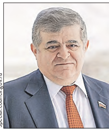
ДЖАБАРОВ Владимир Михайлович (Совет Федерации)

К вопросам ведения комиссии относятся внешняя политика Союзного государства, международные отношения и право. Депутаты устанавливают официальные связи с ведущими мировыми межпарламентскими организациями.