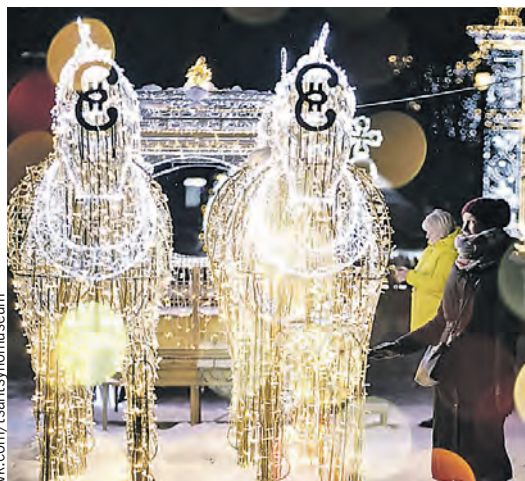
В Царицыно Новый год пройдет с королевским размахом.

Давно полюбившийся москвичам и гостям города фестиваль снова возвращается на московские улицы. Со сноской, конечно, на коронавирус. Власти решили открыть дополнительные площадки в районах Москвы, чтобы избежать столпотворения в центре. Сказочный лес, Волшебник Изумрудного города, Алиса из Страны чудес, Мышиный король и еще 60 героев из любимых сказок ждут гостей у резиденции Деда Мороза. В ГУМе можно прогуляться среди дизайнерских елочек, а рядом с Историческим музеем сегодня заработают торговые ряды, которые познакомят гостей с кухнями разных стран. Из анимации – мастер-класс, традиционные зимние забавы и игры. В районах заработают 18 ледовых катков. Здесь можно будет покататься, а на некоторых площадках пройдет праздничное шоу с участием известных фигуристов.