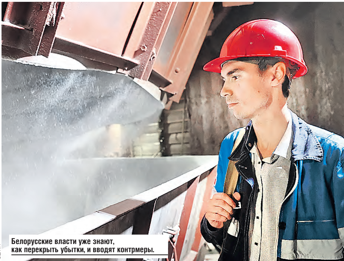
Белорусские власти уже знают, как перекрыть убытки, и вводят контрмеры.

больше тысячи долларов, а для республики почти в десять раз дешевле – 128,5 доллара за тысячу кубометров. К тому же, как планируется, в следующем году на полную мощность выйдет первый энергоблок БелАЭС. Это позволит сэкономить 1,8 миллиарда кубометров газа, а в деньгах – до 250 миллионов долларов.