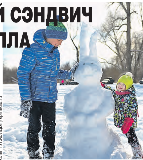
У этого зайца есть шанс простоять до весны.

– Это не такая супертеплая зима, как была в позапрошлом году. Оттепели и суровые морозы будут сменять друг друга.