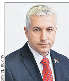
ЩАСТНЫЙ Анатолий Тадеушевич (Совет Республики)

Курируют трудовые отношения, социальное обеспечение и страхование, образование, спорт, туризм, здравоохранение, демографическую и молодежную политику России и Беларуси.