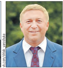
ЯРОШУК Александр Георгиевич (Совет Федерации)

Члены комиссии курируют вопросы экологической безопасности, мониторинга окружающей среды Союзного государства. При участии депутатов реализованы несколько программ по преодолению последствий чернобыльской катастрофы. Четыре крупные больницы получили современное оборудование.