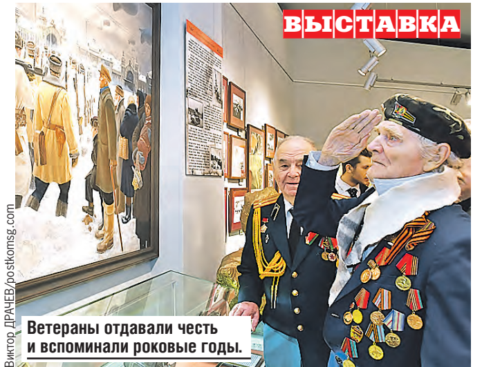
Ветераны отдавали честь и вспоминали роковые годы.

Состоялся и круглый стол. Союзные парламентарии, историки и журналисты обсуждали вопросы сохранения исторической памяти.