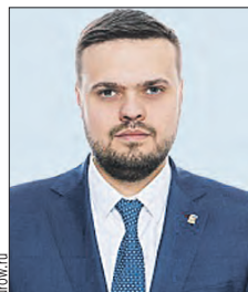
ТУРОВ Артем Викторович Председатель комиссии (Государственная дума)