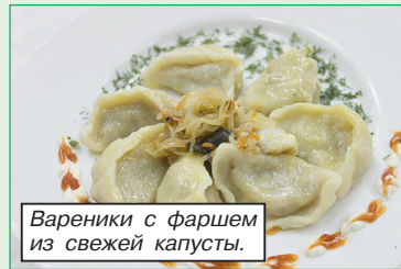
Вареники с фаршем из свежей капусты.

В целях популяризации белорусской национальной кухни не только в объектах придорожного сервиса, но и в общедоступной сети предприятий общественного питания Белкоопсоюза разработано и утверждено типовое меню из белорусских блюд, которое отражает колорит и самобытность нашей культуры. Блюда выделены в меню отдельным цветом.