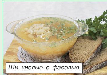
Щи кислые с фасолью.