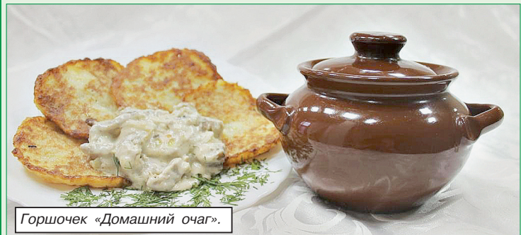
Горшочек «Домашний очаг».