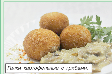
Галки картофельные с грибами.

Еженедельно Белкоопсоюз проводит акцию «Блюдо недели белорусской кухни» в сети ресторанов потребительской кооперации.