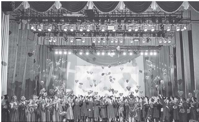
Ввысь взметнулись шарики в виде сердец.