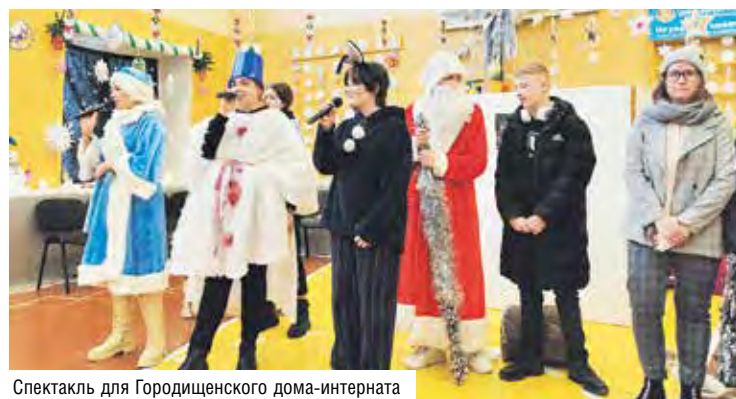
Спектакль для Городищенского дома-интерната

– Воспитательный отдел колледжа и волонтеры интересуются жизнью социальных учреждений за пределами Барановичей. В этот раз учащиеся для оказания помощи Городищенскому дому-интернату разработали афишу о проведении благотворительного сбора, рас-