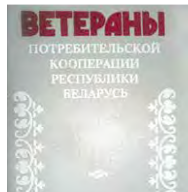
О кооператорах, принимавших участие в Великой Отечественной войне, можно прочитать в книгах «Потребительская кооперация Белорусской ССР» (1989 год) и «Ветераны потребительской кооперации Республики Беларусь» (1993 год)

Цель денежной реформы 1947 года – вывод из оборота излишков наличности. Государство