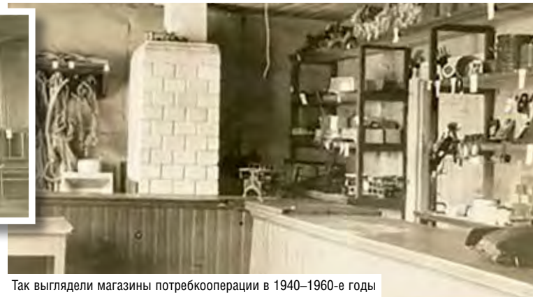
Так выглядели магазины потребкооперации в 1940–1960-е годы

Правление Центросоюза выделяет целевые ссуды для возрождения кооперативных обществ. К концу 1945-го торговая сеть потребкооперации – треть довоенной, а сеть общепита – 45 процентов. Розничный товарооборот соответственно 57 и 52 процента от довоенного уровня. Товарные запасы – 1 процент от всех по СССР. ЦК КП(б)Б и Правление Белкоопсоюза разработали программу развития предприятий торговли и общественного питания, баз и складов, реализация которой упиралась в ограниченные финансовые и материальные возможности. Тем не менее в 1946–1949 годы сеть приросла более чем на треть, а к началу 1950-х этот показатель стабилизировался на уровне 102–104 процента.