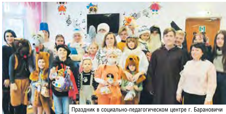
Праздник в социально-педагогическом центре г. Барановичи