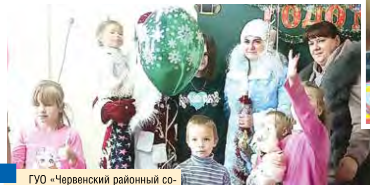
ГУО «Червенский районный социально-педагогический центр» – временный дом для детей, оставшихся без опеки родителей. После ребята отправляются в новую семью или детский дом.

А просьбы у каждого из сестер воспитанников разные: начиная от машинок, рю-