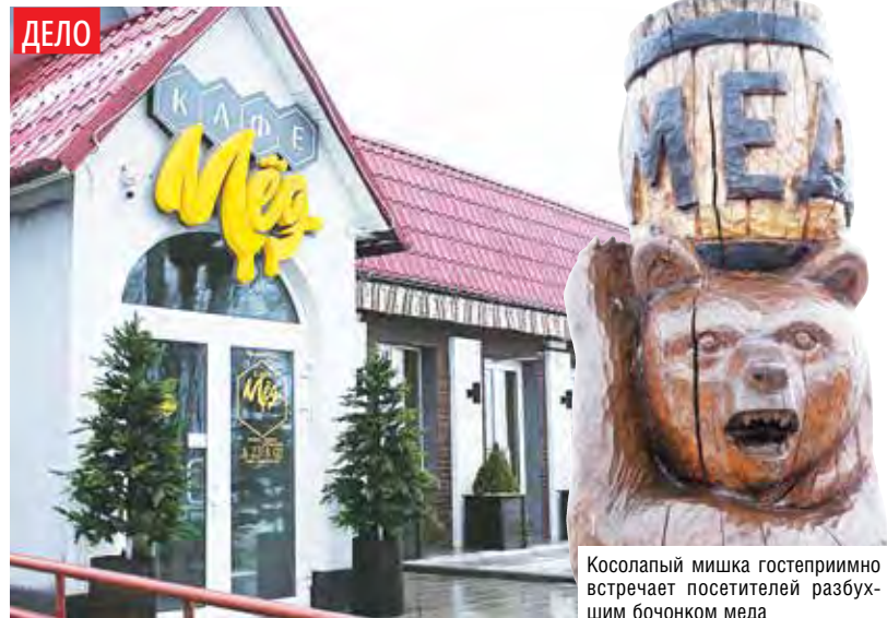
Косолапый мишка гостеприимно встречает посетителей разбухшим бочонком меда