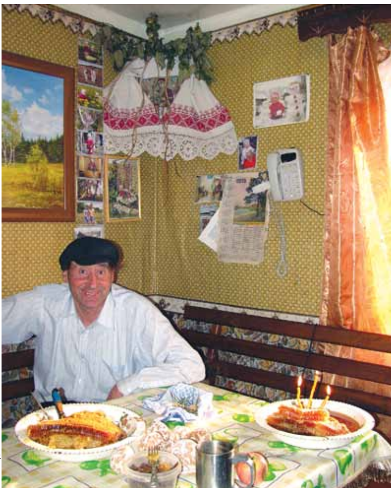
Пчальяр з вёскі Судзілы Клімавіцкага раёна ў сваёй хаце

Уздоўж сцен ад кута ішлі лавы: звычайна яны стаялі акурат пад вокнамі. Напрыклад, ва Усходняй