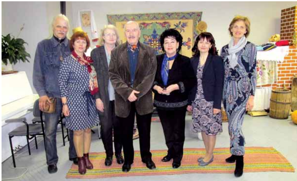
Мастакі з суполкі “Маю гонар” у Цэнтры беларускай культуры

Другая ж выстава, пра якую хочацца расказаць, ладзілася ў Цэнтры бе-