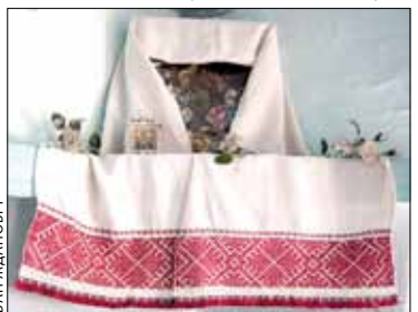
Абраз у чырвоным куце

Ішоў час, віравалі новыя энергіі... За часамі хрысціянства правілам стала размяшчаць у чырвоным куце хаты розныя культуравыя рэчы. Якраз туды памяшчалі, ставілі абразы, ручнікі-набожнікі, грамнічныя свечкі, святыя кнігі ды святую ваду. І не толькі! Скажам, паводле традыцый, што бытавалі ва ўсходняй частцы Беларусі, калі хлопца забірлі ў рэкруты з нейкага двара, то як выпраўлялі яго — са следа бралі крыху зямлі, завязвалі ў вузельчык ды клалі на покуці. Самі ж абразы стараліся не вешаць там, а ставіць: на адмыслова прымацавання для таго драўляныя планкі-падстаўкі. Дзе-нідзе іх нават упрыгожвалі разьбою. Таксама маглі рабіць для абразоў і адмысловыя шафы. На кожны абраз