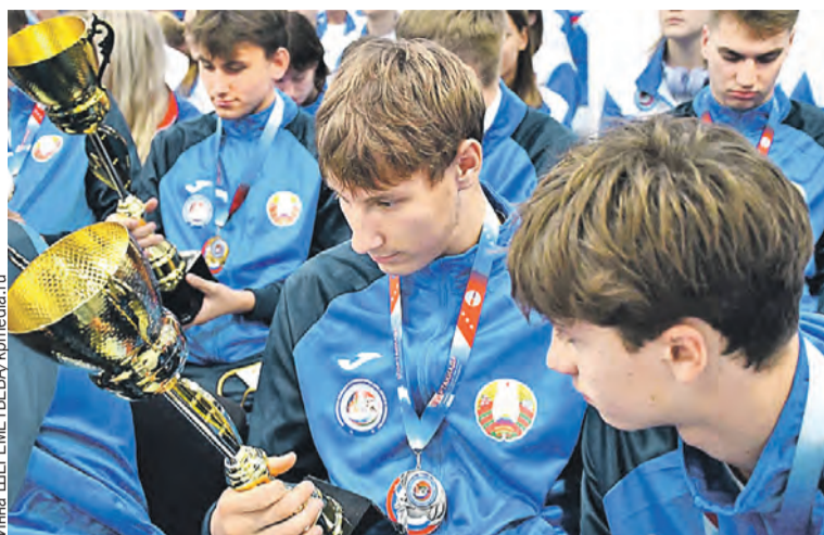
Спартакиада Союзного государства для детей и юношества – трамплин на серьезные турниры.

Так получается, что белорусы в Россию заглядывают все-таки чаще. И приезжают не просто участвовать, а побеждать. Уже не раз и не два они щелкали россиян по носу в их же родных стенах, забирая главные призы. Например,