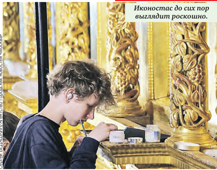
Иконостас до сих пор выглядит роскошно.

имеет особое значение. Лоза – символ Христа, источника жизни для людей. Есть еще одно толкование: лоза – это Церковь, ее члены – ветви. Виноградные грозди, которые клюют птицы, символизируют причастие и жизнь во Христе. Ветхий Завет ассоциируется с Землей обетованной, а Новый Завет – с раем. Кисть винограда, состоящая из множества ягод, символизирует знания, которые человек получает в жизни.