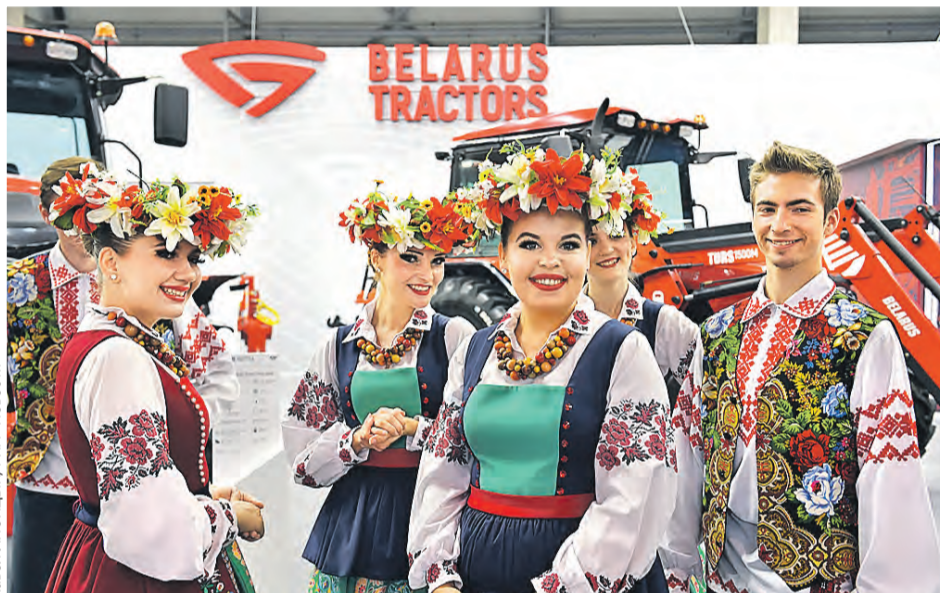
Многочисленные выставки и ярмарки помогают производителям продвигать свои новинки.