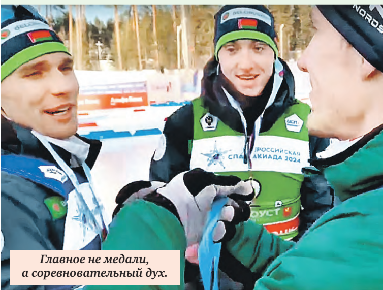
Главное не медали, а соревновательный дух.

И на церемонии награждения стояли в стороне от пьедестала. Картинка, конечно, не очень комильфо. Вот ребята из Башкортостана и решили сами, не оглядываясь на закорючки регламента, восстановить справедливость.