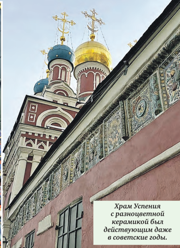
Храм Успения с разноцветной керамикой был действующим даже в советские годы.

Затейливый растительный орнамент на изразцах церкви на Таганке называется «павлинье око» – за сходство с глазком на ярком наряде этой