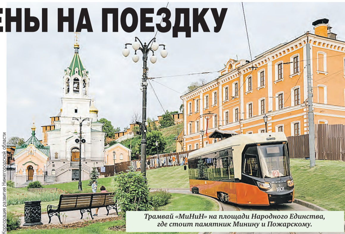
Трамвай «МиНиН» на площади Народного Единства, где стоит памятник Минину и Пожарскому.

Корпорация развития Нижегородской области