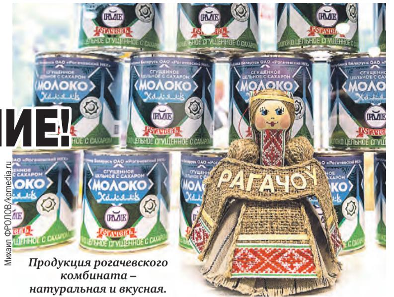
Продукция рогачевского комбината – натуральная и вкусная.

– Наверное, не буду оригинальным, сказав, что любимое местное блюдо – драники. Но это действительно так. Знаю, что сейчас существует множество вариантов приготовления. Современные повара придумывают новые рецепты, но мне по душе самые классические, домашние.