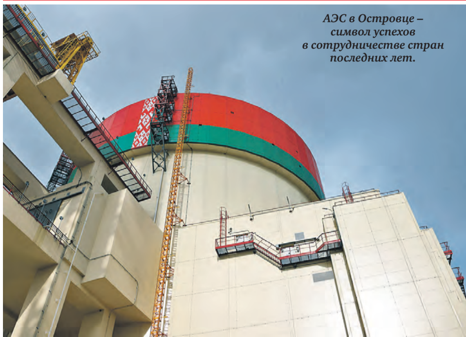
АЭС в Островце – символ успехов в сотрудничестве стран последних лет.