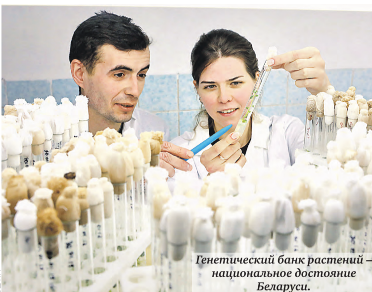
Генетический банк растений – национальное достояние Беларуси.

центра и повторяет: – Но санкции изменили ситуацию коренным образом.