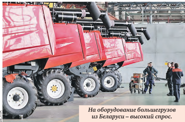
На оборудование большегрузов из Беларуси – высокий спрос.

– Алтайский край – один из важнейших аграрных регионов России. Сотрудничество в сфере АПК развивается?