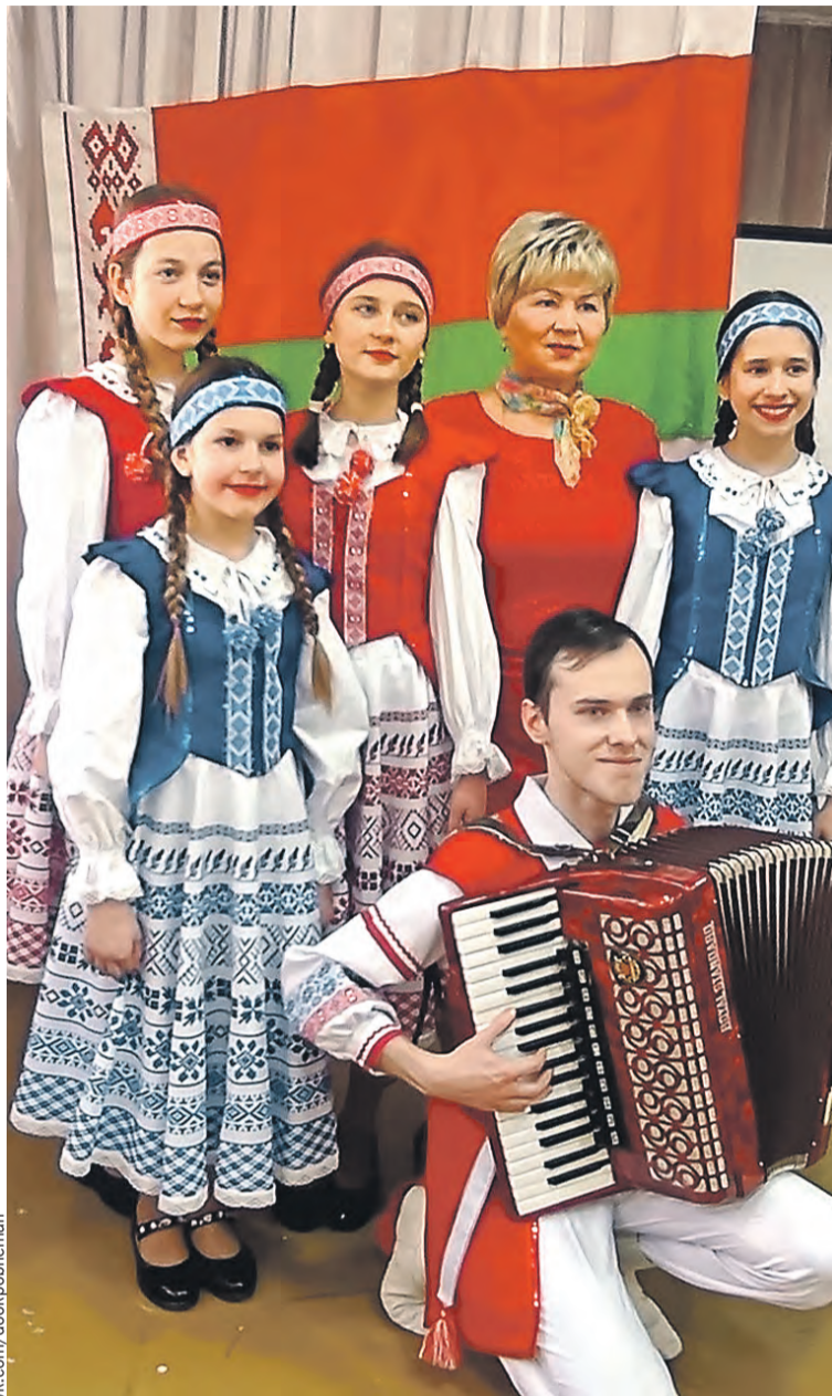
Сохранять свою идентичность важно всегда.

– Во всех российских регионах, где есть наши отделения, активисты участвовали в сборе и отправке гуманитарной помощи в зону СВО. А руководство автономии направило в регионы некоторые суммы от белорусских предпринимателей – пусть небольшие, по сто – двести тысяч рублей – чтобы на местах наш актив мог ими распорядиться в зависимости от конкретных условий. Они пошли в первую очередь на помощь госпиталям, где были раненые военные, – лекарствами, перевязочными средствами. На пункты временного размещения беженцев, на организацию