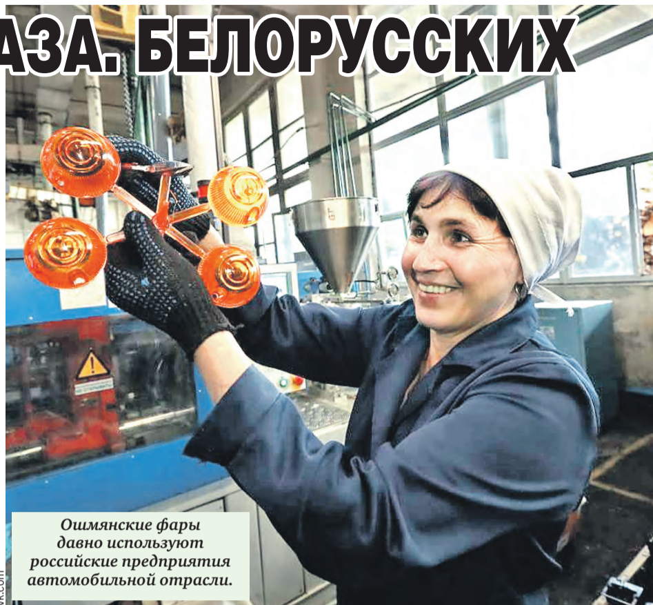
Ошмянские фары давно используют российские предприятия автомобильной отрасли.

И сейчас сделали акцент на новых технологиях. Например, в Ошмянах выпускают профилированные ре-