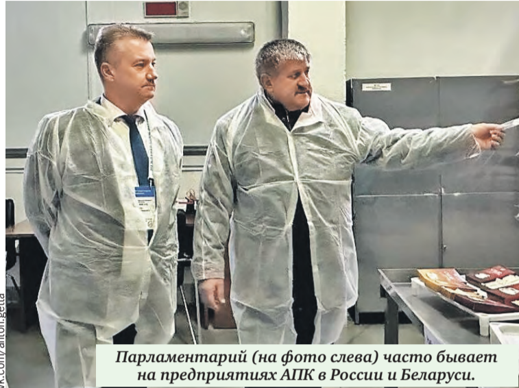
Парламентарий (на фото слева) часто бывает на предприятиях АПК в России и Беларуси.

– Очень нравится бывать в Беларуси. В конце февраля посетил республику в составе делегации Парламентского Собрания в рамках Миссии СНГ по наблюдению за выборами. Приезжал вместе с семьей. С удовольствием провели время в Минске. Очень душевный город. Музей истории Великой Отечественной войны просто поразил нас. Действительно, один из лучших современных музеев, посвященных трагическим дням нашей общей истории.