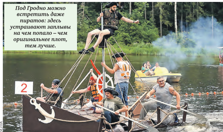
Под Гродно можно встретить даже пиратов: здесь устраивают заплывы на чем попало – чем оригинальнее плот, тем лучше.