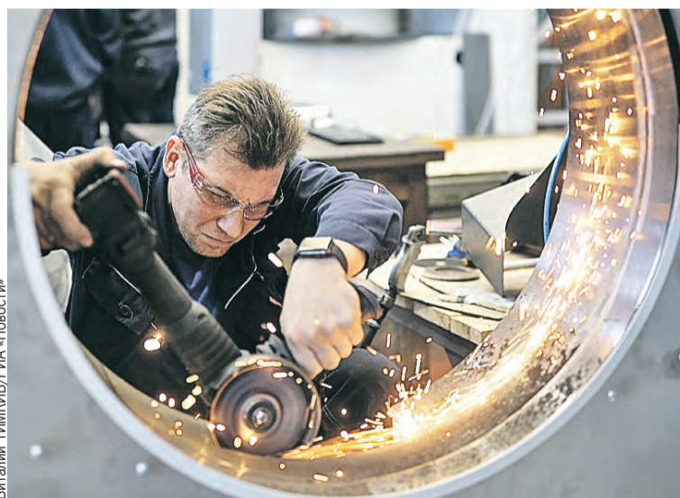
Скоро обработка деталей руками будет восприниматься как архаизм. За человека начнет работать автомат.