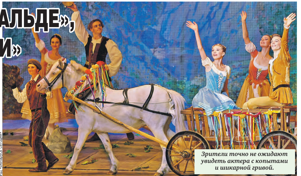
Зрители точно не ожидают увидеть актера с копытами и шикарной гривой.

– Это удивительно, но я ем много, и мне, как правило, не хватало. Наверное, такая конституция досталась от родителей – они были спортивно-телосложения, потому что всегда трудились, никто не сидел без дела. Поэтому и в моей жизни ключевым моментом была работа. Проблем с диетой никогда не было. Это притом что я нормально питаюсь: не могу без супа, без мяса, мне нужно поддерживать состояние бодрости, а это удается благодаря кофе и хорошей еде.