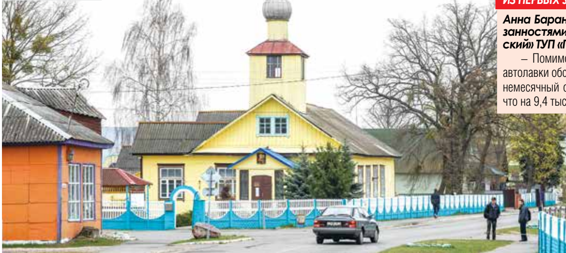
г. Наровля. Церковь св. Иоанна Богослова

возим свежее мясо, рыбу, мороженое. Один автомагазин обслуживает 13 деревень, второй – 23. С началом дачного сезона маршрутная сеть расширяется – летом сельское население заметно увеличивается.