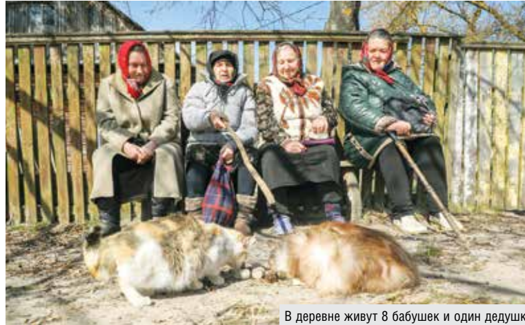
В деревне живут 8 бабушек и один дедушка