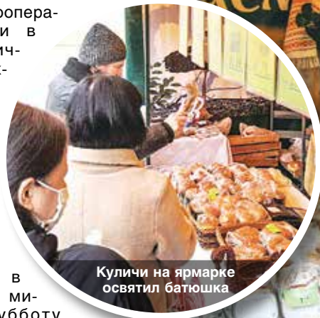
Куличи на ярмарке освятил батюшка