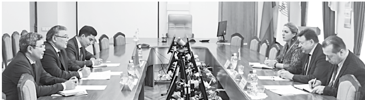
Переговоры с Чрезвычайным и Полномочным Послом и советниками Посольства Республики Казахстан в Республике Беларусь в аппарате Белкоопсоюза

Однако абсолютным лидером по экспорту в январе – марте стала пушнина: темп роста – 164,1 процента к уровню того же периода прошлого года. Почти на 40 процентов больше отправлено за рубеж дикорастущих ягод, на 29,3 процента – готовой пищевой продукции и на 28 процентов больше отгружено за пределы страны говядины. Неплохо продаются и свежие овощи и фрукты, темп роста за первый квартал 2020-го к первому кварталу 2019 года – 103,9 процента.