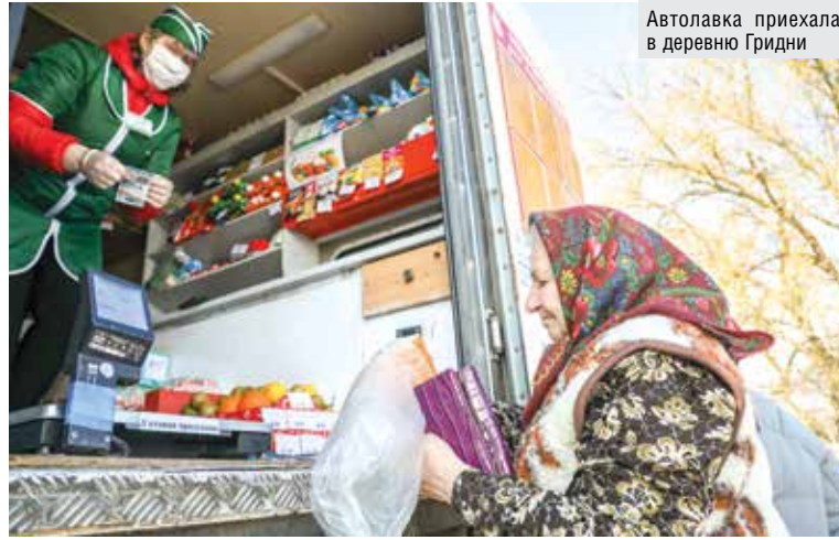
Автолавка приехала в деревню Гридни