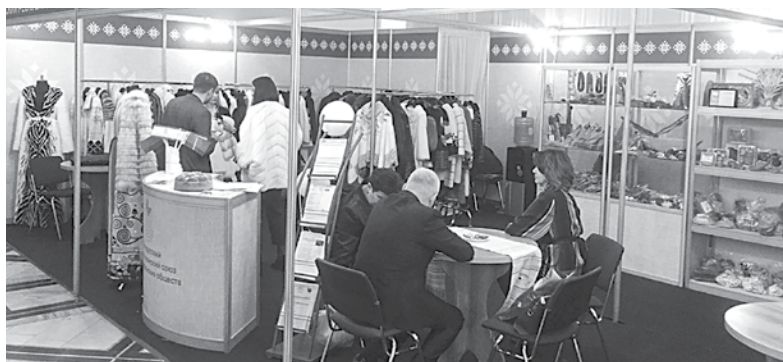
Стенд потребкооперации на Белорусско-узбекском аграрном форуме в Ташкенте