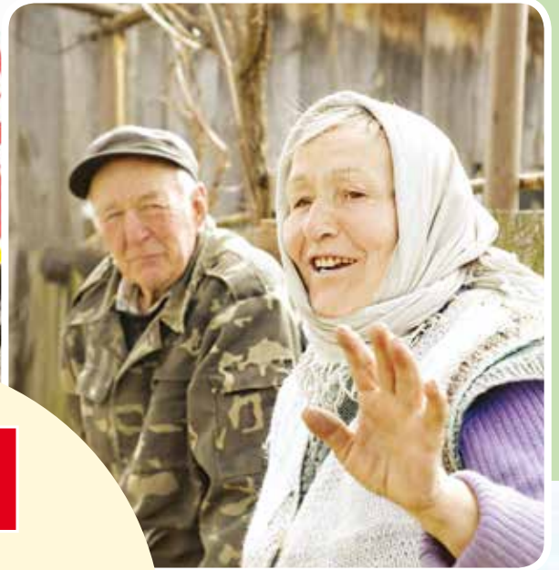
Коллаж Татьяна ГОРБАЧ