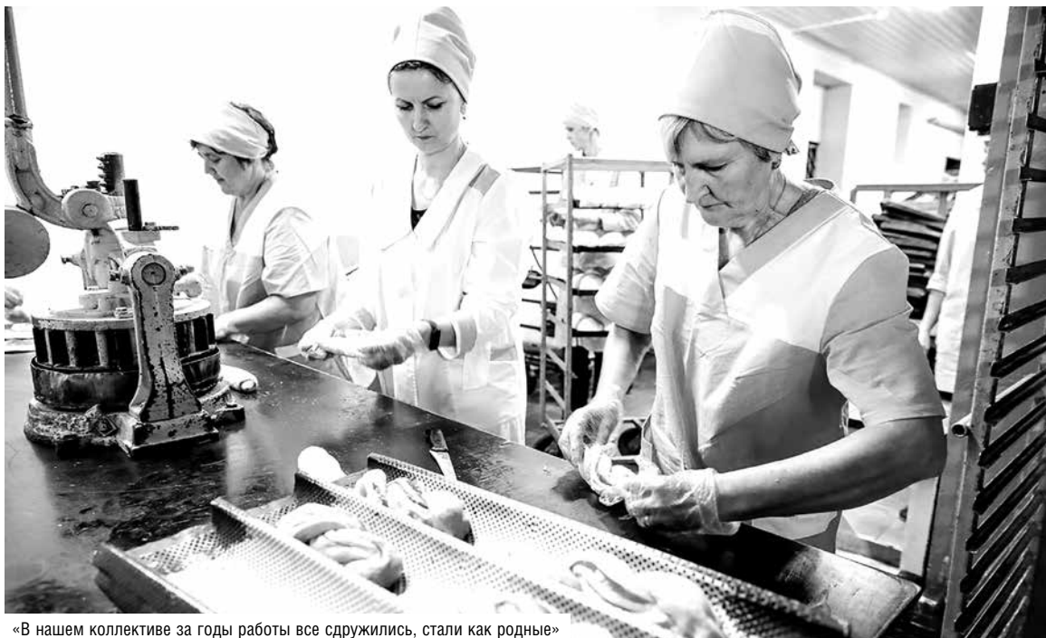
«В нашем коллективе за годы работы все сдружились, стали как родные»

Свислочская пекарня в месяц выпекает 55 тонн хлебо-