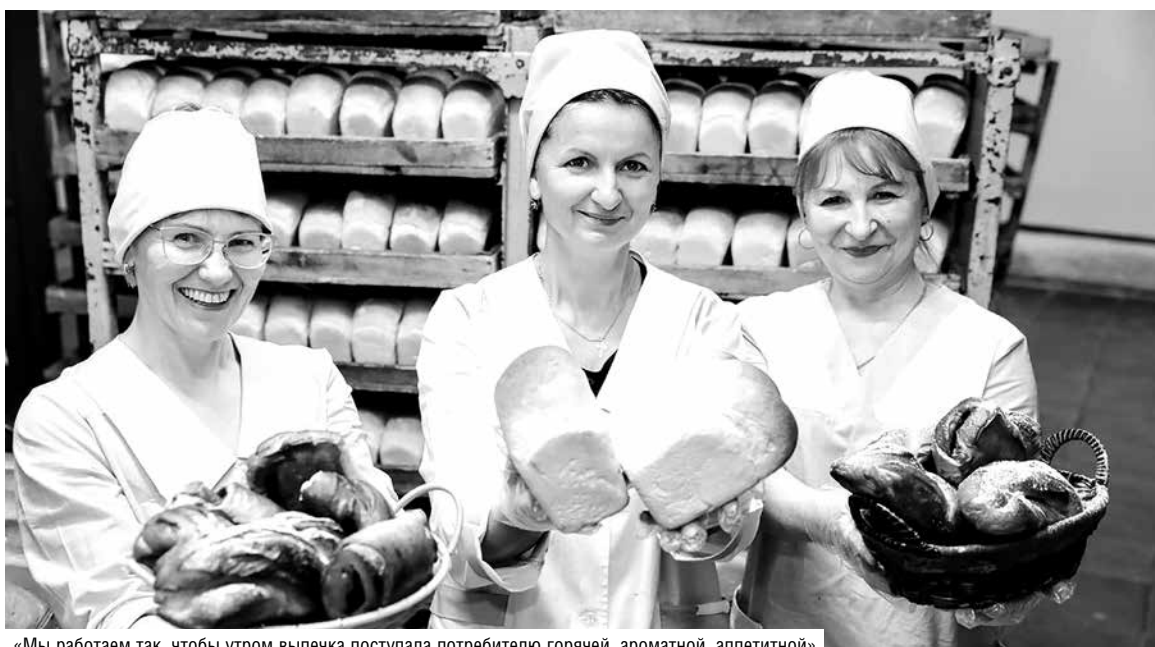
«Мы работаем так, чтобы утром выпечка поступала потребителю горячей, ароматной, аппетитной»