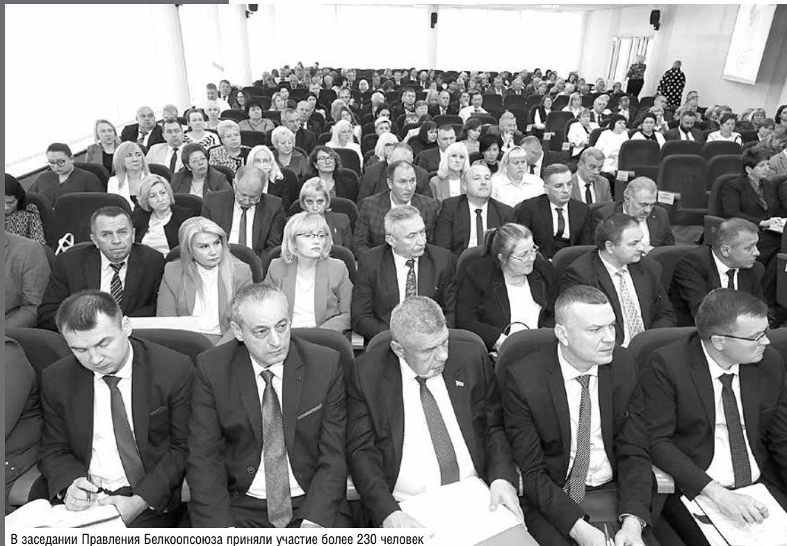
В заседании Правления Белкоопсоюза приняли участие более 230 человек

Необходимо также максимально задействовать резервы