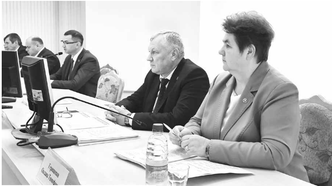
На повестке дня – выполнение параметров развития за 8 месяцев и состояние расчетно-платежной дисциплины