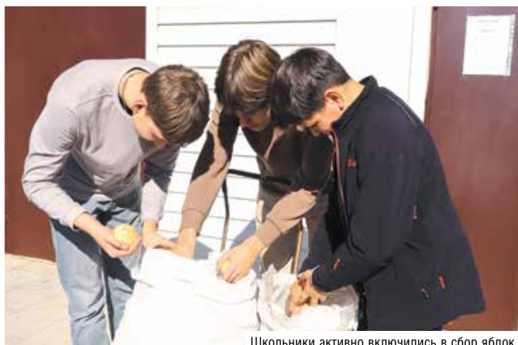
Школьники активно включились в сбор яблок