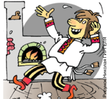
Рисунок: Николай ГИРГЕЛЯ

«Когда ему (архитектору) заказывали план, то он обыкновенно чертил сначала зал и го-