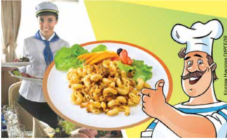
Коллаж: Николай ГИРГЕЛЯ

В русском военном флоте XVIII века по уставу макароны были не положены. В общий котел запрещалось класть продукты не из корабельных припасов. Исключением были только свежее мясо и рыба. Но начиная с конца XIX века, вопреки Морскому уставу, было принято после тяжелых работ готовить матросам макаронные изделия с мясом.