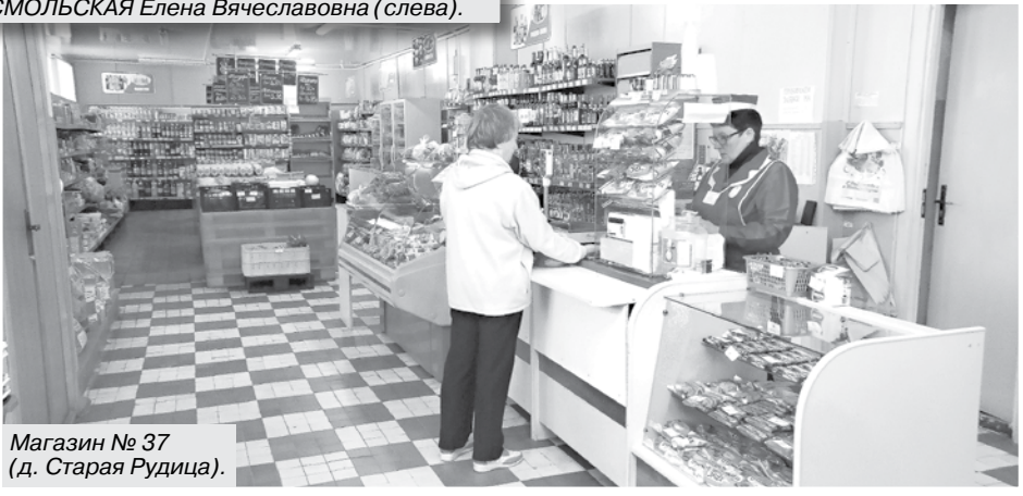
Магазин № 37 (д. Старая Рудица).