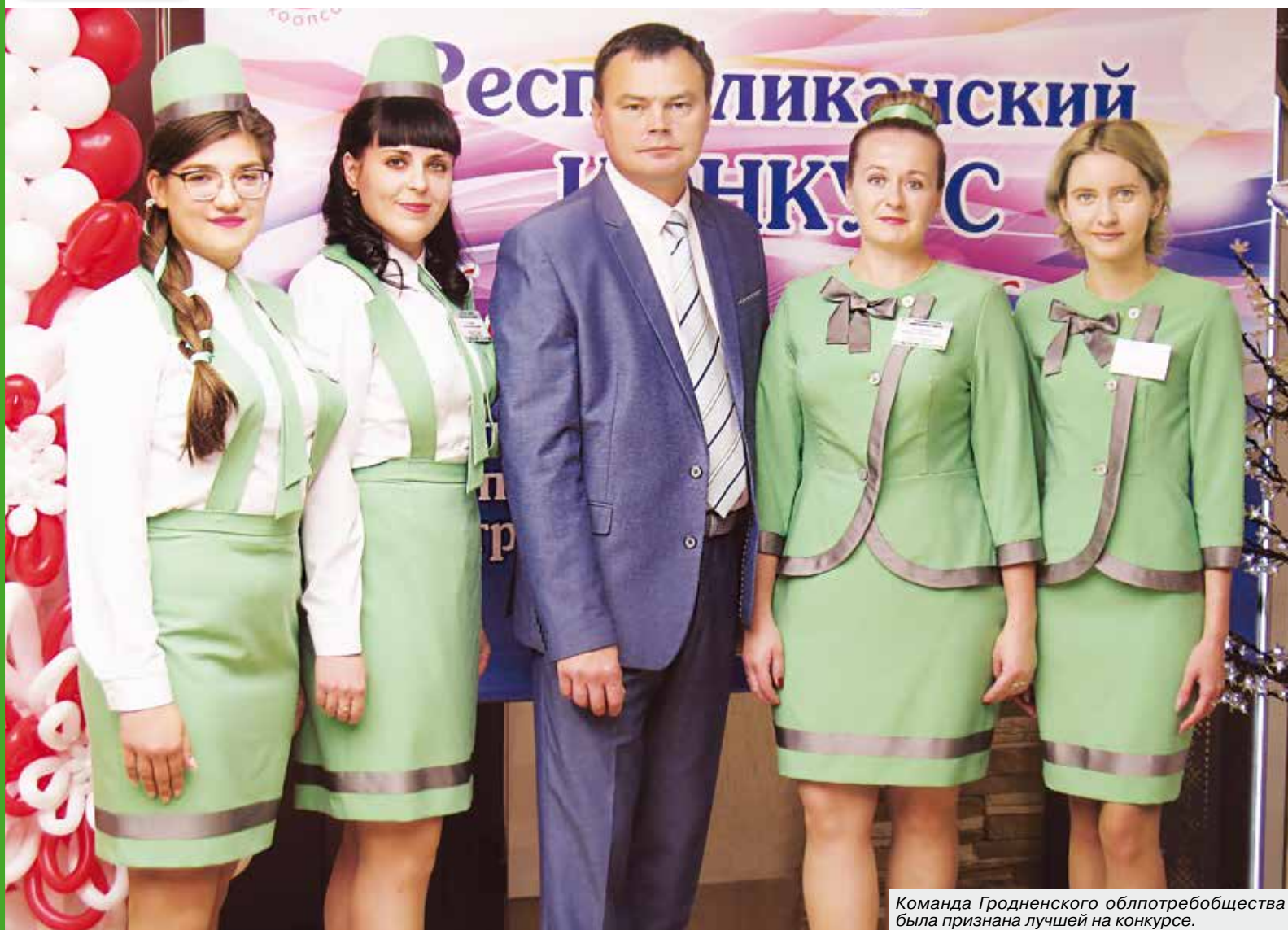
Команда Гродненского облпотребобщества была признана лучшей на конкурсе.