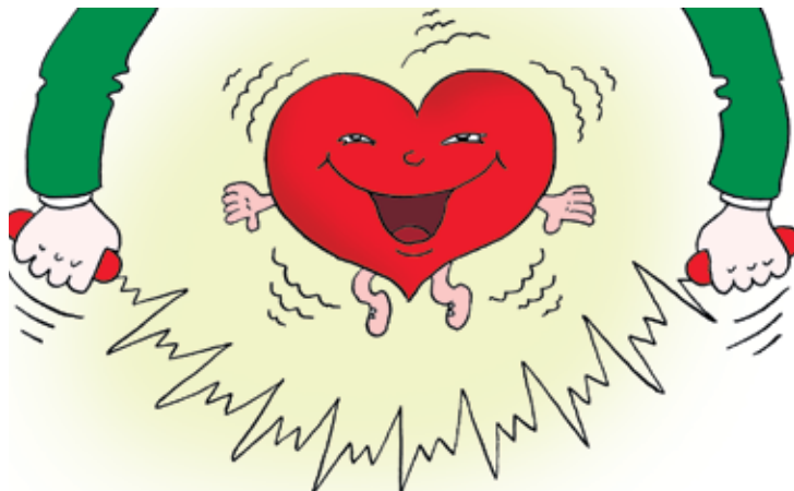
Рисунок Олега ПОПОВА

Всемирный день сердца проводится под девизом «Сердце для жизни». В партнерстве с ВОЗ Всемирная федерация сердца организует мероприятия более чем в 100 странах. В программу Дня сердца входят массовые проверки здоровья, публичные лекции, спектакли, научные форумы, выставки, концерты, фестивали, организованные прогулки и спортивные состязания. Каждый год мероприятия, проходящие в рамках Дня сердца, посвящены определенной теме, связанной со здоровьем сердца. В настоящее время сердечно-сосудистые заболевания являются главной причиной смерти в мире: ежегодно они уносят более 17 миллионов человеческих жизней.