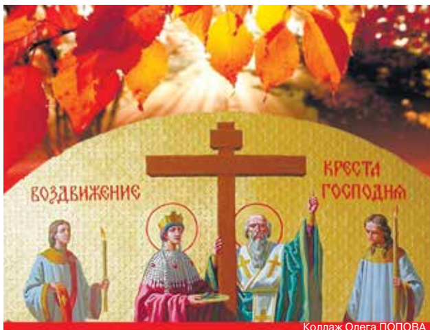
Коллаж Олега ПОПОВА

Считалось, что молитвы в этот день обладают особой силой. Если в этот день искренне помолиться или попросить о чем-нибудь, это обязательно будет исполнено.