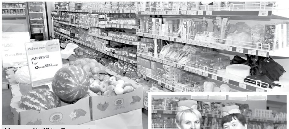
Магазин № 46 (д. Боровое).

Время идет, все меняется, стремительно растут требования покупателей. Поэтому необходимо постоянно совершенствовать материально-техническую базу. Эта важная работа продолжается в райпо и в 2019 году. Что же сделано конкретно? Приобретено 36 единиц терминального оборудования. Еще 32 контрольно-суммирующих аппарата, 10 единиц холодильного оборудования. Установлено два кондиционера. Замена торгового оборудования производится постоянно. Так вот и обновляется эта важнейшая отрасль, с учетом имеющихся возможностей.