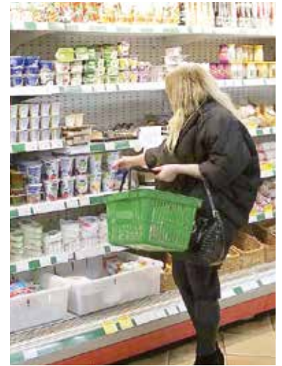
Всегда широкий ассортимент в магазине «PROЗапас» агрогородка Лесной

– Мы серьезно занимаемся организацией выездной торговли.