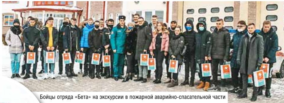
Бойцы отряда «Бета» на экскурсии в пожарной аварийно-спасательной части

В Барановичском технологическом колледже Белкоопсоюза создан Молодежный отряд охраны правопорядка «Бета»