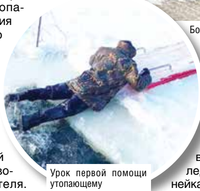
Урок первой помощи утопающему

«равный обучает равного». В их обязанности входит охрана правопорядка в общежитиях и учебных корпусах колледжа, а также на прилегающей к ним территории, на дискотеках, вечерах отдыха, общеколледжных мероприятиях и линейках. Патрулирование территории ведется еженедельно.