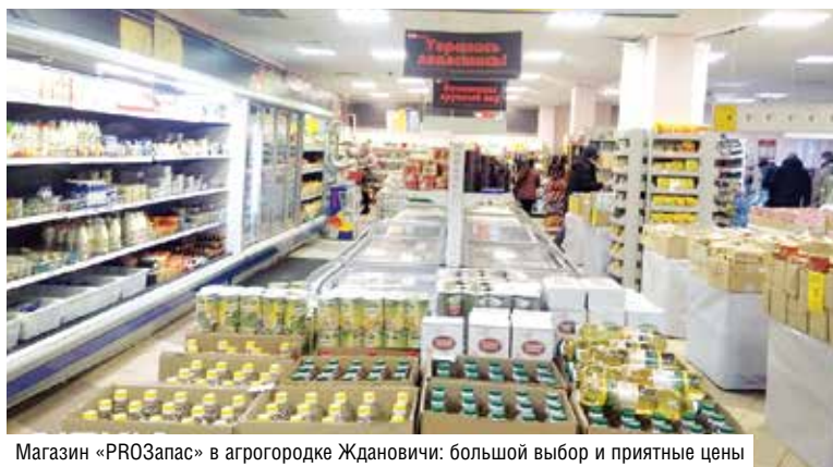
Магазин «PROЗапас» в агрогородке Ждановичи: большой выбор и приятные цены

нать развиваться. Активно занимаемся вопросами модернизации магазинов по современным требованиям. Только за предыдущий год мы их отремонтировали 37. Но привлекаем покупателей не одним только внешним видом, конечно. Постоянно работаем над товарным ассортиментом и организовываем для покупателей приятные скидки и акции. В наших магазинах хозяйственных товаров есть даже специальные дни скидок по примеру минских универмагов. И за выходные, например, выходит отличная выручка – на уровне недельной. Уже давно мы работаем с кредитами по непродуктовому товару и с распродажами по карте «Халва». Покупателей привлекают такие выгодные условия.