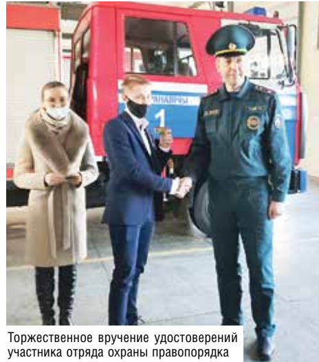
Торжественное вручение удостоверений участника отряда охраны правопорядка