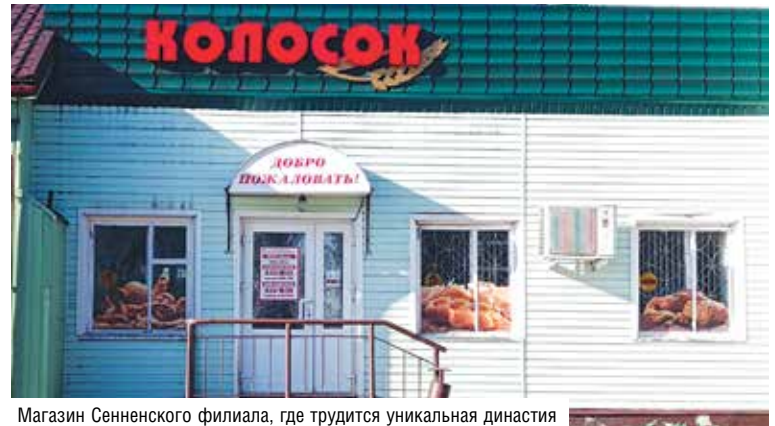
Магазин Сенненского филиала, где трудится уникальная династия

– В детстве, когда мы с бабушкой шли по городу, всегда удивлялась, что с ней все здороваются. Буквально все. Это же так здорово, думала, когда тебя все знают и уважают.