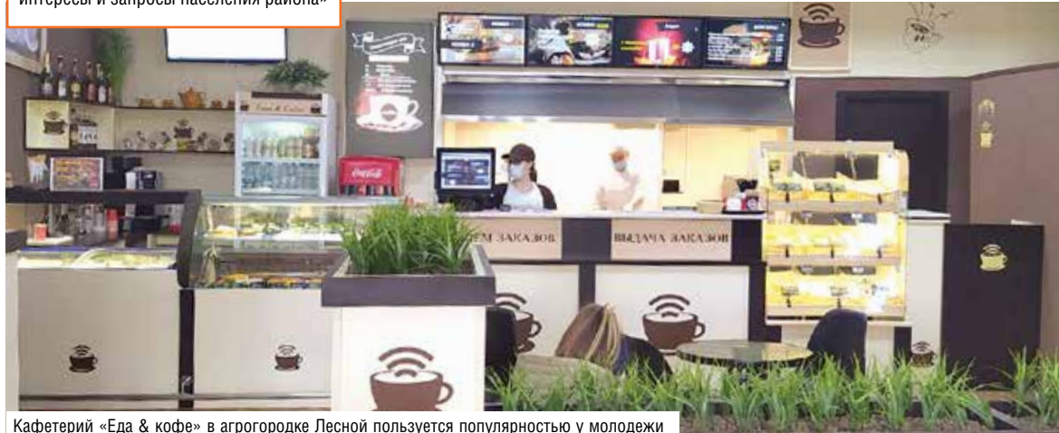
Кафетерий «Еда & кофе» в агрогородке Лесной пользуется популярностью у молодежи

«В 2021 году будем продолжать реконструкцию и модернизацию магазинов, займемся отработкой новых проектов по сети общественного питания. Продолжим масштабную автоматизацию торговли. Только одна задача из года в год практически не меняется – у филиала превыше всего были и остаются интересы и запросы населения района»