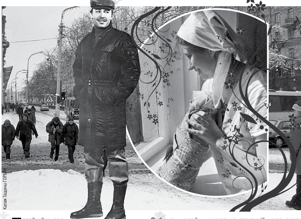
Калаж Таццяны ГОРБАЧ

І сапраўды насустрач вясёламу мужчыну ішлі аж тры міліцыянеры. А вясёлун у прыгожым дэмісезонным паліто як спяваў, так і спяваў.