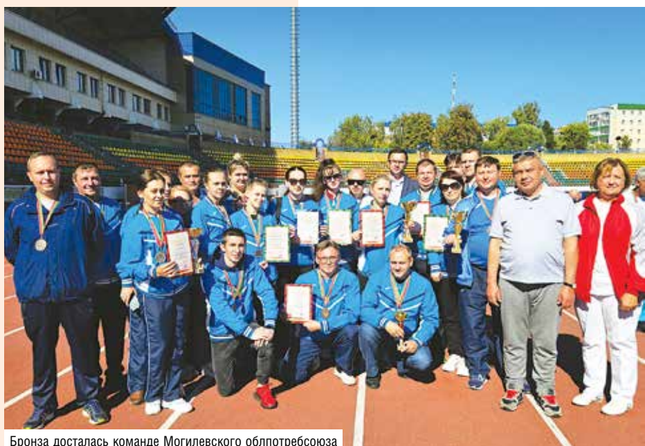
Бронза досталась команде Могилевского облпотребсоюза

ПРЕДСЕДАТЕЛЬ ПРАВЛЕНИЯ БРЕСТСКОГО ОБЛПОТРЕБСОЮЗА И МНОГОЧИСЛЕННЫЙ КОЛЛЕКТИВ РАБОТНИКОВ СИСТЕМЫ ПОТРЕБИТЕЛЬСКОЙ КООПЕРАЦИИ БРЕСТСКОЙ ОБЛАСТИ