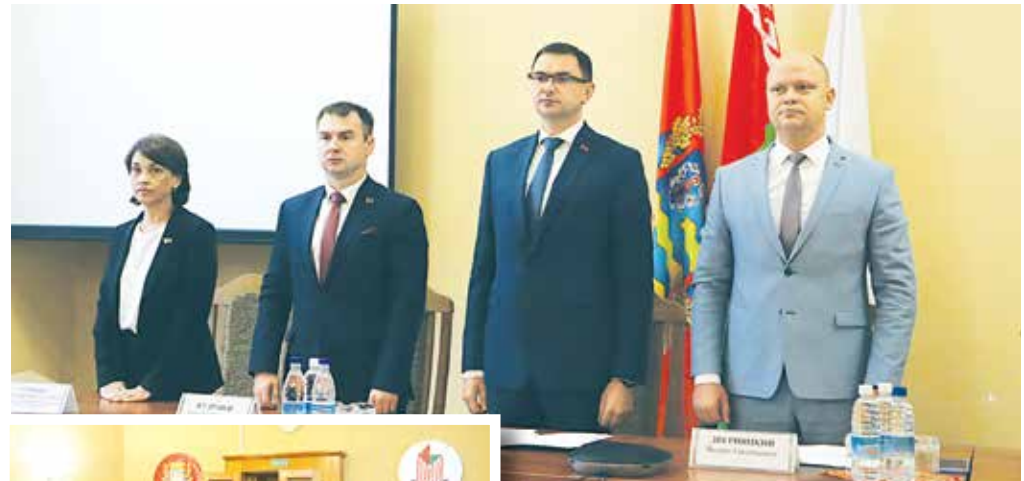
Во время внеочередного общего собрания представителей членов Минского облпотребсоюза

– В работе я привык опираться на свой коллектив и надеюсь, что в вашем лице тоже найду поддержку. Глава государства поставил задачу по-