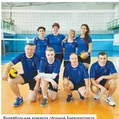
Волейбольная команда сборной Белкоопсоюза

Желаем вам и в дальнейшем только побед – побед не только в спорте, но и в работе и личной жизни, крепкого спортивного здоровья, счастья, мира, добра и благополучия!