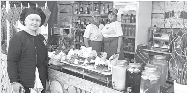
Силами Гомельского филиала была организована работа пяти точек торговли и общепита

Руслан ПРОЛЕСКОВСКИЙ