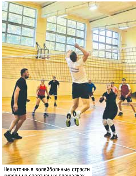
Нешуточные волейбольные страсти кипели на спортивных площадках