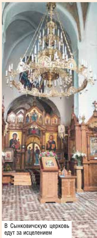
В Сынковичскую церковь едут за исцелением