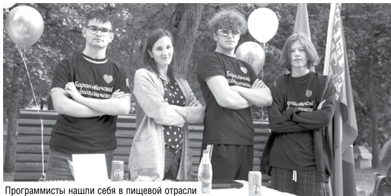
Программисты нашли себя в пищевой отрасли

питания. Ребята демонстрировали опыты с химическими реактивами и продуктами.