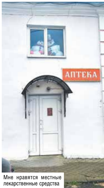
Мне нравятся местные лекарственные средства