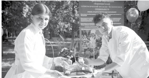
Шедевр кондитерского искусства – гигантский пряник в форме Беларуси

– Мы предстали как многопрофильное учебное заведение, где изучаются самые разные дисциплины – от биотехнологий до разработок программных продуктов. Нам удалось показать и рассказать, какими интересными идеями живем, какая талантливая молодежь у нас учится.