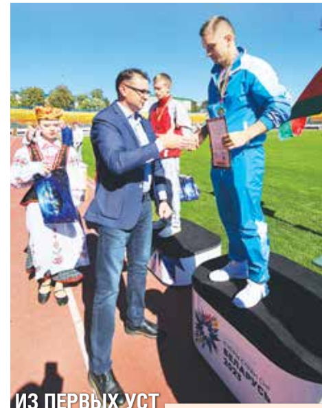
ИЗ ПЕРВЫХ УСТ