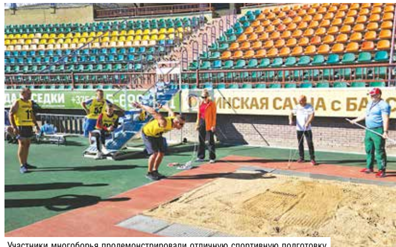
Участники многоборья продемонстрировали отличную спортивную подготовку

Игроков со всей страны в этом году радушно принимали чемпионы прошлых лет – кооператоры Гродненщины. Финальные старты проходили 15 и 16 сентября в областном комплексном центре олимпийского резерва. За звание лучших участники боролись в шести видах спорта: многоборье «Здоровье», волейбол, настольный теннис, дартс, шахматы и шашки. Хозяева постарались, и турнир стал настоящим праздником молодости, энергии и задора.