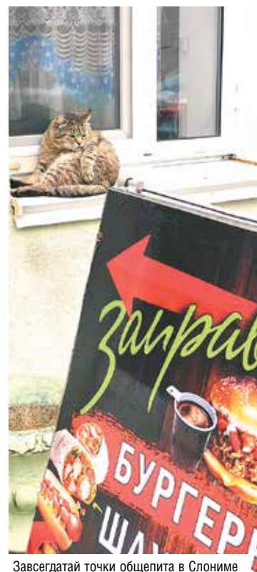
Завсегдадай точки общепита в Слониме

трой толщены стены, четыре угловые башни, бойницы и машикули (навесные бойницы, расположенные в верхних частях стен) по фасаду свидетельствуют о том, что здание имело и оборонительное значение. Сейчас они, конечно, играют декоративную роль, превратились в элементы внешнего убранства церкви, которые и придают ей неповторимый облик. В верхней части главного фасада располагается редкий архитектурный элемент – фонарик, который служил наблюдательным пунктом.