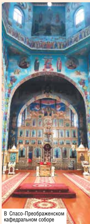
В Спасо-Преображенском кафедральном соборе