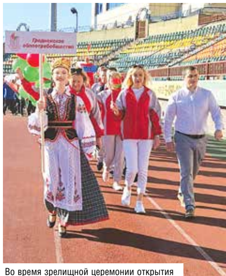
Во время зрелищной церемонии открытия

Соревнования у теннисных столов продолжались несколько часов подряд — каждый участник отыграл 6 раундов по 3 пар-