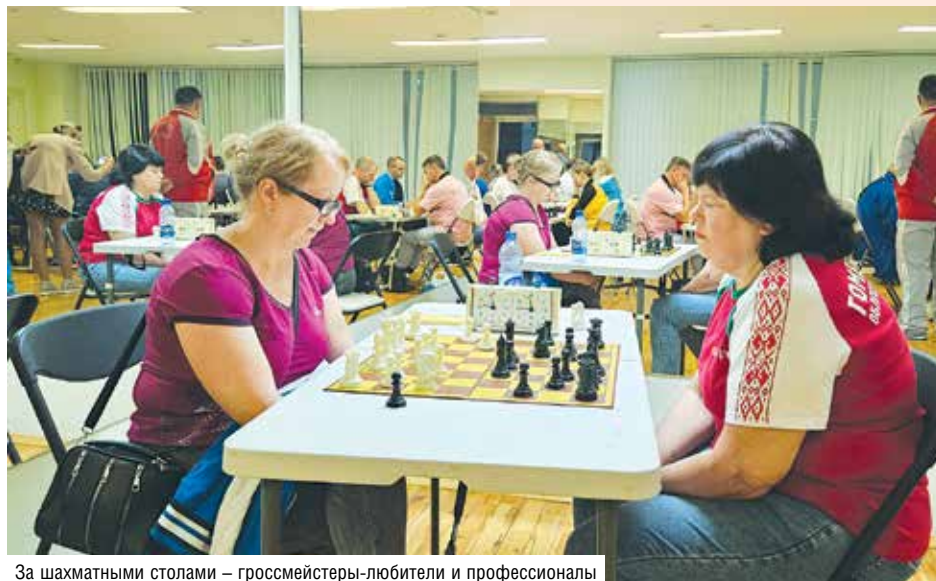
За шахматными столами — гроссмейстеры-любители и профессионалы