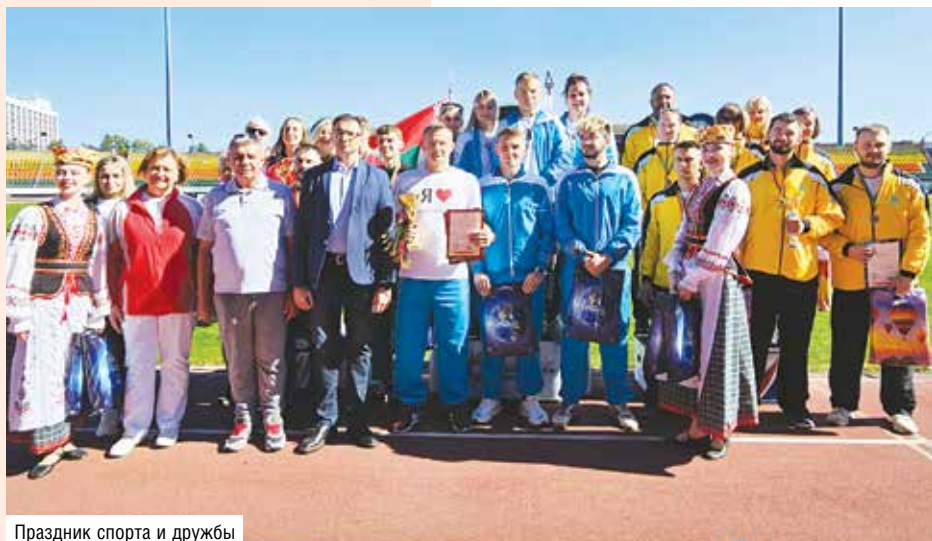
Праздник спорта и дружбы