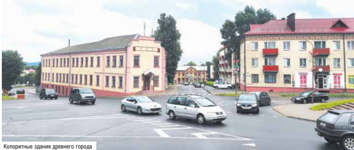
Колоритные здания древнего города

Сейчас синагога выставлена на аукцион, который пройдет в октябре на площадке «БУТБ-