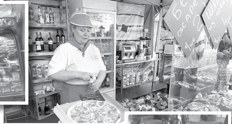
Кооператоры торговали в основном продукцией собственного производства

Отдельно стоит отметить красочное оформление торговых мест. Эстетичный прилавок – немаловажная деталь, задающая общий фирменный стиль.