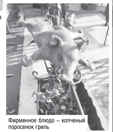
Фирменное блюдо – копченый поросенок гриль

Два дня оживленной торговли на открытом пространстве стали хорошей репетицией перед началом осенних ярмарок. Гомельский филиал облпотребобщества будет участвовать в них на протяжении всего октября в населенных пунктах Гомельского, Добрушского и Буда-Кошелевского районов. Покупателей ждет большой выбор сезонной сельхозпродукции: свеклы, капусты, моркови, лука и, разумеется, картофеля. Второй для белорусов хлеб, судя по качеству урожая и количеству хороших предложений от поставщиков, в этом году удался на славу.