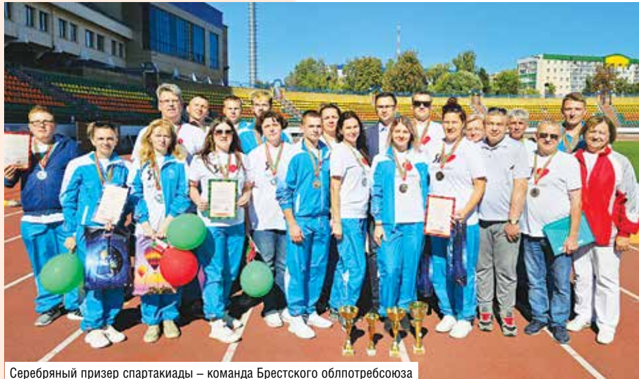
Серебряный призер спартакиады – команда Брестского облпотребсоюза

КОМАНДА МИНСКОГО РЕГИОНА СТАЛА ПОБЕДИТЕЛЕМ XXXI РЕСПУБЛИКАНСКОЙ