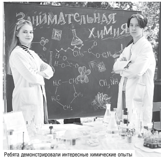
Ребята демонстрировали интересные химические опыты