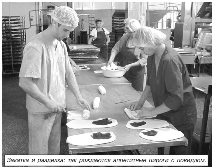
Закатка и разделка: так рождаются аппетитные пироги с повидлом.

В настоящее время предприятие планирует освоить производство двух новых наименований хлеба — «Повседневный» и «Гармония». Отличительная их особенность — добавление крахмала. С вкусовыми и прочими достоинствами такого хлеба дятловские кооператоры ознакомились во время семинара-совещания по вопросам хлебопечения, не так давно проведенного Гродненским облпо в Островце. Тамешние коллеги такой хлеб уже выпекают — рецептура получила одобрение экспертного совета. Свой образец испекли и дятловские кооператоры: пока что его изучают специалисты