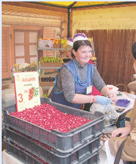
Клюква на ярмарке пользовалась повышенным спросом.

десятков саженцев. За саженец малины здесь просили полтора рубля, в то время как на соседней улице все пять.