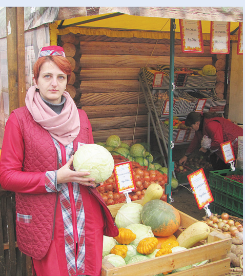
Капуста у дзержинских кооператоров и лепа видом, и красна ценою — всего 28 копеек за килограмм.

Воложинское райпо предлагало все для сада и огорода — от товаров непродовольственной группы до саженцев. Тут тоже не обошлось без открытий и сюрпризов: еще только утро первого дня работы, а уже реализовано порядка двух