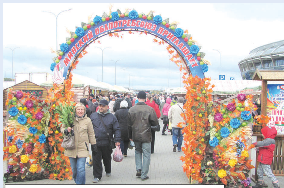
Минский облпотребсоюз приглашает!

Сельскохозяйственные ярмарки у «Чижовка-Арены» собирают покупателей по субботам и воскресеньям уже месяц. За это время, по словам представителей организаторов, наметился и своего рода тренд: продавцов от недели к неделе все больше, цены на многие виды продукции все ниже. Так, в минувшие выходные главная ярмарка столицы насчитывала