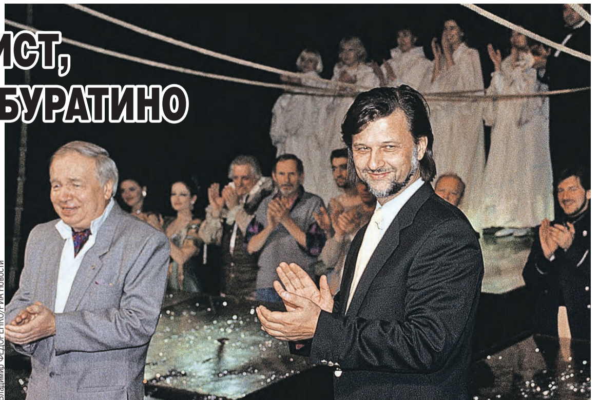
Для легендарного ленкомовского спектакля мазстро положил стихи Андрея Вознесенского (слева) на восхитительные мелодии.

– Это можно назвать модным словом «самоизоляция». Родители должны на