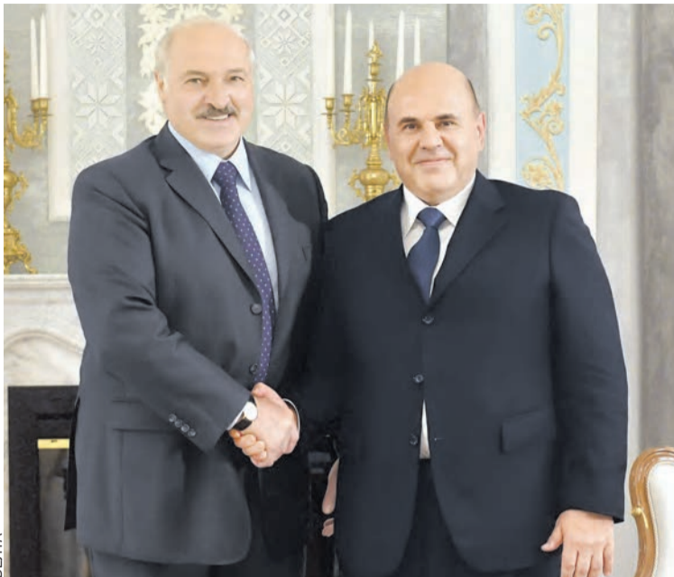
Александр Лукашенко с Михаилом Мишустиным обсудили в том числе и то, что происходит во время предвыборной гонки.

– Я бы хотел отметить перспективы наших братских союзнических отношений, которые заложены в союзном договоре. Вы были инициатором этого договора, отноше-