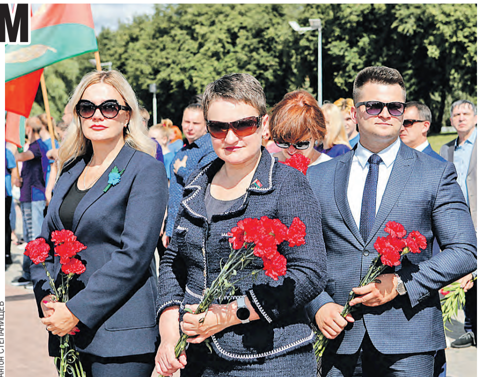
Союзные парламентарии Оксана Гайдук, Людмила Макарина-Кибак и председатель Молодежной палаты Парламентского Собрании Александр Лукьянов возложили цветы у мемориального комплекса «Три штыка».

– Впечатляют темпы строительства авиатерминала и самого логистического центра, – поделился впечат-