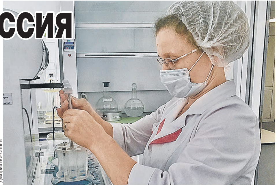
В лаборатории анализировали несколько вариантов, но зарекомендовал себя только один.

– Чувствовали себя наравне с врачами, спасающими жизни людей в реанимационных боксах. С утра приступали к работе над вариантами препарата, вечером относили результаты в лабораторию на анализ, который длился по десять часов. На следующий день уже аналитическая группа выдавала нам заключение, и на этом эта-