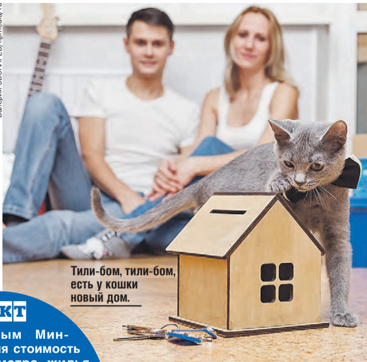
Тили-бом, тили-бом, есть у кошки новый дом.