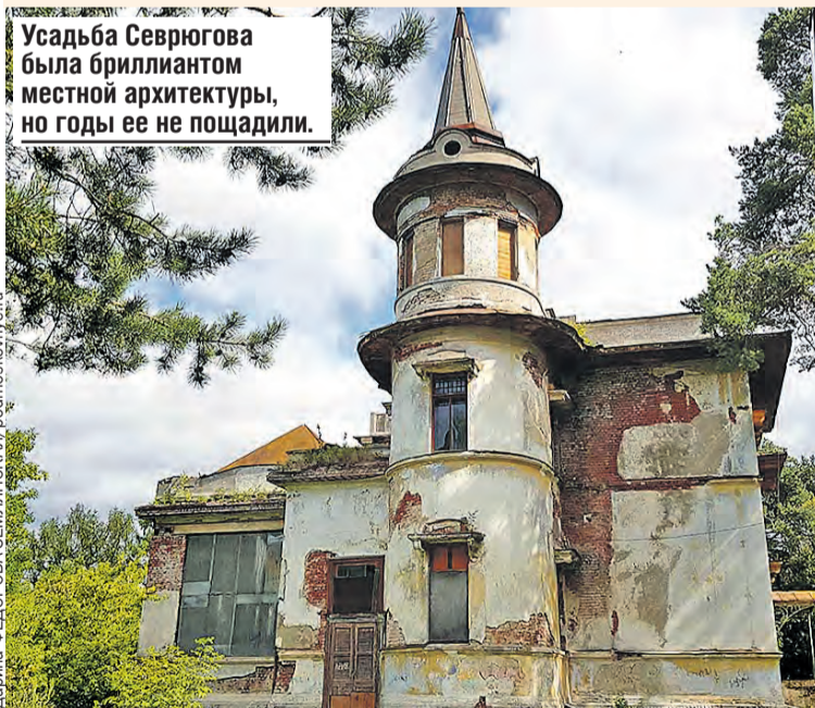
Усадьба Севрюгова была бриллиантом местной архитектуры, но годы ее не пощадили.

Ларика ФЕДОРОВА-ЗЕМЛЯНСКАЯ/rodmoskoye.ru