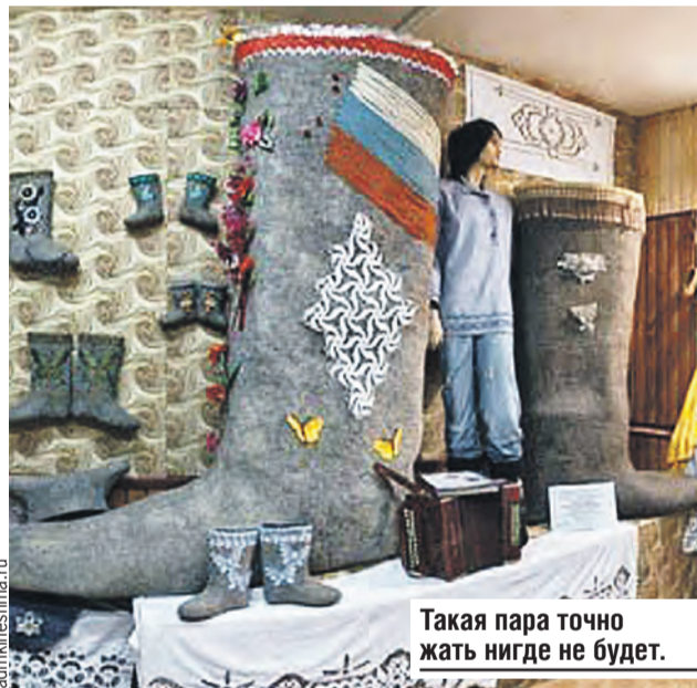
Такая пара точно жать нигде не будет.