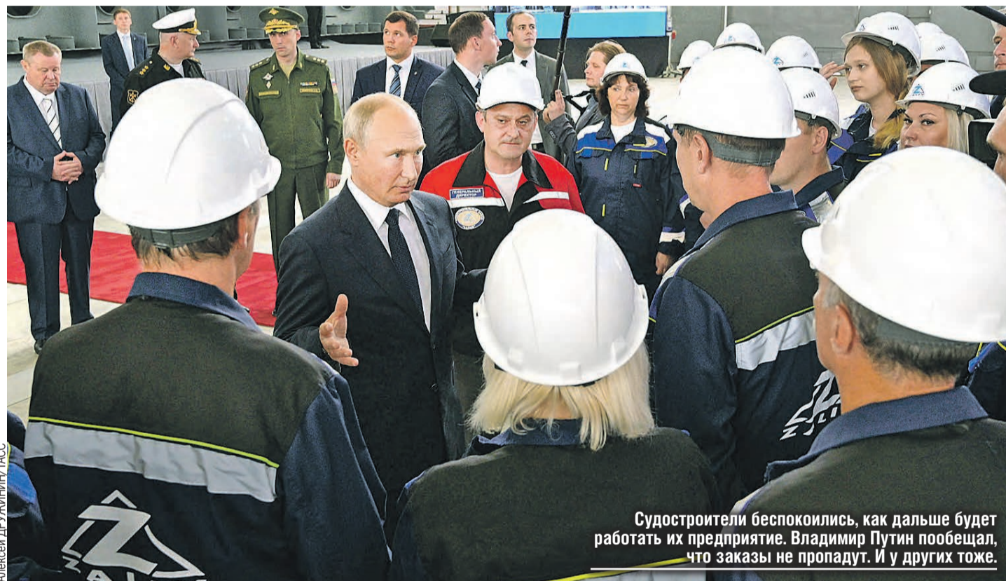
Судостроители беспокоились, как дальше будет работать их предприятие. Владимир Путин пообещал, что заказы не пропадут. И у других тоже.

■ В апреле из-за пандемии ВВП сократился на 12 процентов, в мае – на 10,9. Как Россия будет выходить из кризиса? Какие меры станут первоочередными?