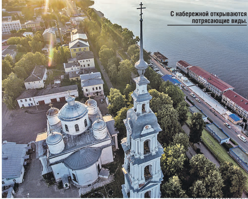
С набережной открываются потрясающие виды.