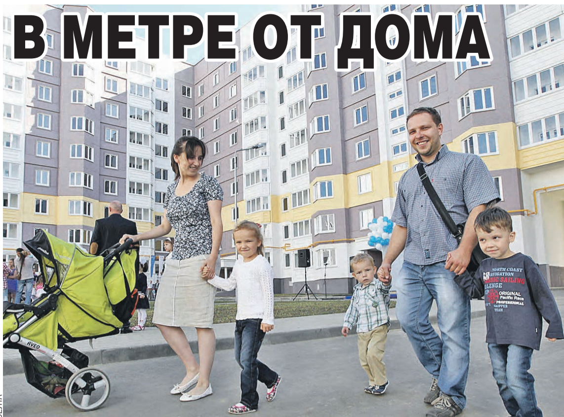
Жилплощадь позволяет! Решиться на третьего ребенка в Беларуси теперь гораздо проще, чем раньше.

Белорусскую АЭС – самый крупный энергетический проект Союзного государства.