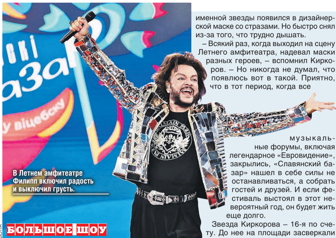
В Летнем амфитеатре Филипп включил радость и выключил грусть.

В ответственный момент погода не подвела, хотя в полночь на столбике термометра было не более восьми градусов. Но зрители никак не хотели расставаться с артистами даже после финальных аккордов и не раз вызывали их на бис.